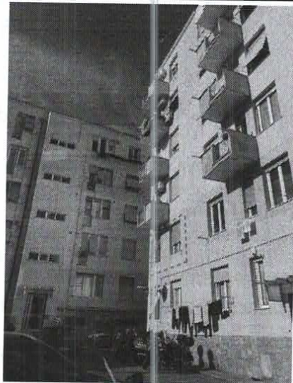
Figura 4 LOCALIZZAZIONE EDIFICIO: PROSPETTO SUD OVEST SU DISTACCO CONDOMINIALE

Il vano scala, cui si accede da un piccolo portone ed androne, si sviluppa con