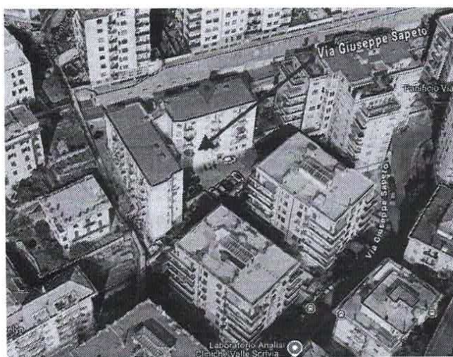
Figura 3 LOCALIZZAZIONE EDIFICIO: VOLUMETRICO

L'intera zona è caratterizzata da scarsi spazi di parcheggio autoveicolare, assolto solo parzialmente da autorimesse singole private.