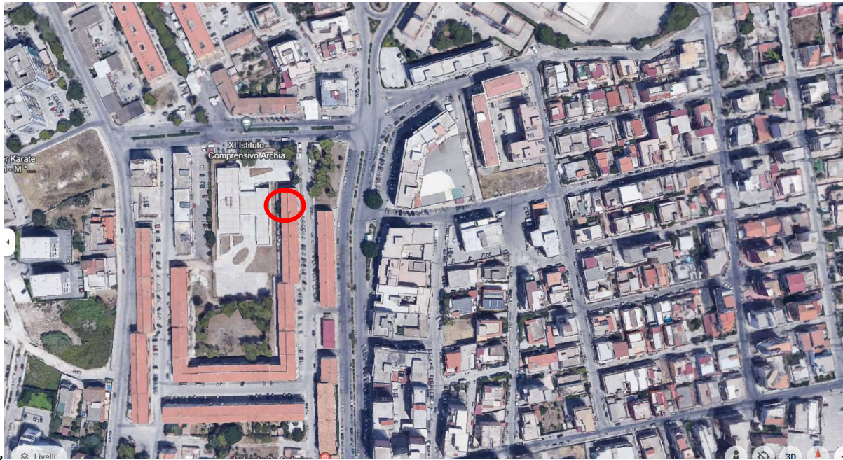
Foto 1: Aereofoto Siracusa Via Adrano, il cerchio in rosso indica l'ubicazione dell'immobile oggetto di causa.