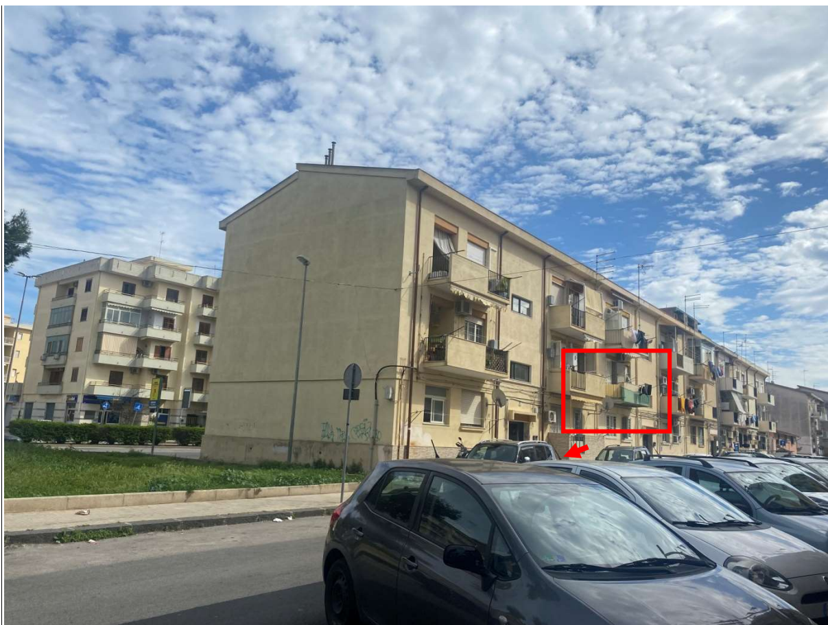
Foto 2: Prospetto edificio su via Adrano, il riquadro in rosso indica l'appartamento oggetto di stima, la freccia in rosso indica invece il portone condominiale di ingresso prospiciente sul civico n°20.