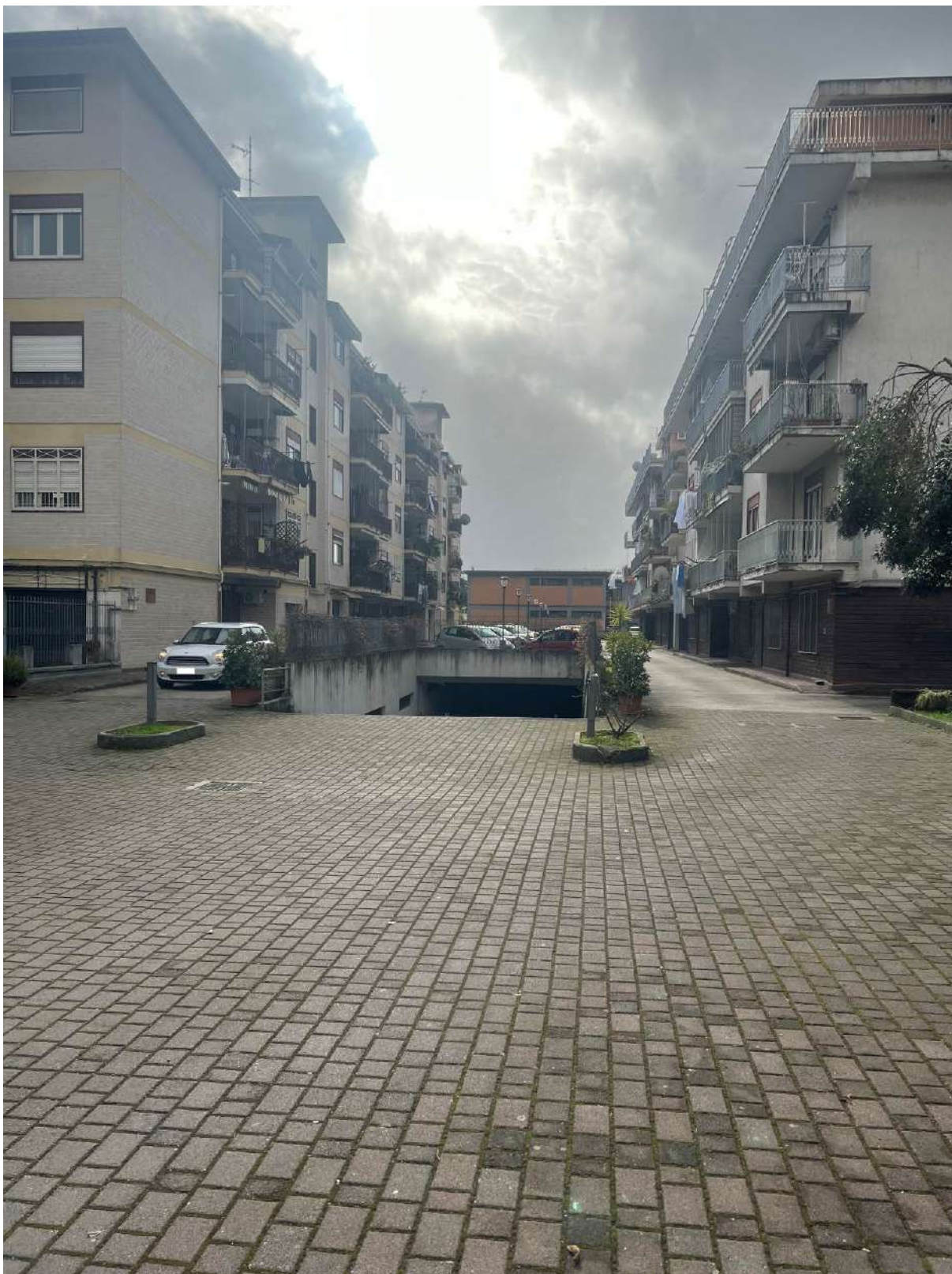
Foto viale condominiale