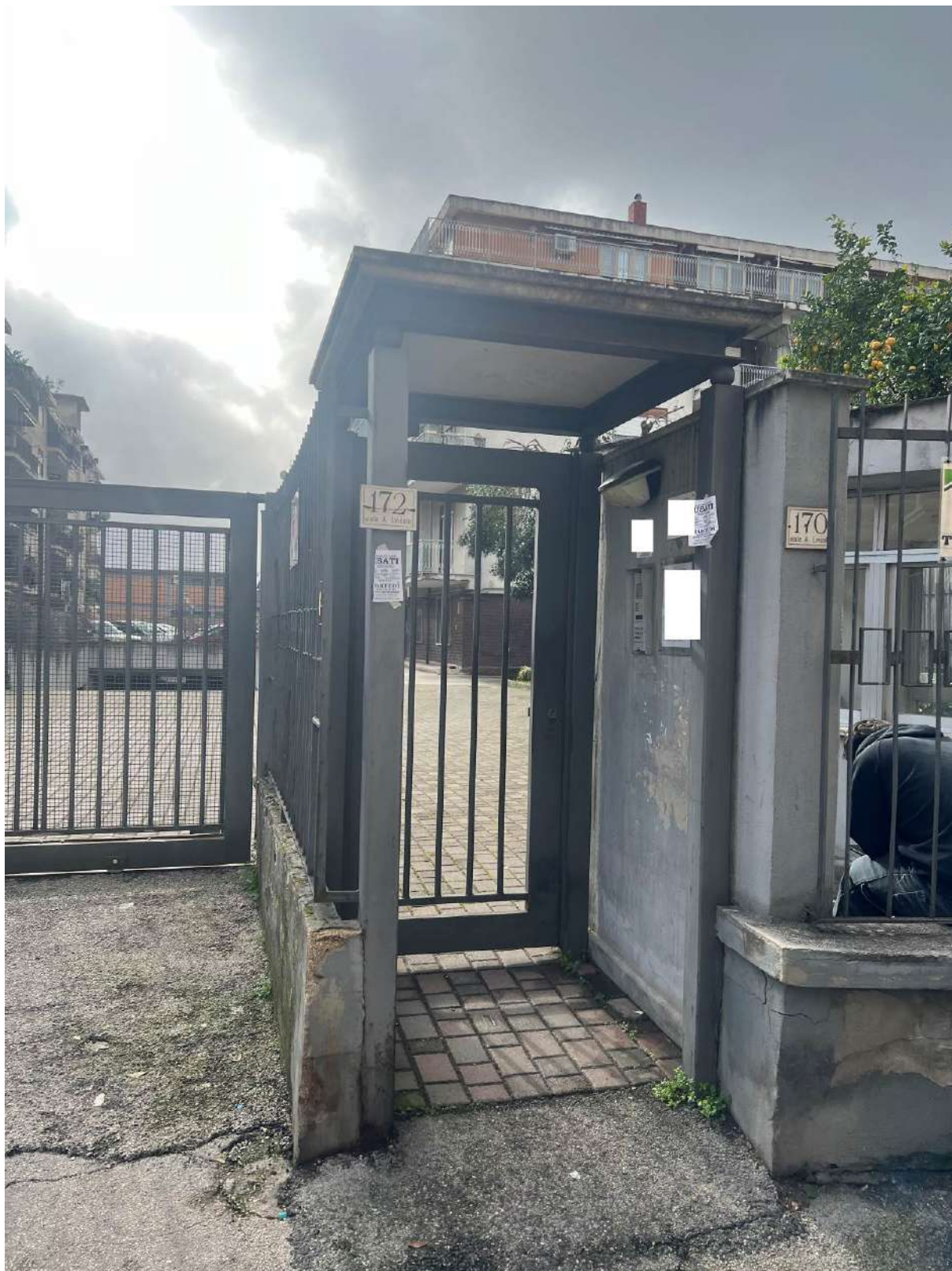
Foto ingresso esterno