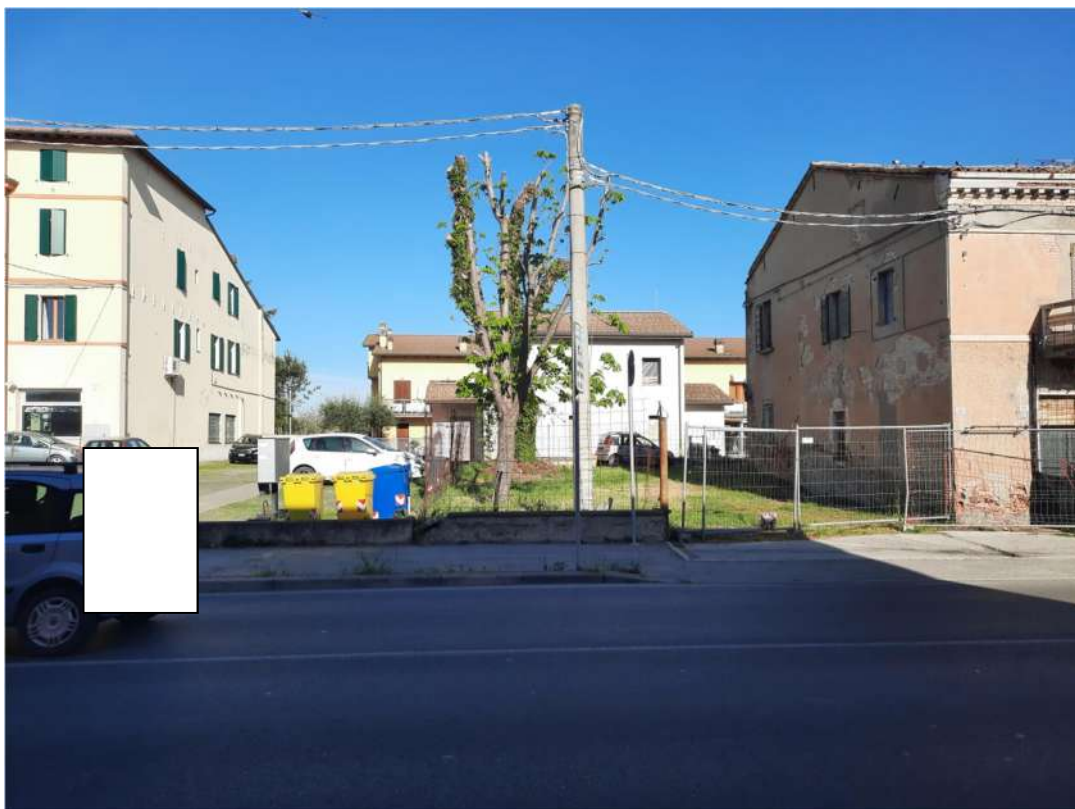
2 - VISTA GENERALE DA VIA LUGHESE