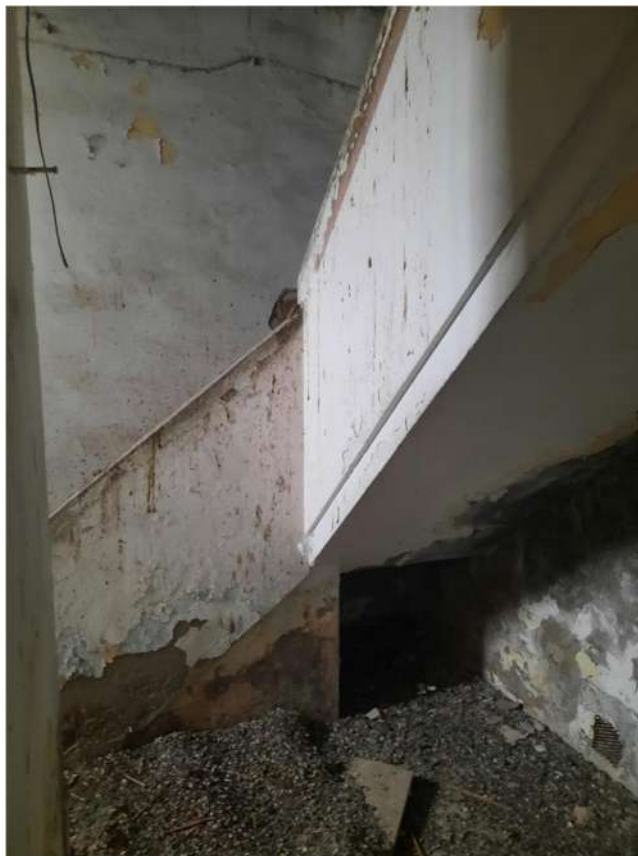
13 – VISTA PIANO TERRA – INGRESSO E SCALA