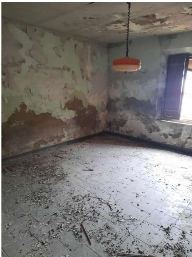
15 – VISTA PIANO TERRA - INTERNO