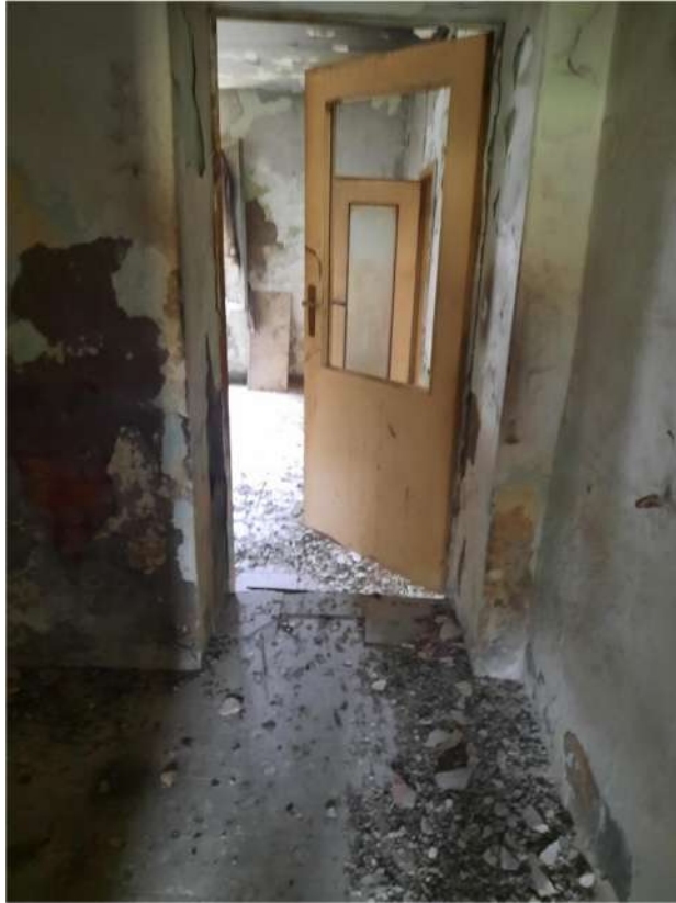
12 – VISTA PIANO TERRA - INTERNI