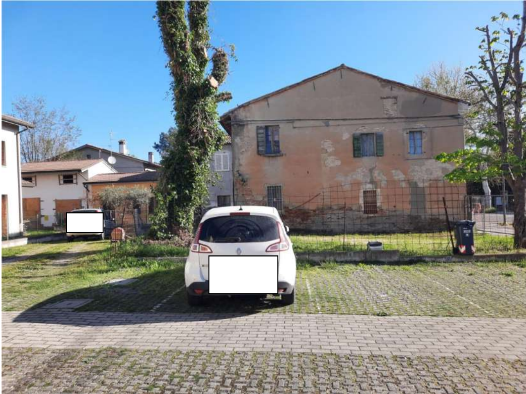
4 – PROSPETTO LATERALE