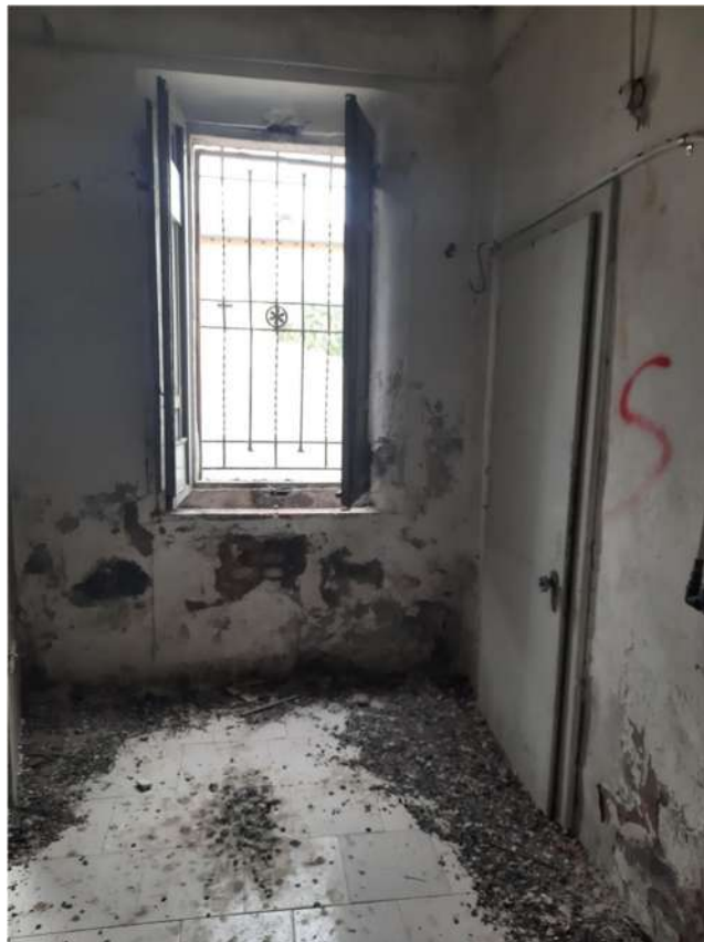
11 – VISTA PIANO TERRA - INTERNI