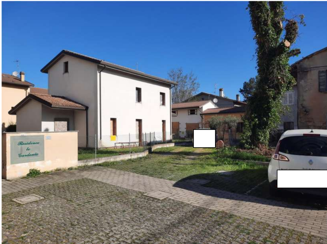
5 – VISTA CORTE COMUNE