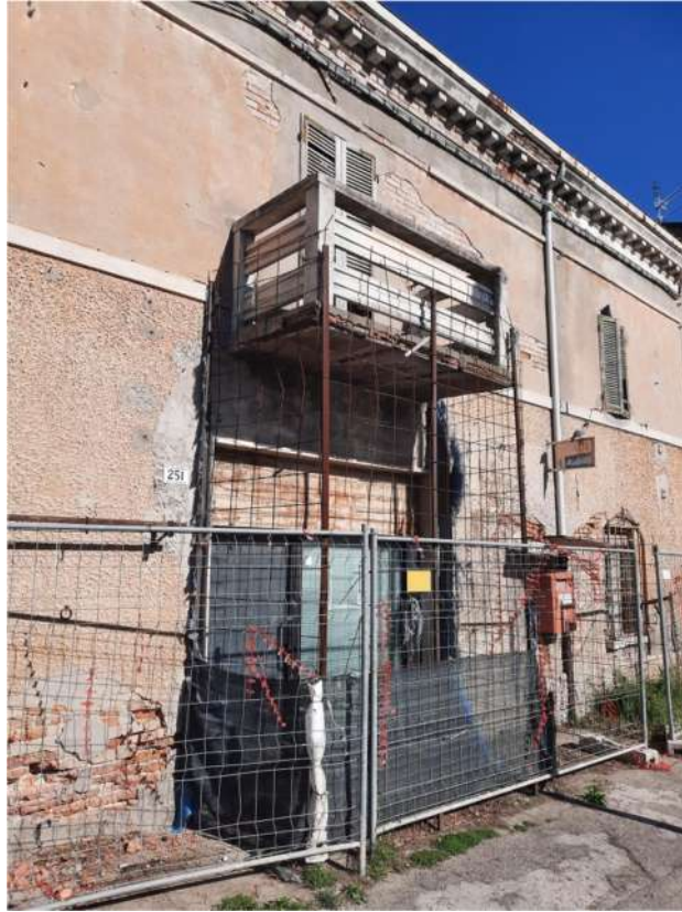
10 – VISTA DETTAGLIO FRONTE PRINCIPALE