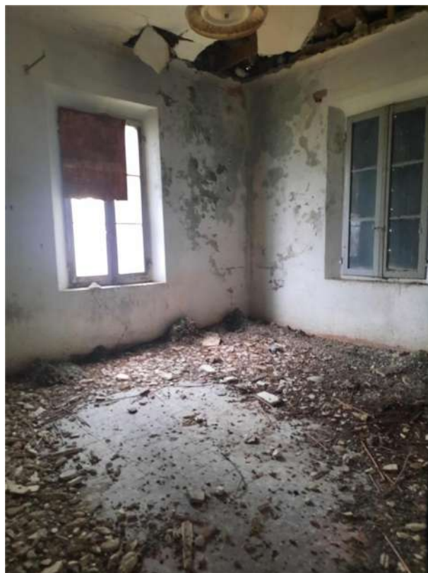
17 – VISTA PIANO PRIMO - INTERNO