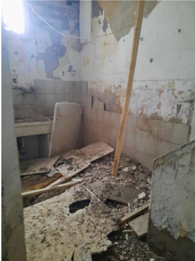
14 – VISTA PIANO TERRA - CUCINA