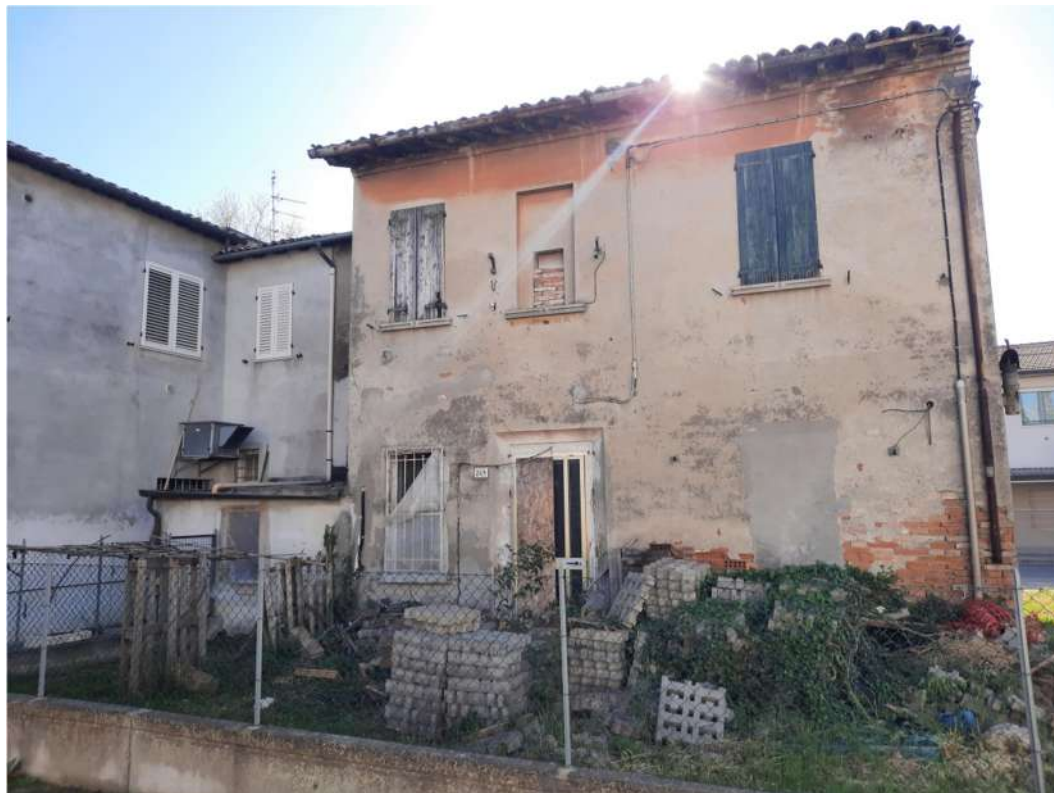
7- VISTA RETRO-PROSPETTO