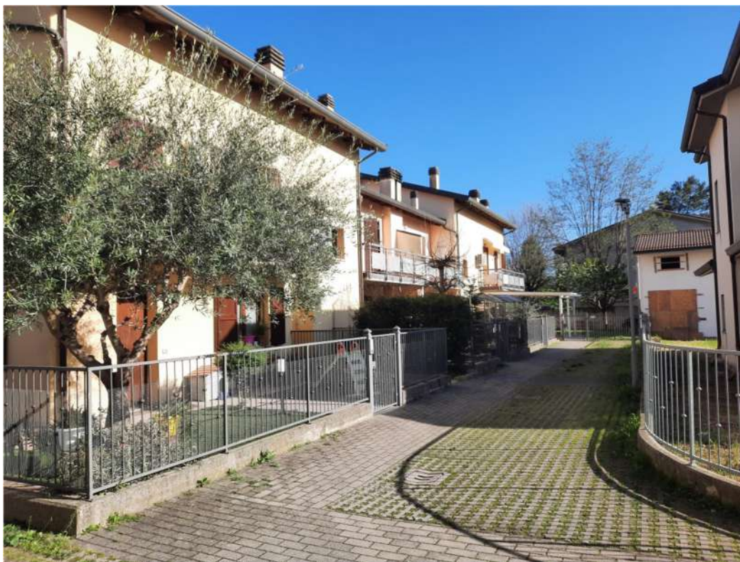
6- VISTA CORTE ED ACCESSO COMUNE