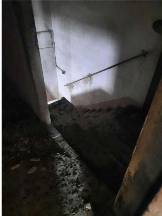
16 – VISTA PIANO PRIMO - SCALA