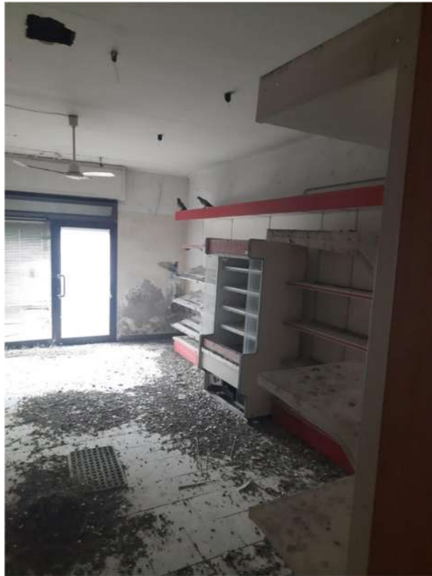
18 – VISTA PIANO TERRA - NEGOZIO