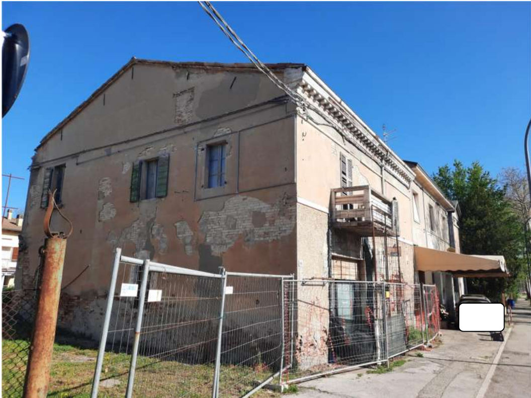
9- VISTA PROSPETTI LATERALE E PRINCIPALE