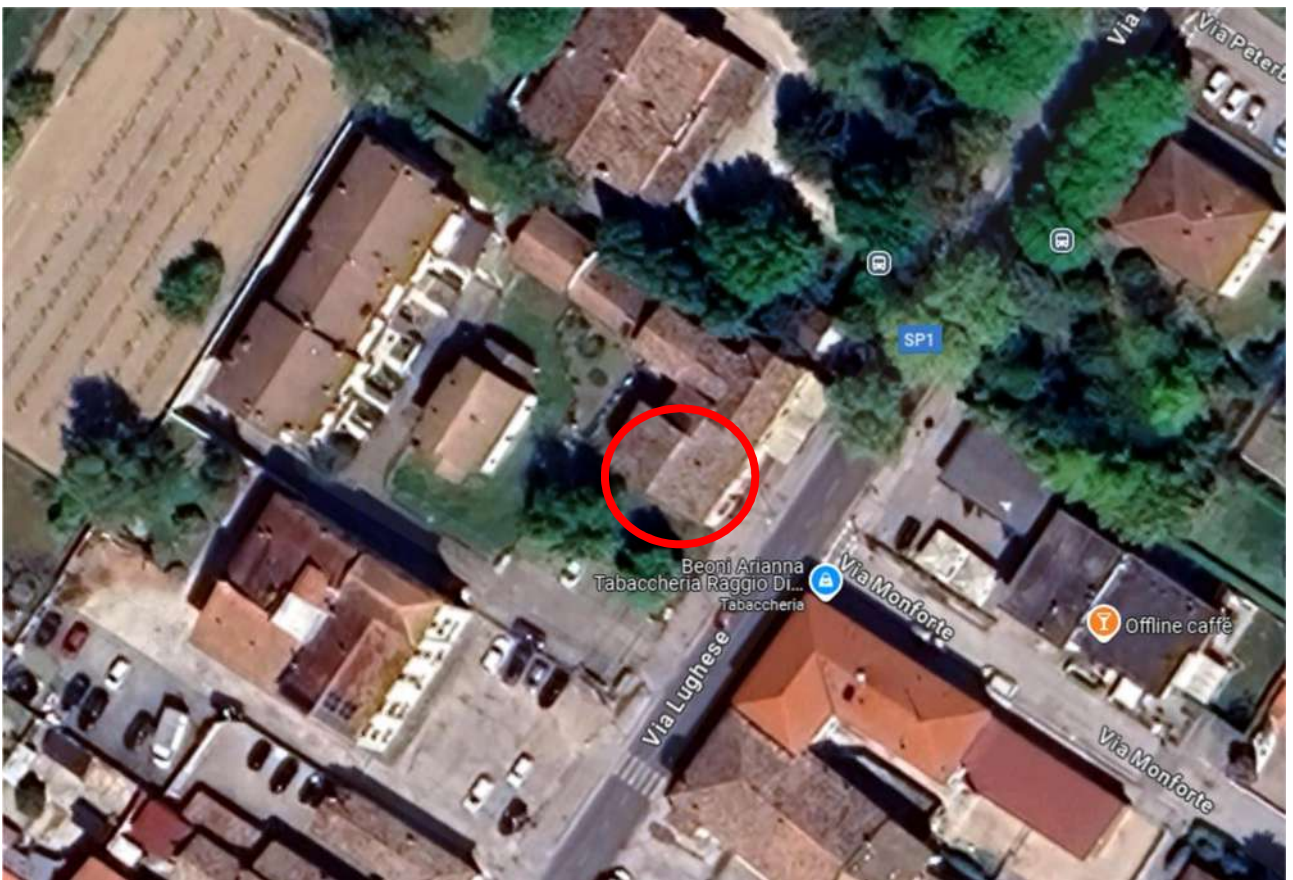
1 - FOTO ZENITALE