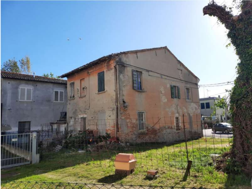
8- VISTA PROSPETTI LATERALE E RETRO