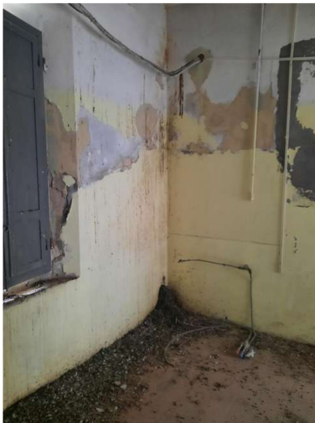
19 – VISTA PIANO TERRA - NEGOZIO