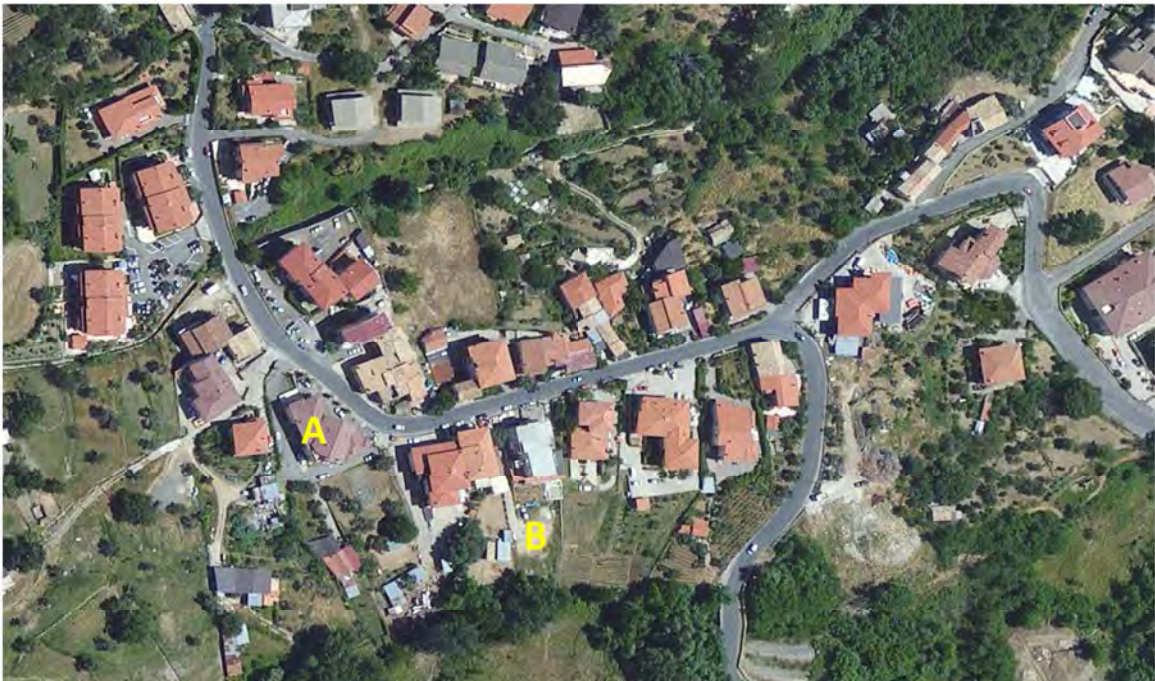
Comune di Marano Principato CS – Via Persanolento (A: p.lla 737 – B: p.lla 409)