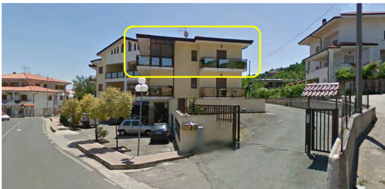
Immibile 1 – Comune di Marano Principato CS – Via Persanolento 40/B