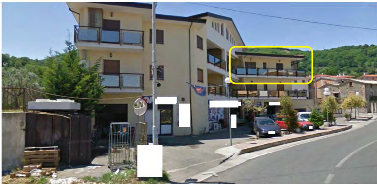
Immibile 1 – Comune di Marano Principato CS – Via Persanolento 40/B