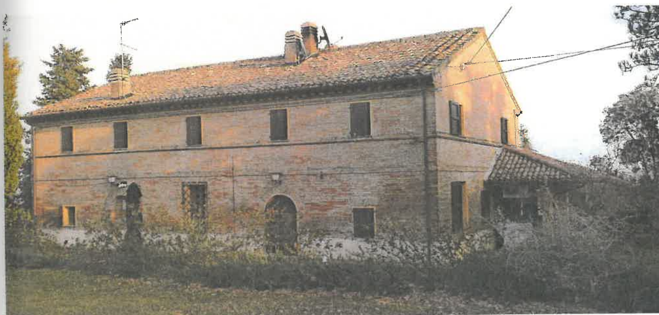
Foto 4 – Vista del retro e del fianco Sx dell'immobile principale da altro punto dello scoperto.