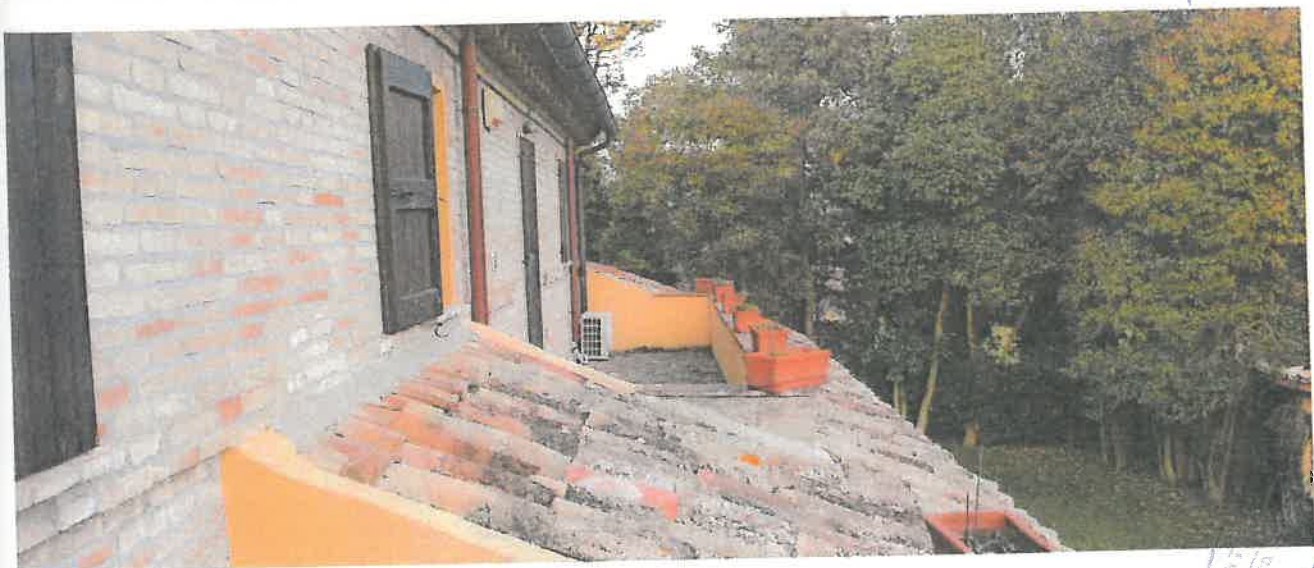
Foto 8 – Vista dei terrazzi al piano primo ricavati sulla copertura del portico nel fronte.