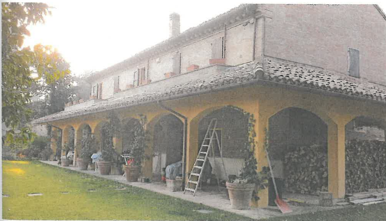
Foto 2 – Vista del fronte dell'immobile e di parte del fianco Dx, dalla parte opposta del cancello di cui sopra.