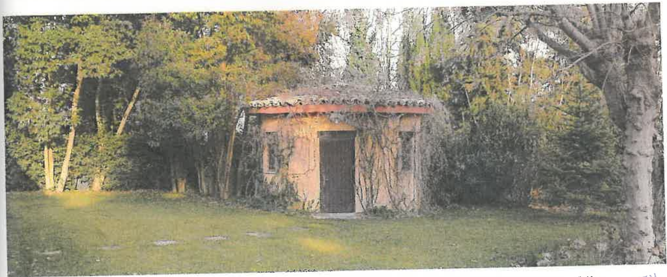
Foto 7 – Vista dell'accessorio minore posizionato sul fronte dalla parte opposta dell'ingresso carrabile.