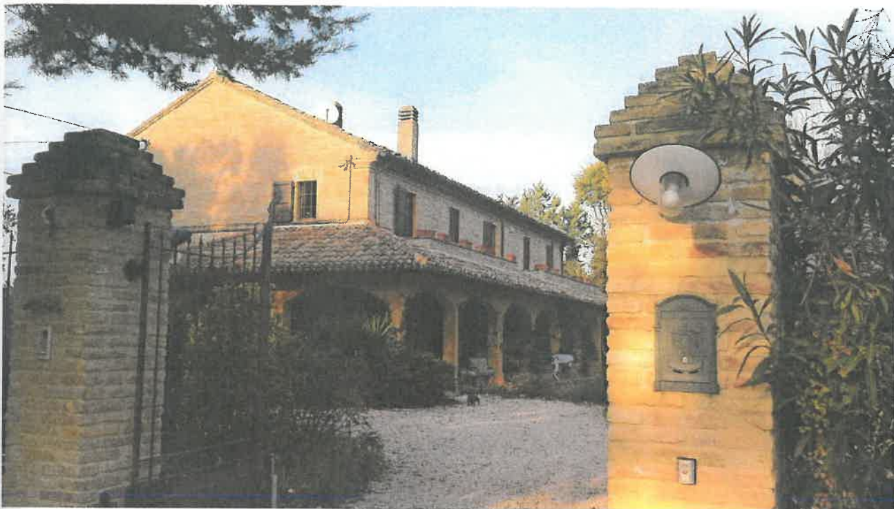
Foto 1 – Vista della villa colonica con in primo piano le colonne dell'ingresso.