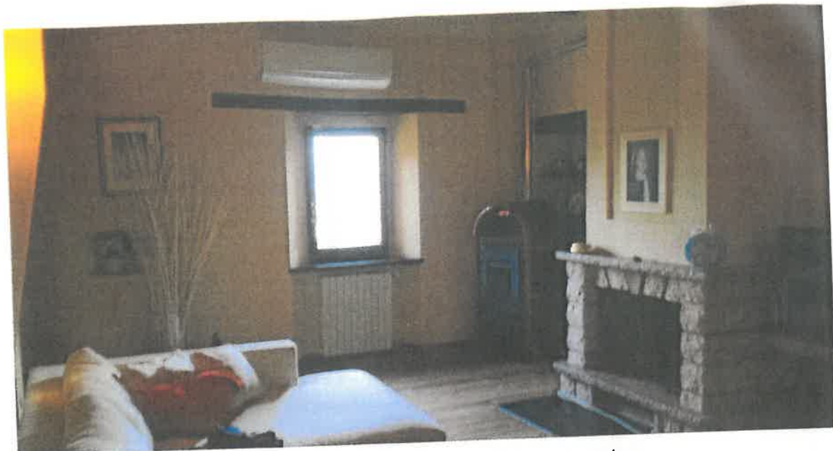
Foto 12 – Vista parziale del soggiorno al piano primo, anch'esso con camino.