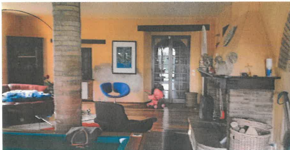
Foto 10 – Vista parziale del soggiorno al piano terra con camino, tavolo da biliardo e salotto.