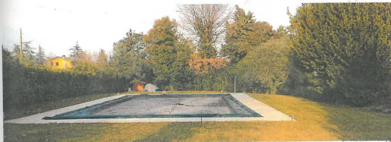
Foto 5 – Vista della piscina sul retro dello scoperto di proprietà esclusiva.