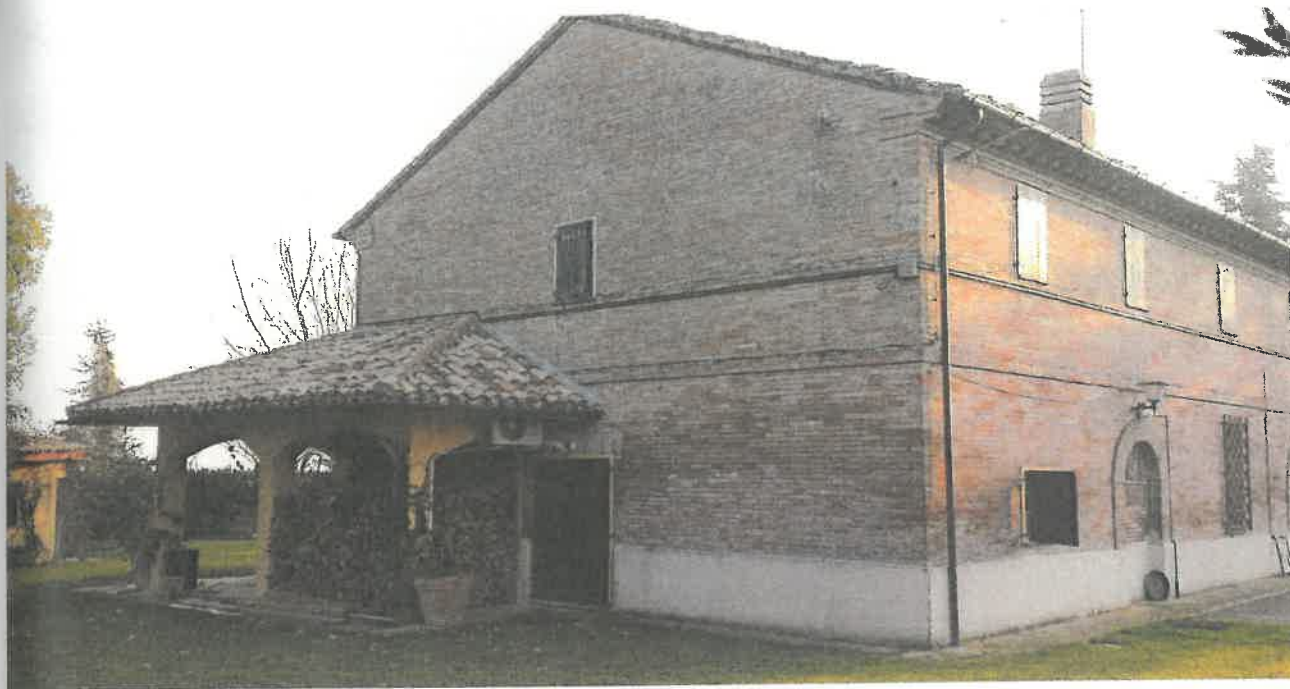
Foto 3 – Vista fianco Dx e parte del retro dallo scoperto di proprietà esclusiva.