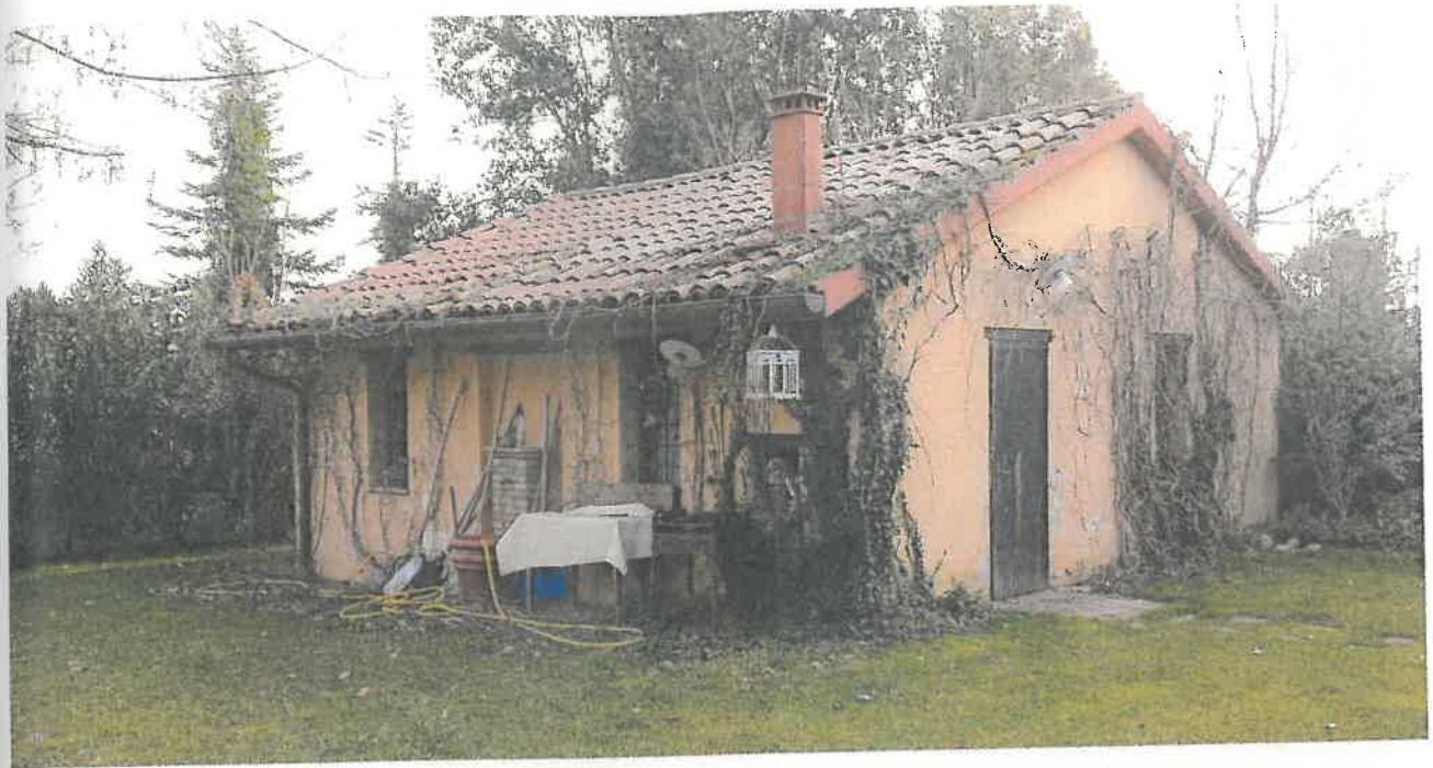
Foto 6 – Vista dell'accessorio maggiore posizionato sul fronte in adiacenza al cancello dell'ingresso.