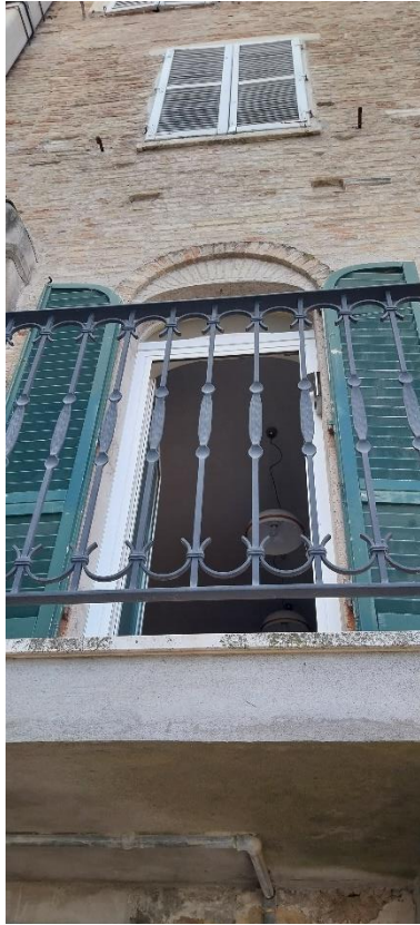
Foto 54. Piano secondo (palazzo Luciani Bambini). Prima porta finestra (facciata est).