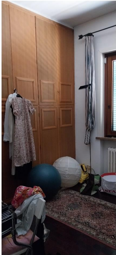
Foto 34. Piano secondo, zona notte. Seconda camera da letto.