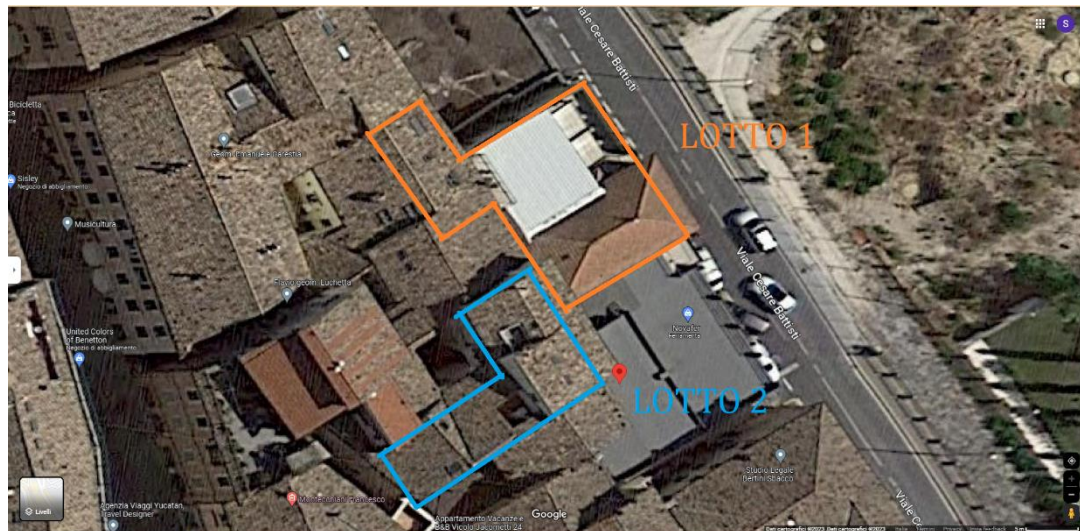
Foto 01. Vista aerea da Google Maps, con indicazione delle planimetrie del Lotto 1 e del Lotto 2.