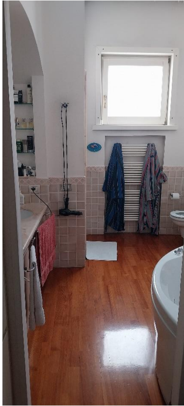
Foto 33. Piano secondo, zona notte. Primo bagno.