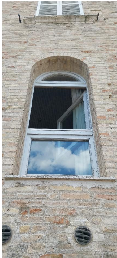
Foto 55. Piano secondo (palazzo Luciani Bambini). Seconda finestra (facciata est).