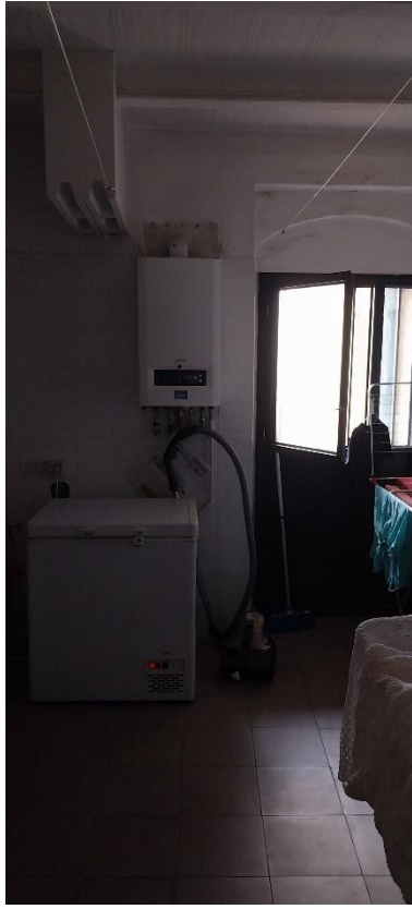
Foto 51. Piano primo (palazzo Luciani Bambini). Locale lavanderia. Caldaia.