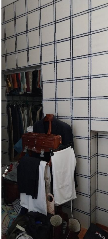
Foto 31. Piano secondo, zona notte. Locale guardaroba.