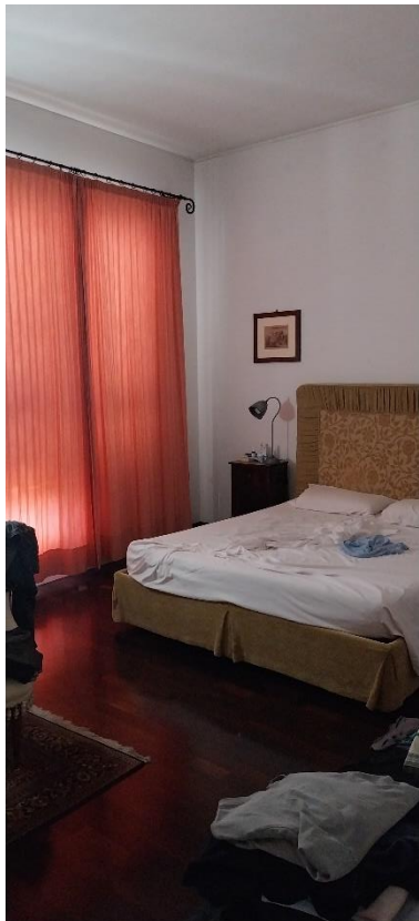
Foto 32. Piano secondo, zona notte. Prima camera da letto.