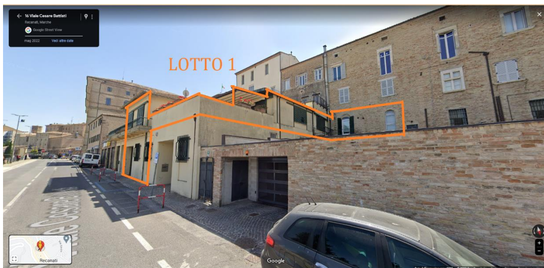
Foto 02. Vista stradale da Google Maps, con indicazione del prospetto del Lotto 1.