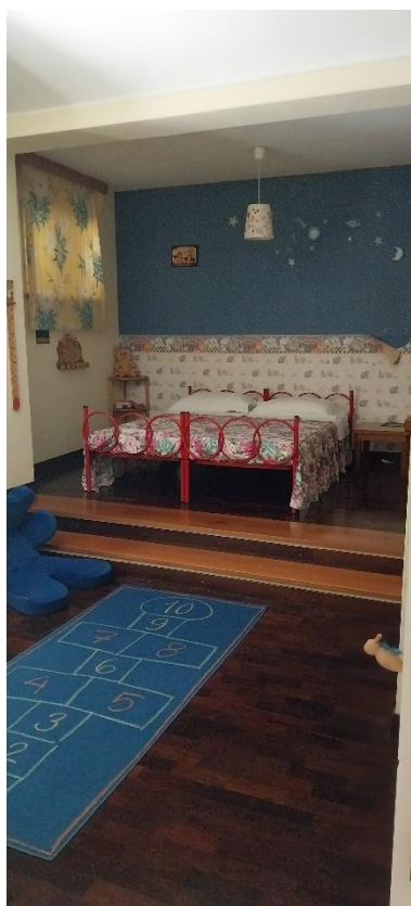
Foto 36. Piano secondo, zona notte. Terza camera da letto.