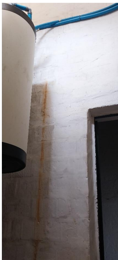
Foto 13. Locale tecnico accessibile dal garage. Boiler.