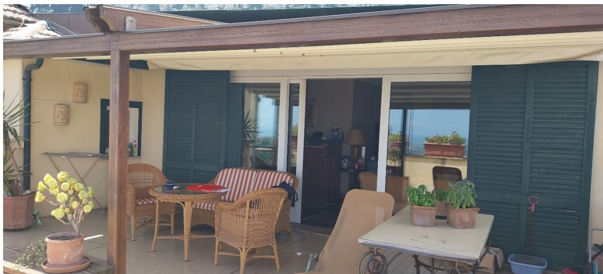
Foto 41. Piano secondo, zona giorno. Terrazzo est.