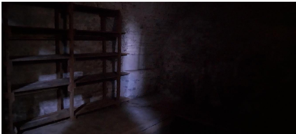
Foto 61. Locale secondario. Una volta a crociera. Circa 44,90 metri quadri.