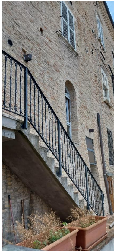
Foto 57. Piano secondo (palazzo Luciani Bambini). Scala esterna (cemento armato) rispetto alla seconda finestra (facciata est).