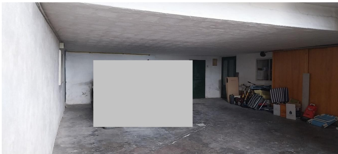
Foto 11. Locale principale del box doppio, Lotto 1, Corpo B.