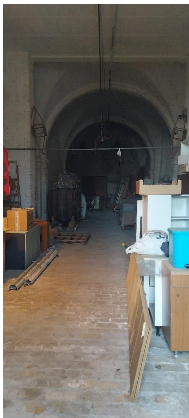
Foto 61. Locale principale. Quattro volte a crociera. Circa 128,80 metri quadri.