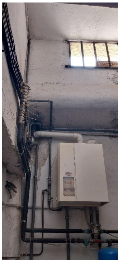
Foto 12. Locale tecnico accessibile dal garage. Caldaia.