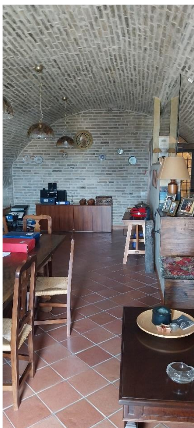
Foto 53. Piano secondo (palazzo Luciani Bambini). Locale ampliato con il solaio/soppalco (a destra).