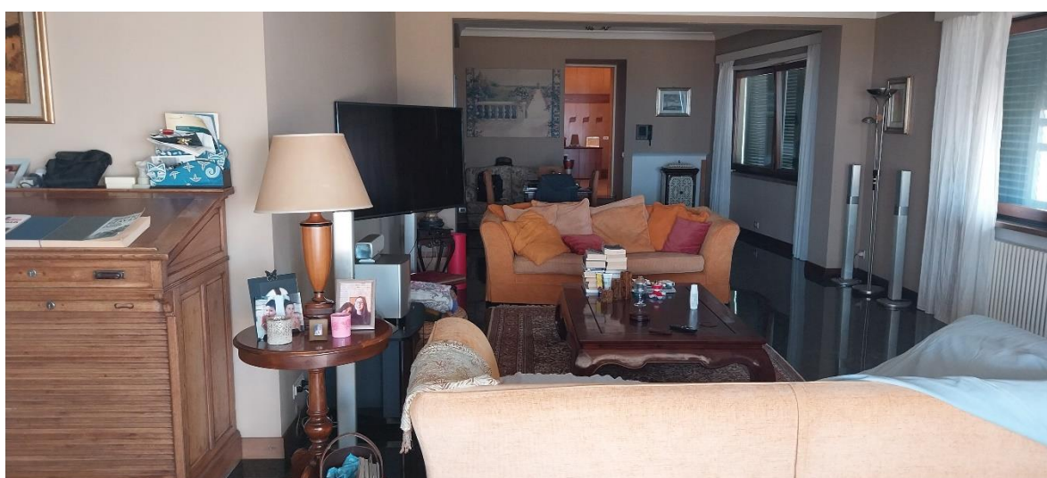
Foto 41. Piano secondo, zona giorno. Salone.