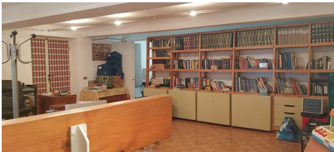
Foto 21. Piano primo. Locale principale.