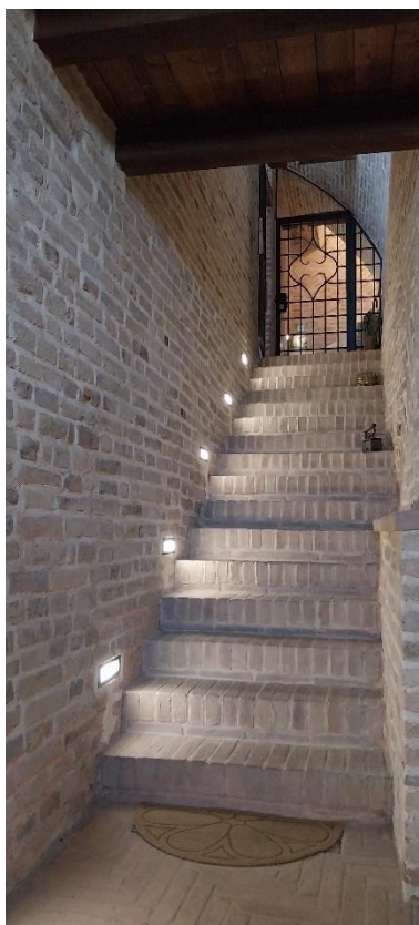
Foto 52. Piano primo (palazzo Luciani Bambini). Scala di terzi su cui è stato realizzato il solaio/soppalco.