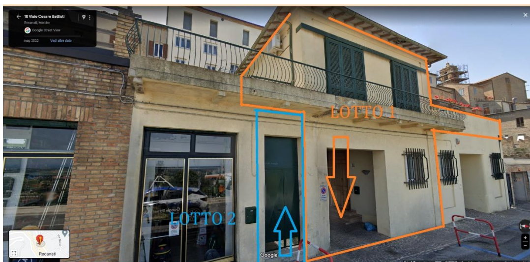
Foto 03. Vista stradale da Google Maps, con indicazione dell'accesso al Lotto 1 (pedonale e carrabile) e al Lotto 2 (pedonale).