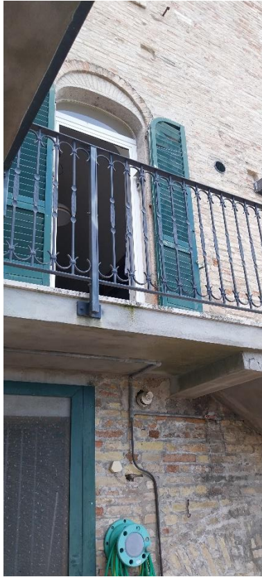
Foto 56. Piano secondo (palazzo Luciani Bambini). Ballatoio esterno (cemento armato) rispetto alla prima porta finestra (facciata est).