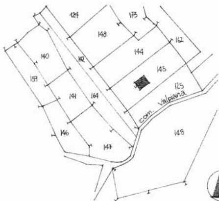
Comune di Segusino Sezione Unica Foglio 7° Mappale 145 Estratto Scala 1:2000