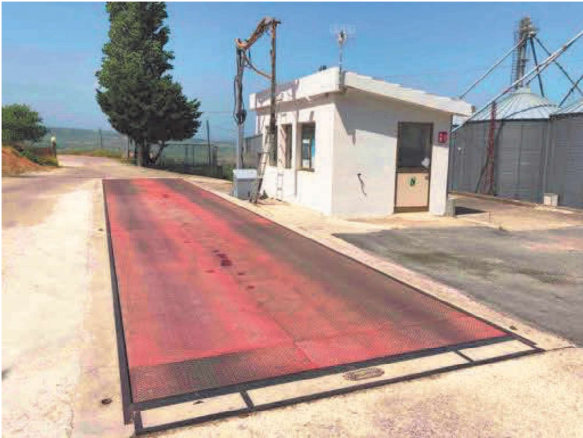
FABBRICATO STOCCAGGIO CEREALI