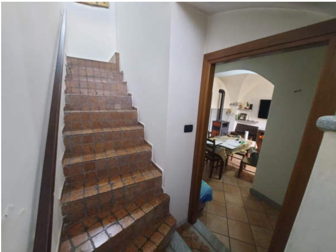
Fotografia 4: ingresso