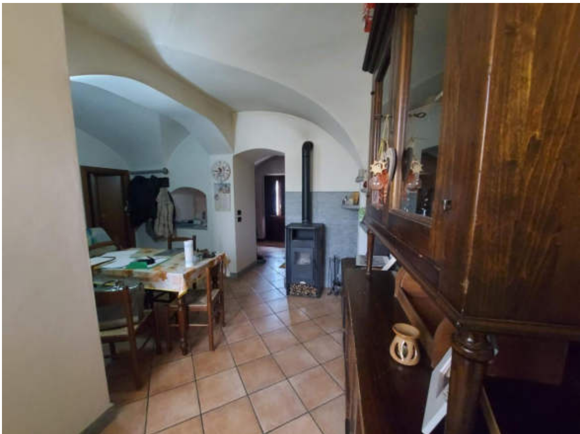
Fotografia 6: il soggiorno