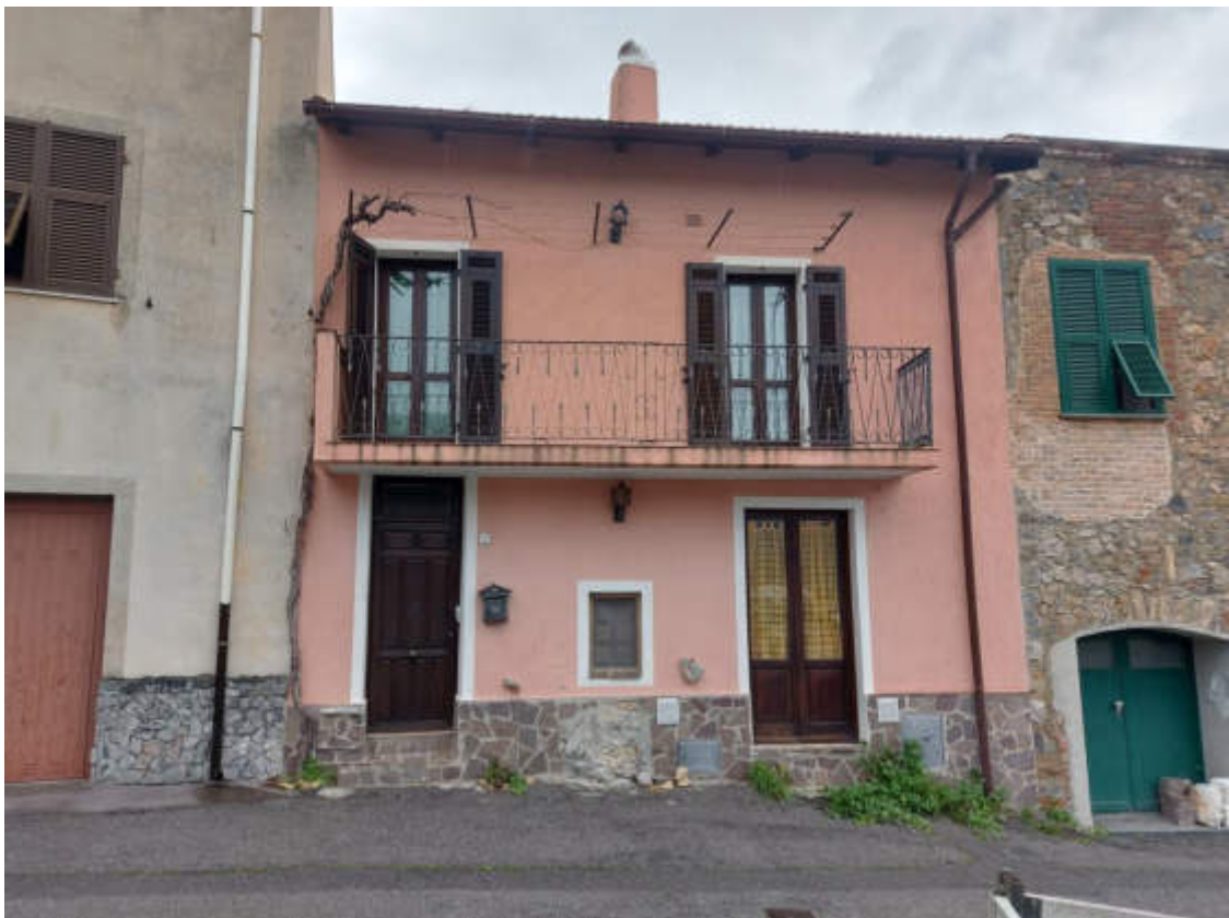
Fotografia 2: prospetto ovest su via Costa