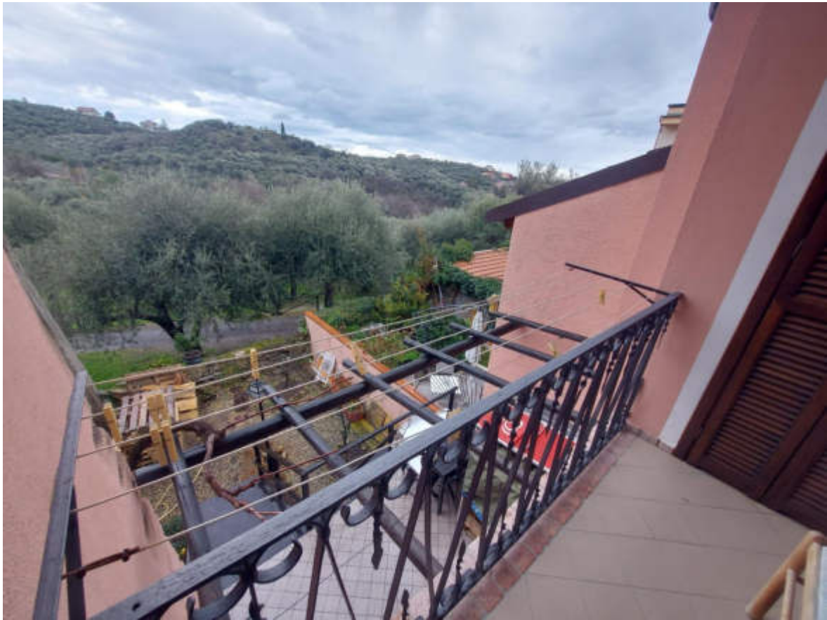
Fotografia 11: il balcone a est sul giardino