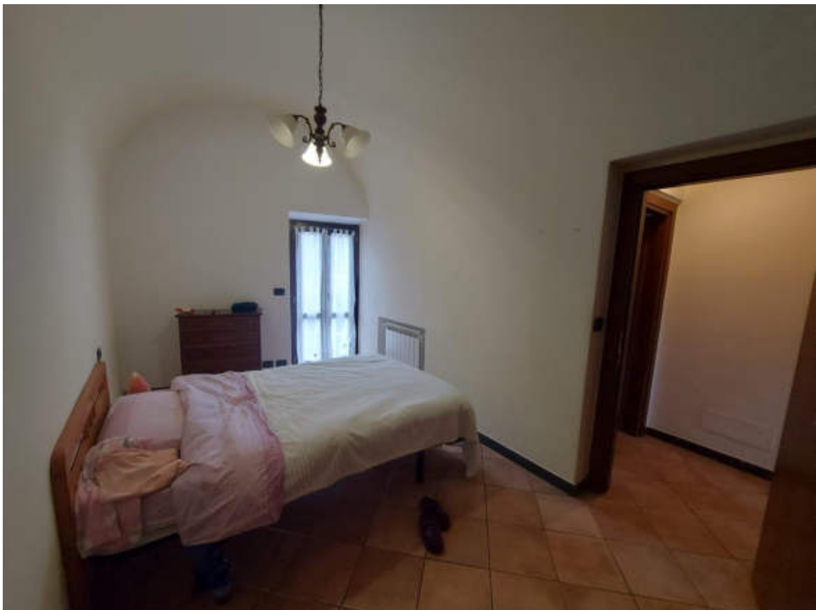
Fotografia 8: la camera a ovest