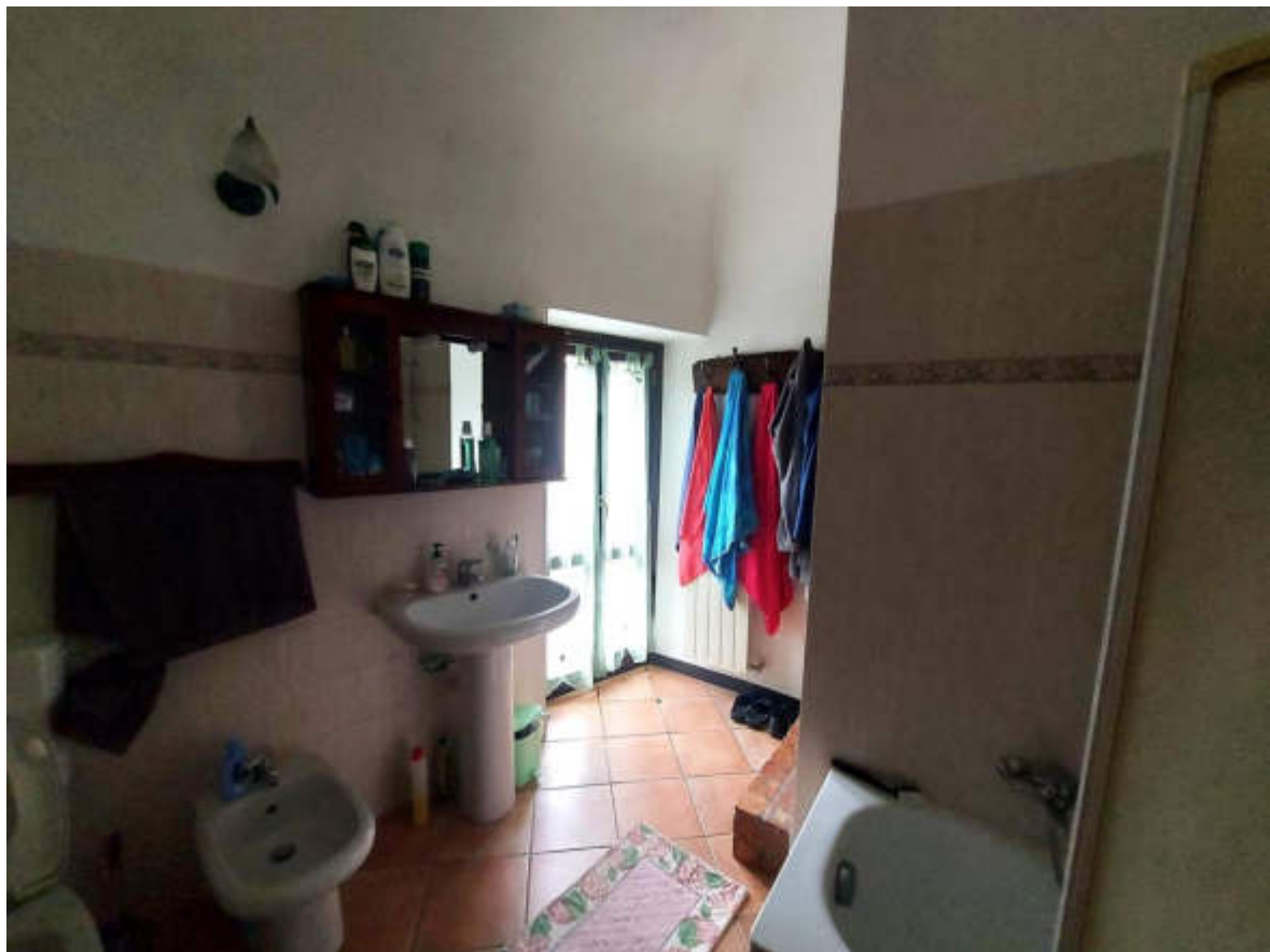
Fotografia 10: il bagno