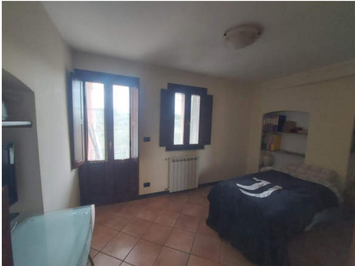
Fotografia 9: la camera ad est