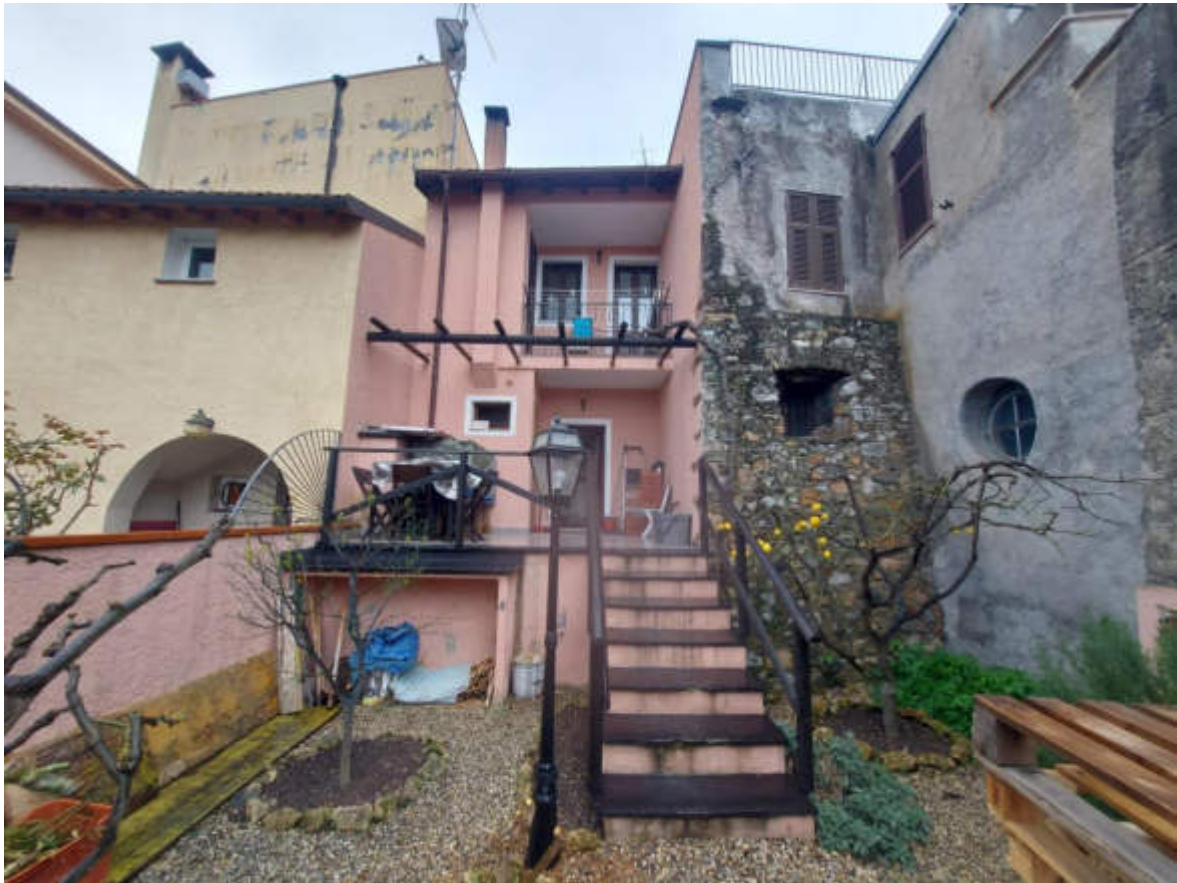
Fotografia 3: prospetto est su giardino