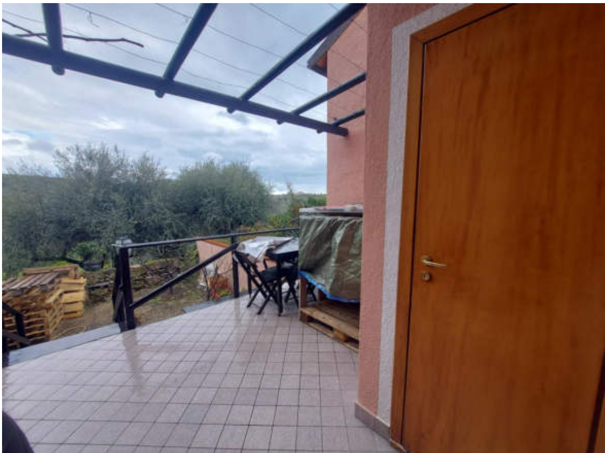
Fotografia 12: il terrazzo p. terra a est