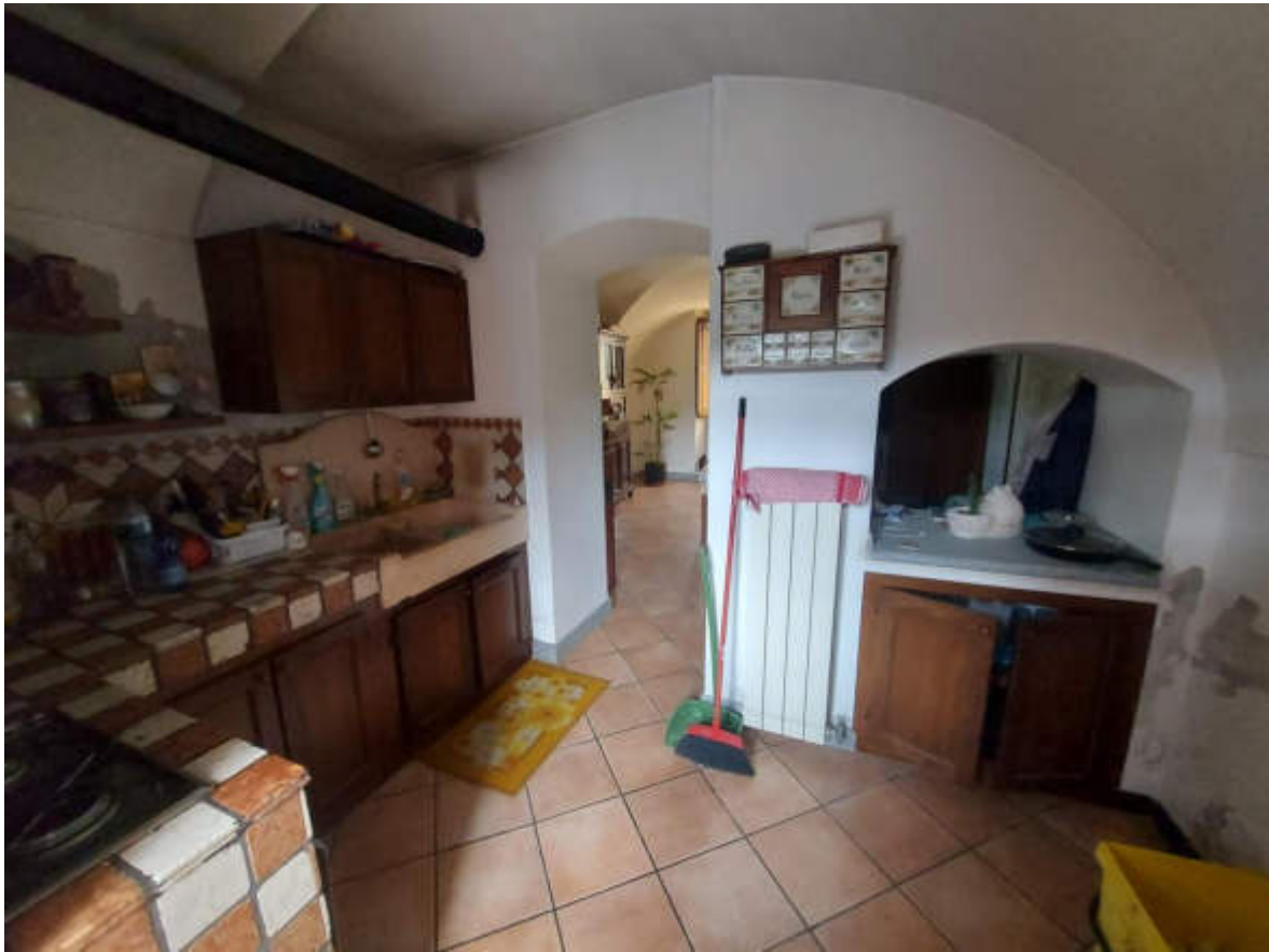
Fotografia 7: la cucina