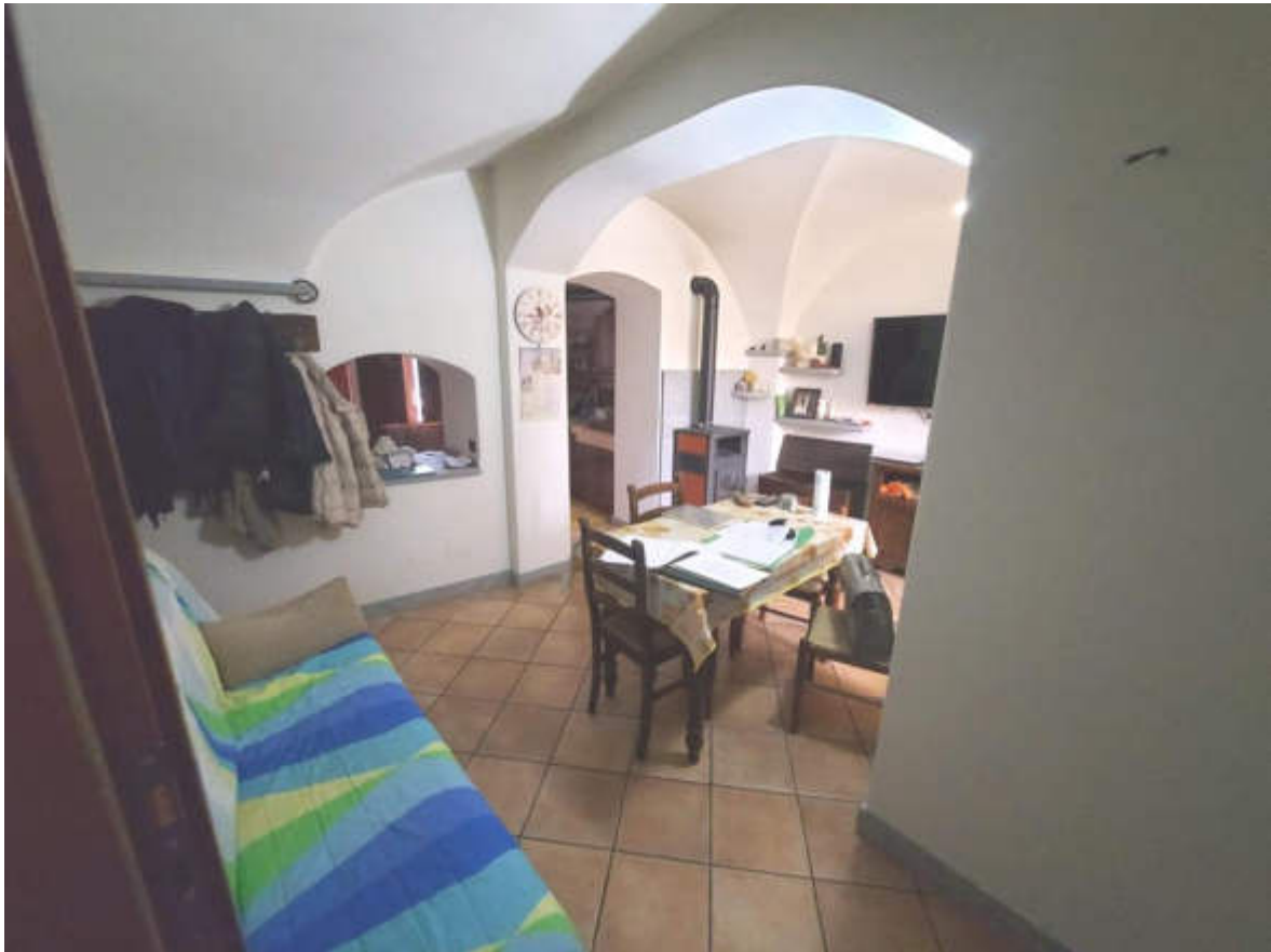
Fotografia 5: il soggiorno