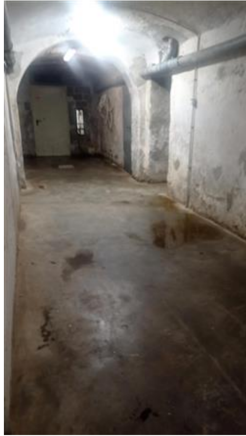
Corridoio delle cantine interrato