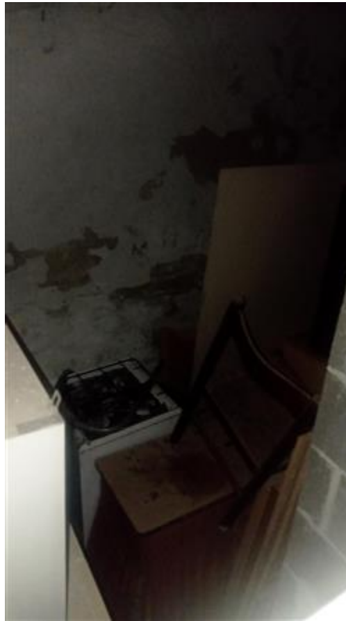
Interno della cantina