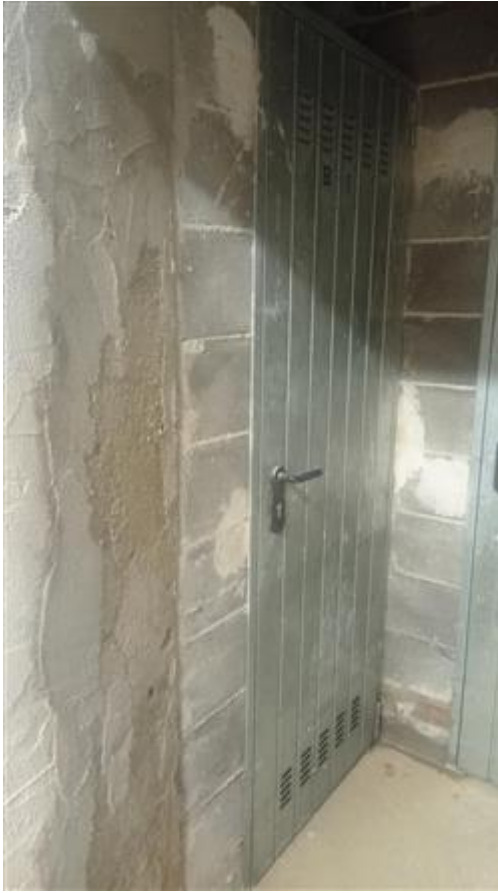
Accesso alla cantina pertinenziale