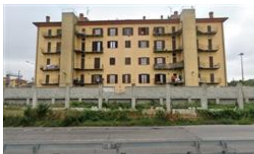
Condominio "Lago Dorato", Corso Marconi 186

I beni sono ubicati in zona periferica in un'area residenziale, le zone limitrofe si trovano in un'area industriale (i più importanti centri limitrofi sono Cairo Montenotte). Il traffico nella zona è scorrevole, i parcheggi sono sufficienti. Sono inoltre presenti i servizi di urbanizzazione primaria e secondaria.