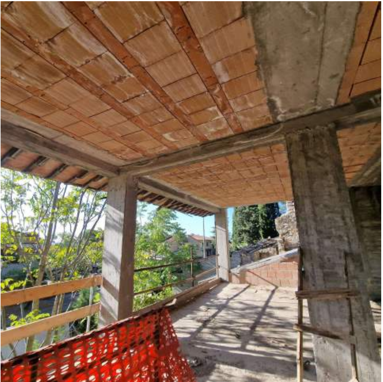
FOTO 4 PIANO PRIMO – ELEMENTI DI PARAPETTO (2° sopralluogo 25/09/2022)