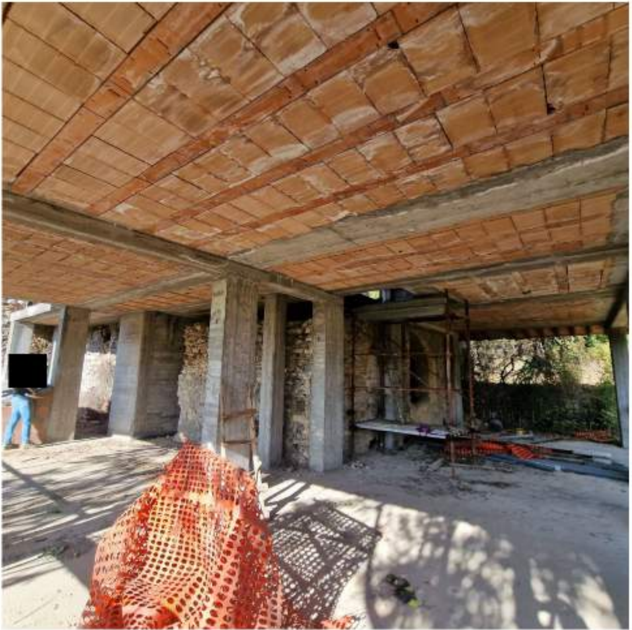
FOTO 3 PIANO PRIMO – ELEMENTI DI PONTEGGI PER ACCESSO PIANI SUPERIORI (2° sopralluogo 25/09/2022)