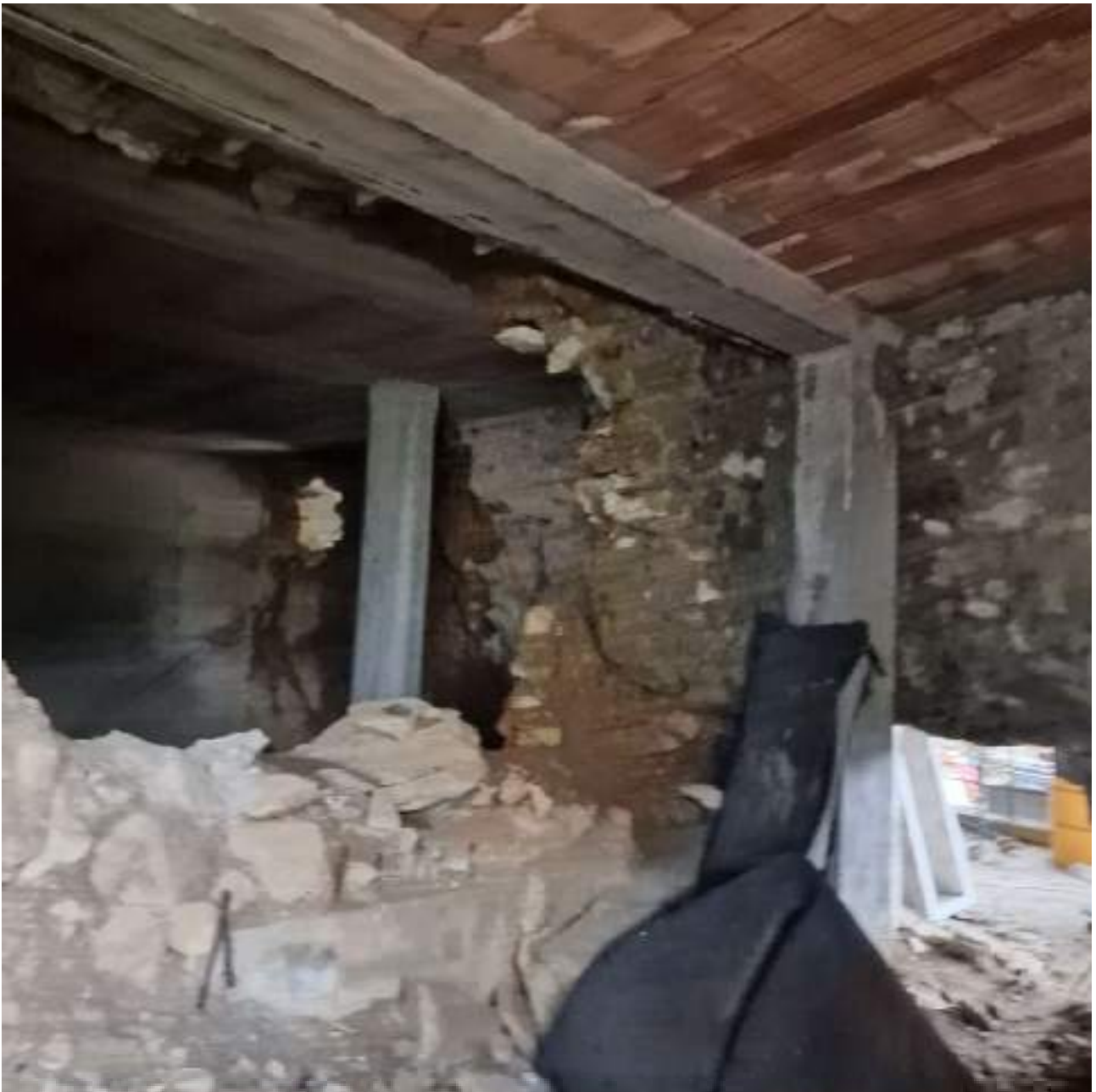
FOTO 21 STATO MURATURE ANTICA FORNACE