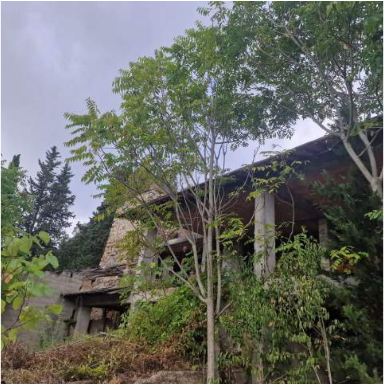
FOTO 1 PIANO TERRA – AREA PRECEDENTE POSIZIONE GRU (2° sopralluogo 25/09/2022)