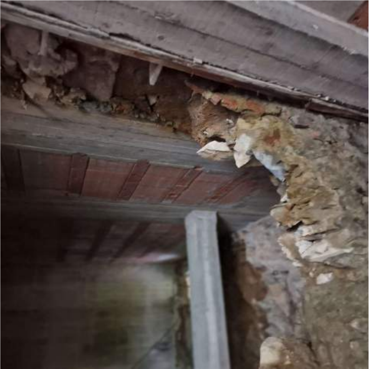
FOTO 17 STATO MURATURE ANTICA FORNACE (3° sopralluogo 02/11/2022)