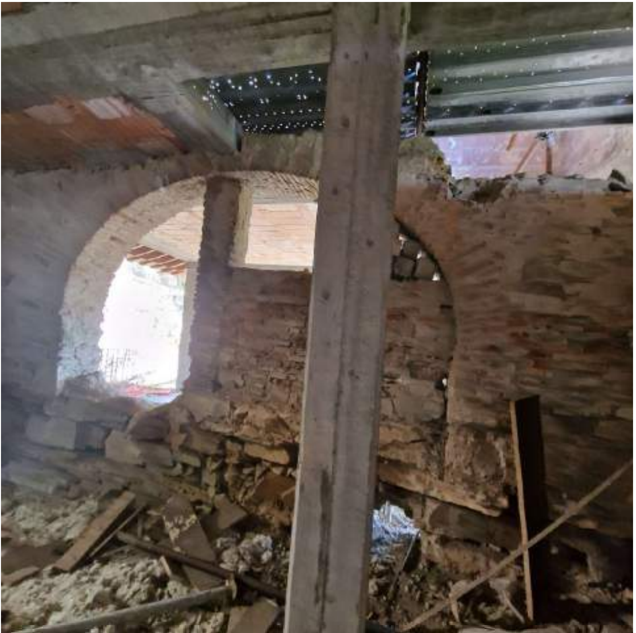
FOTO 8 PIANO PRIMO – VISTA MURATURE ANTICA FORNACE (2° sopralluogo 25/09/2022)