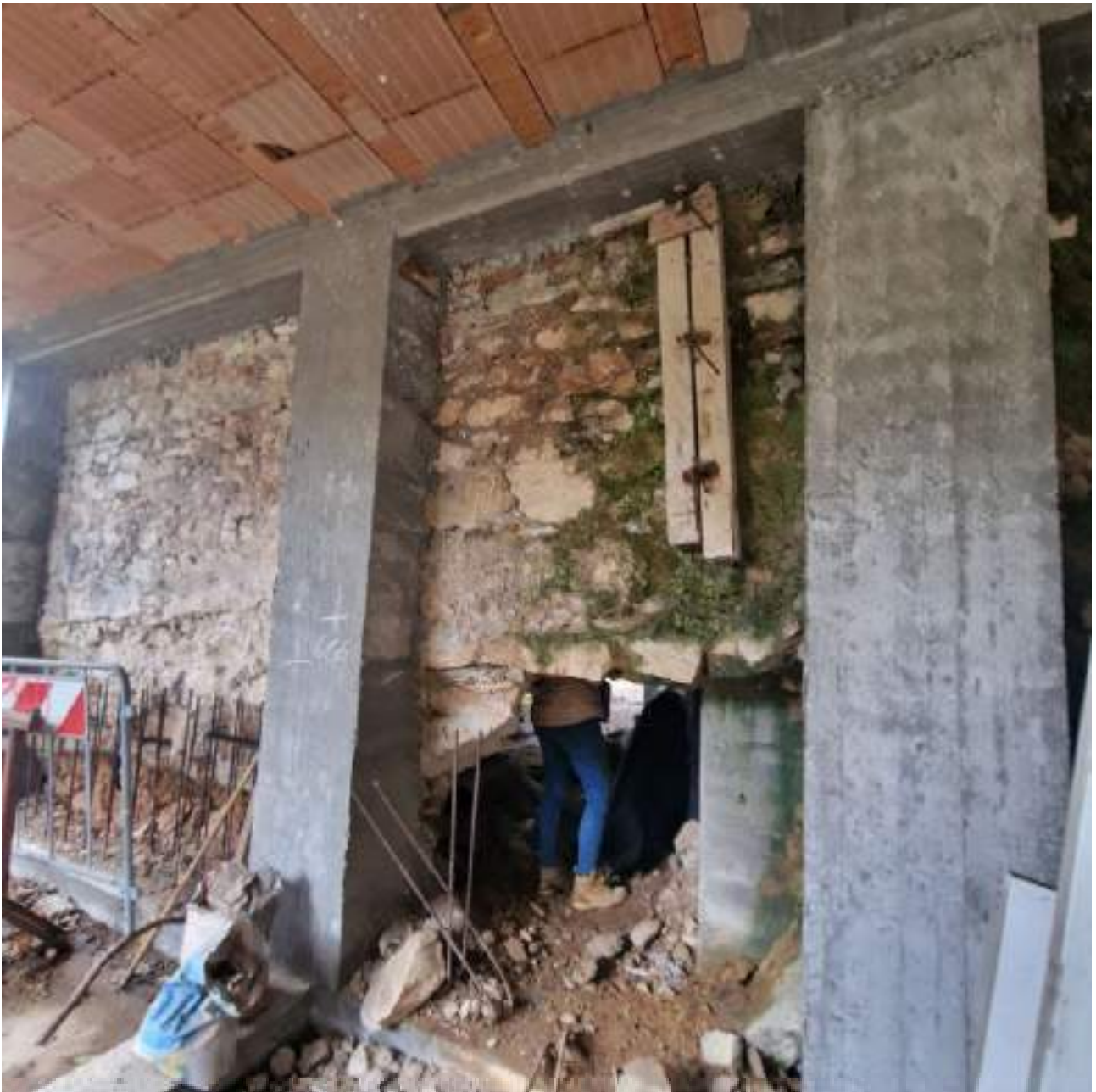
FOTO 18 STATO MURATURE ANTICA FORNACE (3° sopralluogo 02/11/2022)