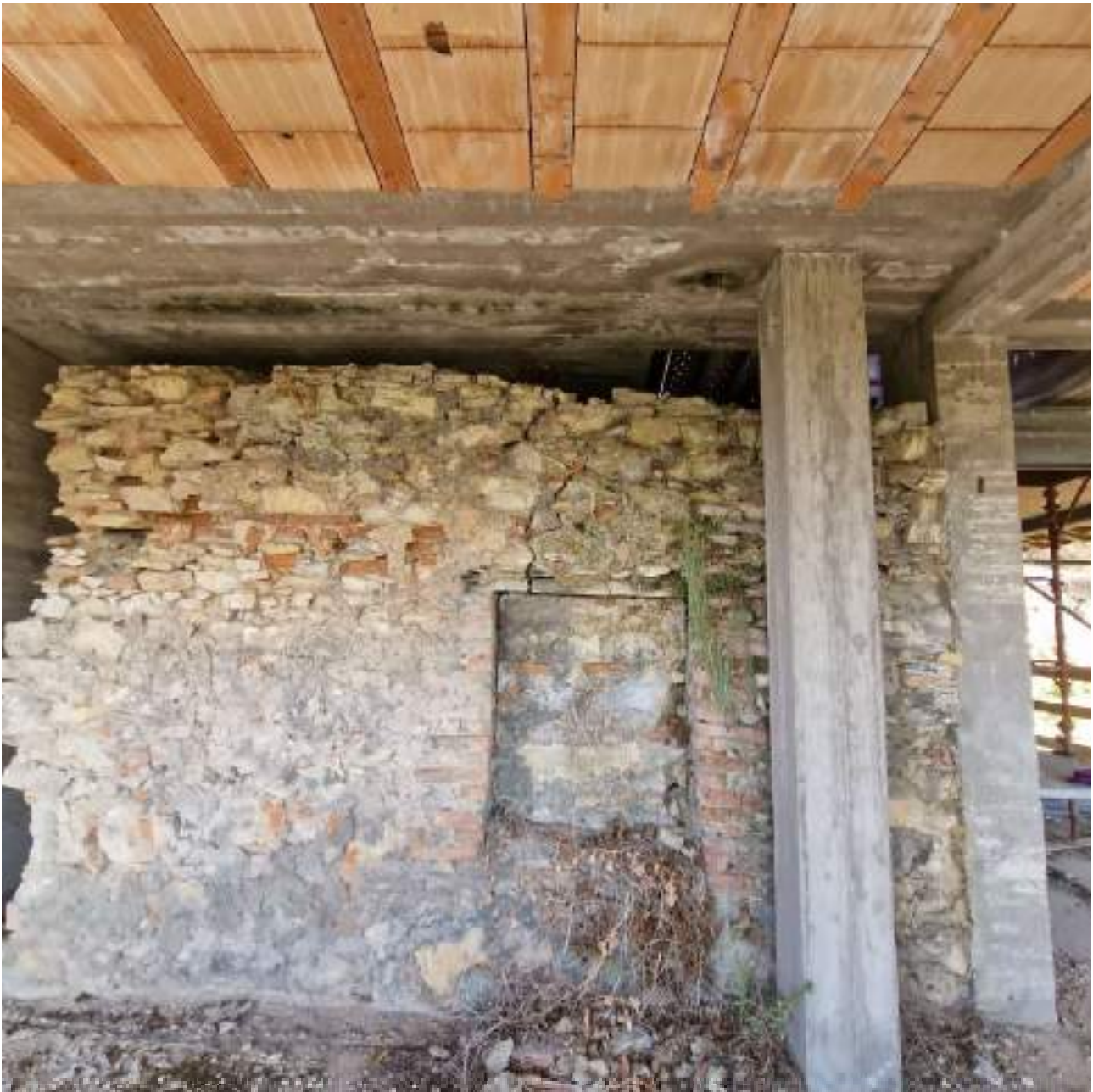
FOTO 7 PIANO PRIMO – VISTA MURATURE ANTICA FORNACE (2° sopralluogo 25/09/2022)