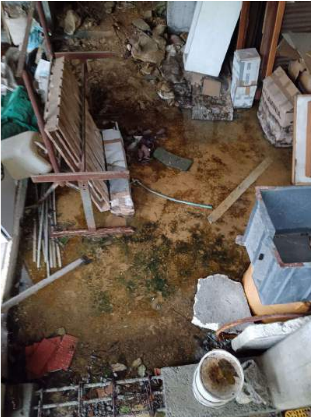
FOTO 23 STATO DEGRADO INTERNO PER ESPOSIZIONE AGENTI ATMOSFERICI (4° sopralluogo 10/11/2022 per rilievo con strumento topografico)