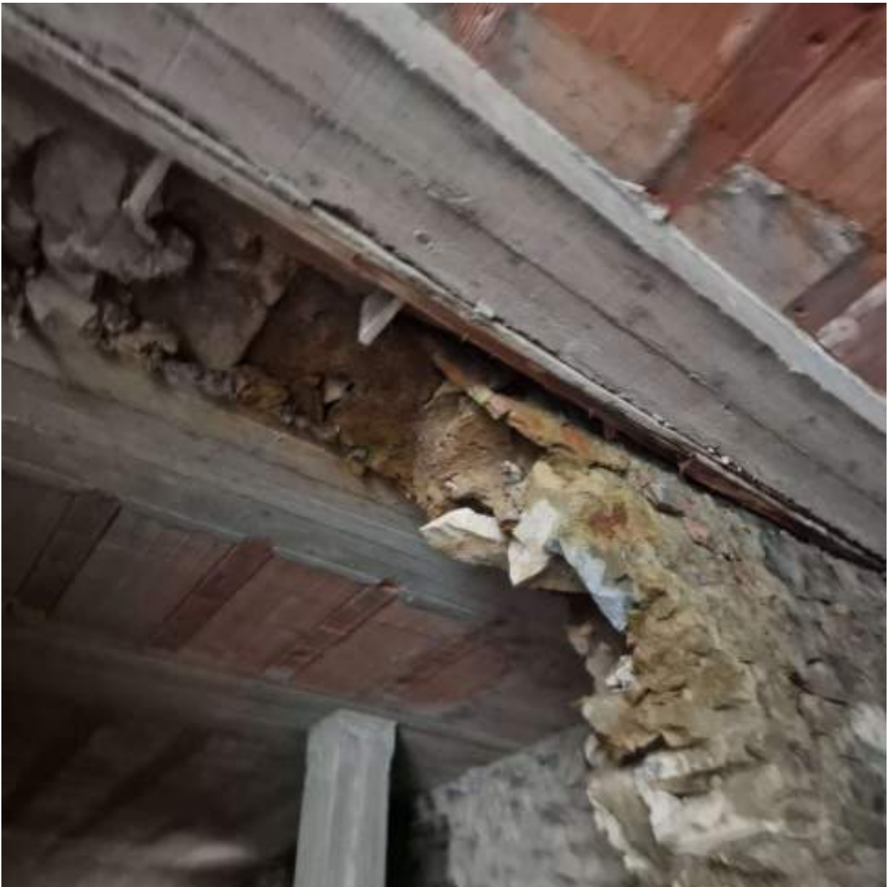
FOTO 19 STATO MURATURE ANTICA FORNACE (3° sopralluogo 02/11/2022)