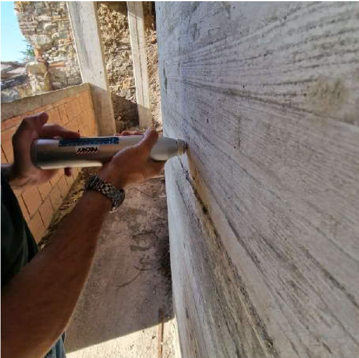
FOTO 6 PIANO PRIMO – SAGGI SU ELEMENTI IN CALCESTRUZZO (2° sopralluogo 25/09/2022)