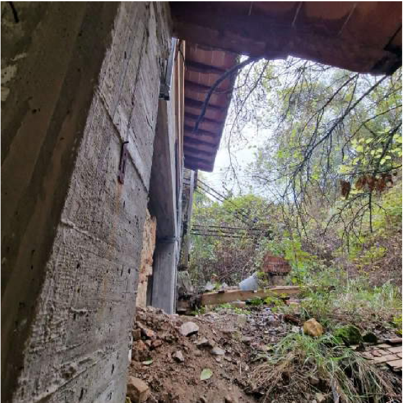
FOTO 15 STATO AREE ESTERNE