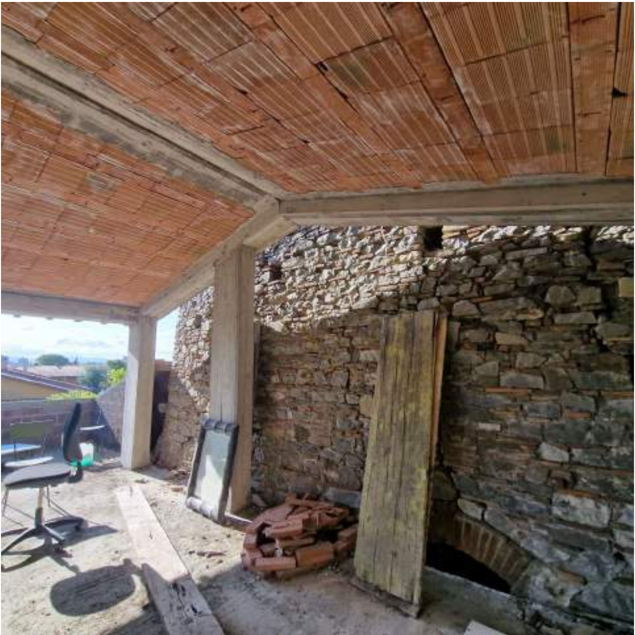
FOTO 11 PIANO SECONDO – VISTA LATO TORRE VECCHIA FORNACE (2° sopralluogo 25/09/2022)