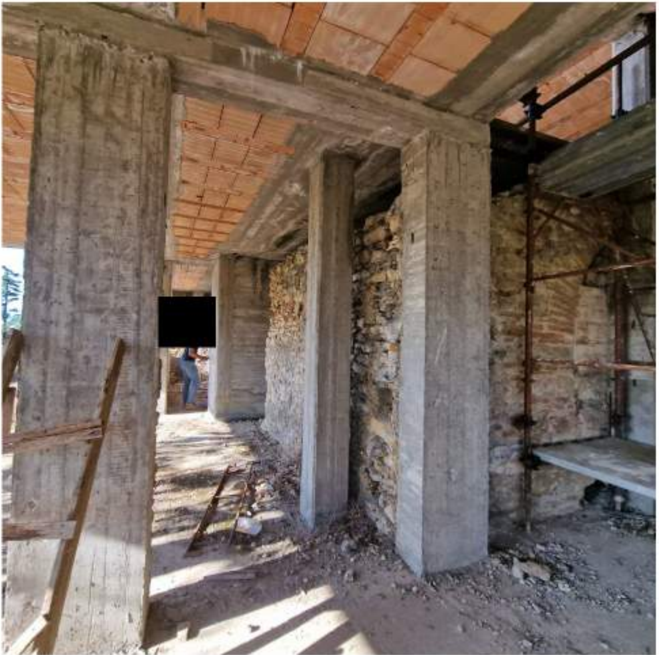
FOTO 5 PIANO PRIMO – VISTA MURATURE ANTICA FORNACE E SAGGI SU ELEMENTI IN CALCESTRUZZO (2° sopralluogo 25/09/2022)