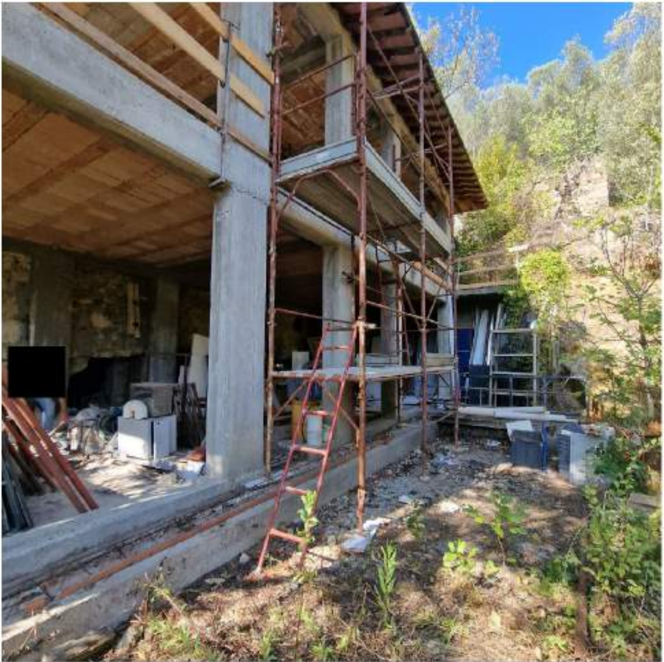
FOTO 2 PIANO TERRA – ELEMENTI DI PONTEGGIO INSTALLATI PER ACCESSO PIANI SUPERIORI (2° sopralluogo 25/09/2022)