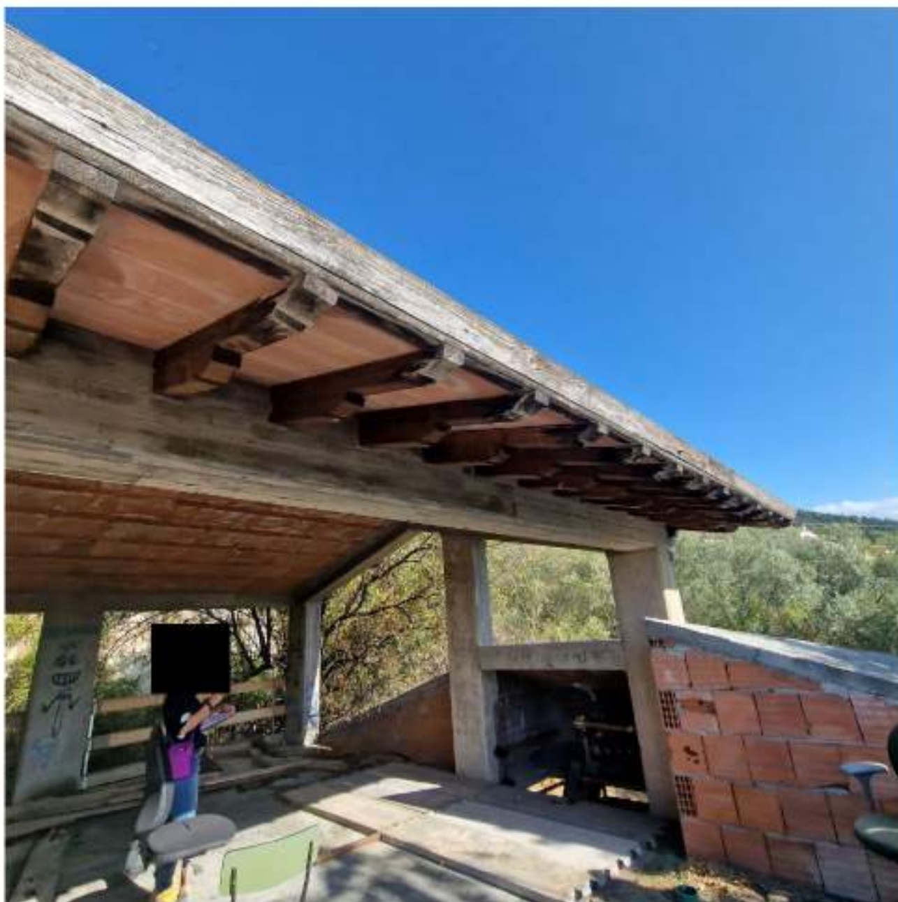
FOTO 10 PIANO SECONDO – VISTA ACCESSO E TERRAZZO A TASCA (2° sopralluogo 25/09/2022)