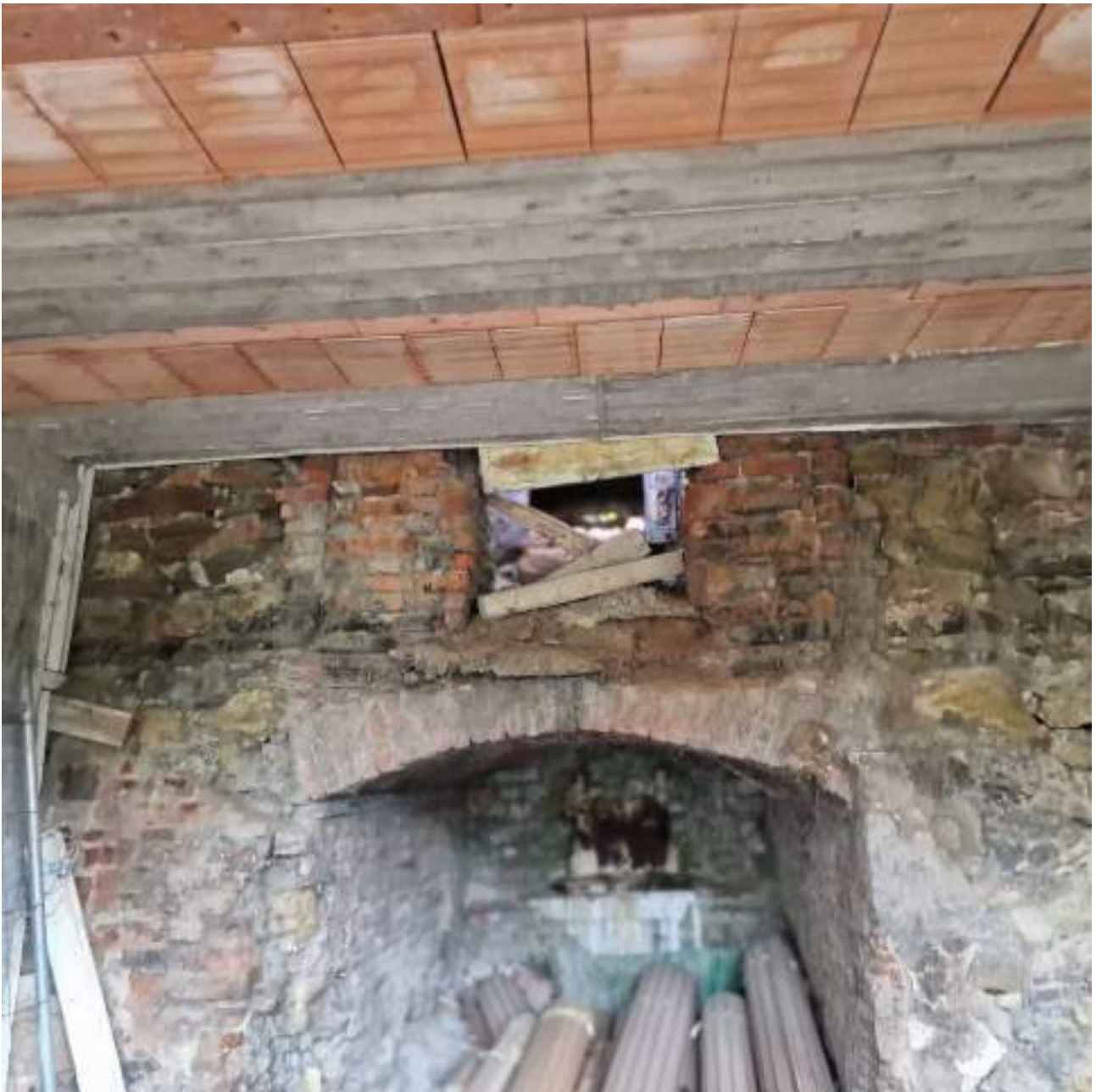
FOTO 20 STATO MURATURE ANTICA FORNACE