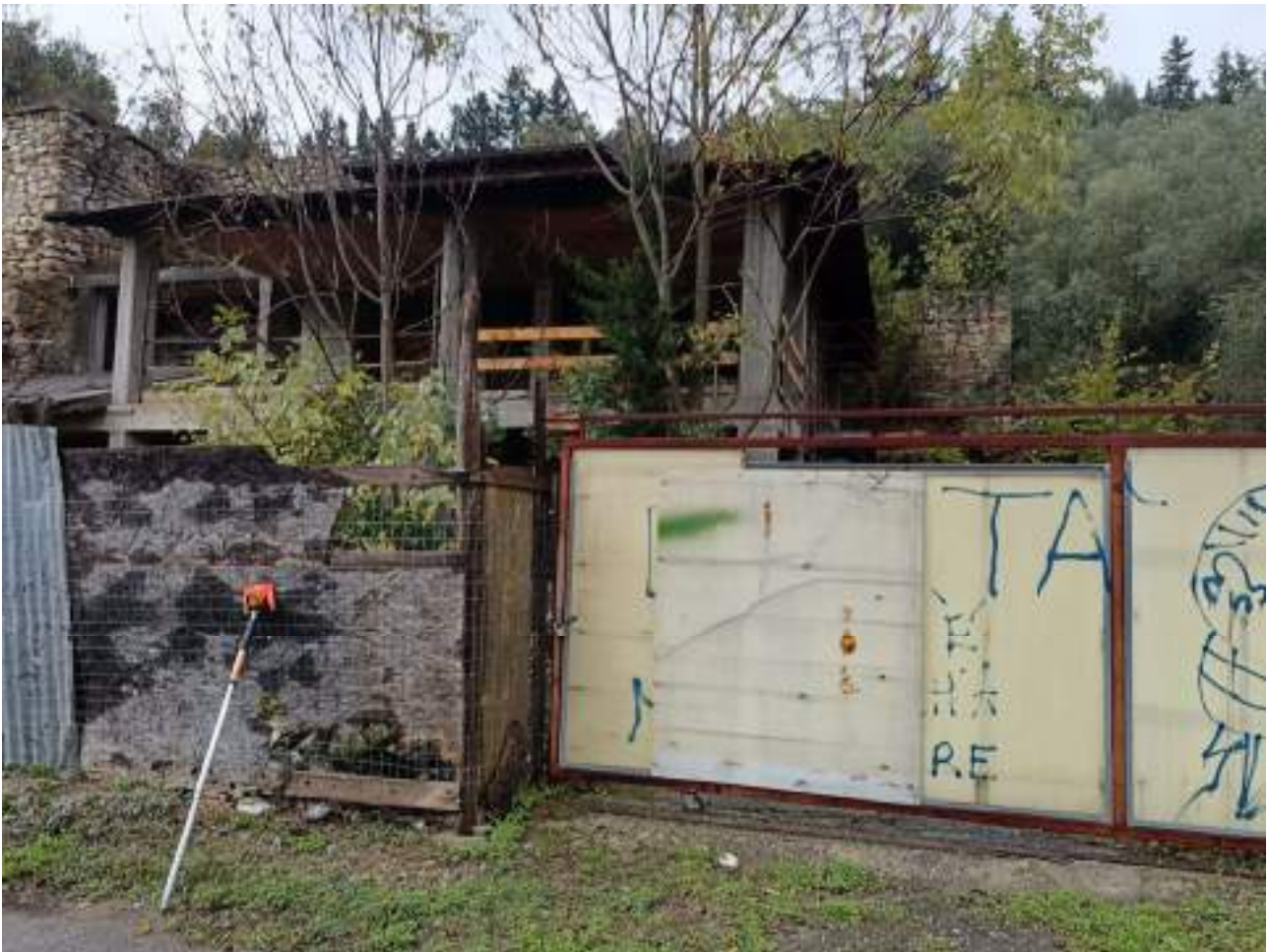
FOTO 24 VISTA FABBRICATO DA VIA MUGELLESE

(4° sopralluogo 10/11/2022 per rilievo con strumento topografico)