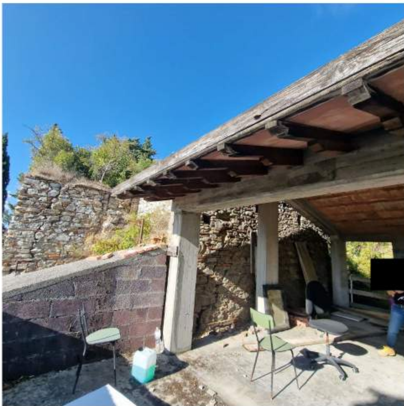
FOTO 12 PIANO SECONDO – VISTA LATO TORRE VECCHIA FORNACE (2° sopralluogo 25/09/2022)