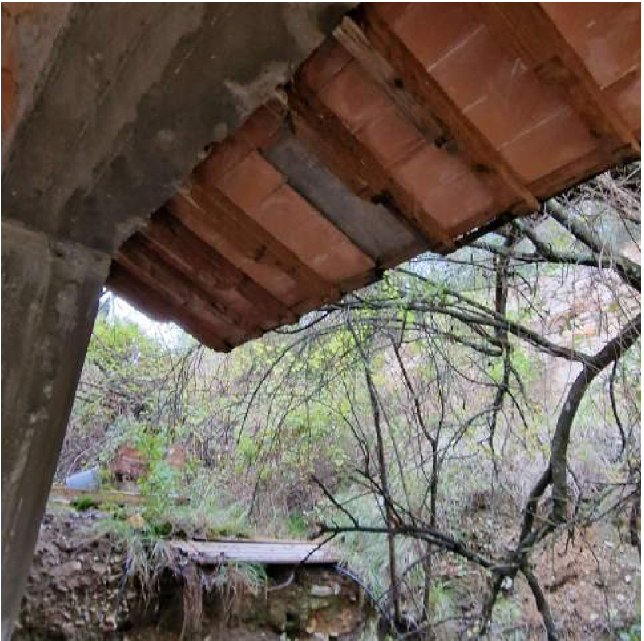
FOTO 14 STATO DEGRADO GRONDE ALLA TOSCANA (3° sopralluogo 02/11/2022)