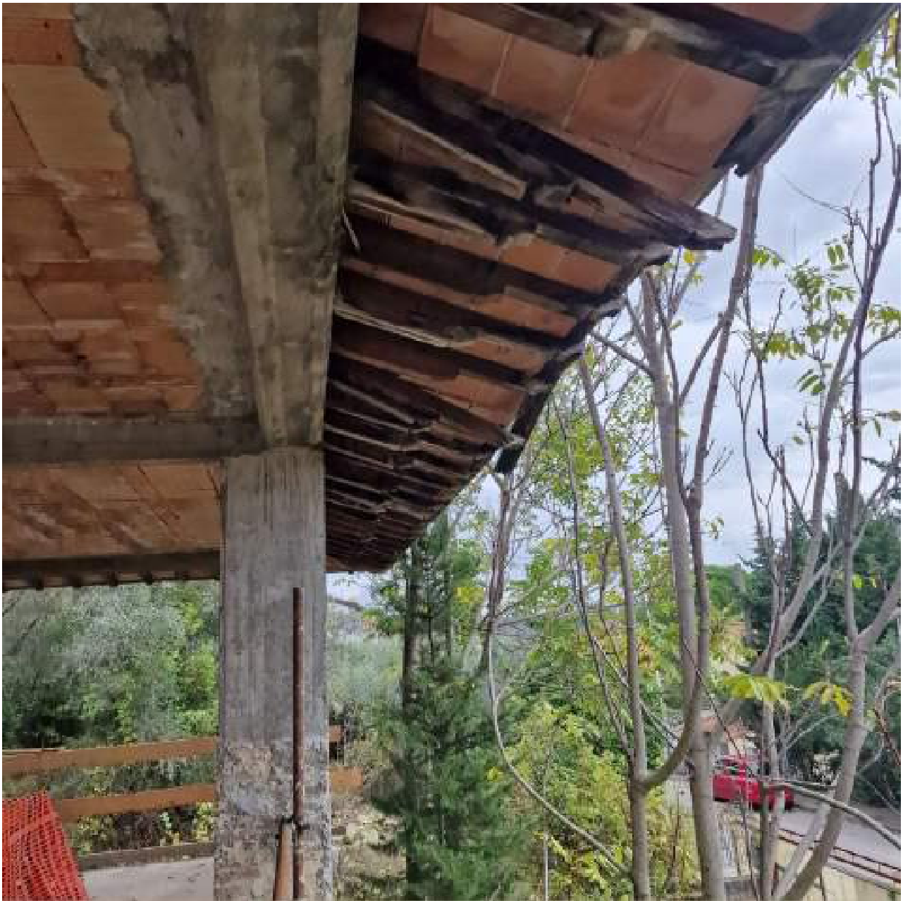
FOTO 13 STATO DEGRADO GRONDE ALLA TOSCANA (3° sopralluogo 02/11/2022)