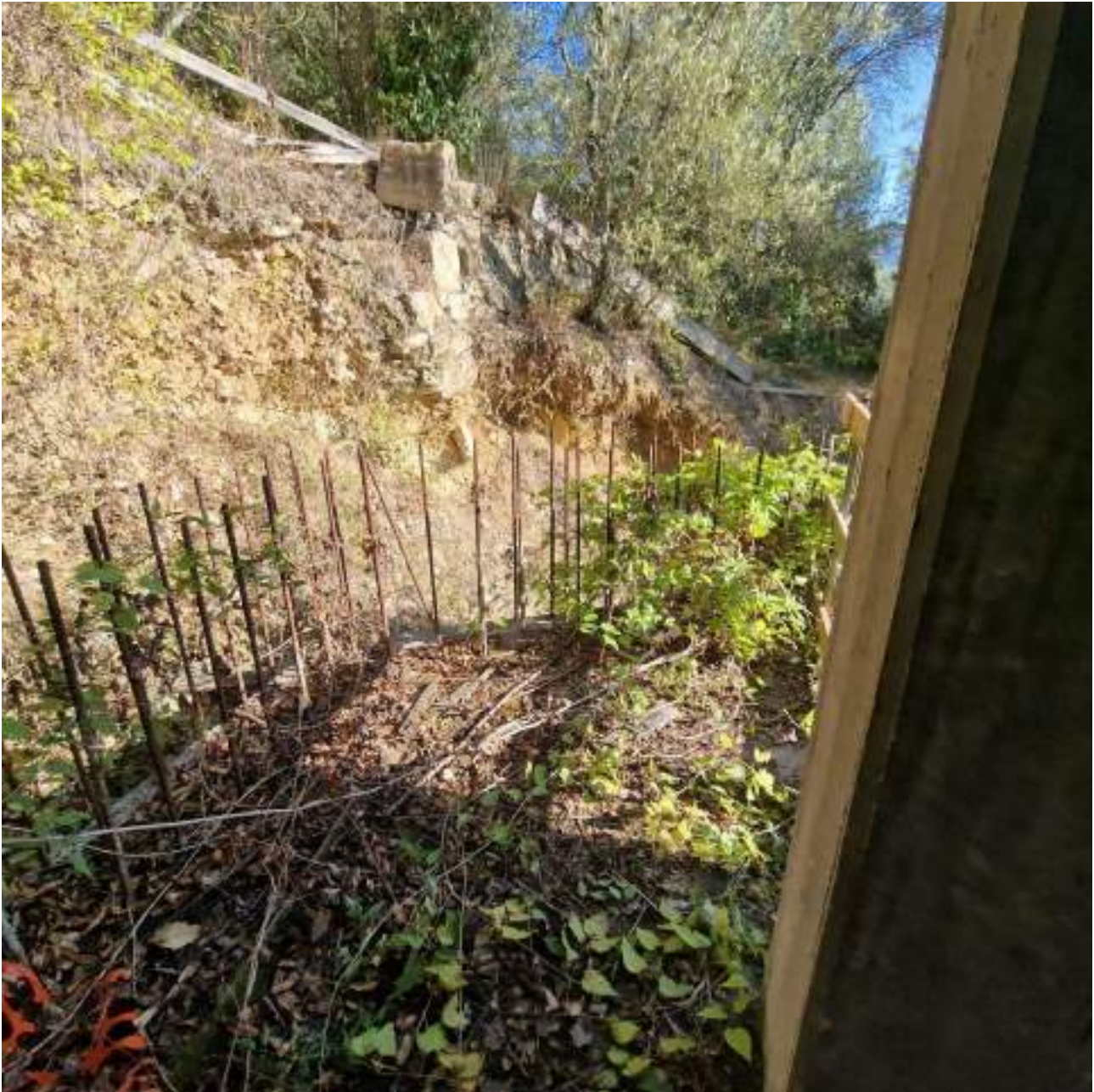
FOTO 9 PIANO PRIMO – TERRAZZO DA COMPLETARE (2° sopralluogo 25/09/2022)