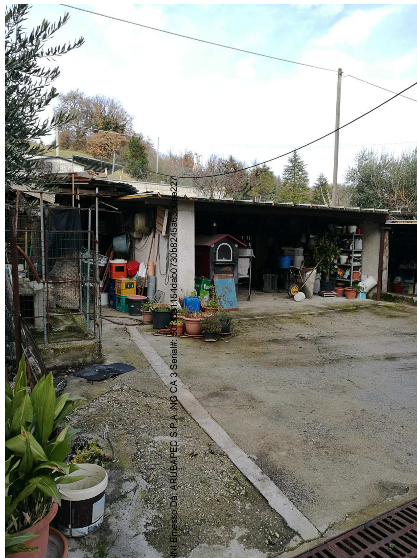
Immobile H Foglio n. 45 Particella 661 Vista del Vista del lato nord est

Firmato Da: RIPANI GIOVANNI E messo Da: ARUBAPEC S.P.A. NG CA 3 Serial#: 500001154dab0730b8245a65a1e227