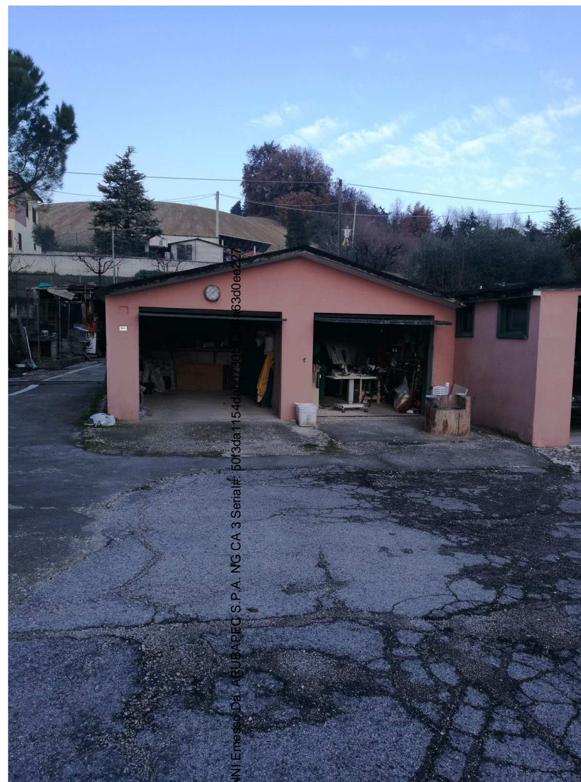
Immobile G Foglio n. 45, Particella 489, sub 2

Firmato Da: RIPANI GIOVANNI Emesso Da: ARUBAPEC S.P.A. NG CA 3 Serial#: 50f3da1154dab4a73013163d0ee227