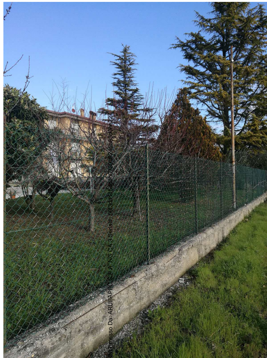
Immobile D Foglio n. 34, Particella 255 Vista da sud ovest

Firmato Da: ARUBA P.E.C. S. P. A. - NG CA 3 - Segreteria - Via S. Maria Maddalena 100 - 00187 Roma (RM) - Tel. 06 49790123 - Fax 06 49790124