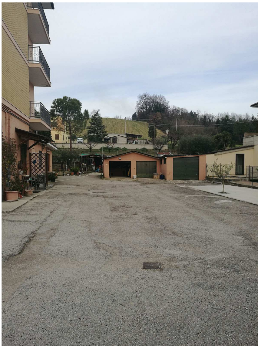
Immobile G Foglio n. 45, Particella 489, sub 2 Vista dall'accesso da Via Faleriense Est