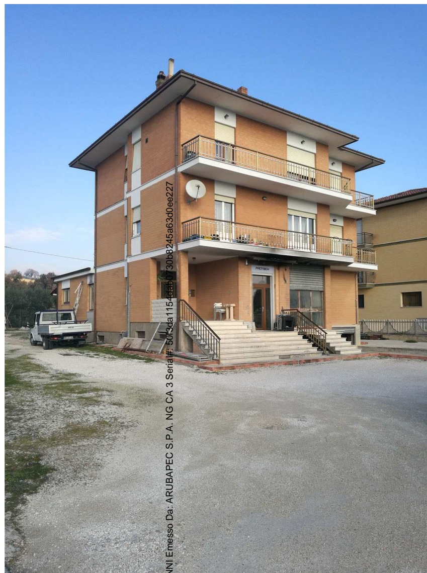
Foglio n. 34, Particella 218 vista d'insieme, immobili A,B e C

Firmato Da: RIPANI GIOVANNI Emesso Da: ARUBAPEC S.P.A. NG CA 3 Serial#: 5055da11544eab030b8245a63d0ee227