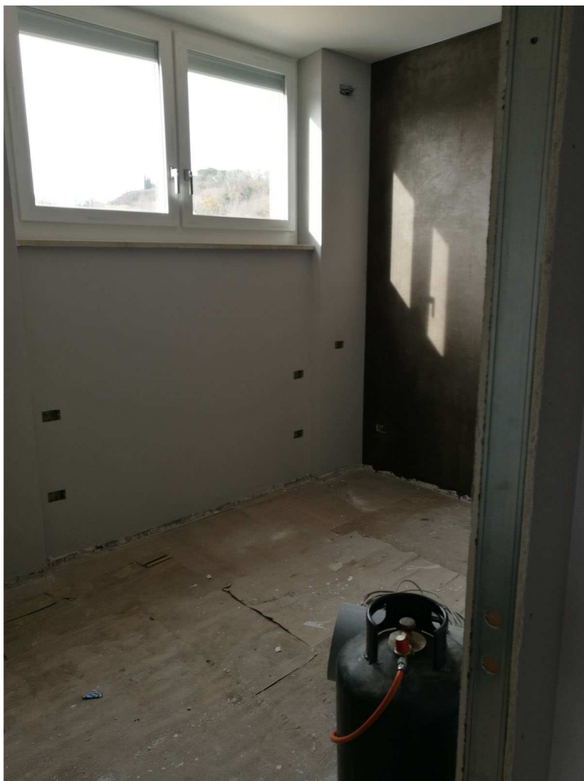
Immobile A Foglio n. 34, Particella 218, sub 4 Piano terra rialzato - vista interna