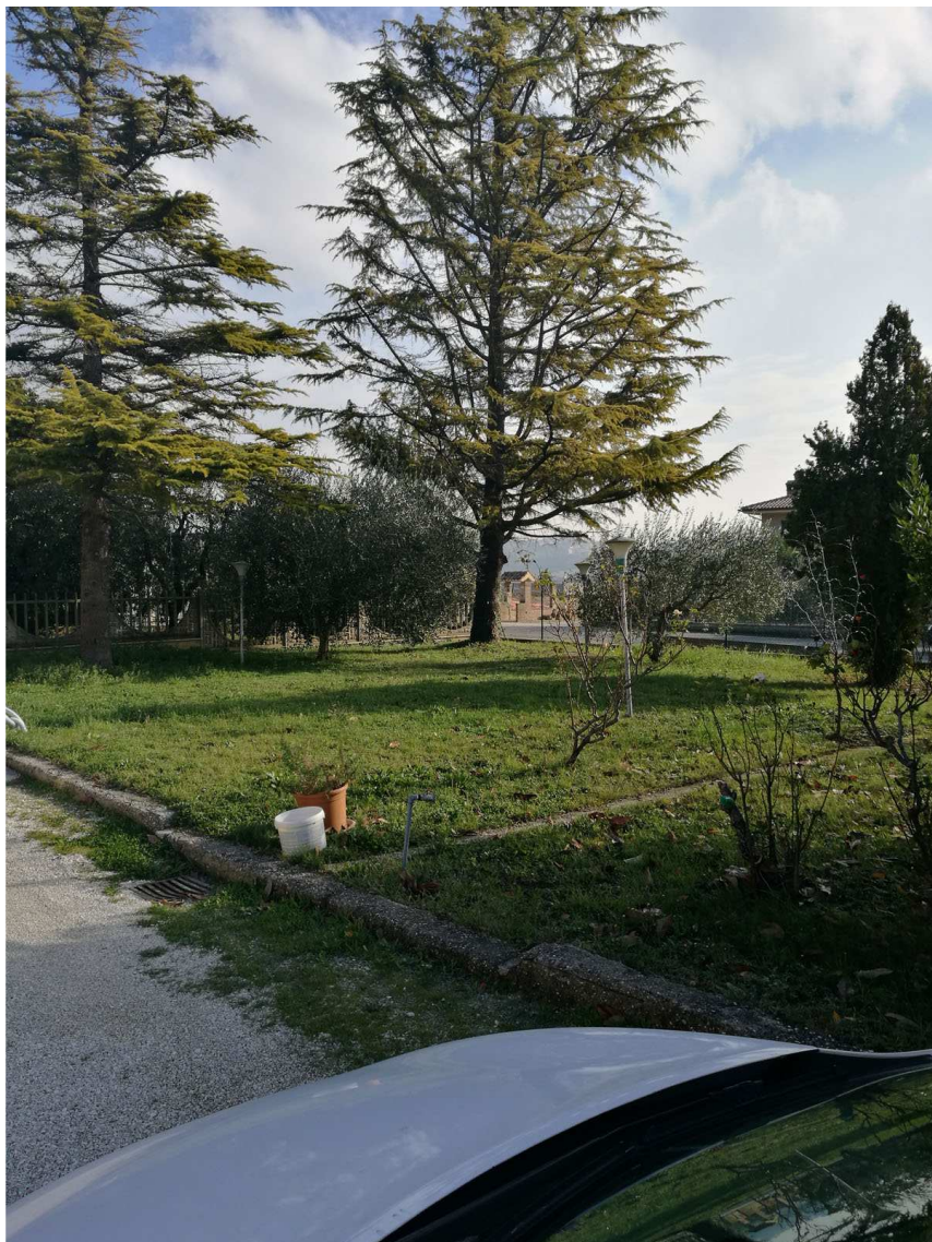
Immobile D Foglio n. 34, Particella 255 Vista da nord ovest