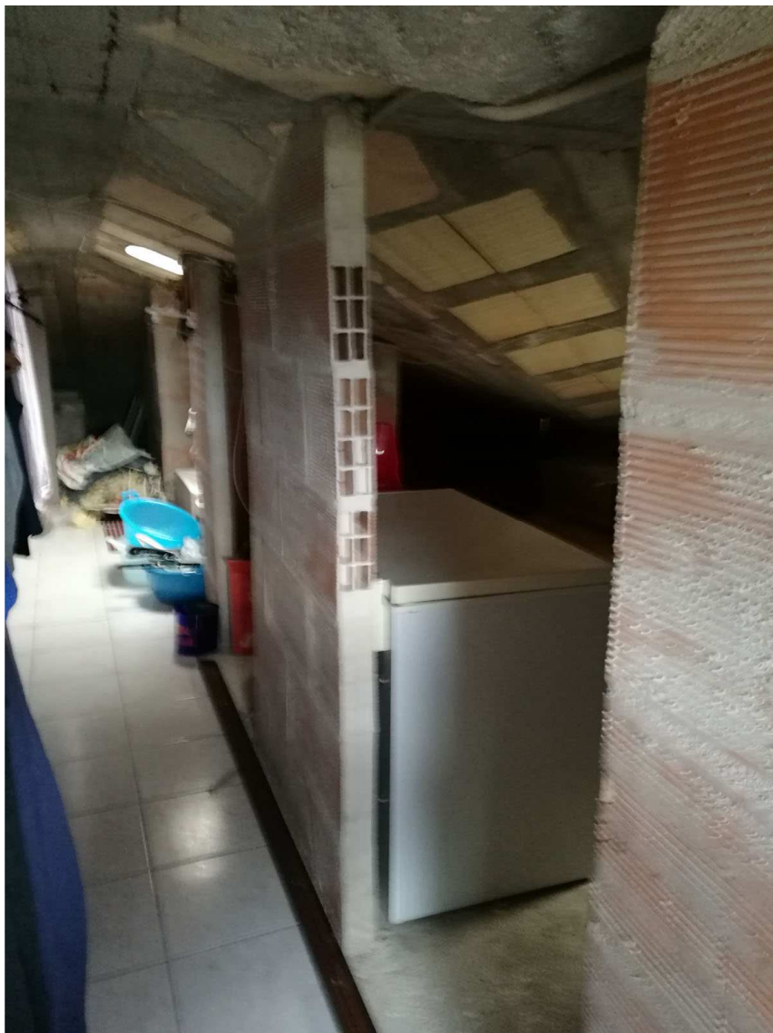
Immobile B Foglio n. 34, Particella 218, sub 5 Soffitta- vista interna