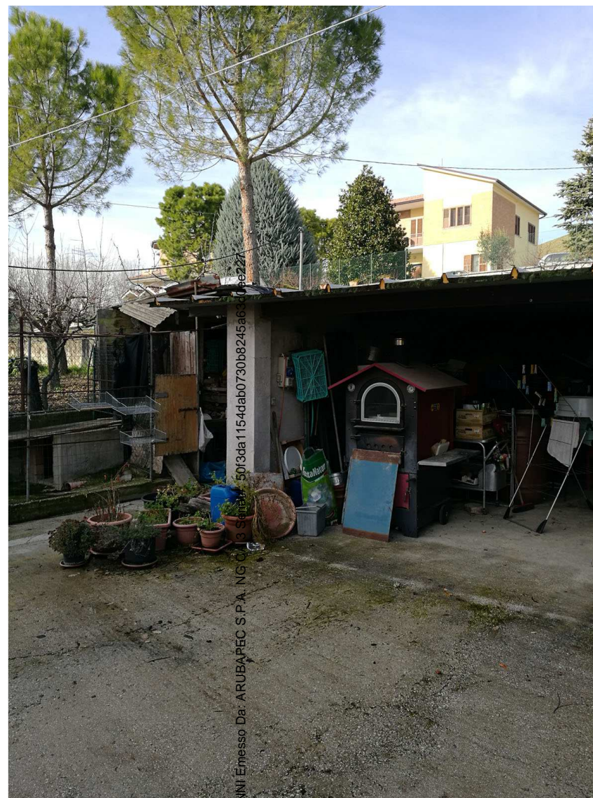
Immobile H Foglio n. 45 Particella 661 Vista dell'angolo nord ovest

Firmato Da: RIPANI GIOVANNI Emesso Da: ARUBAPEC S.P.A. NG 050f3da1154dab0730b8245a63d0aee27