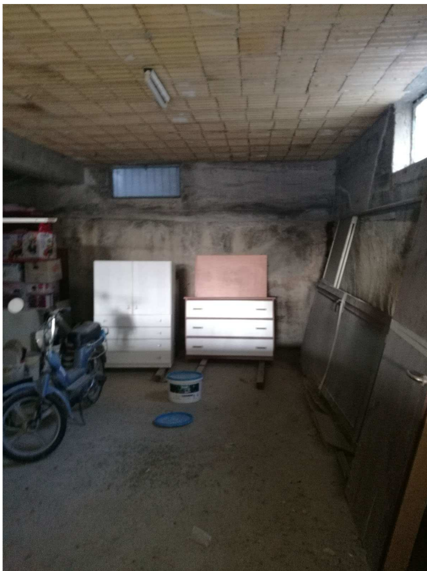
Immobile C Foglio n. 34, Particella 218, sub 6 Piano interrato- vista interna