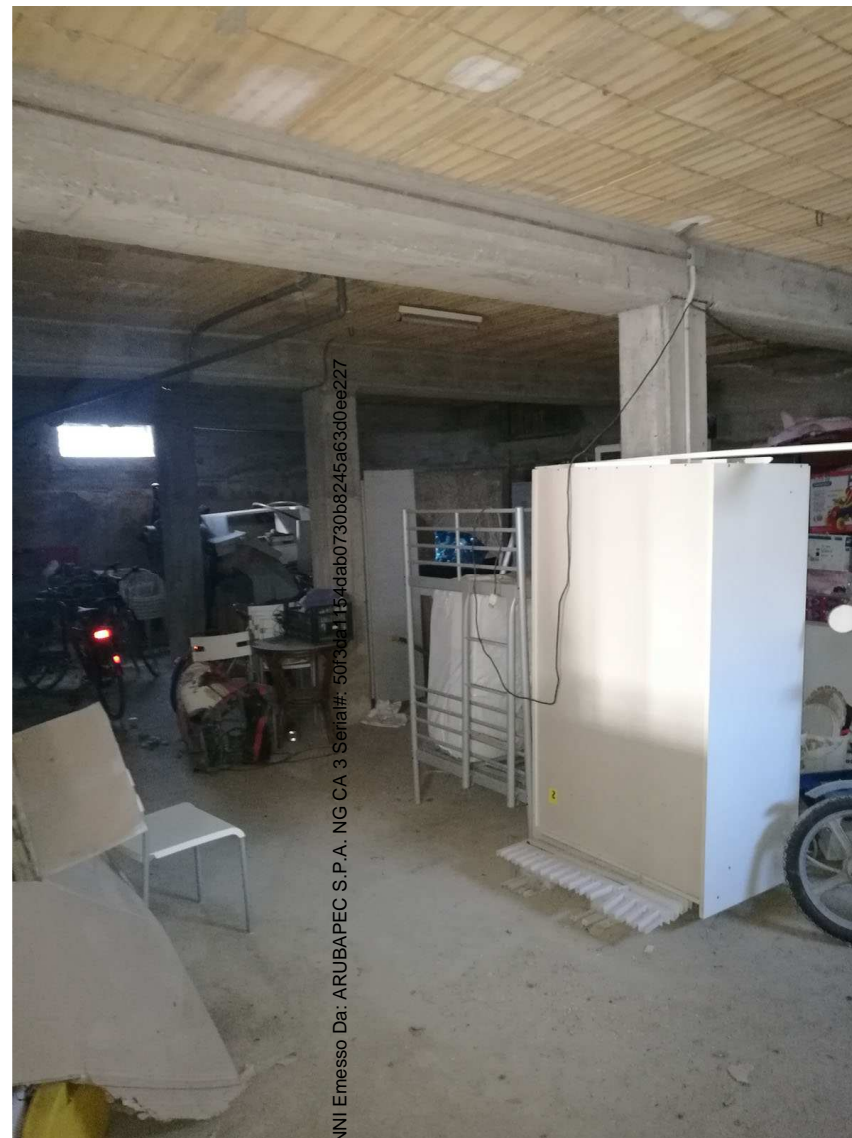
Immobile C Foglio n. 34, Particella 218, sub 6 Piano interrato- vista interna

Firmato Da: RIPANZI GIOVANNI Emesso Da: ARUBAPEC S.P.A. NG CA 3 Serial#: 50f5d41154dab0730b8245a6360ee227