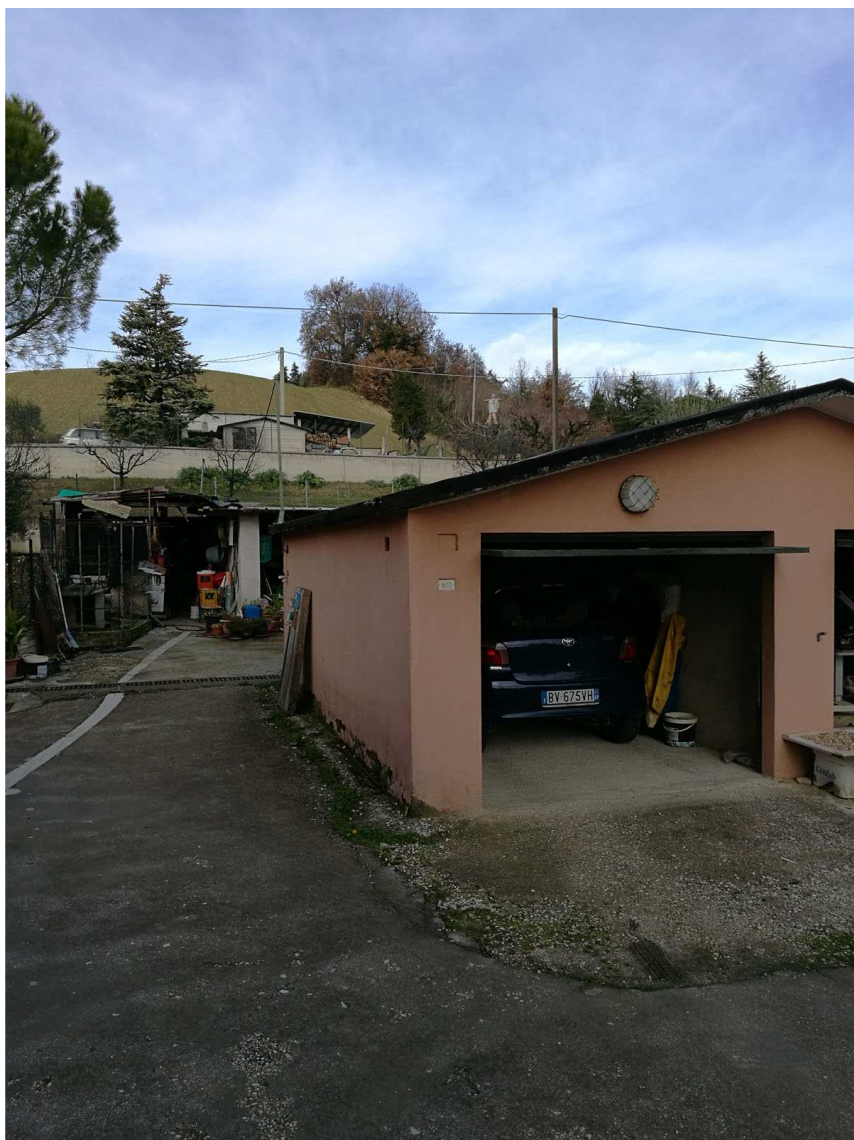
Immobile G Foglio n. 45, Particella 489, sub 2