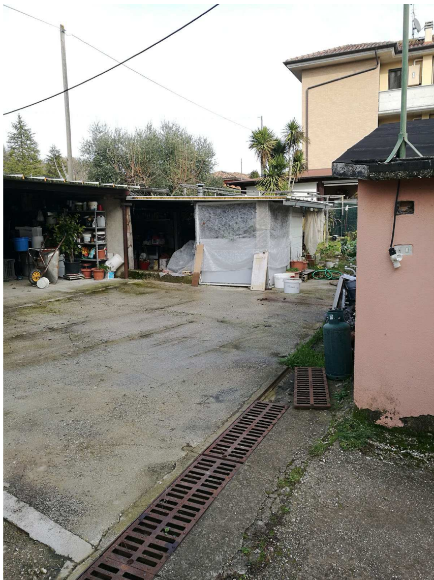
Immobile H Foglio n. 45 Particella 661 Vista del lato sud est