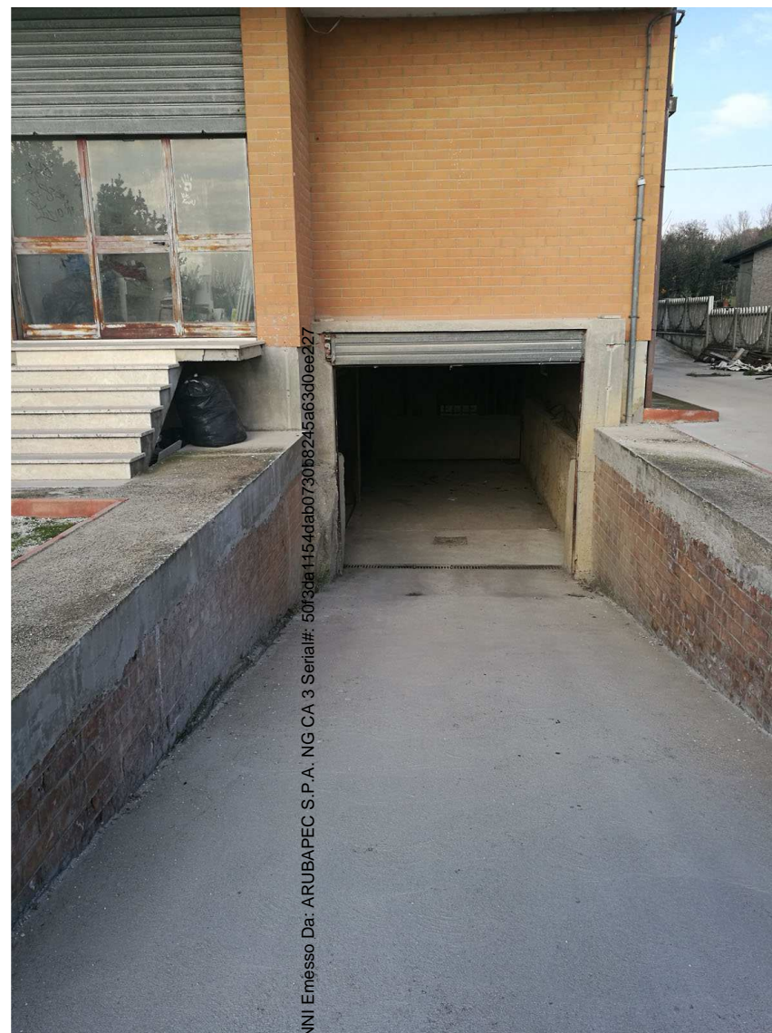
Immobile C Foglio n. 34, Particella 218, sub 6 Piano interrato- rampa d'accesso esterna

Firmato Da: RIPANI GIOVANNI Emesso Da: ARUBAPEC S.P.A. NG CA 3 Serial#: 50f3da1154dab0730b8245a63d0ee227