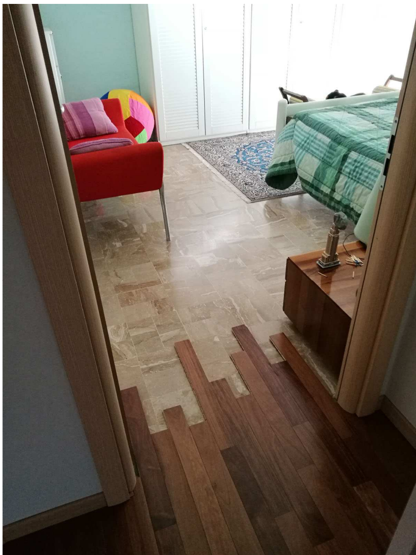
Immobile B Foglio n. 34, Particella 218, sub 5 Piano secondo- vista interna