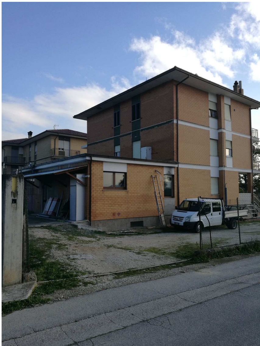
Foglio n. 34, Particella 218 vista d'insieme, immobili A,B e C