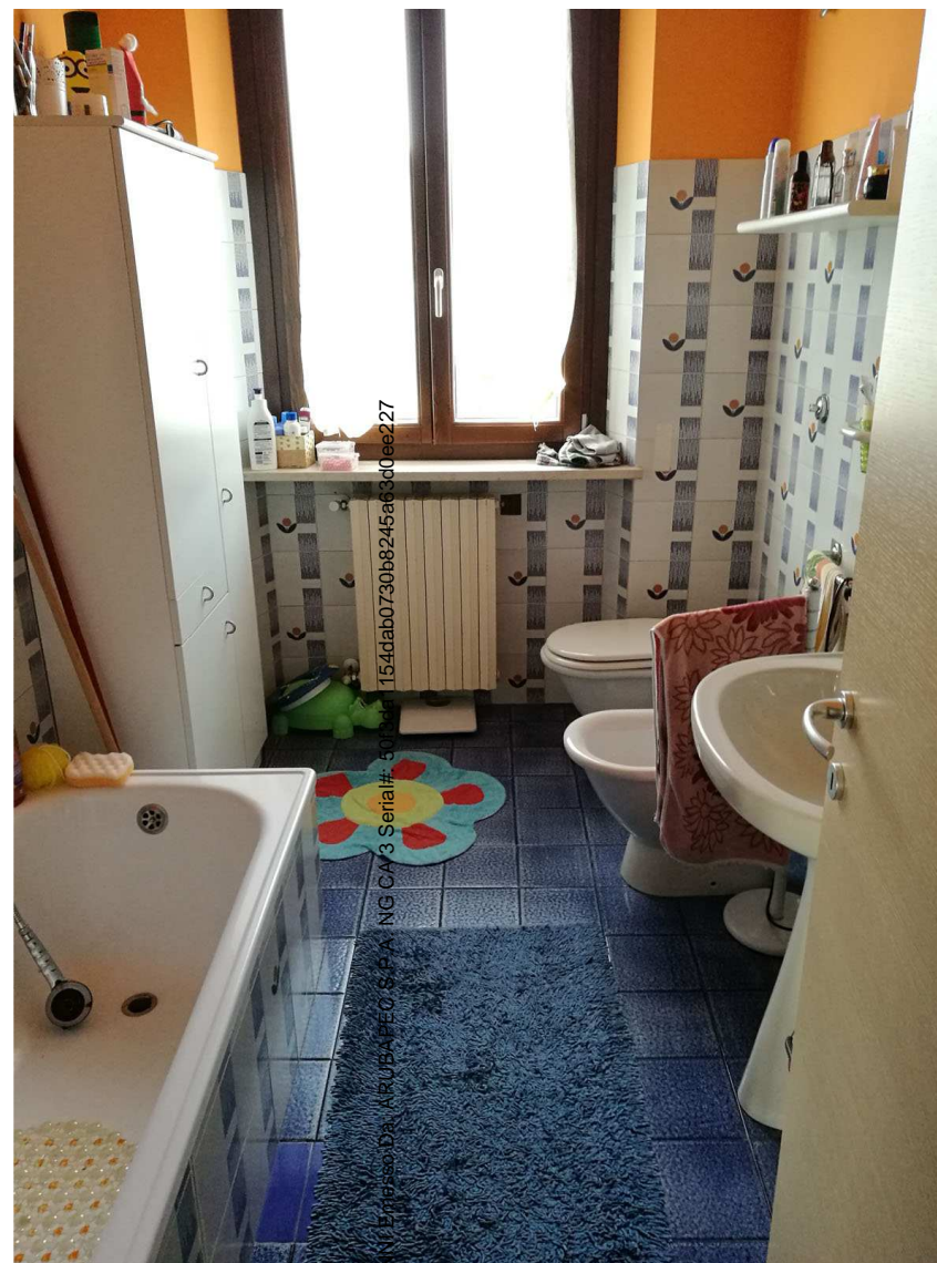
Immobile B Foglio n. 34, Particella 218, sub 5 Piano secondo- vista interna

Firmato Da: RIPANZI GIOVANNI 154dab0730b8245a6300ee227