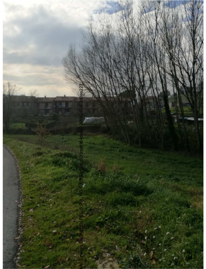
Immobile F Foglio n. 45, Particella 683 Scorcio

Firmato Da: RIPANI GIOVANNI E messo Da: ARUBAPEC S.P.A. NG CA 3 Serie#: 50f9daf154da10730b8245a63d0ee227