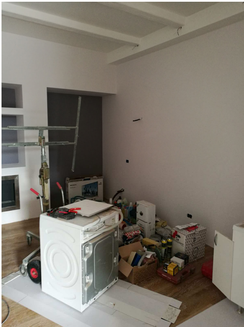
Immobile A Foglio n. 34, Particella 218, sub 4 Piano terra rialzato - vista interna