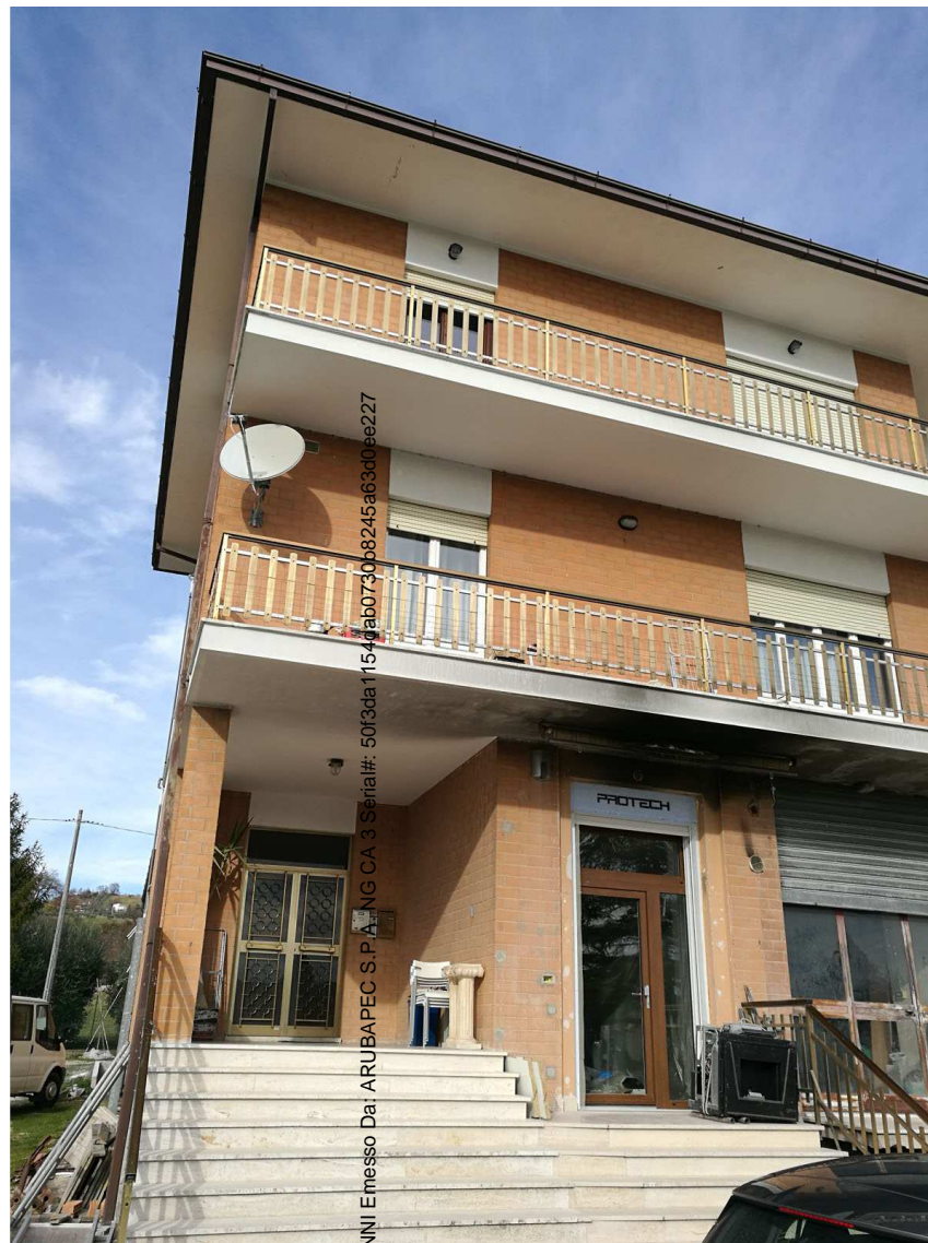
Foglio n. 34, Particella 208 vista immobili A e B

Firmato Da: RIPANI GIOVANNI | E messo Da: ARUBAPEC S.P.A. | ING CA 3 | Serial#: 50f5da154daab0730b8245a63d0ee227