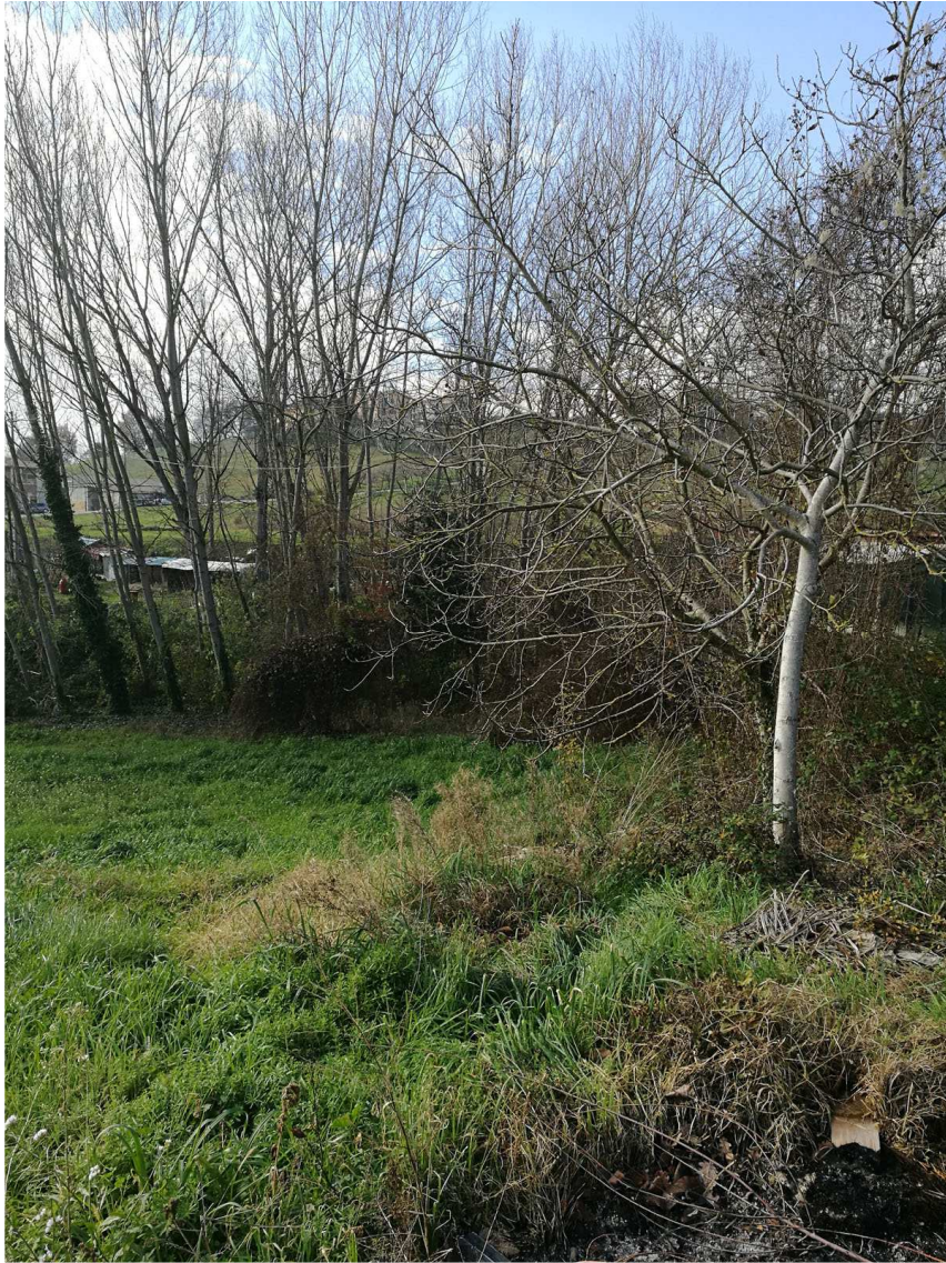
Immobile E Foglio n. 45, Particella 60 Scorcio