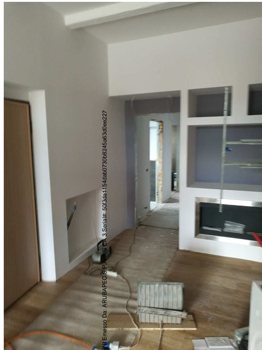
Immobile A Foglio n. 34, Particella 218, sub 4 Piano terra rialzato - vista interna

Firmato Da: RIPANI CO. S.p.A. Emesso Da: ARUBAPEC S.P.A. ING. CA. 3 Serial#: 50f5da1154dab0730b8245a63d0ee227