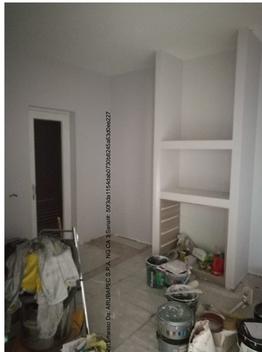
Immobile A Foglio n. 34, Particella 218, sub 4 Piano terra rialzato - vista interna

Firmato Da: RIPANI CO. ANNI Emesso Da: ARUBAPEC S.P.A. NG CA 3 Serial#: 50f3da1154dab0730b8245a63d0ee227