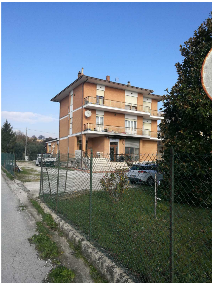
Foglio n. 34, Particella 218 vista d'insieme, immobili A,B e C