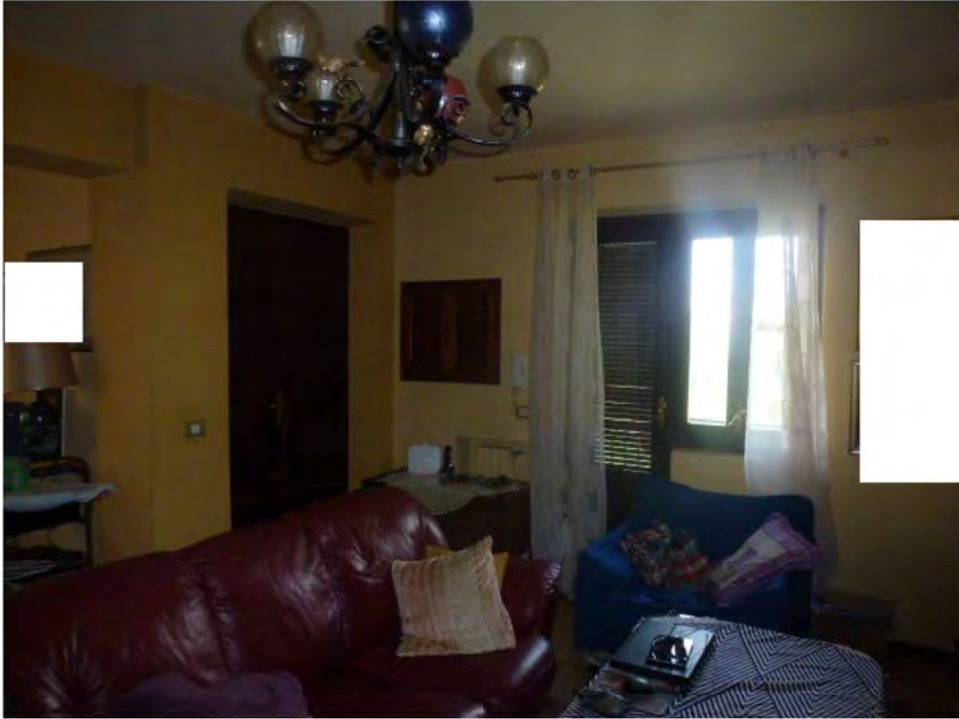
Foto n. 7: Ingresso/Soggiorno (vista dalla porta che porta al corridoio)