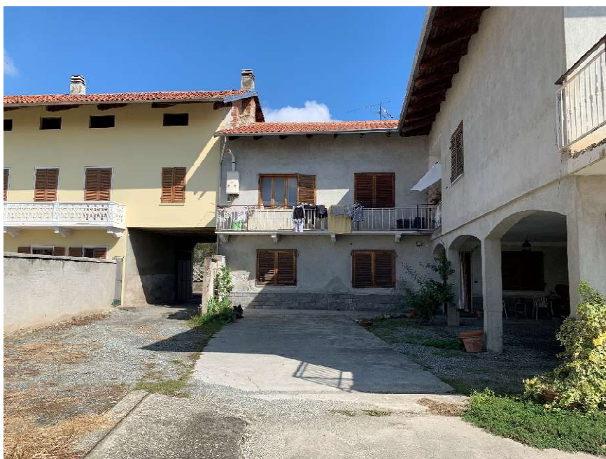
Vista dell'abitazione dal cortile