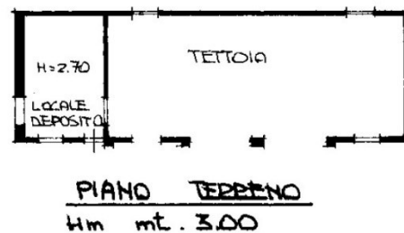
Elaborato catastale, corretto