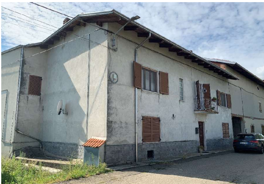
Vista dell'abitazione dalla strada

Il sottoscritto esperto dava inizio alle operazioni peritali di accesso diretto all'immobile dopo aver preso contatti con il custode che ha inviato lettera raccomandata alle parti esecutate, una non è stata ritirata in quanto non più domiciliato presso l'indirizzo indicato, l'altra è stata ritirata correttamente ed il giorno 26/09/2022 è stato possibile effettuare sopralluogo presso l'immobile, il tutto accompagnati dall'avvocato curatore del bene. In tale data si è potuto accedere ai beni oggetto di esecuzione che si sono rivelati alcuni occupati dai beni dall'esecutato, mentre altri in corso di ristrutturazione.