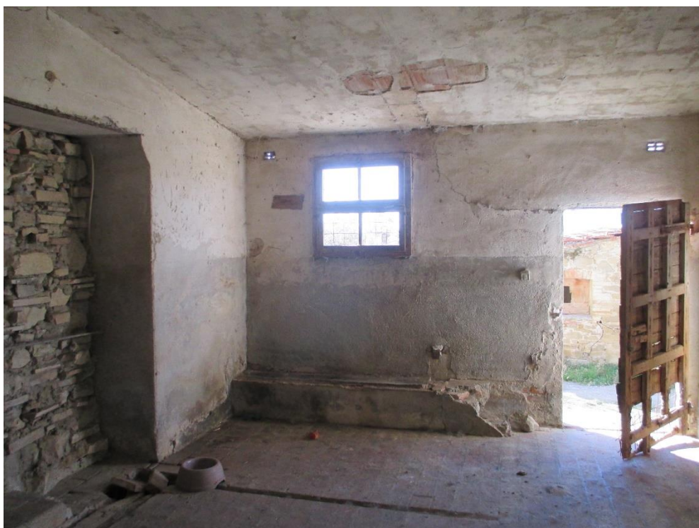
Foto n.11: Interno del fondo al piano terra posto a nord dell'edificio con accesso dal prospetto ovest, con il particolare della parete tamponata.