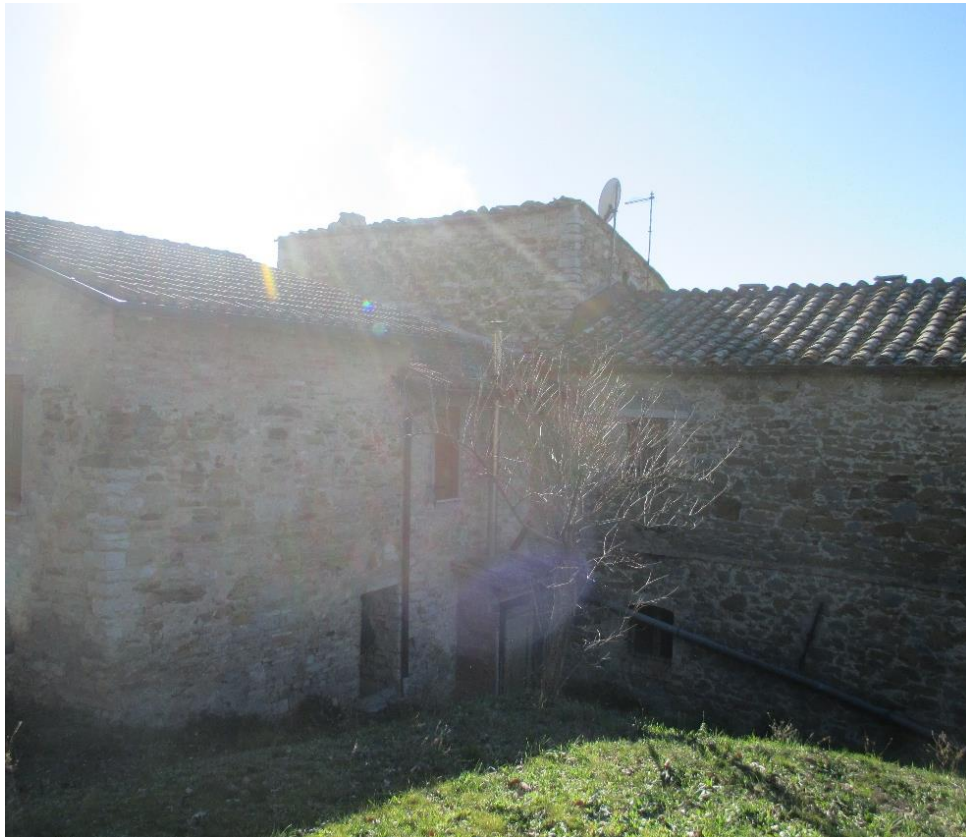
Foto n.5: Altro particolare del retro del fabbricato residenziale, dove è visibile il vano tecnico esterno posto in adiacenza alla cantina del piano terra dove è alloggiata la caldaia.