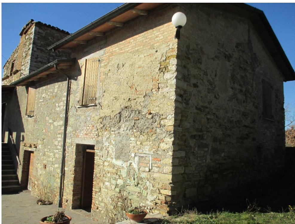
Foto n.4: Altro particolare del fabbricato residenziale con i prospetti sud e est.