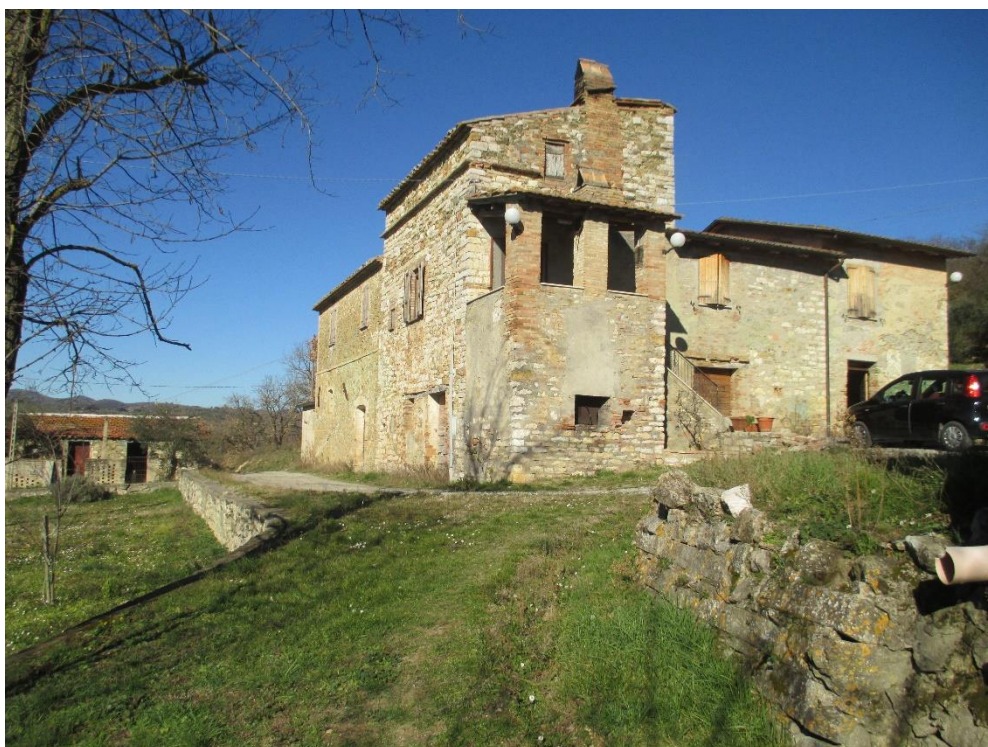
Foto n.2: Particolare ripreso da angolazione opposta alla precedente del fabbricato di civile abitazione con i prospetti sud e ovest, della pertinenza costituita dagli stalletti (prospetto sud), della corte esclusiva e del terreno agricolo.