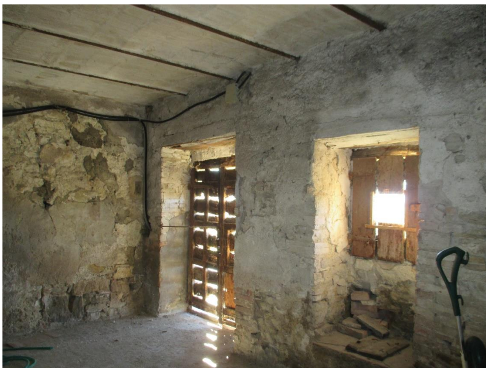
Foto n.13: Interno del fondo al piano terra con accesso dal prospetto ovest con copertura realizzata a volticine in ferro e laterizio.