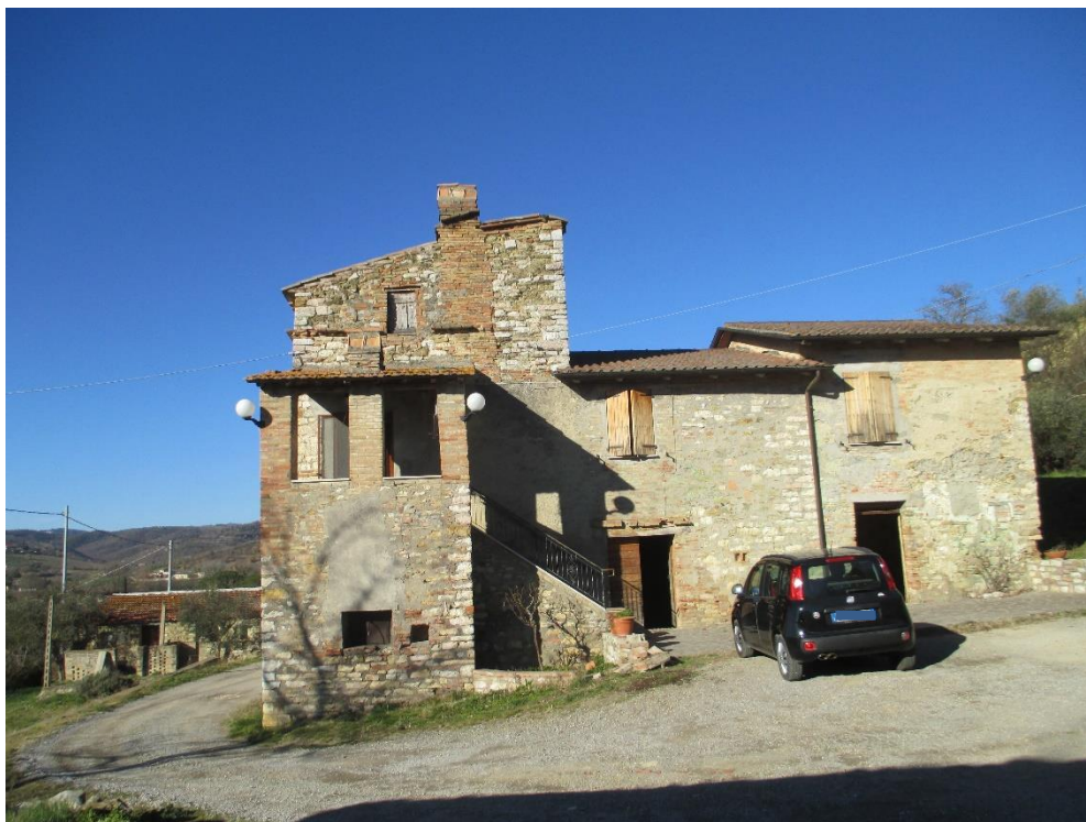
Foto n.3: Altro particolare del fabbricato residenziale su tre livelli con il prospetto principale (sud); sono visibili il forno al piano terra sotto la terrazza, la scala di accesso al piano primo con terrazza coperta e il secondo piano adibito a soffitta.