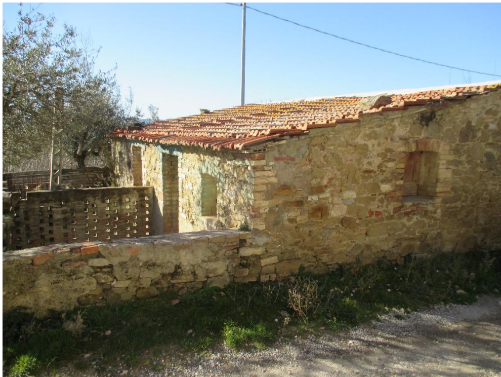
Foto n.8: Particolare della pertinenza costituita da stalletti ricadente nella particella 31 del foglio 24.