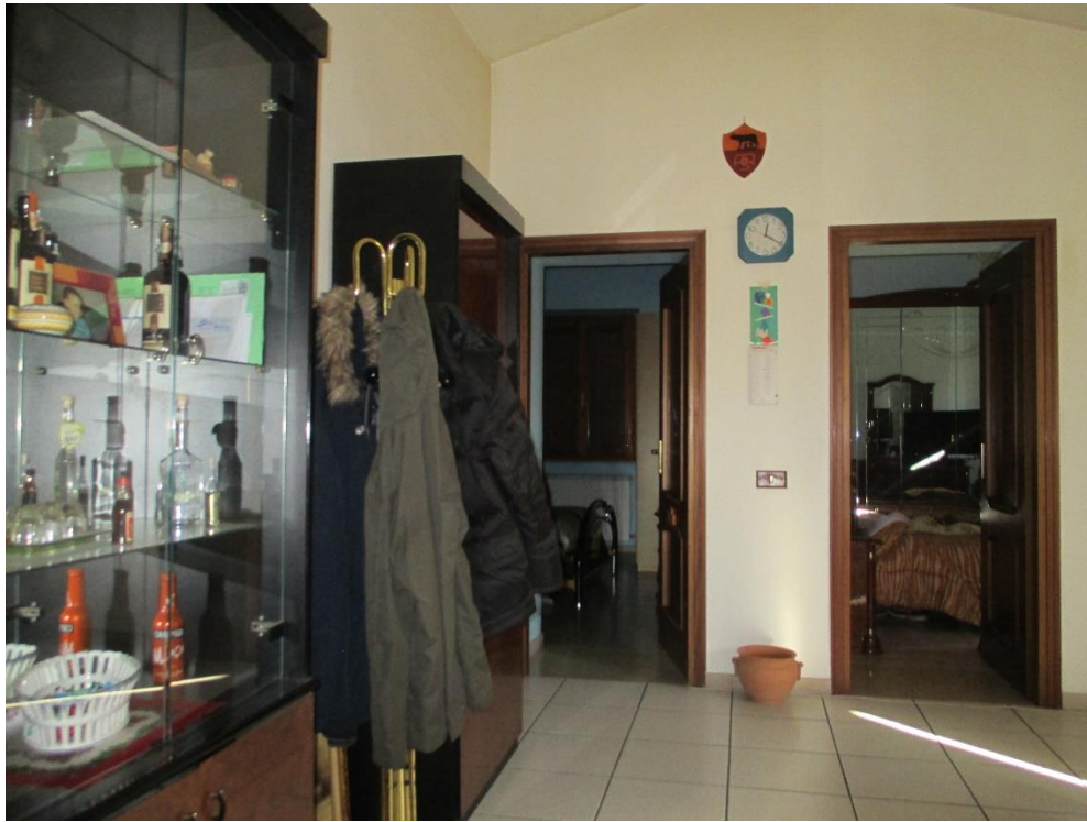
Foto n.19: Interno del soggiorno con l'accesso alle due camere sul lato est.