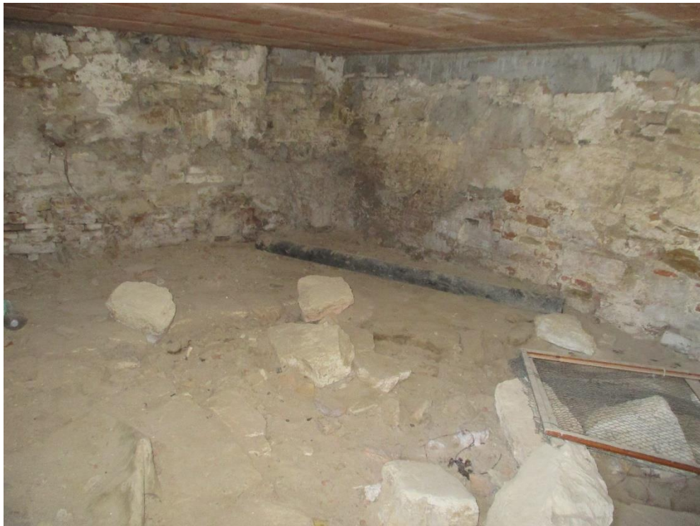
Foto n.16: interno del fondo al piano terra con accesso dal retro del fabbricato.