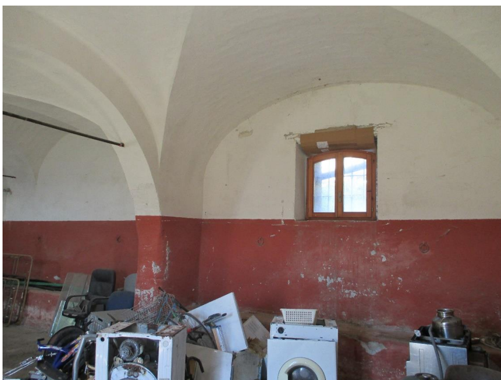
Foto n.12: Interno del fondo al piano terra con accesso dal prospetto ovest dotato di copertura con volte a vela.