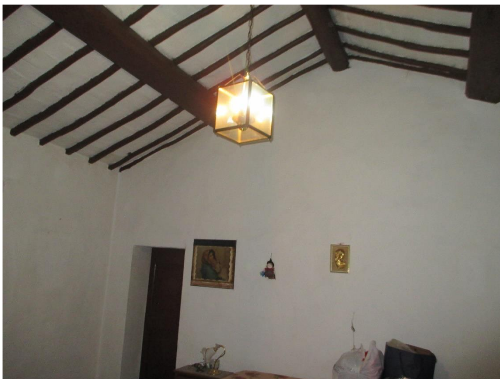
Foto n.23: Particolare della camera di passaggio sul lato nord del piano primo. Sullo sfondo la porta di accesso a una delle due altre camere sul lato nord.