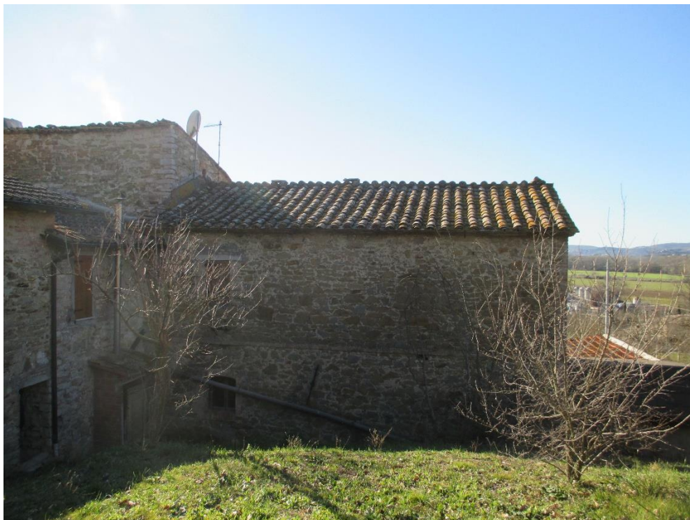
Foto n.6: Altro particolare del prospetto est del fabbricato e di parte della corte.