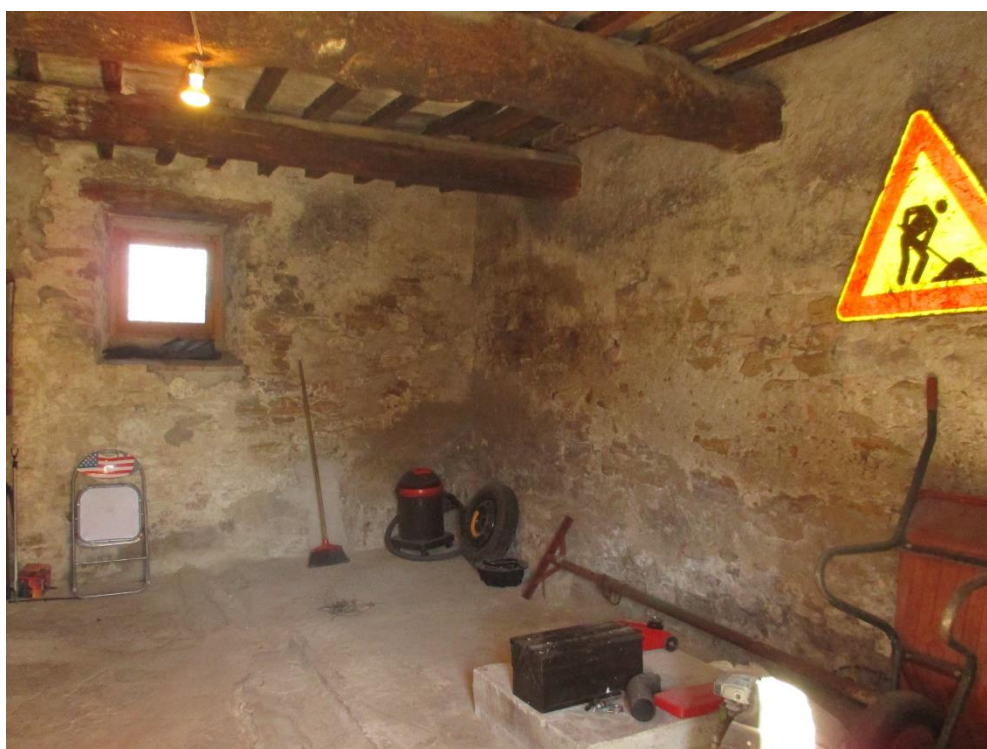
Foto n.14: Interno della cantina al piano terra con accesso dal prospetto sud.