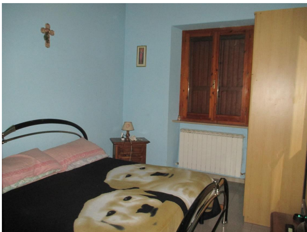
Foto n.22: Particolare di una delle due camere sul lato est del piano primo.