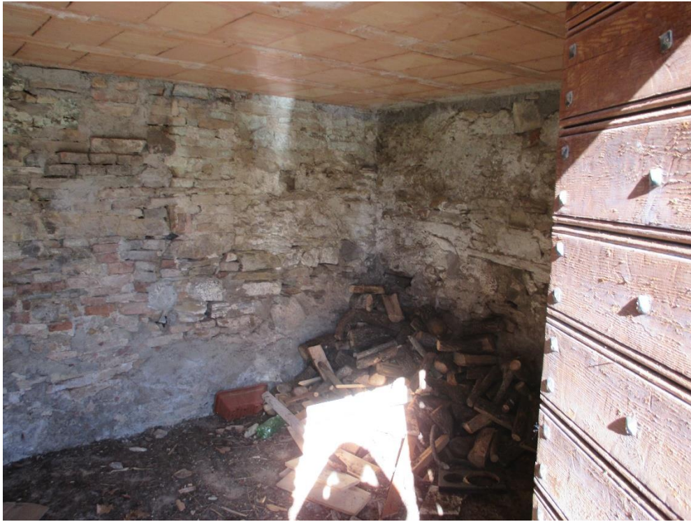
Foto n.15: Interno di altro fondo al piano terra con accesso dal prospetto sud.