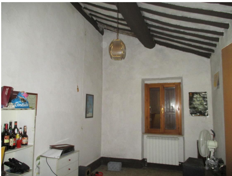
Foto n.24: Particolare di una delle due camere sul lato nord del piano primo.