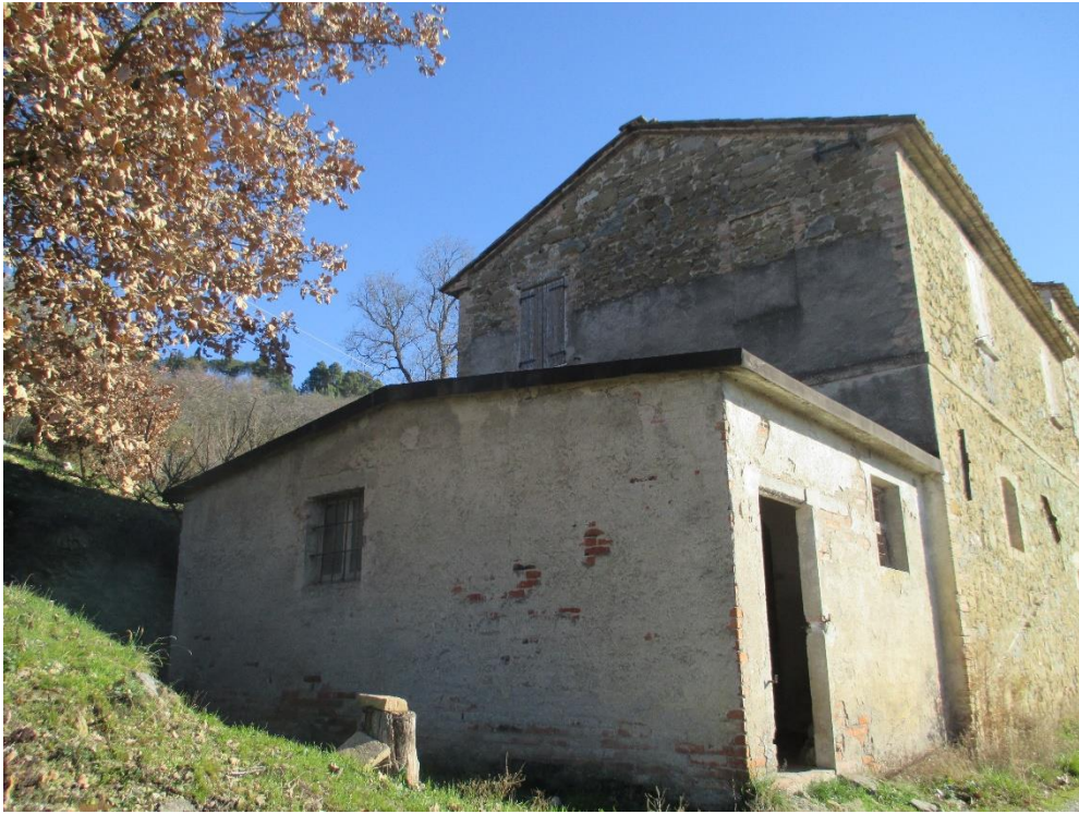
Foto n.7: Veduta del prospetto nord e di parte di quello ovest del fabbricato residenziale.