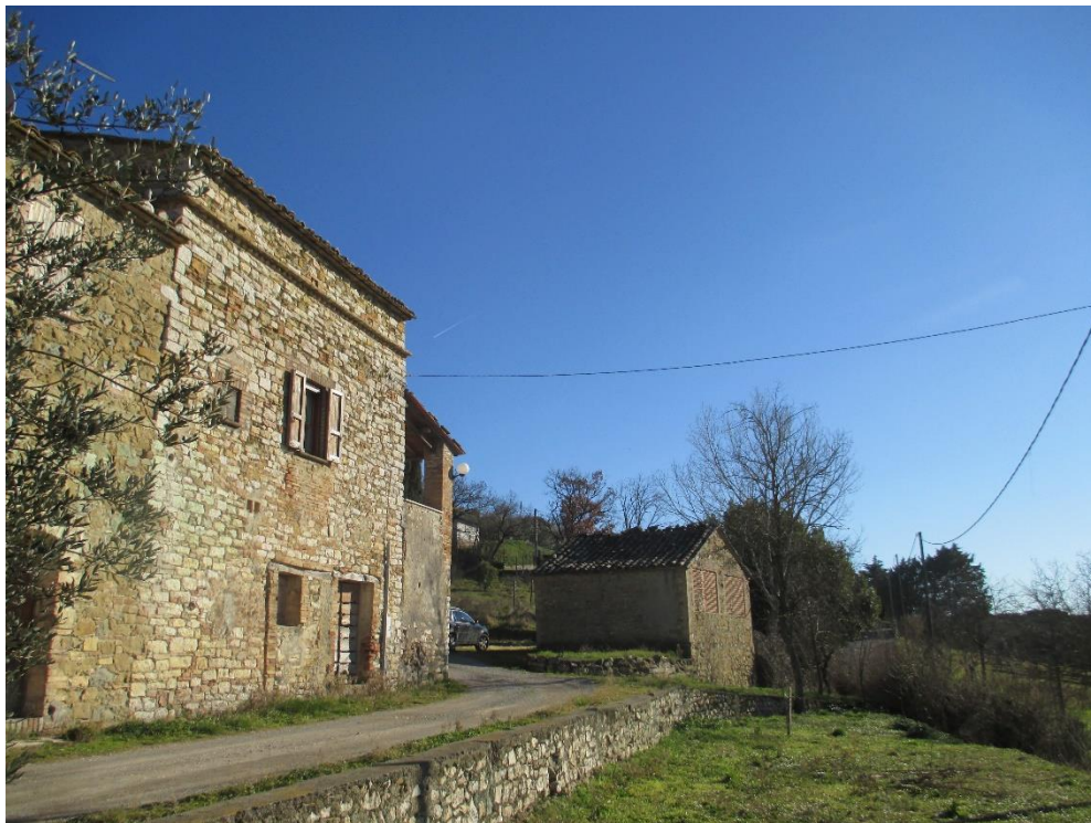
Foto n.1: Veduta, ripresa dalla strada di accesso, via Giacomo Prampolini, del compendio immobiliare dove sono visibili parte del prospetto ovest del fabbricato di civile abitazione da cielo a terra su tre livelli, dell'annesso adibito a rimessa (prospetti nord e ovest), della corte esclusiva e del terreno agricolo.