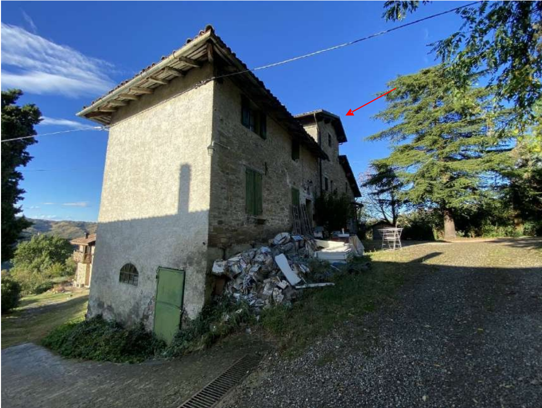
Vista di porzioni del piccolo borgo dove sorge l'unità immobiliare residenziale