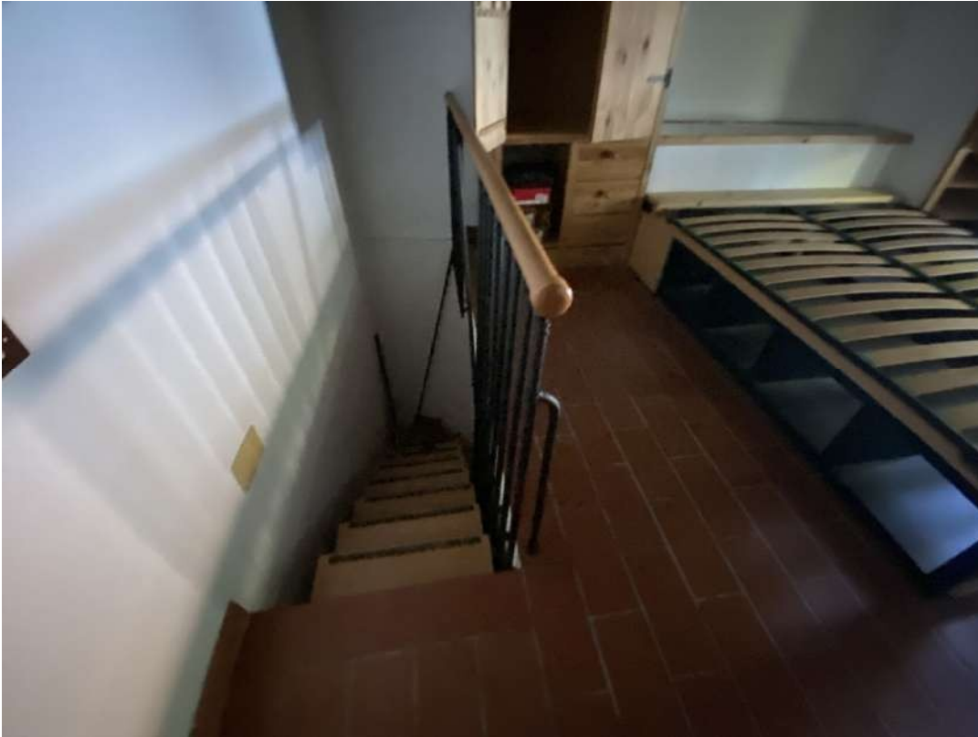
Vista della scala che arriva dal piano primo e si conclude al piano secondo nella camera del secondo piano sottotetto