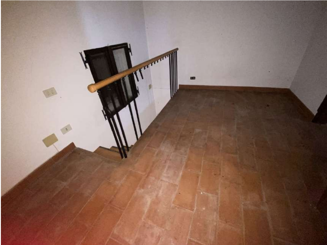
Vista della camera al piano primo e della scala che arriva dal soggiorno del piano terra