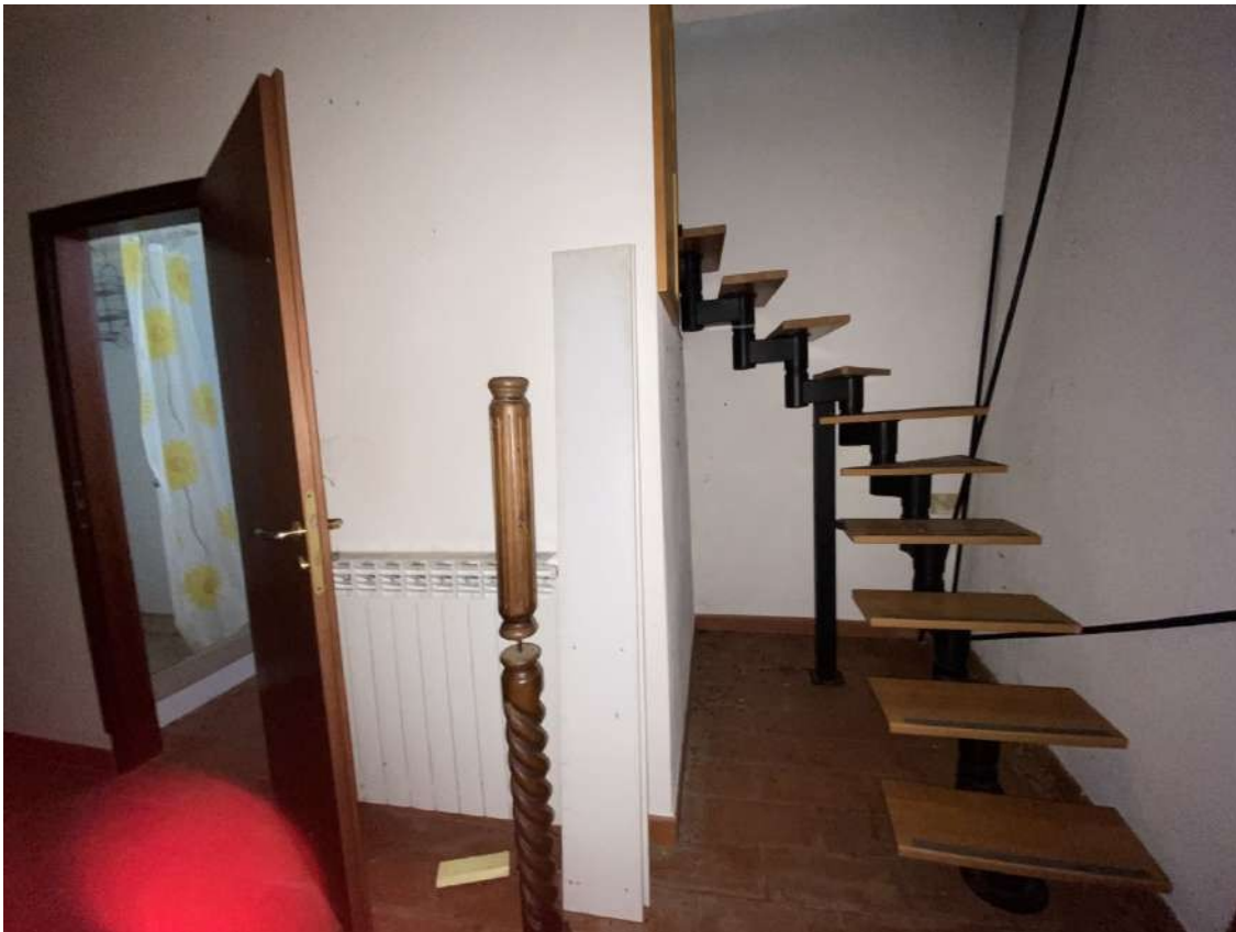
Vista di una porzione della camera al piano primo, dell'entrata del bagno e della scala che conduce alla camera da letto del secondo piano sottotetto