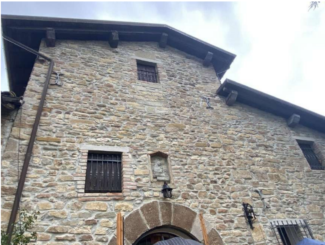
Vista del particolare della facciata principale con bassorilievo di natività sopra l'entrata