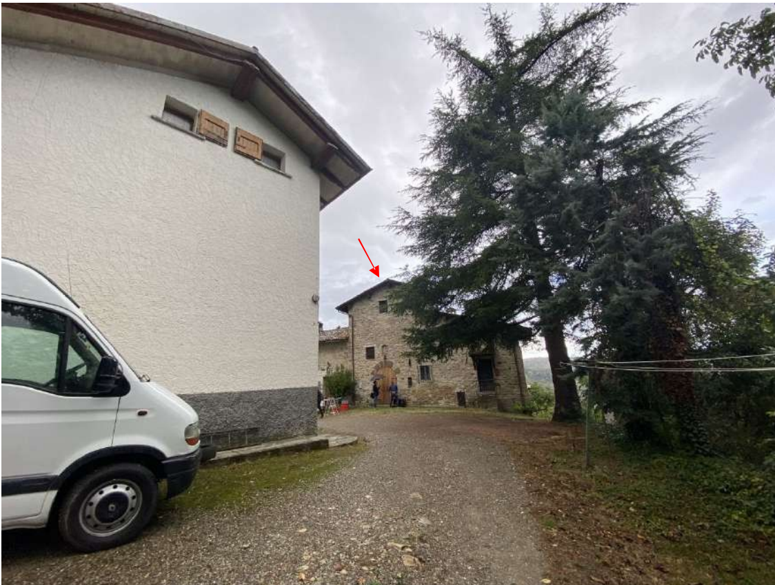
Vista dell'accesso al piccolo borgo dove sorge l'unità immobiliare residenziale