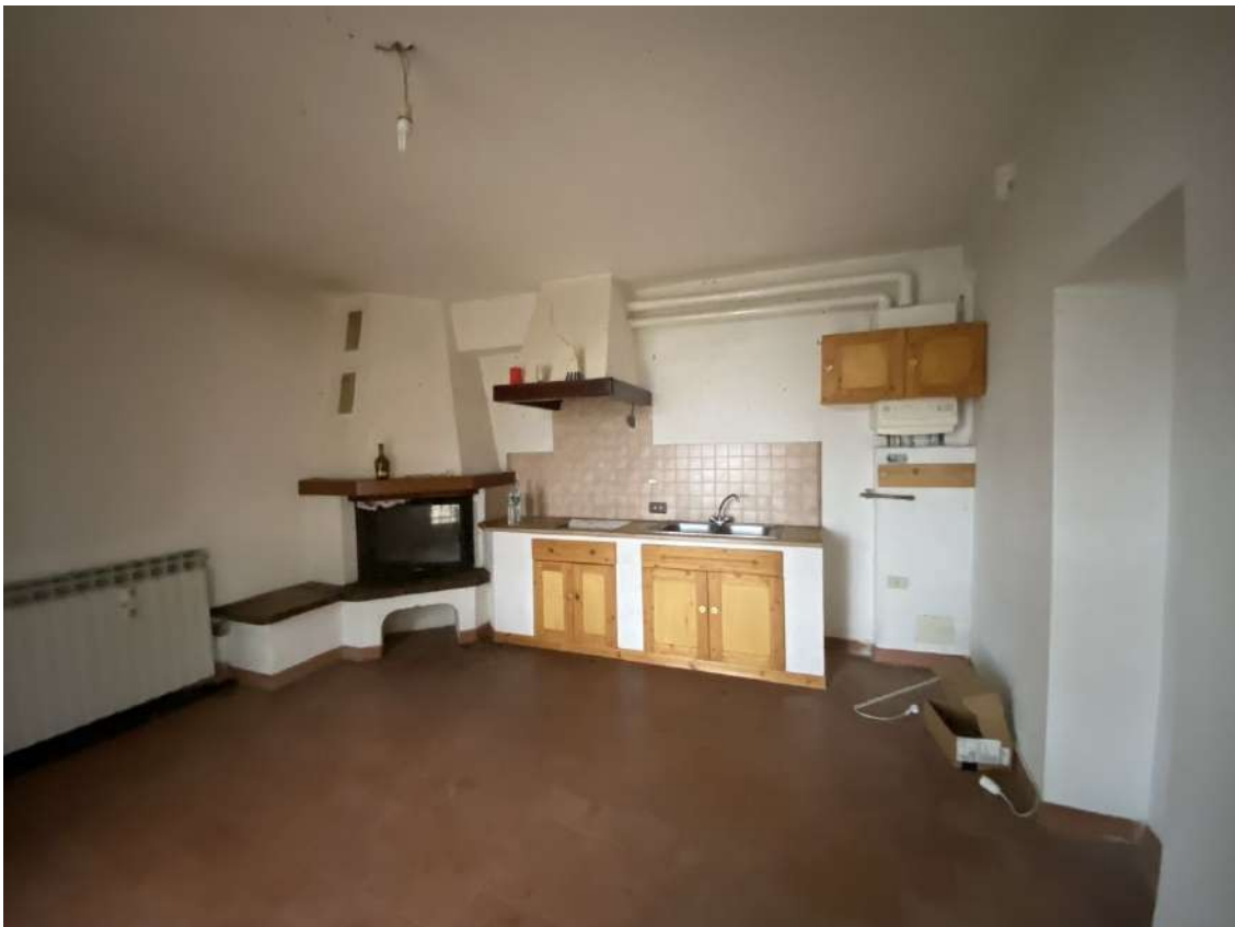
Altra vista nel soggiorno con angolo cottura dell'unità immobiliare al piano terra