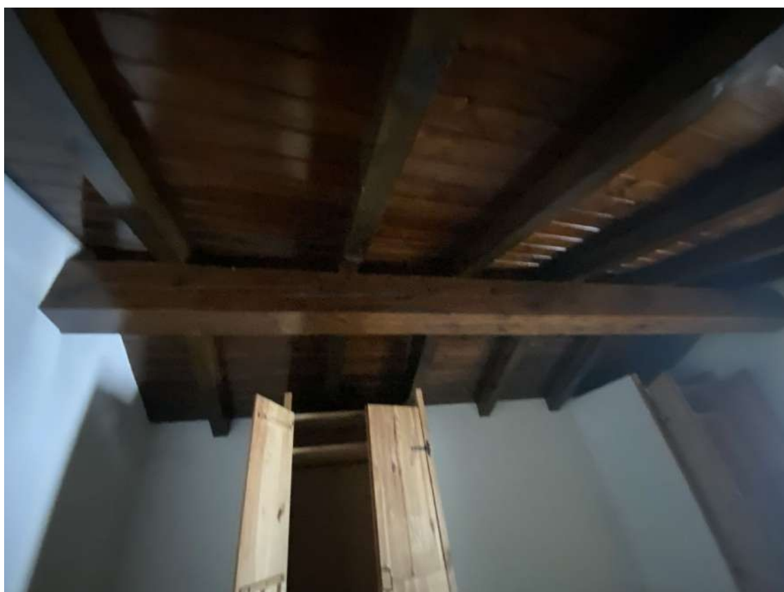
Altra vista della camera del piano secondo a livello del sottotetto con travi in vista