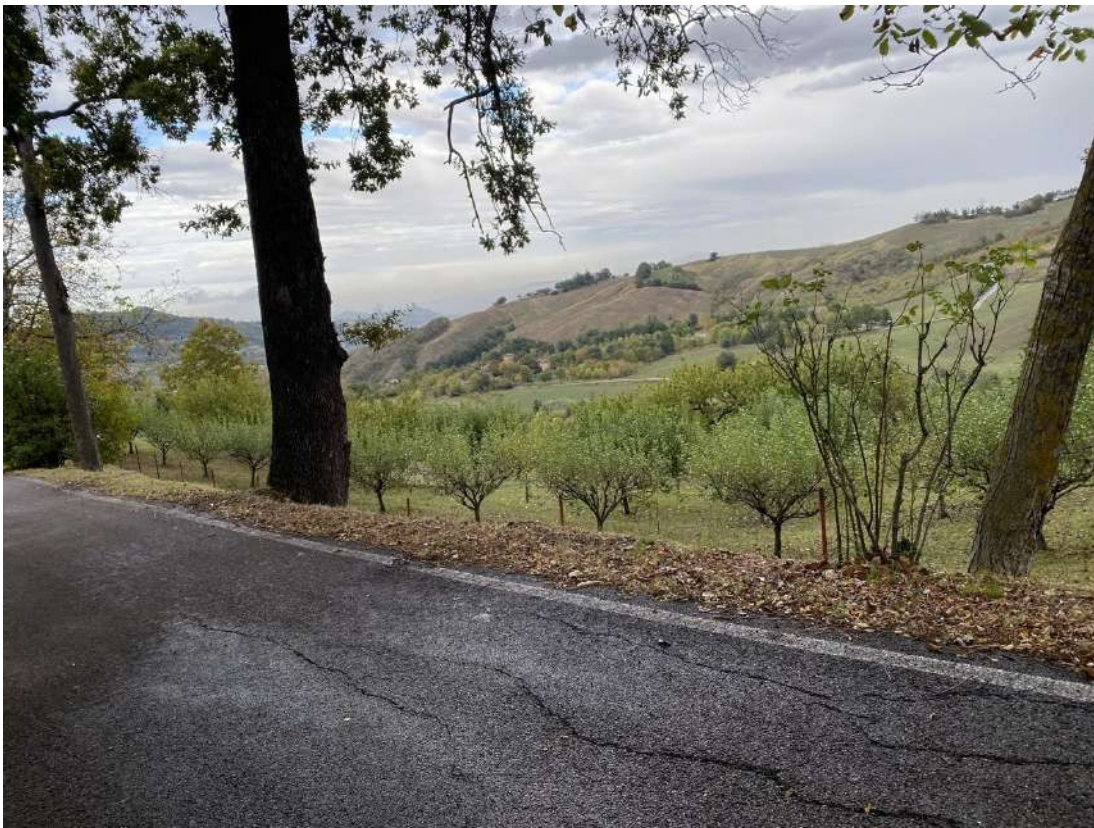
Vista dalla strada comunale all'altezza della strada sterrata che conduce al borgo