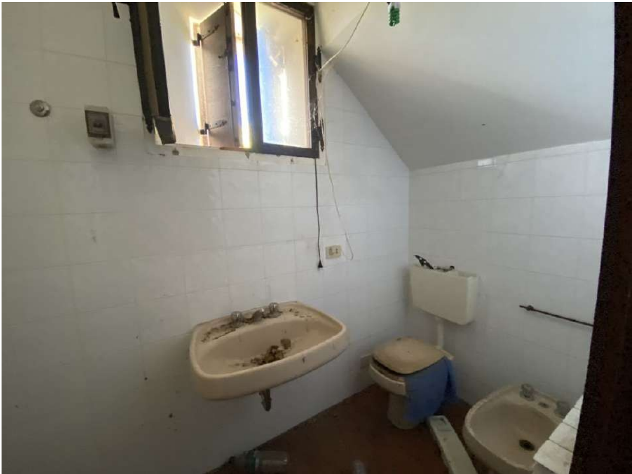
Viste dell'unico bagno presente nell'unità immobiliare ubicato al piano primo