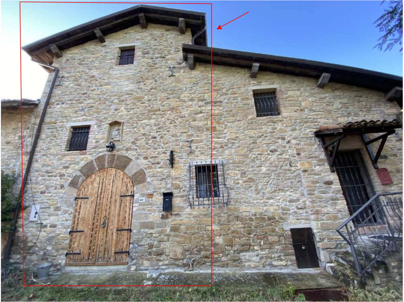
Vista della facciata principale e accesso dell'unità immobiliare a torre