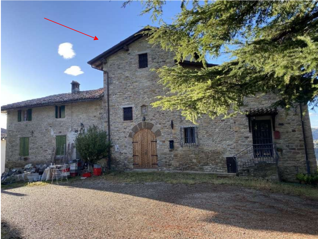
Vista della facciata principale del fabbricato dove sorge l'unità immobiliare a torre