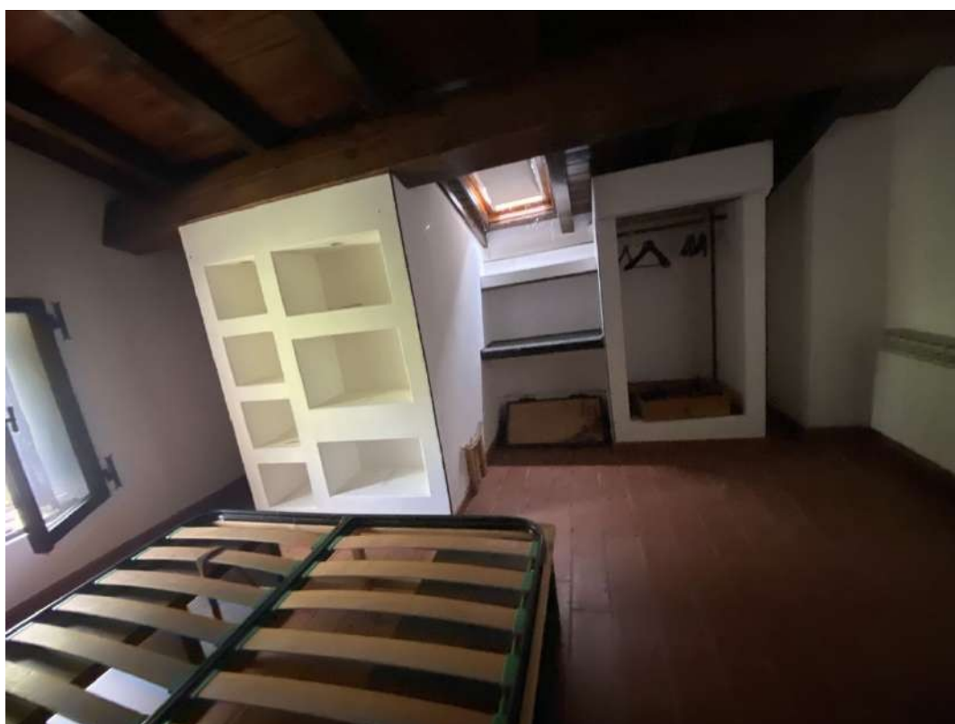
Altra vista della camera del piano secondo a livello del sottotetto e degli arredi fissi realizzati in cartongesso