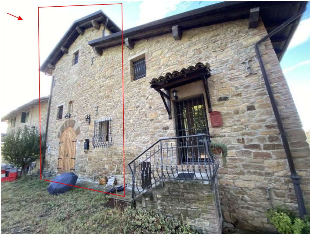
Altra vista della facciata principale e accesso dell'unità immobiliare a torre