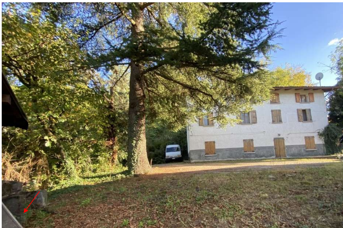
Vista del contatore del gas rispetto al cortile del borgo