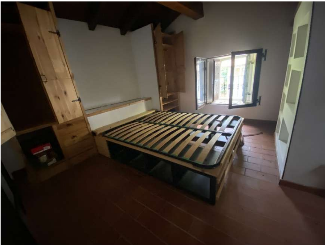
Vista della camera del piano secondo a livello del sottotetto