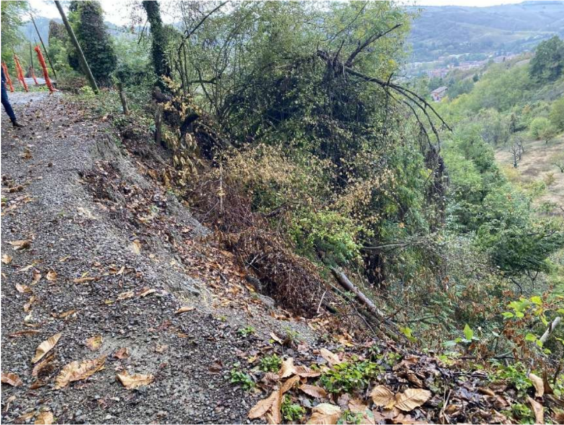
Vista della strada sterrata che conduce al borgo. Una porzione del percorso, al momento della redazione della perizia, è in un tratto crollata per le ingenti piogge della primavera 2023