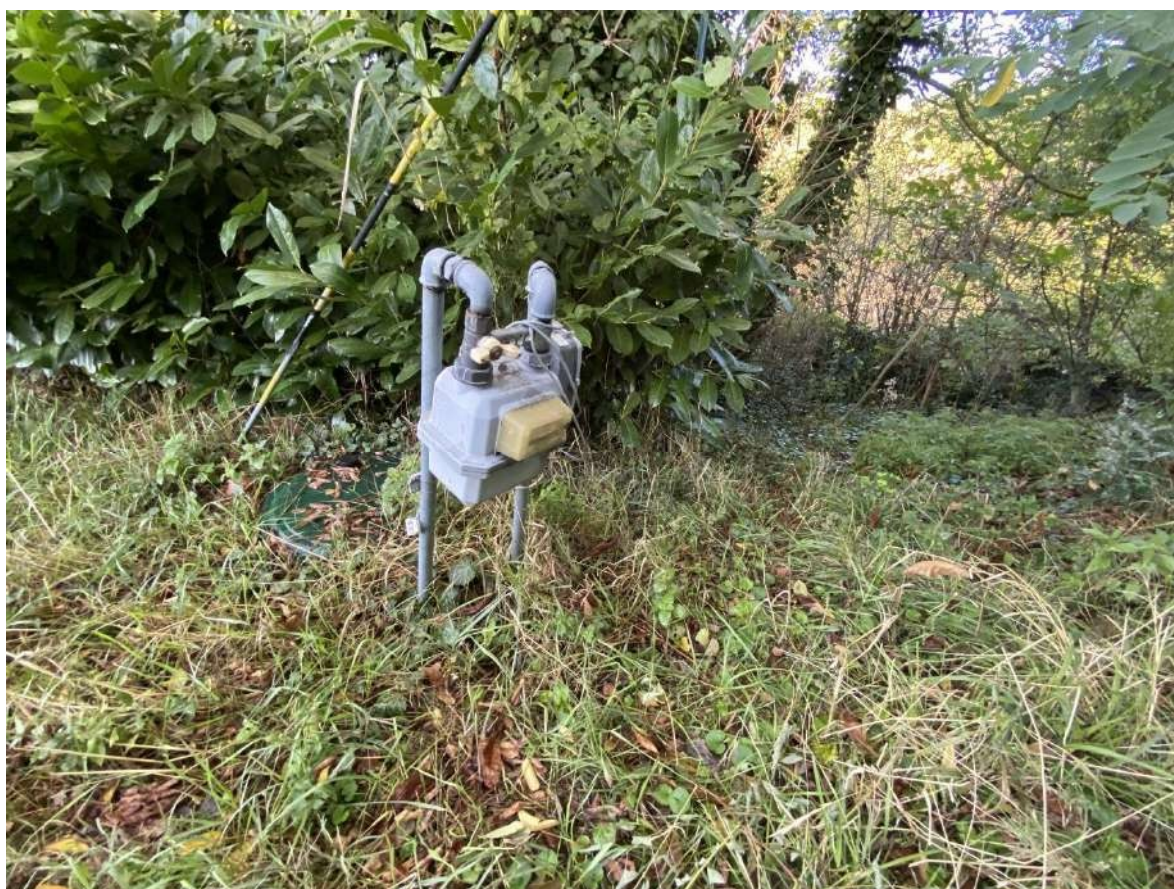
Vista del contatore del gas del bombolone interrato ubicato sul lato destro, guardando la facciata, alla fine del fabbricato