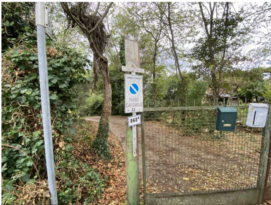
Vista della strada sterrata che conduce al borgo dalla strada comunale