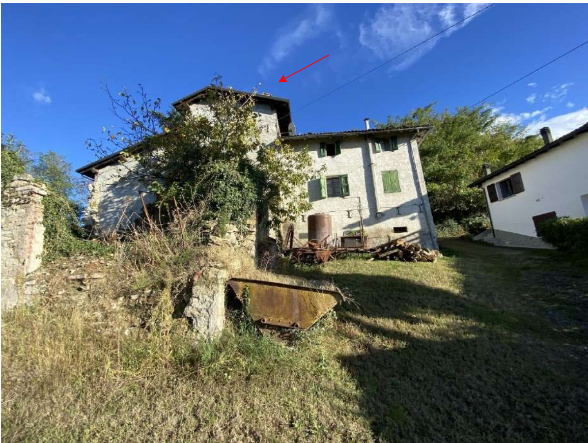
Vista del retro del borgo dove sorge l'unità immobiliare residenziale