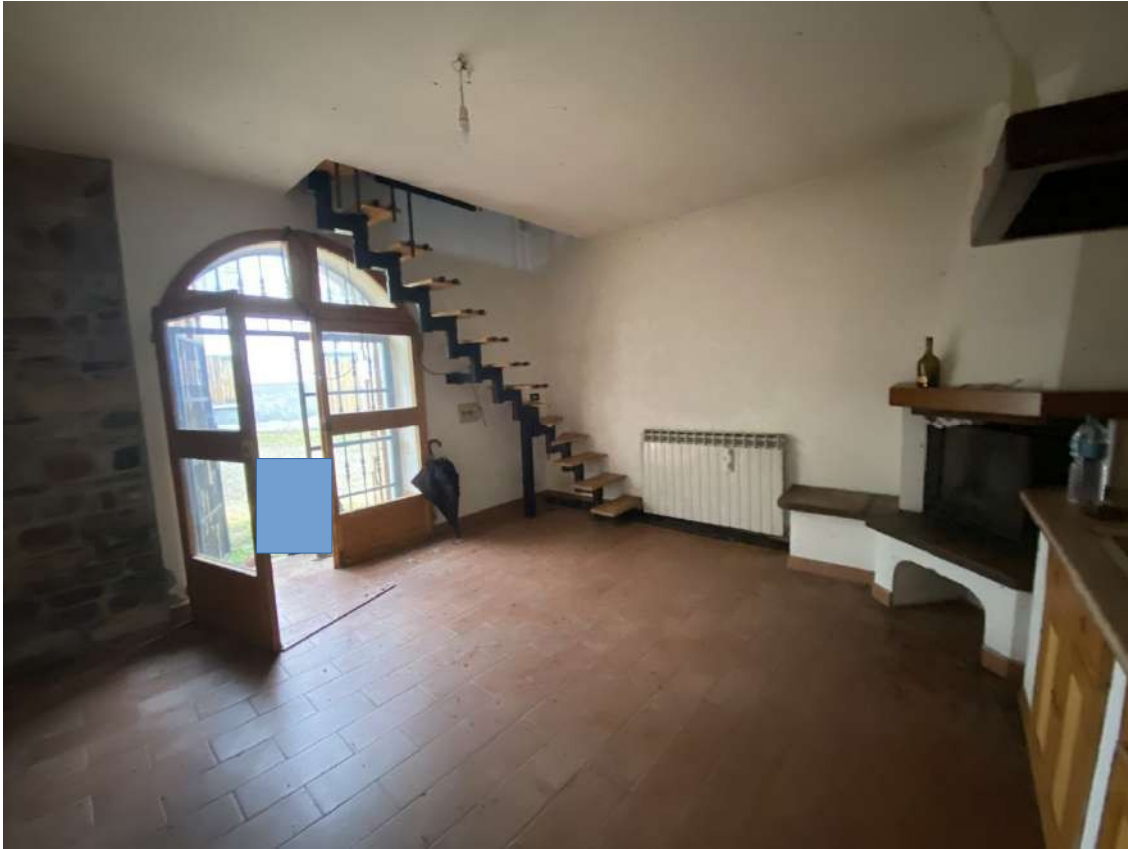
Vista dell'entrata nel soggiorno con angolo cottura dell'unità immobiliare al piano terra e vista della scala che conduce al piano primo