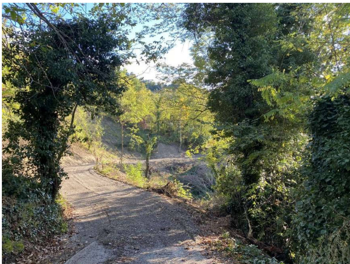
Vista della strada sterrata che conduce al borgo