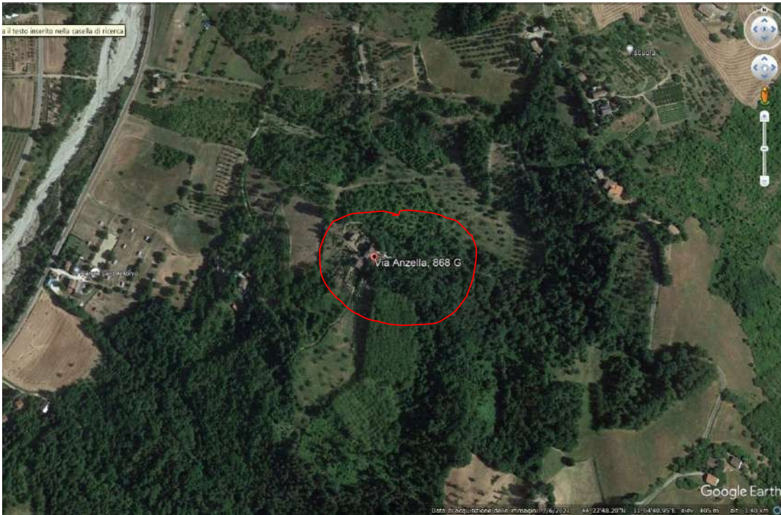
Vista aerea della zona

ES RG N.30/23 - LOTTO UNICO - UNITA' IMMOBILIARE RESIDENZIALE CIELO TERRA A TORRE (PIANO TERRA - PIANO PRIMO - PIANO SECONDO) NEL COMUNE DI VALSAMOGGIA (BO), FRAZIONE DI SAVIGNO, VIA MONTEVECCHIO, N.868/A – (VIA AZZELLA N.868/A)