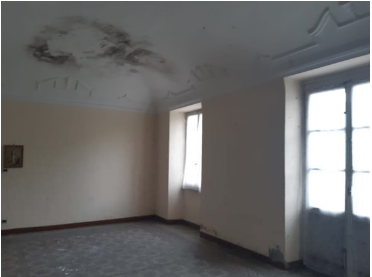
Vista interna locale salone in piano primo