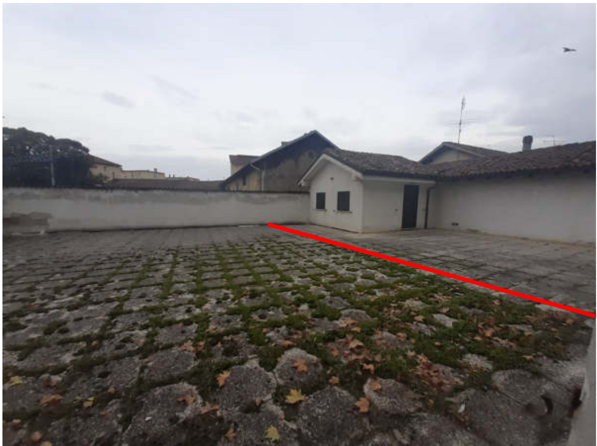
Vista terrazzo / lastrico solare pertinenziale in piano primo