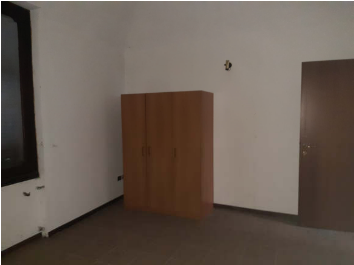
Vista tipo rifinitura monocale in piano primo