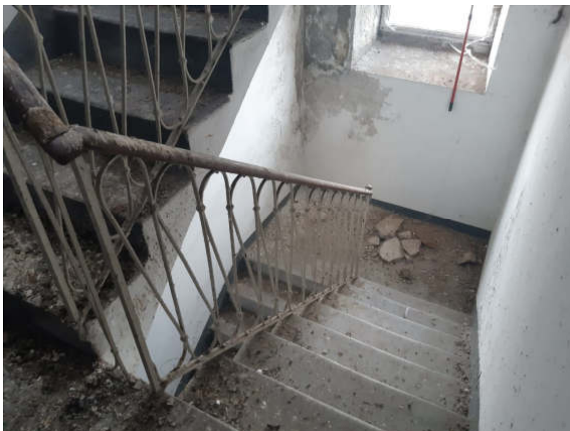
Vista vano scala interno di acceso da quota piano terra a quota piano primo