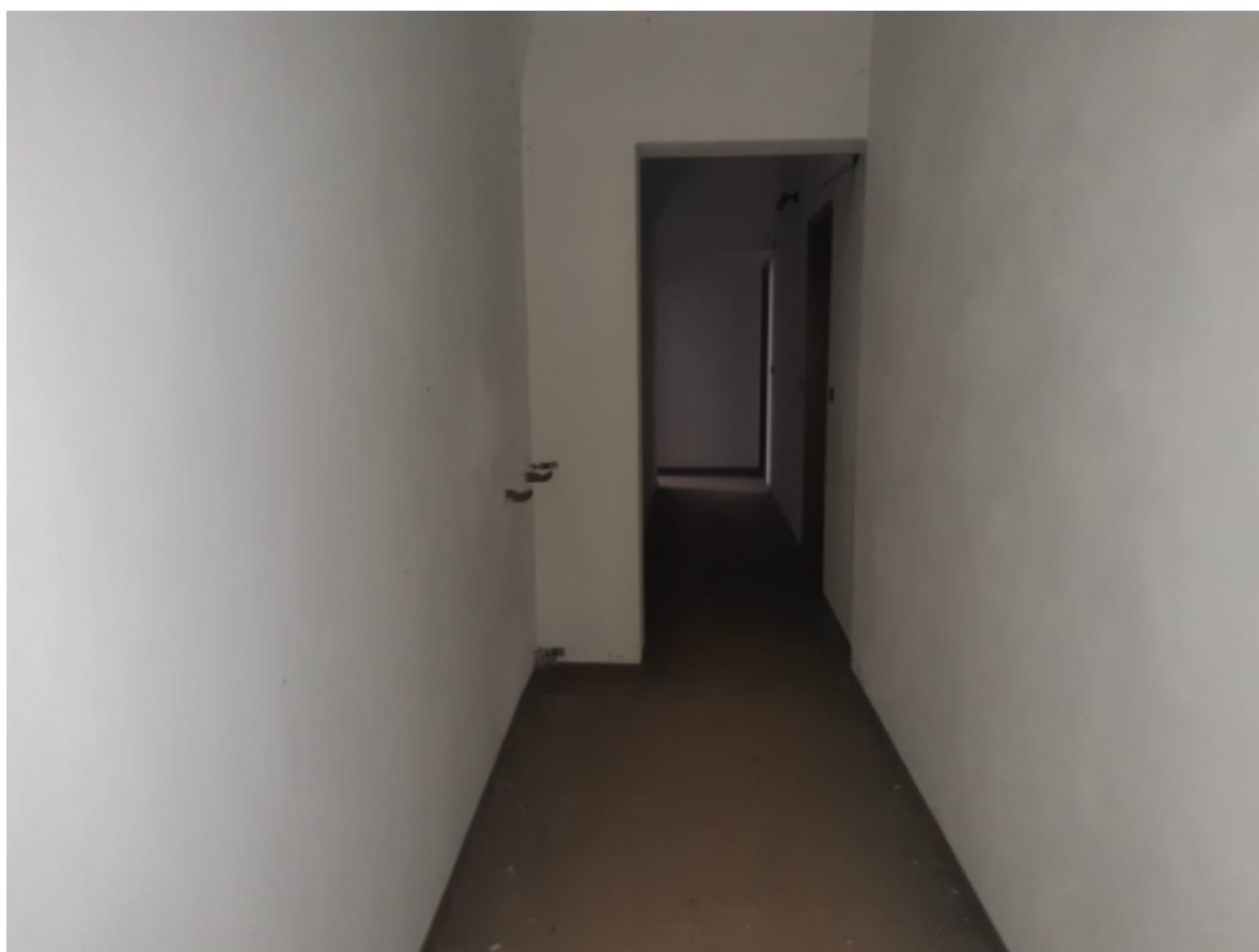
Vista corridoio distributore comune in piano primo