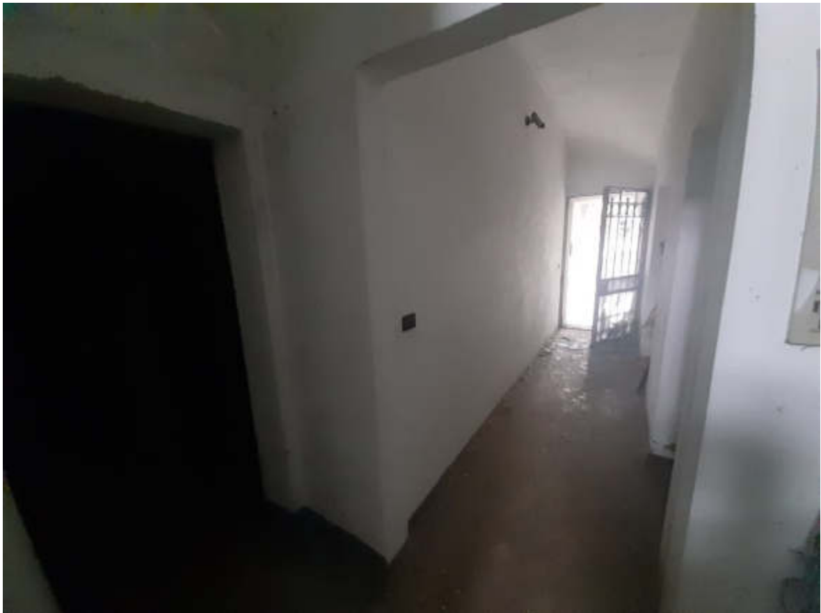
Vista dal sedime stradale pubblico della Via Mazzini del portoncino pedonale ed androne vano scala in piano terra dal quale viene praticato l'accesso ai locali in piano primo