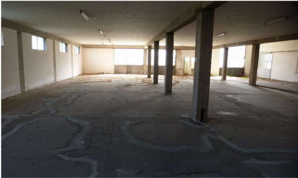
locale ad uso deposito - corpo principale