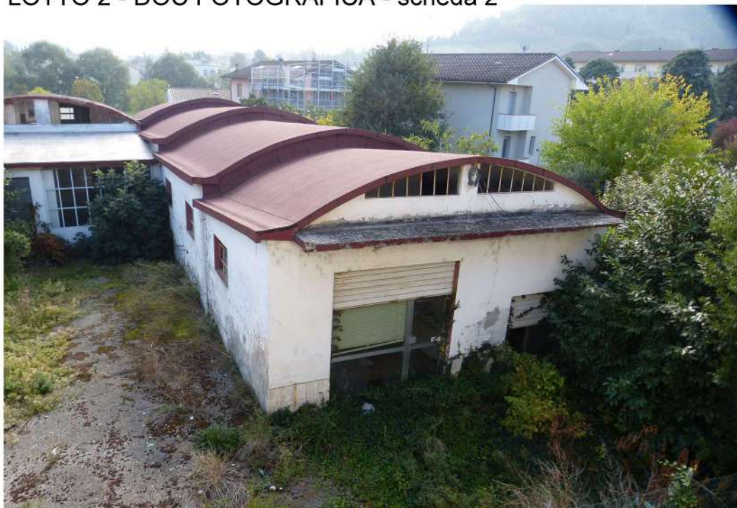
vista lato est, corpo capannone adibito a sala mostra