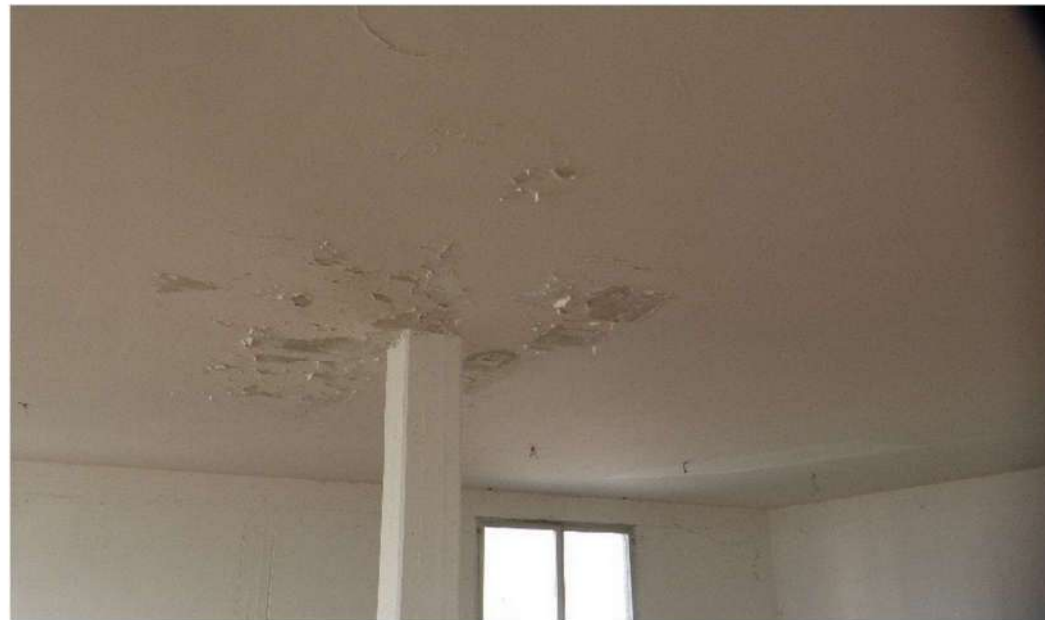
traccia di infiltrazione acqua piovana da copertura