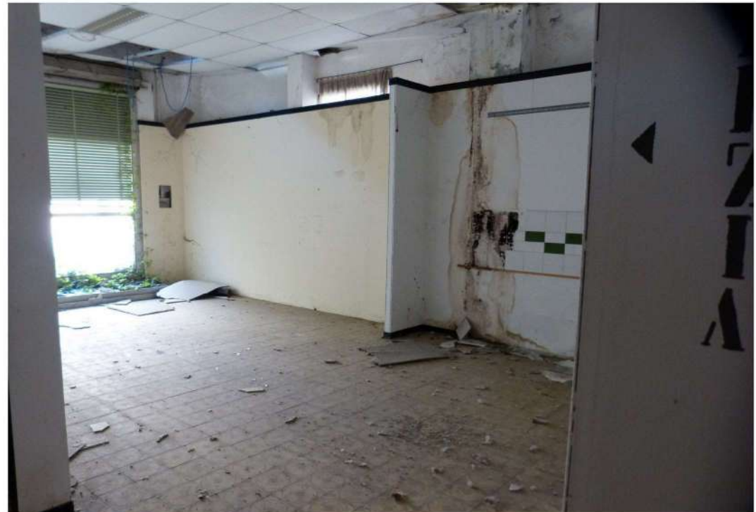
vista locali espositivi