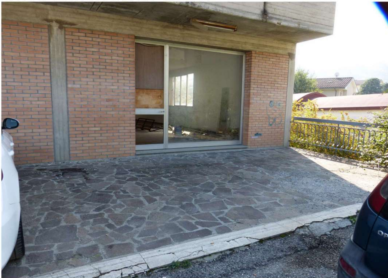
ingresso area espositiva - piano terra