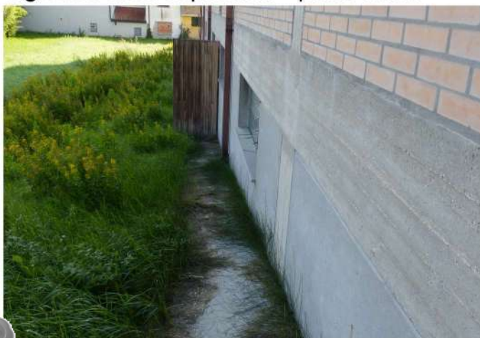
vista parte basamentale