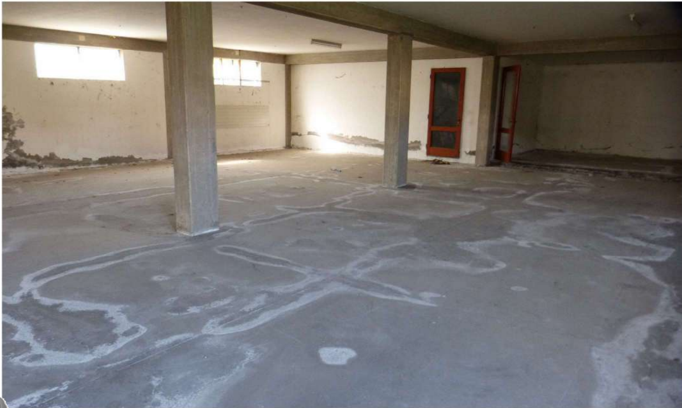
particolare risalta capillare dell'umidità - degrado pavimentazione e parti basamentali