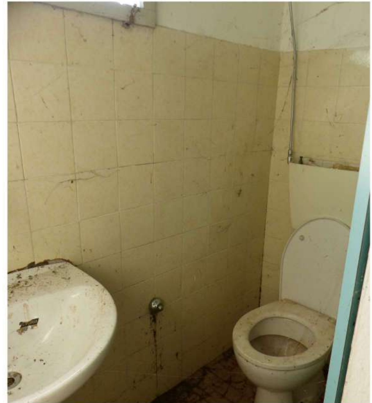
bagno-wc - corpo principale