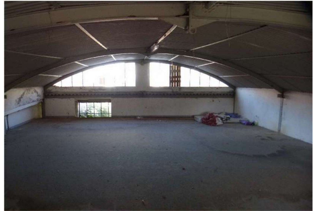
locale deposito con soppalco