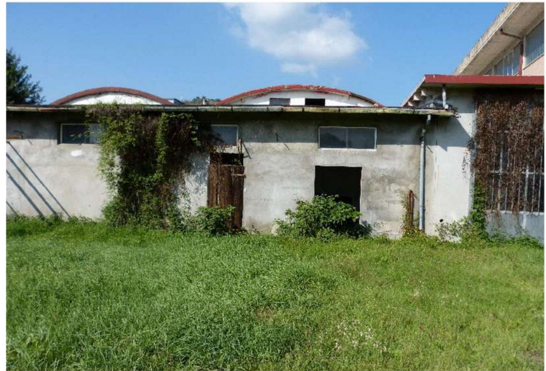
vista esterna lato sud ovest - locale "laboratorio"