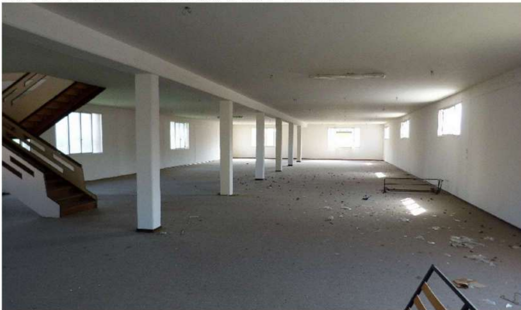
locale interno piano terra -autorizzato come sala espositiva