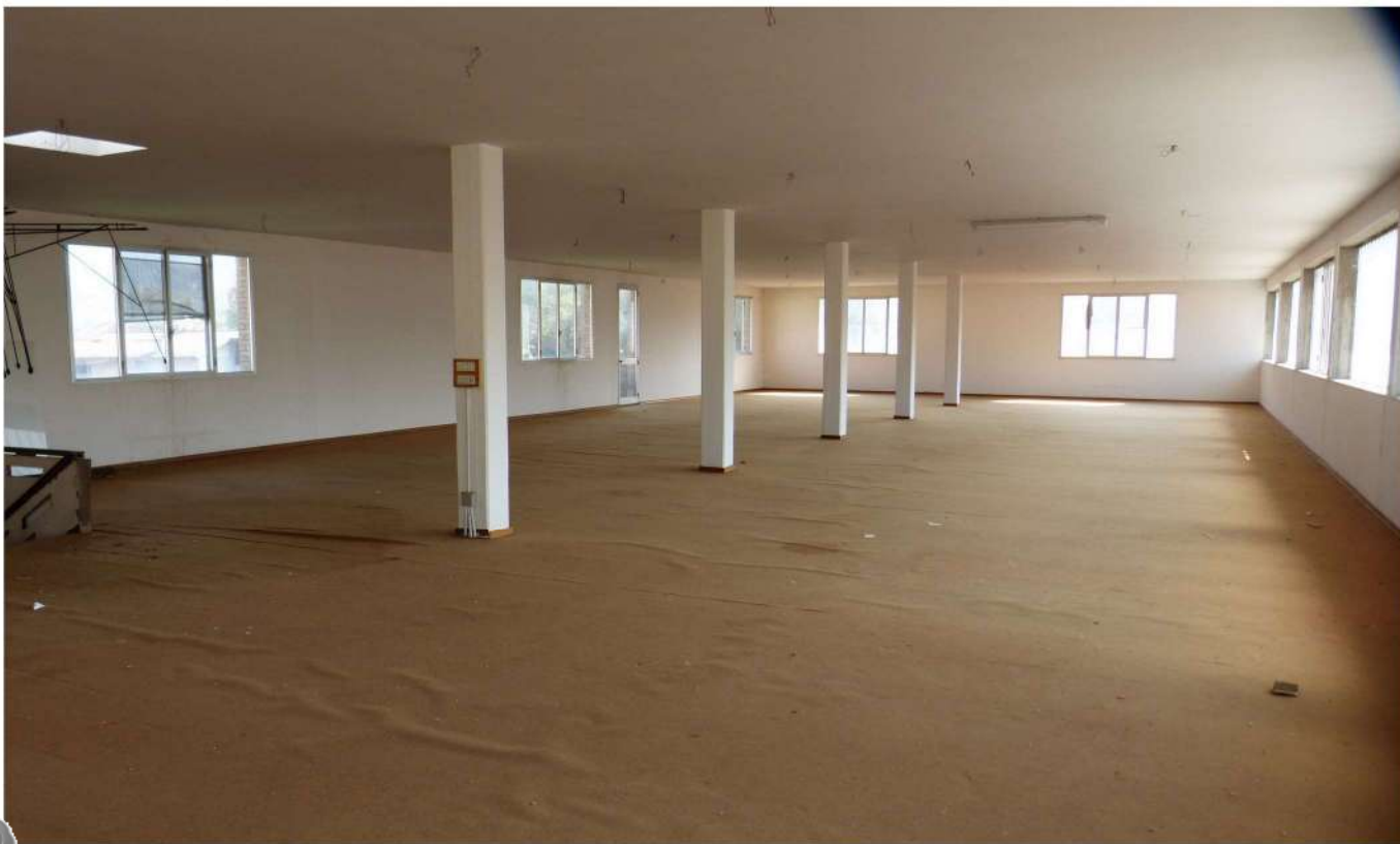
locale interno piano primo autorizzato come laboratorio