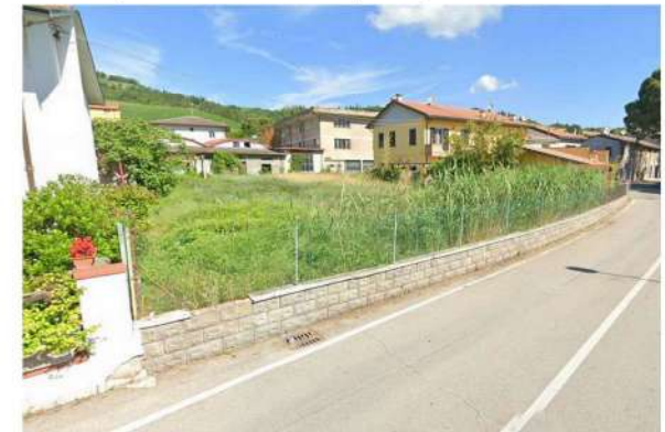
lotto visto da via dei mulini