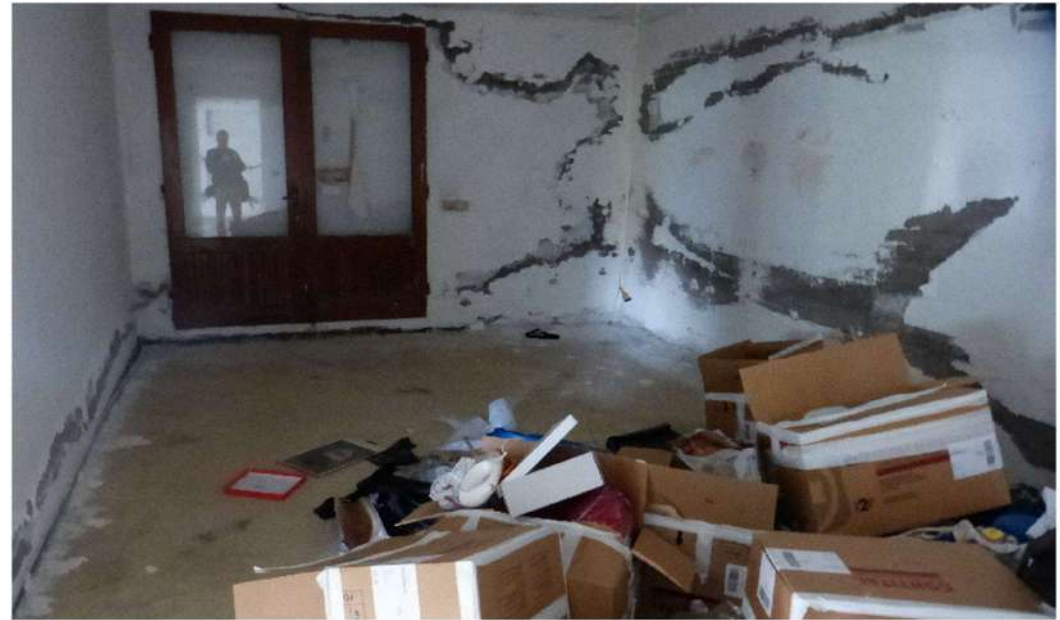
ufficio - corpo principale