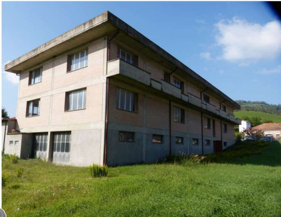
vista compressiva del fabbricato principale