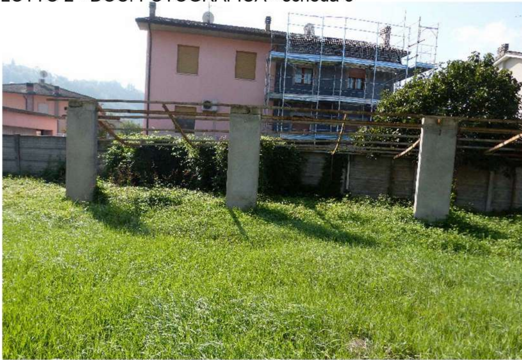
vista esterna residui di edificio autorizzato come "deposito" 4