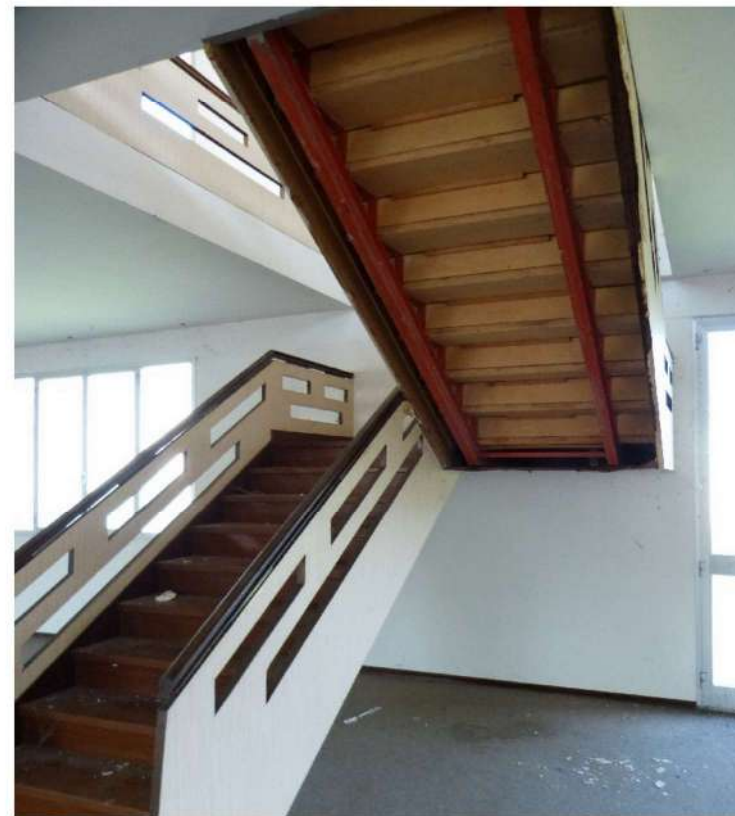
scala di collegamento