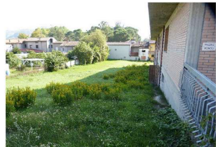
rampa di accesso