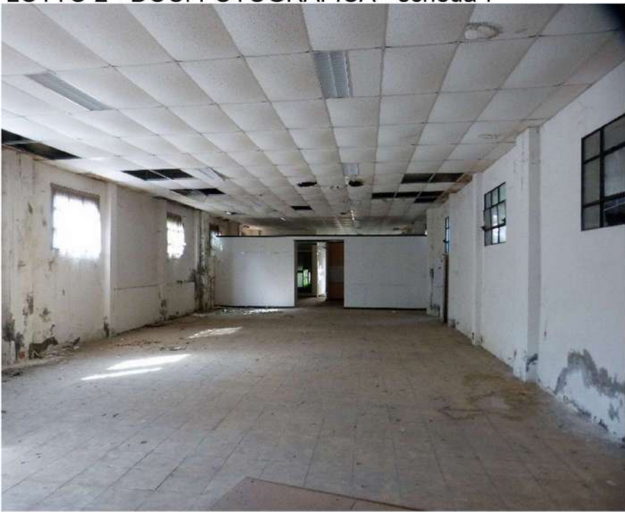
locali autorizzati come "Spazio Espositivo"