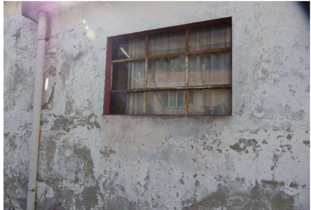
particolare parete esterna e infisso