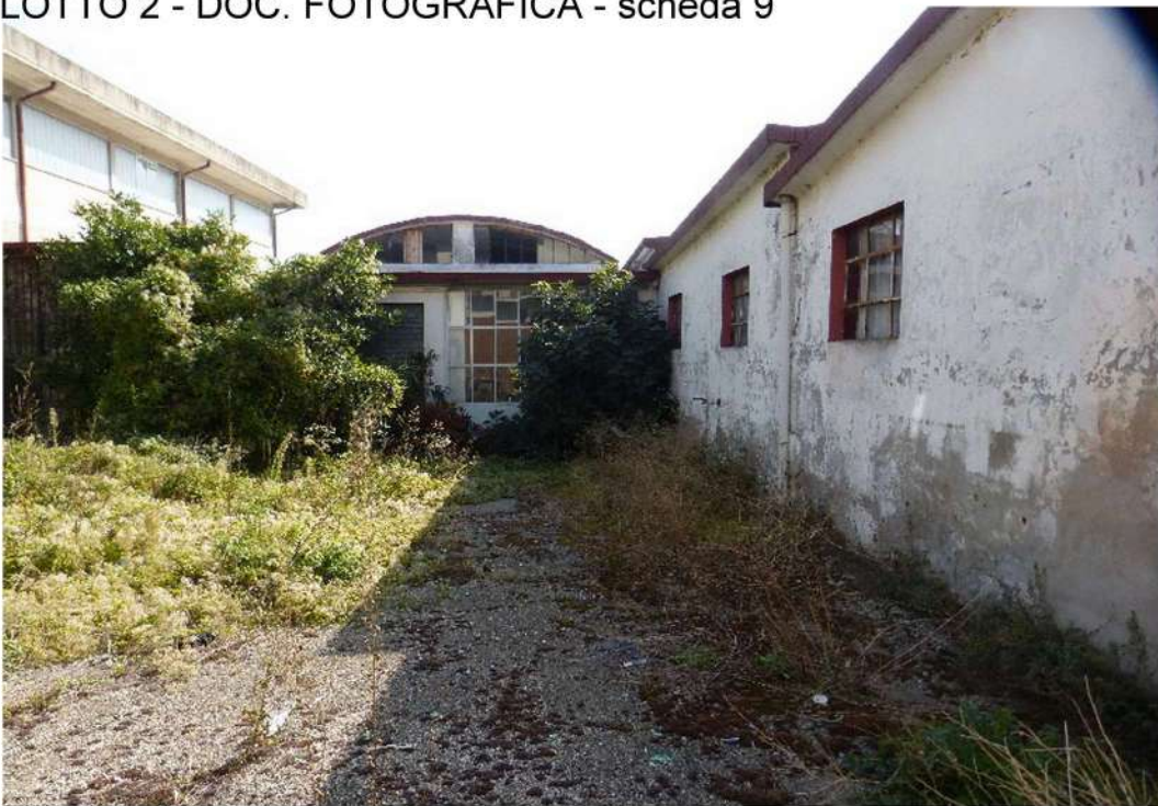
vista esterna corpo di fabbrica, deposito