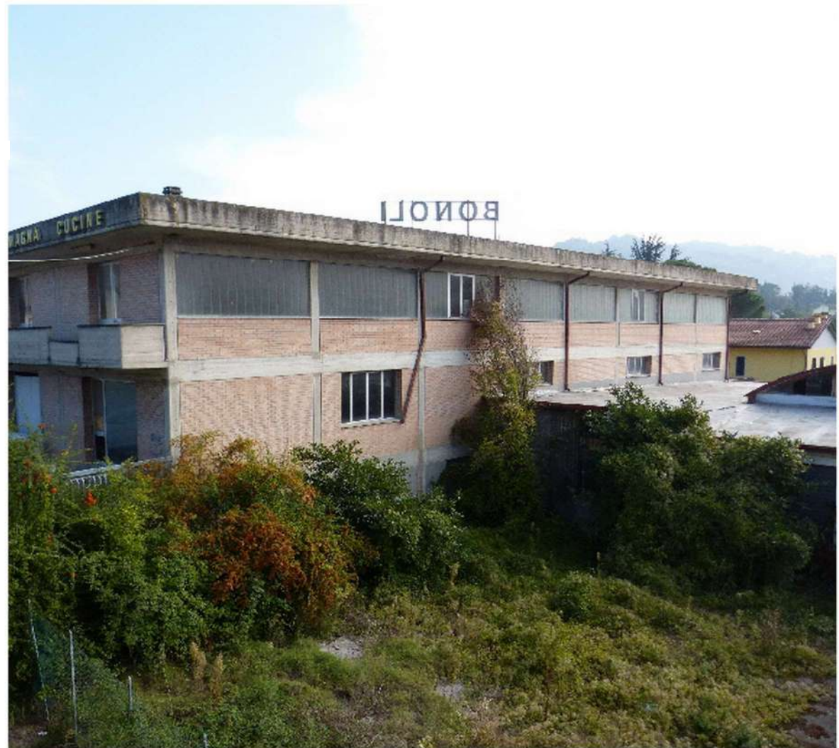
vista fianco sud fabbricato principale e corpo di fabbrica, deposito