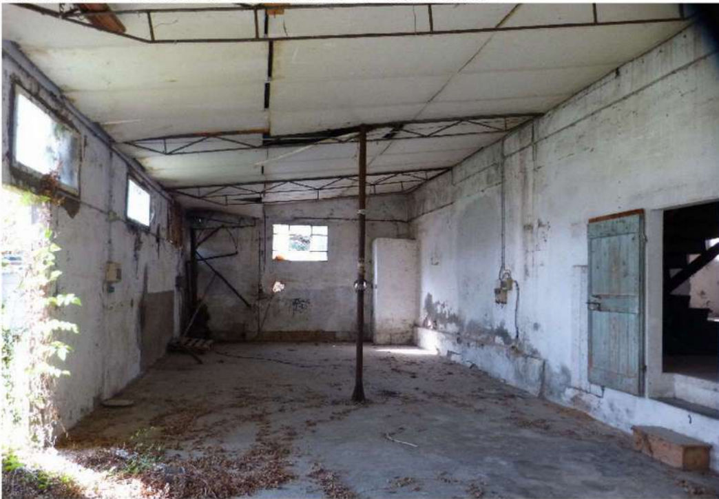
locale autorizzato come "laboratorio"