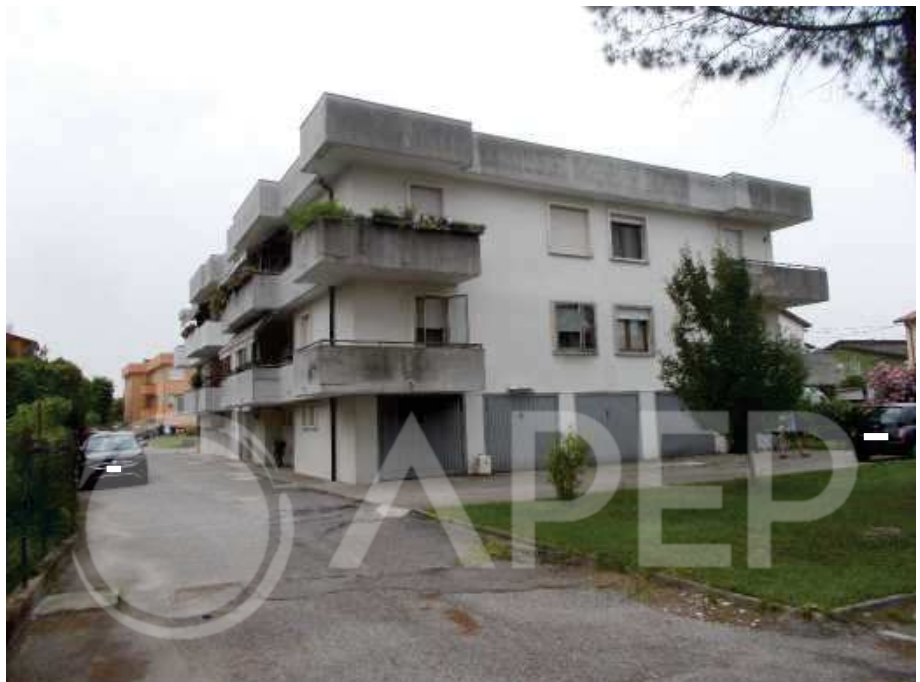
Foto 2- Vista da nord est - Fronte nord