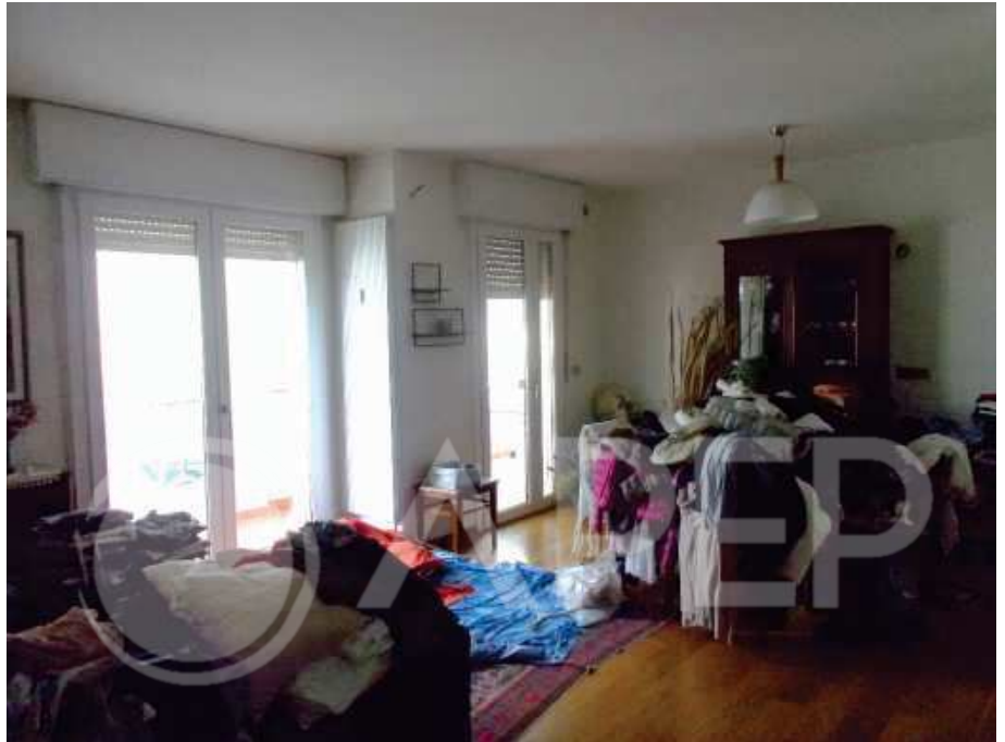
Foto 7- P. 1. Soggiorno con sullo sfondo vano cucina