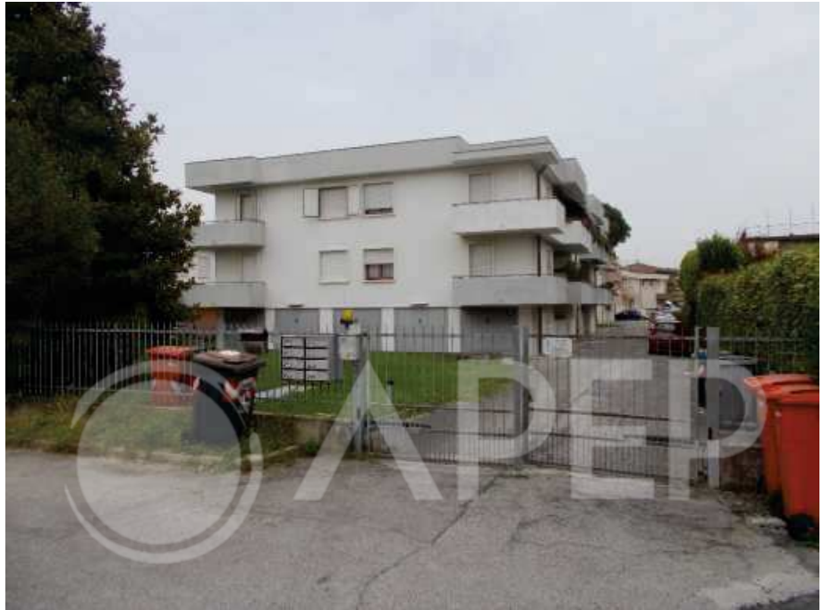
Foto 1- Accesso carrabile da via Leopardi - Fronte sud