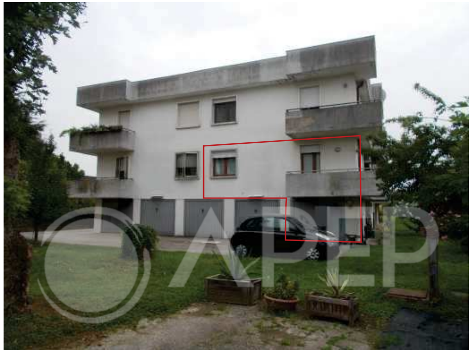
Foto 3- Vista da nord ovest- Fronte nord