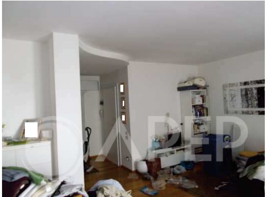
Foto 5- P. 1. Ingresso e soggiorno