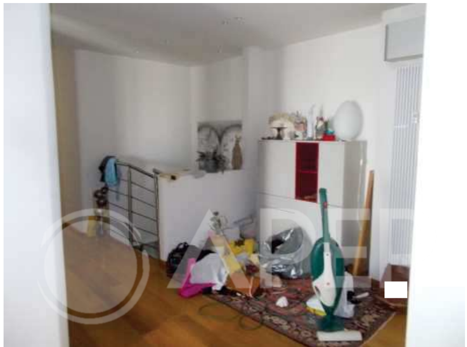
Foto 6- P. 1. Corridoio con scala interna