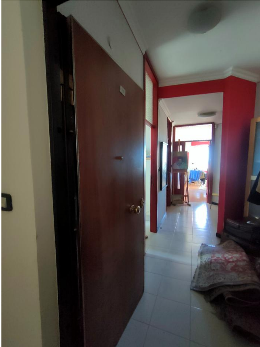
Ingresso Abitazione (Int. 10 – Piano 7°)