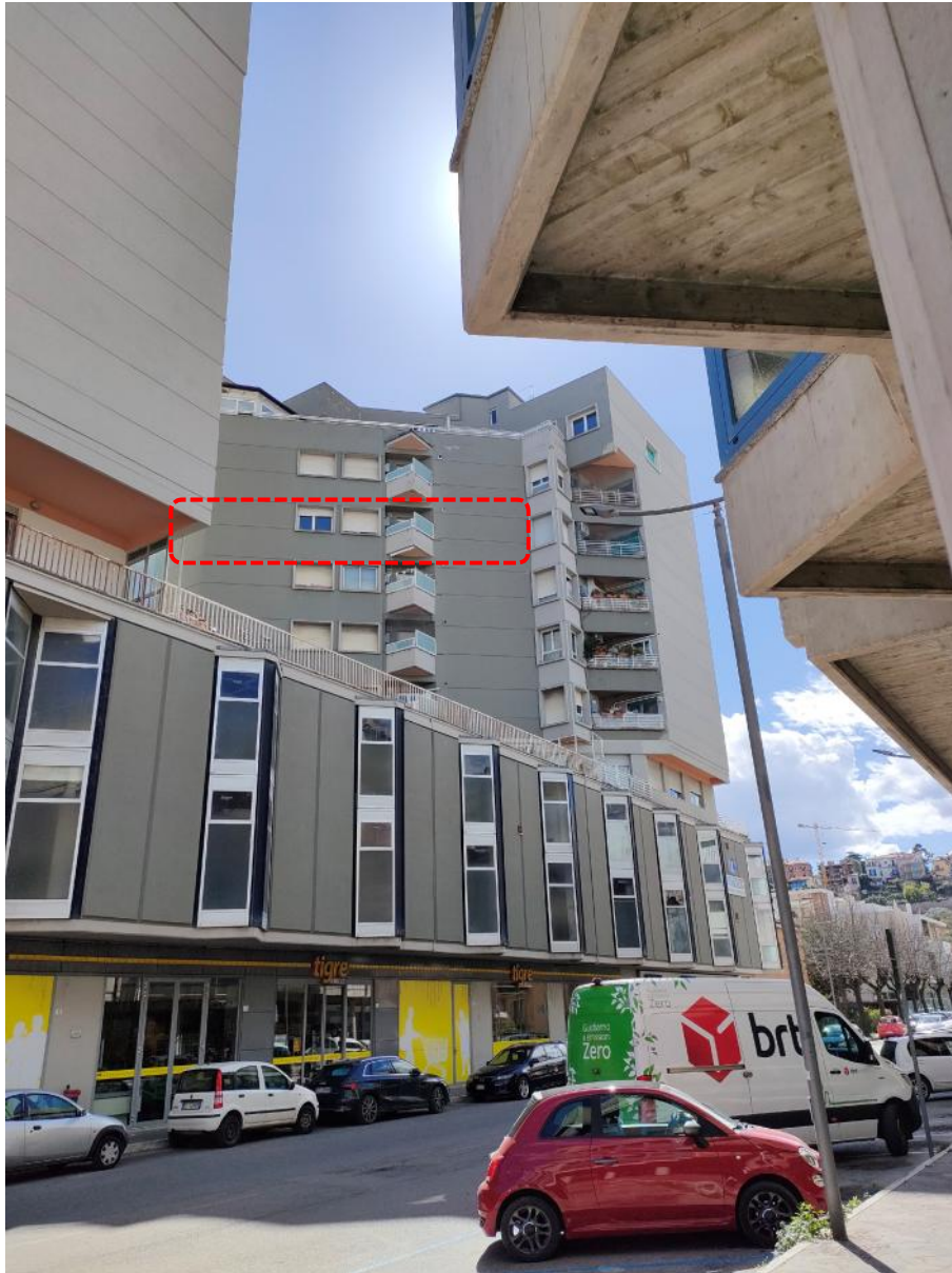
Vista Esterna Edificio Torre Ovest – Accesso da Via Matteotti n. 23