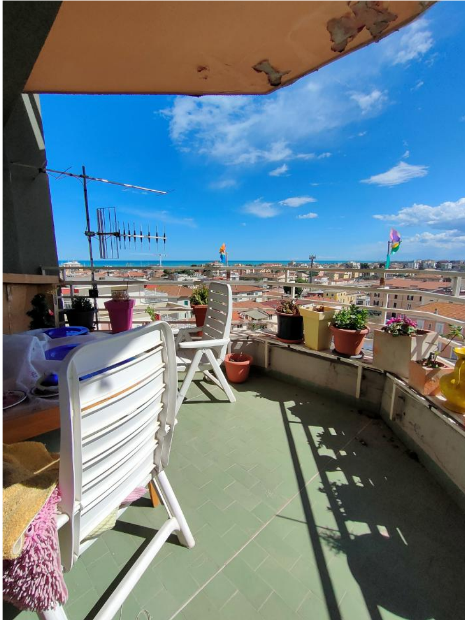
Balcone Soggiorno Vista Mare