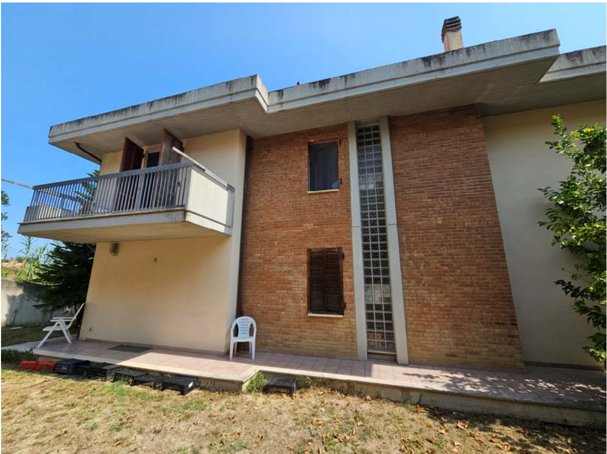
FOTO 4 - Vista esterna