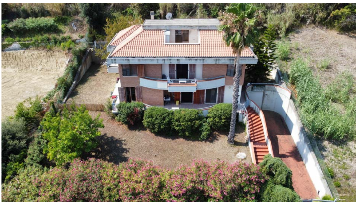
FOTO 2 - Vista esterna