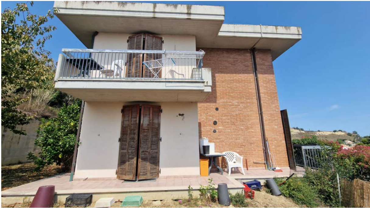
FOTO 3 - Vista esterna