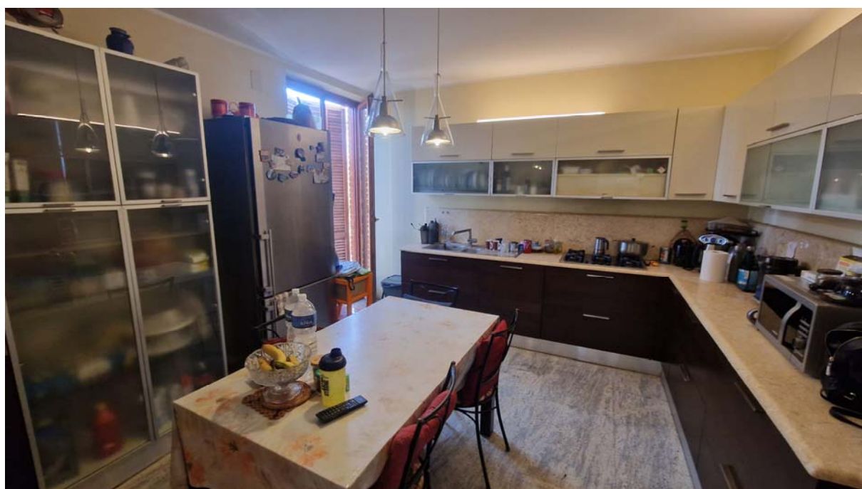
FOTO 6 - Cucina