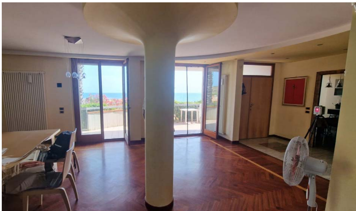
FOTO 5 - Soggiorno