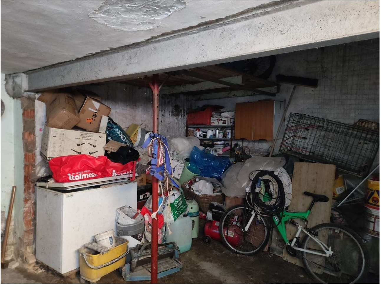
Autorimessa da sanare per abbattimento muro divisorio