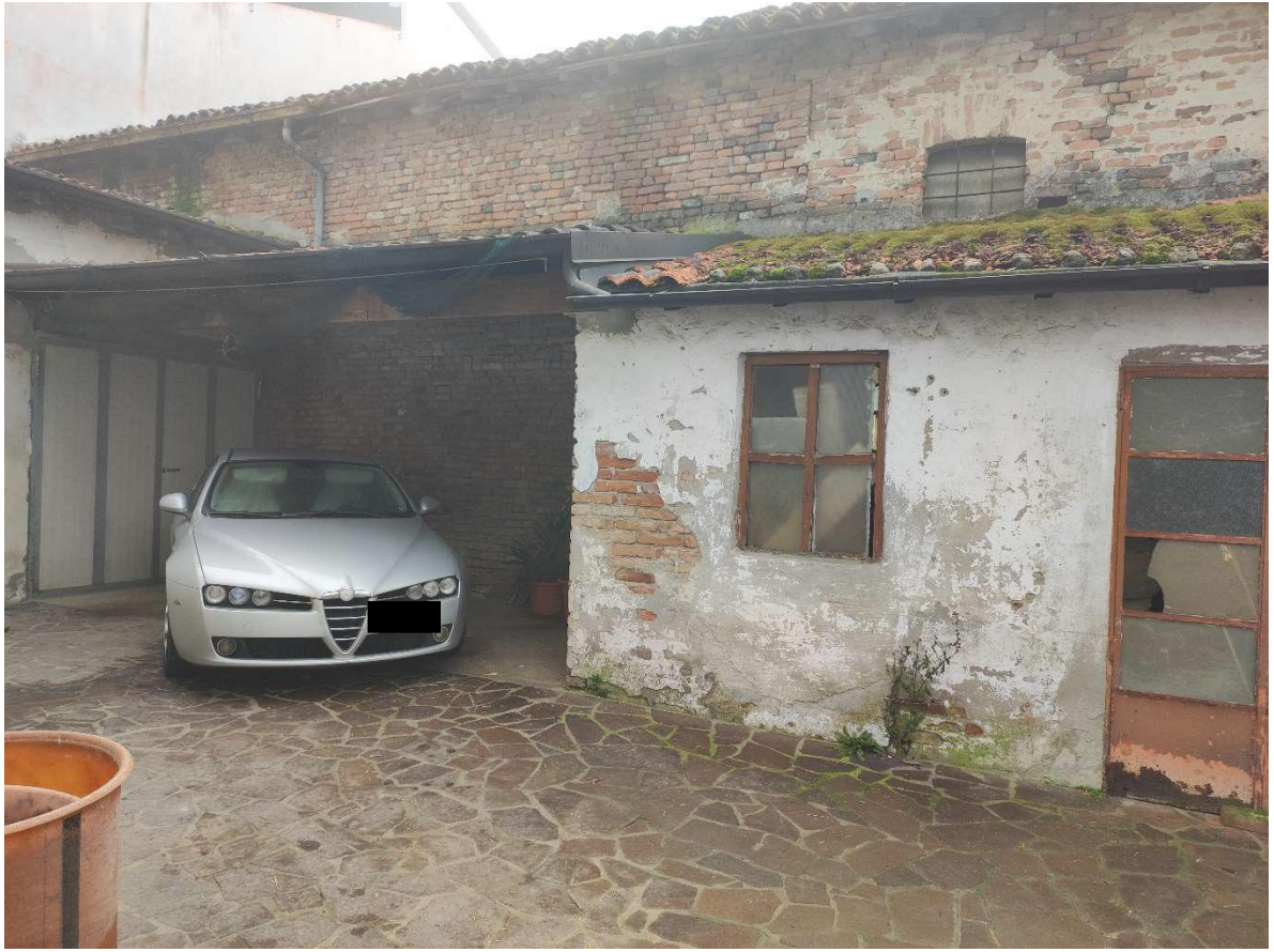
Portico da sanare