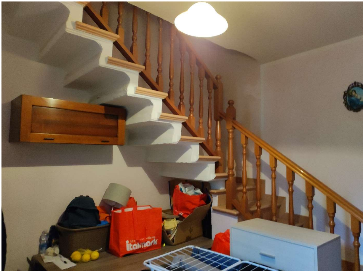
Disimpegno con scala p.t.