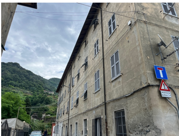
edificio (prospetto su via Granara)