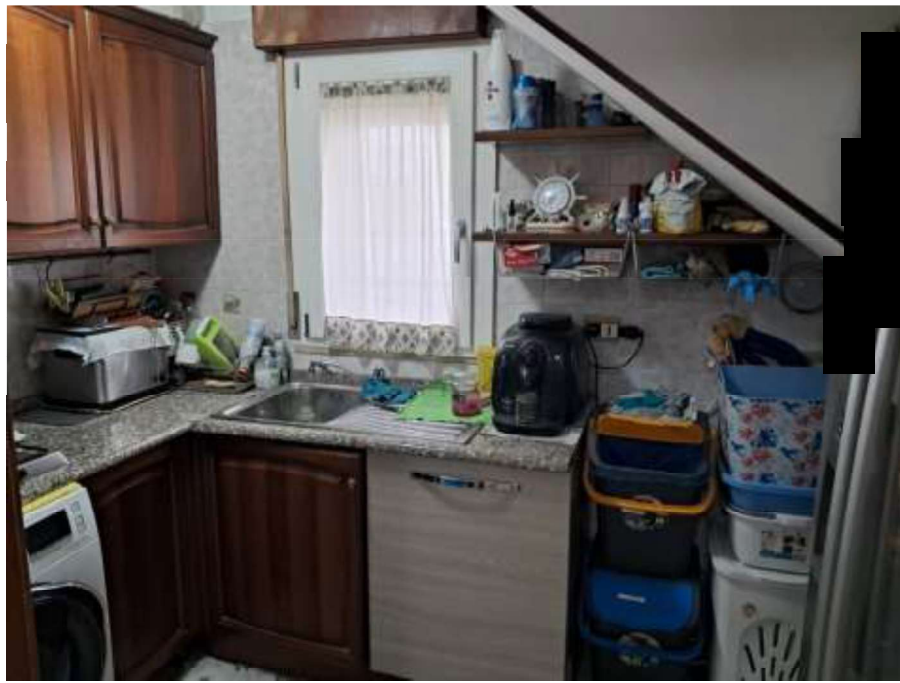
CUCINOTTO – PIANO TERRA