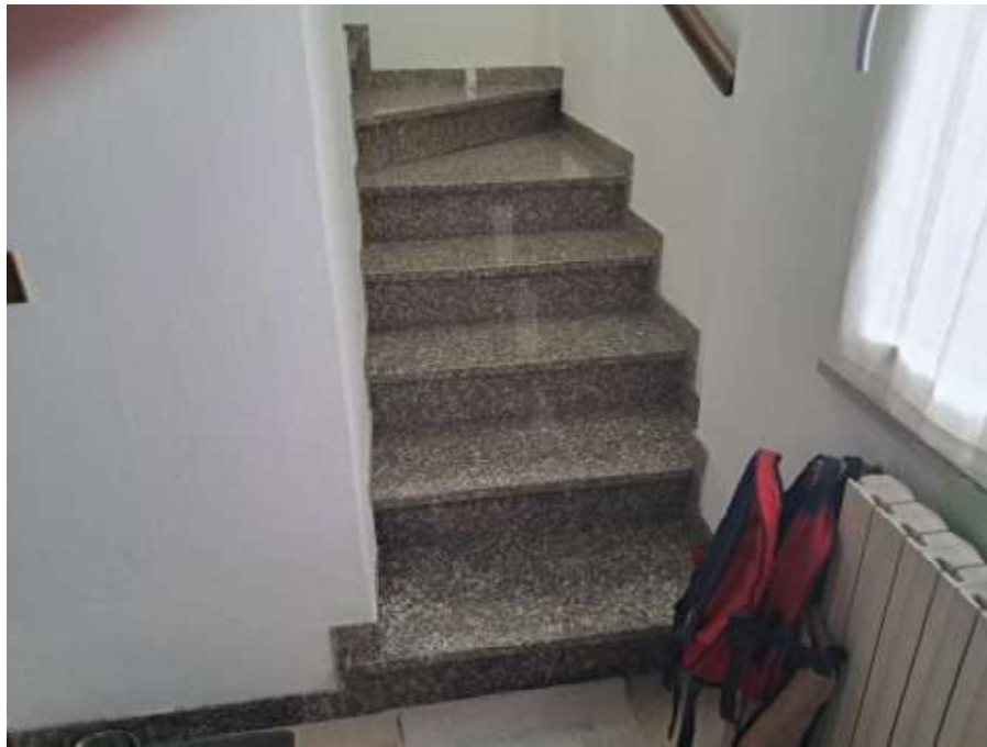
SCALA INTERNA – PIANO TERRA