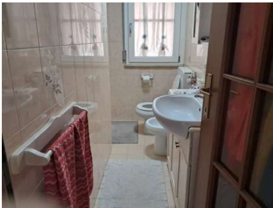
BAGNO – PIANO PRIMO