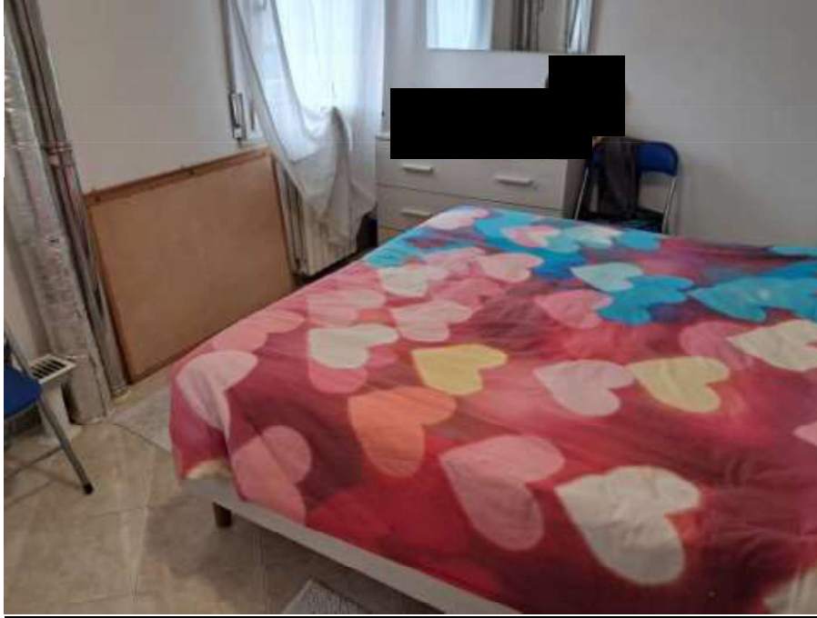
LETTO – PIANO PRIMO