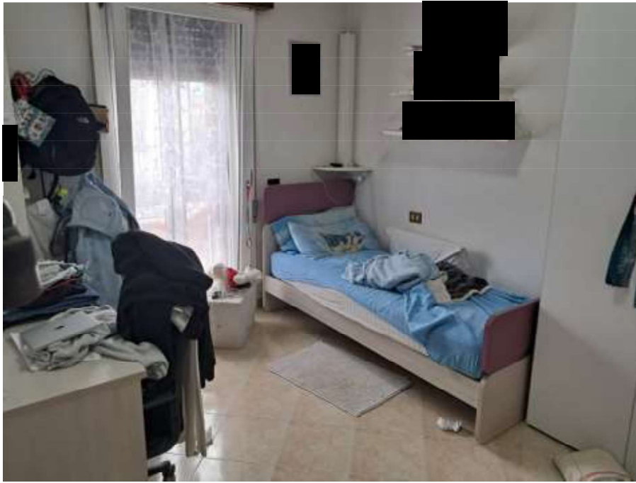
LETTO – PIANO PRIMO