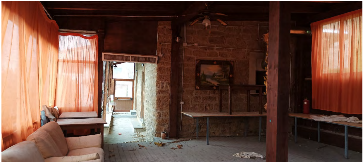
INTERNO VERANDA LATO SUD