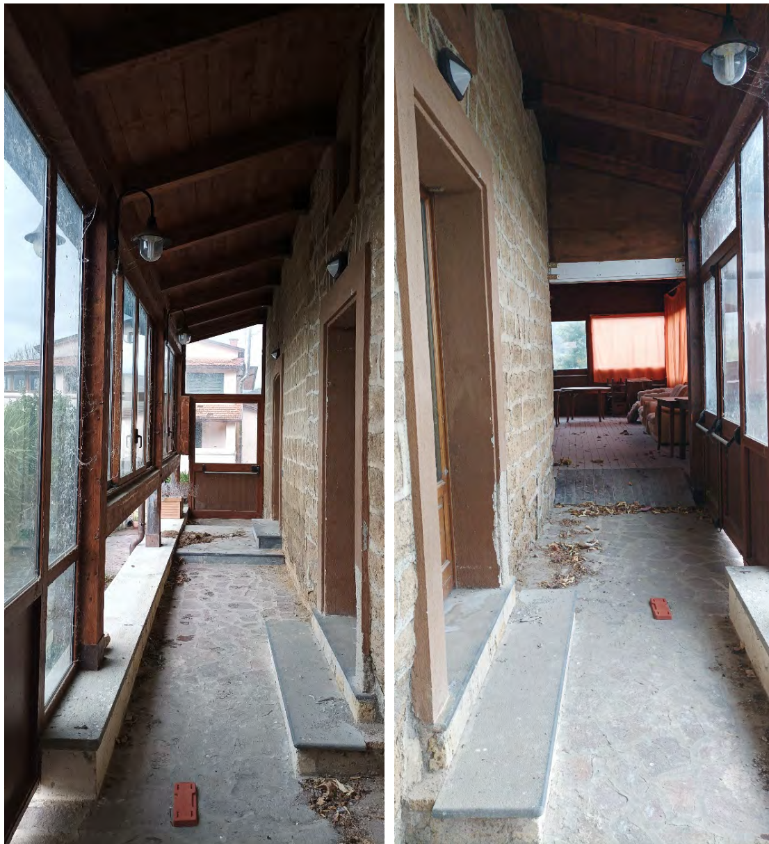
INTERNO VERANDA LATO OVEST