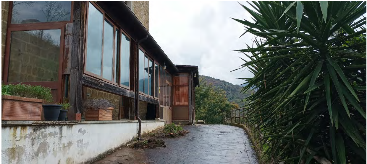
LATO OVEST - VERANDA