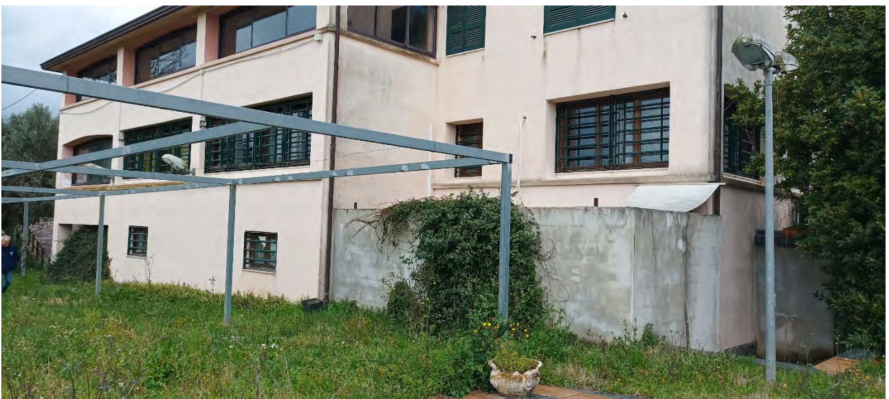
VISTA DA SUD-OVEST, DALL'AREA PISCINA (P.LLA 1063)