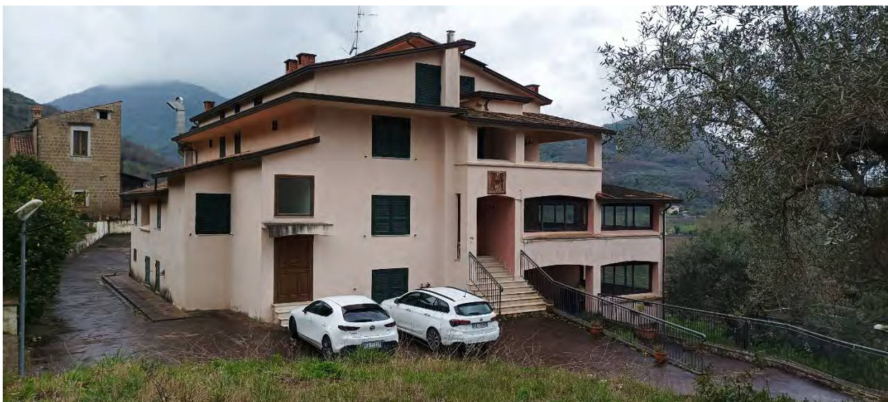
VISTA DA NORD-EST, DALLA PARTICELLA 167