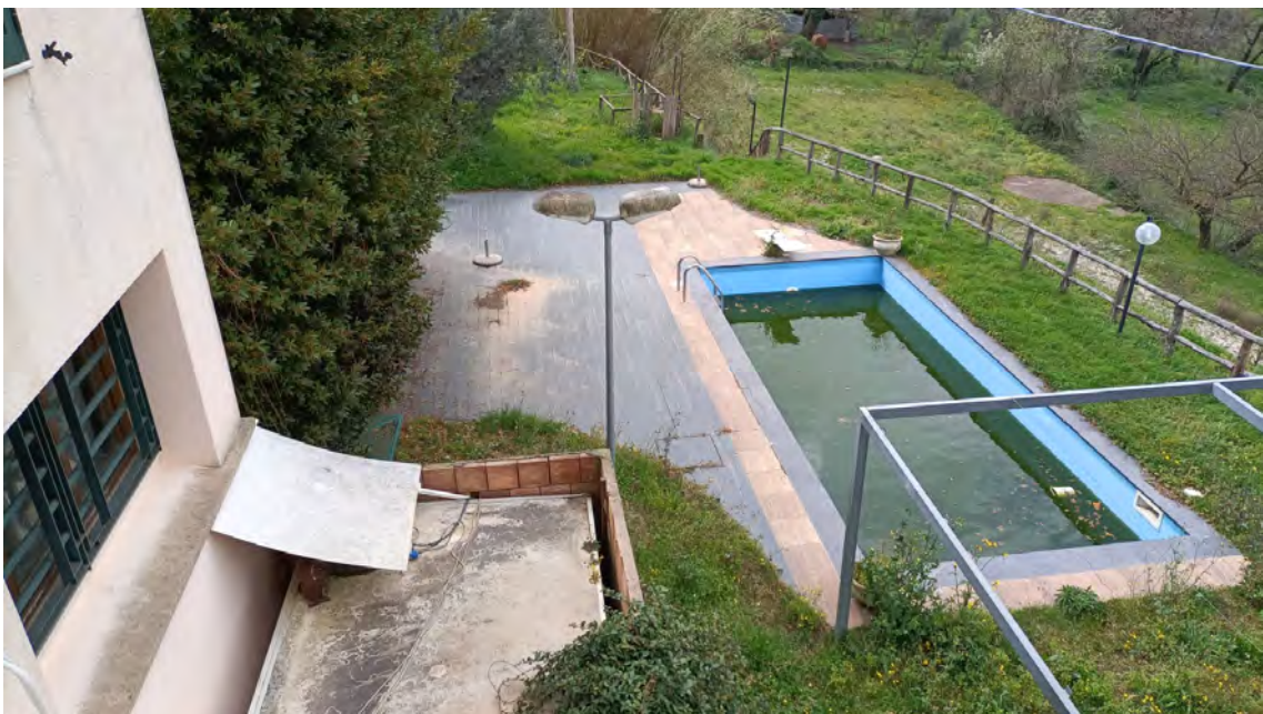
AREA PISCINA (P.LLA 1063)