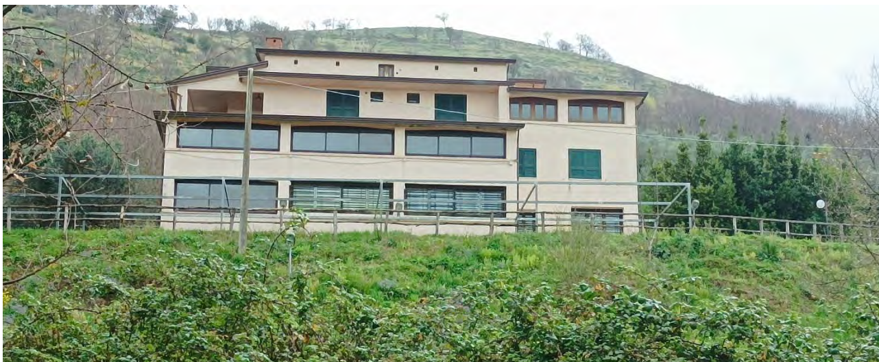
VISTA DA OVEST, DAI TERRENI SOTTOSTANTI