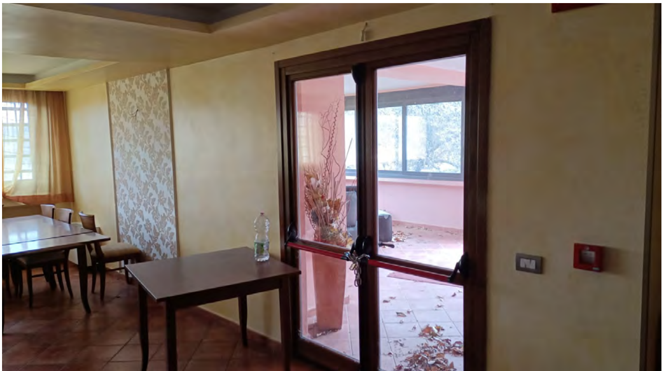
ACCESSO ALLA VERANDA