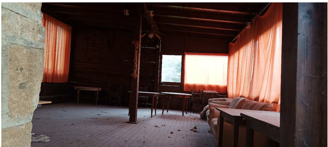
INTERNO VERANDA LATO SUD