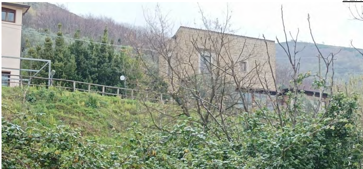
VISTA DA OVEST, DAI TERRENI SOTTOSTANTI