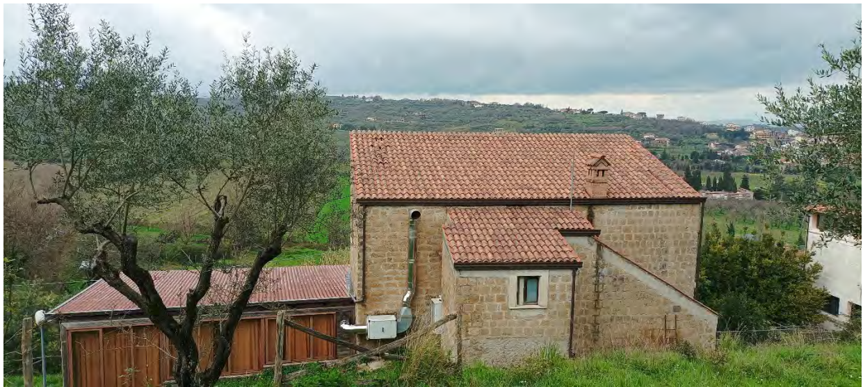
VISTA DA SUD-EST