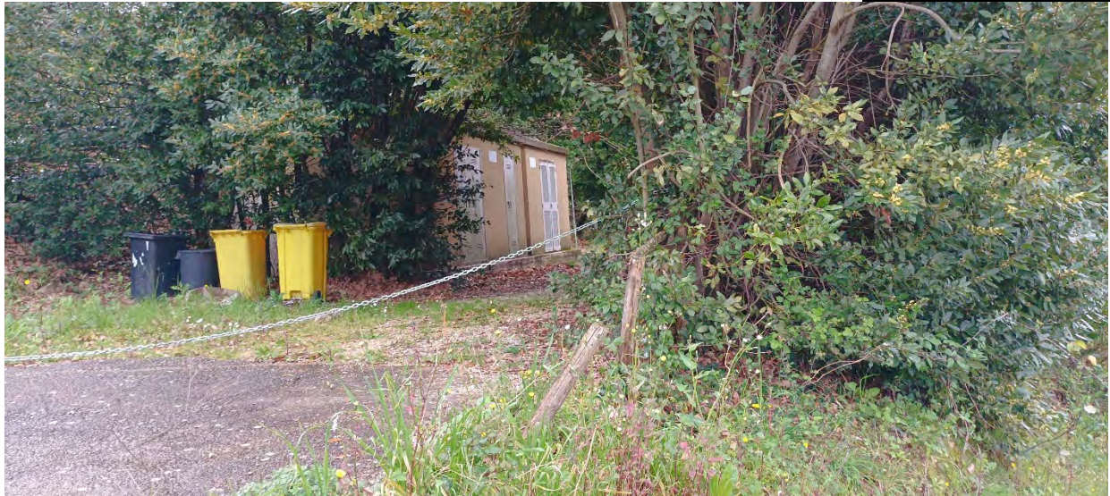
ACCESSO AL BENE