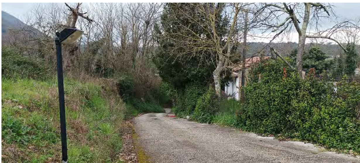
STRADA DI ACCESSO AI BENI PARTE DEI TERRENI