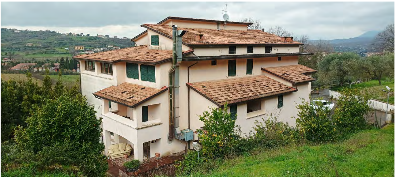
VISTA DA EST, DALLA PARTICELLA 167