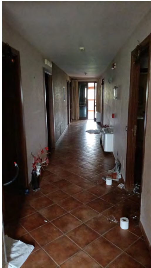
VANO SCALA E CORRIDOIO