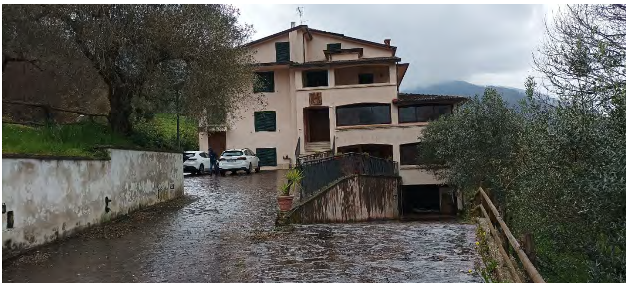
VISTA DA NORD, DAL VIALE DI ACCESSO