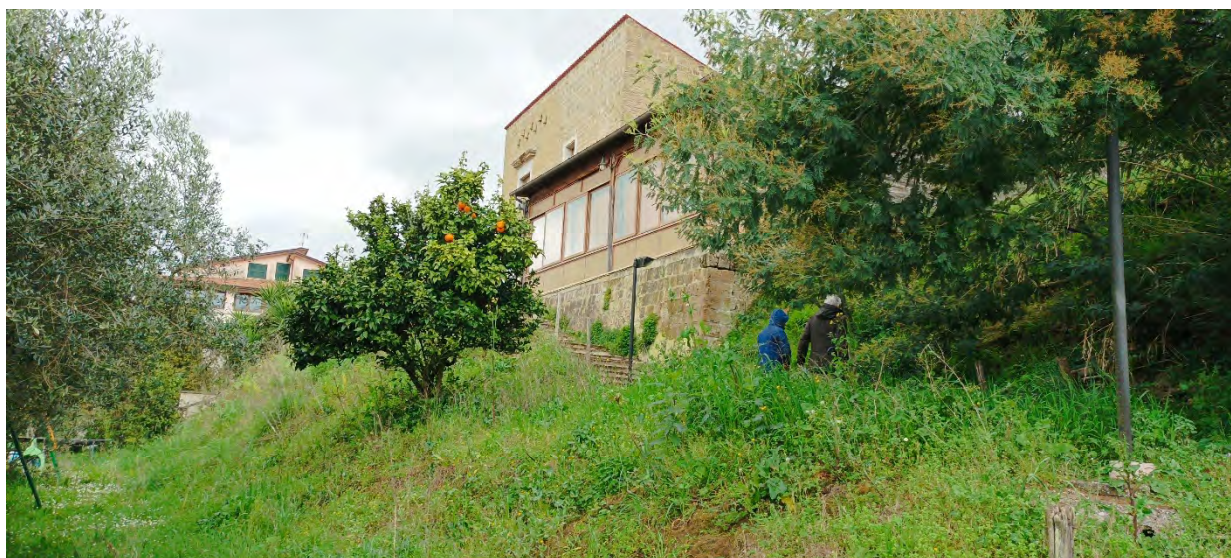
VISTA DA SUD-OVEST, DAI TERRENI SOTTOSTANTI