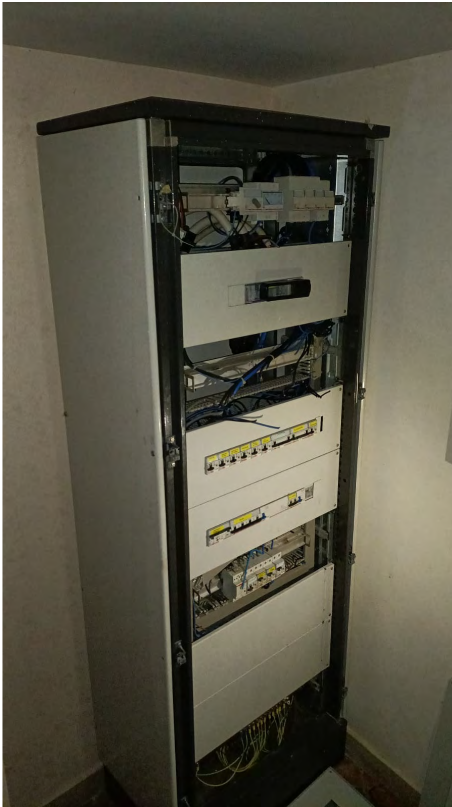
QUADRO ELETTRICO DANNEGGIATO