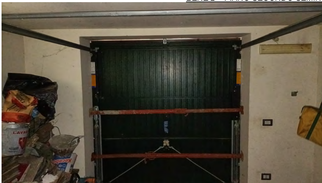
ACCESSO AI LOCALI DEPOSITO DALL'ESTERNO