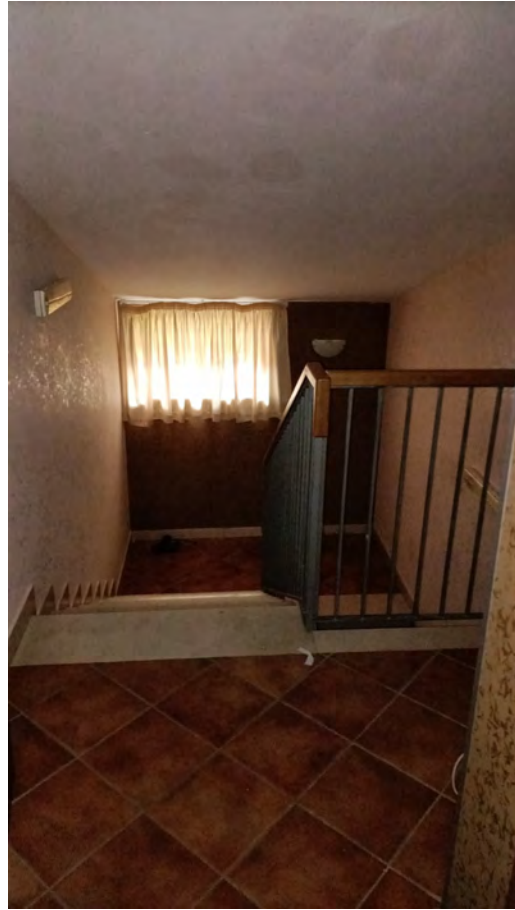
CORRIDOIO E VANO SCALA