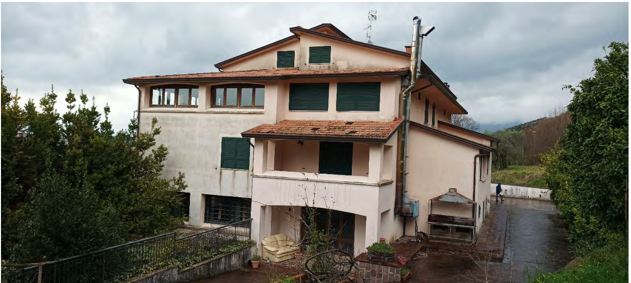
VISTA DA SUD, DALL'AREA ESTERNA DEL FABBRICATO RURALE