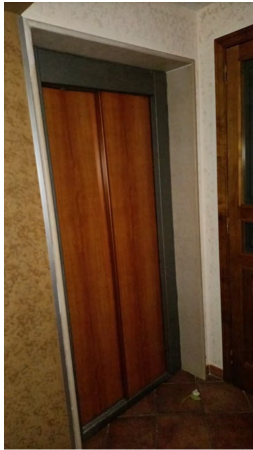
CORRIDOIO E ASCENSORE