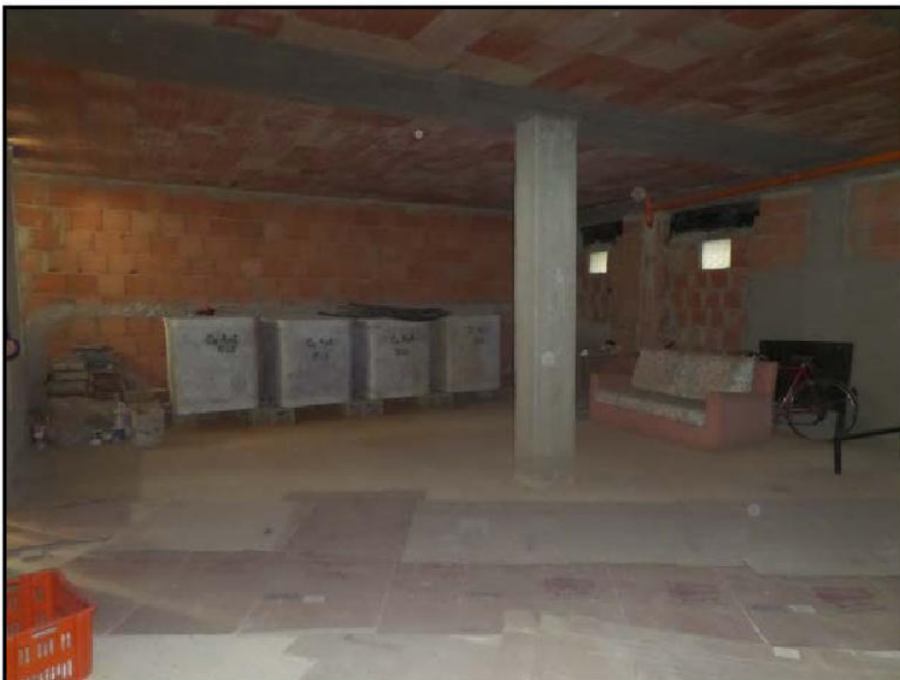
Vista interna del locale sub 7