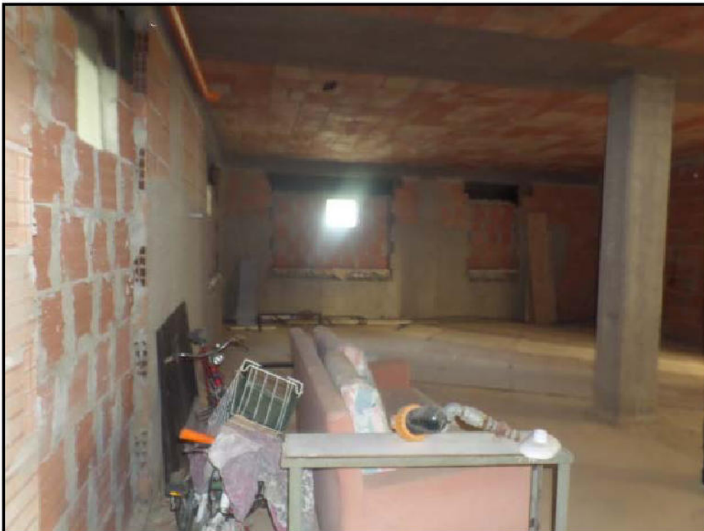
Vista interna del locale sub 7