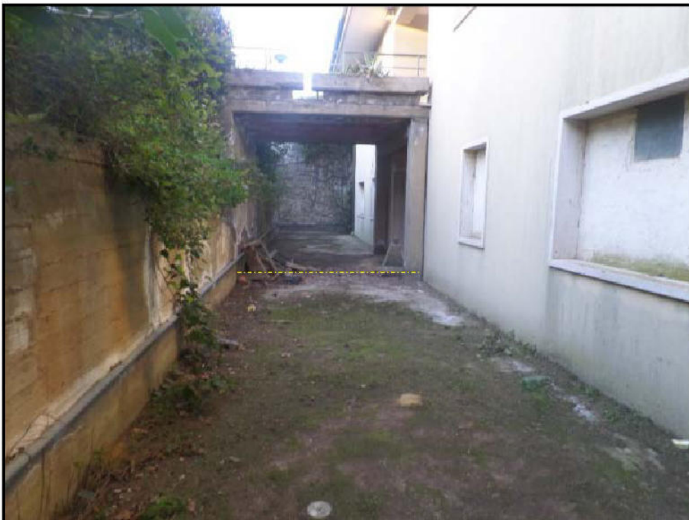
Corte nel retro dell'uiu