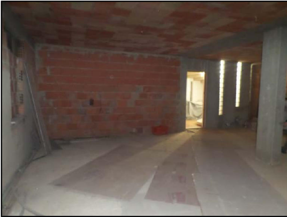
Vista interna del locale sub 7