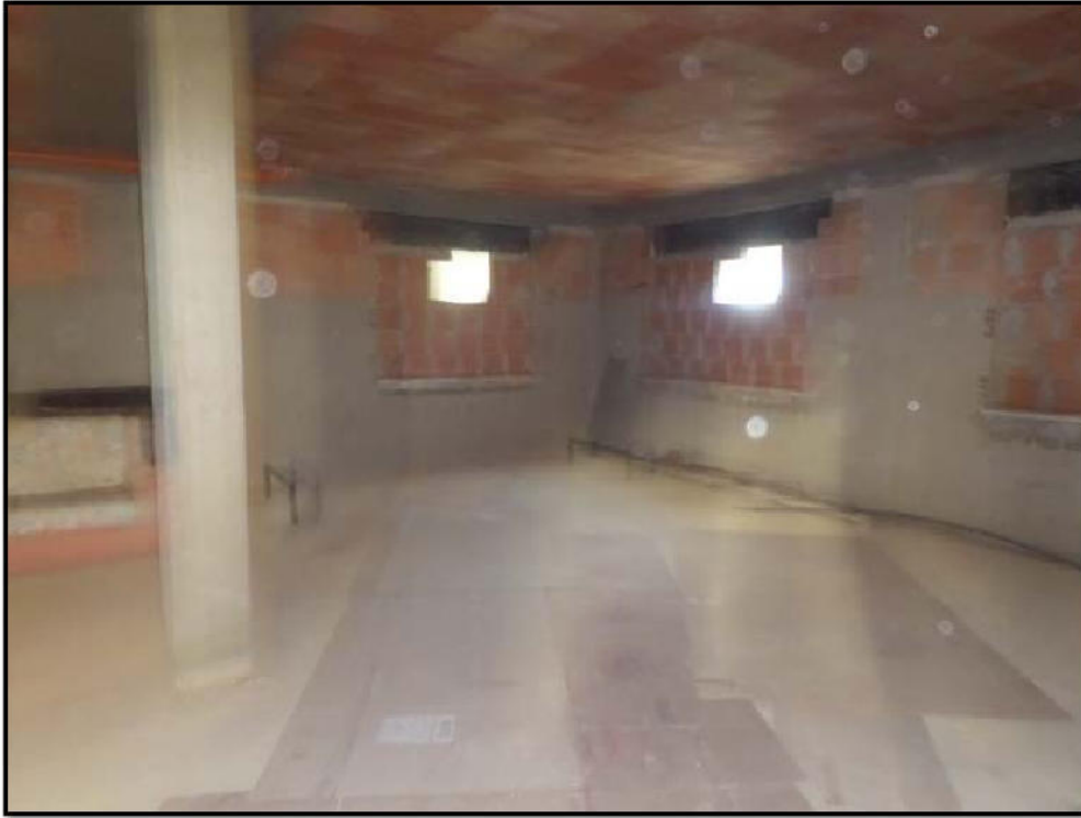
Vista interna del locale sub 7