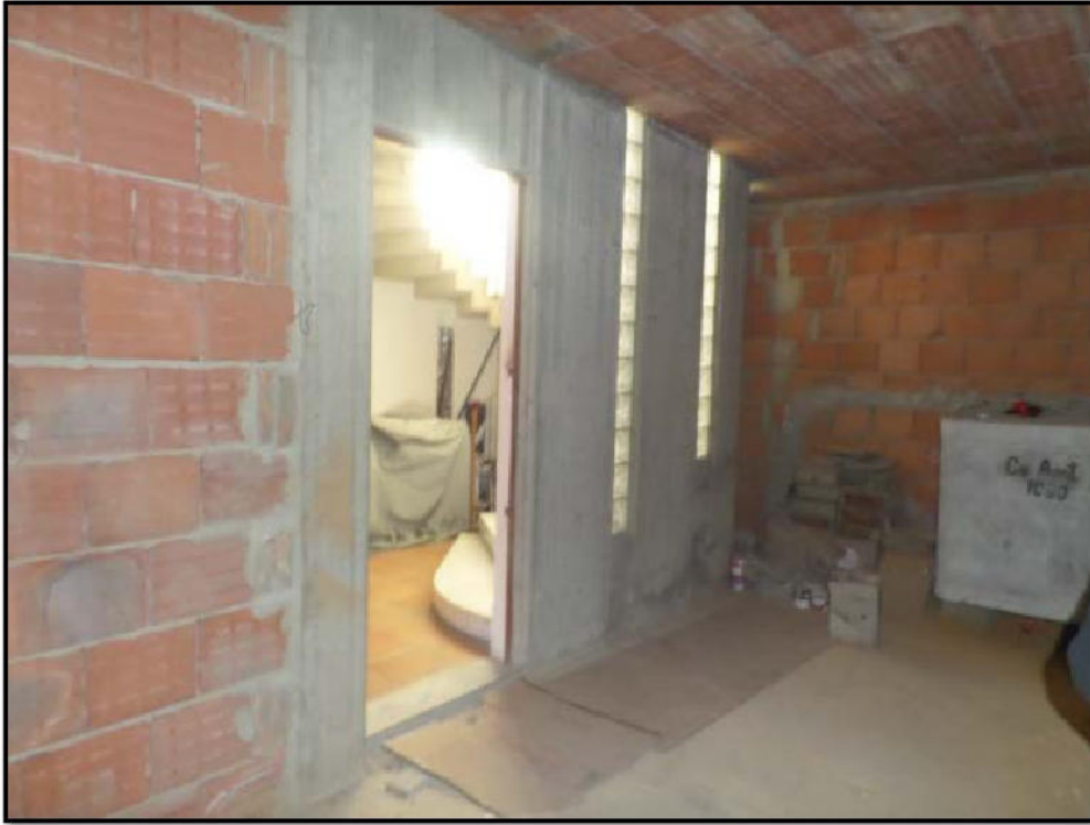
Vista interna del locale sub 7