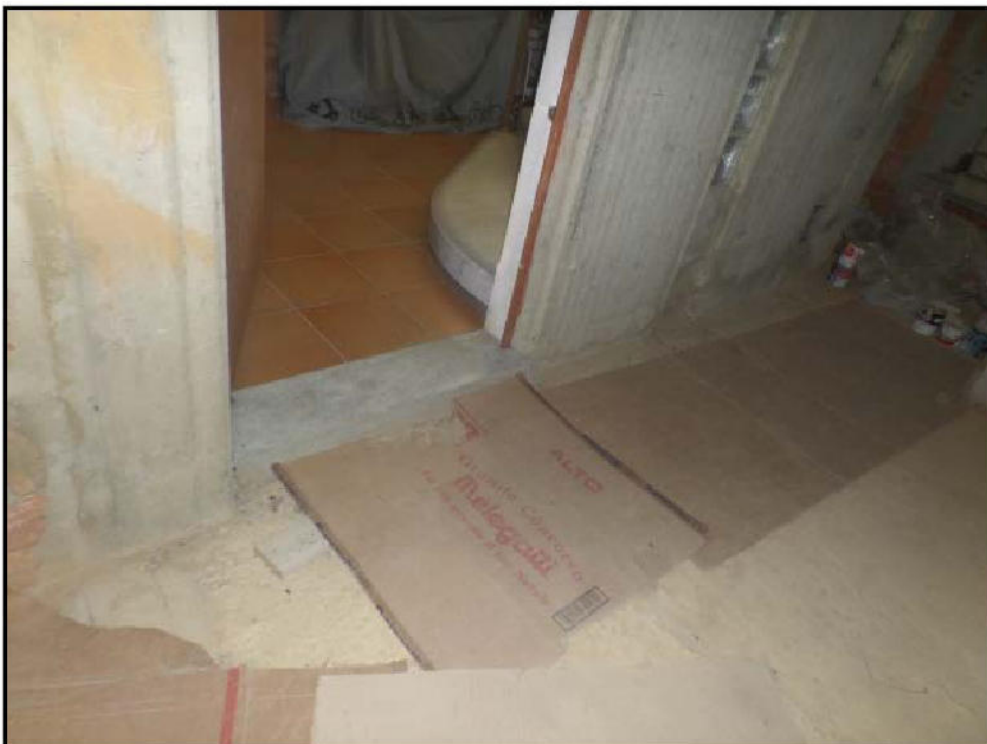
Vista interna del locale sub 7