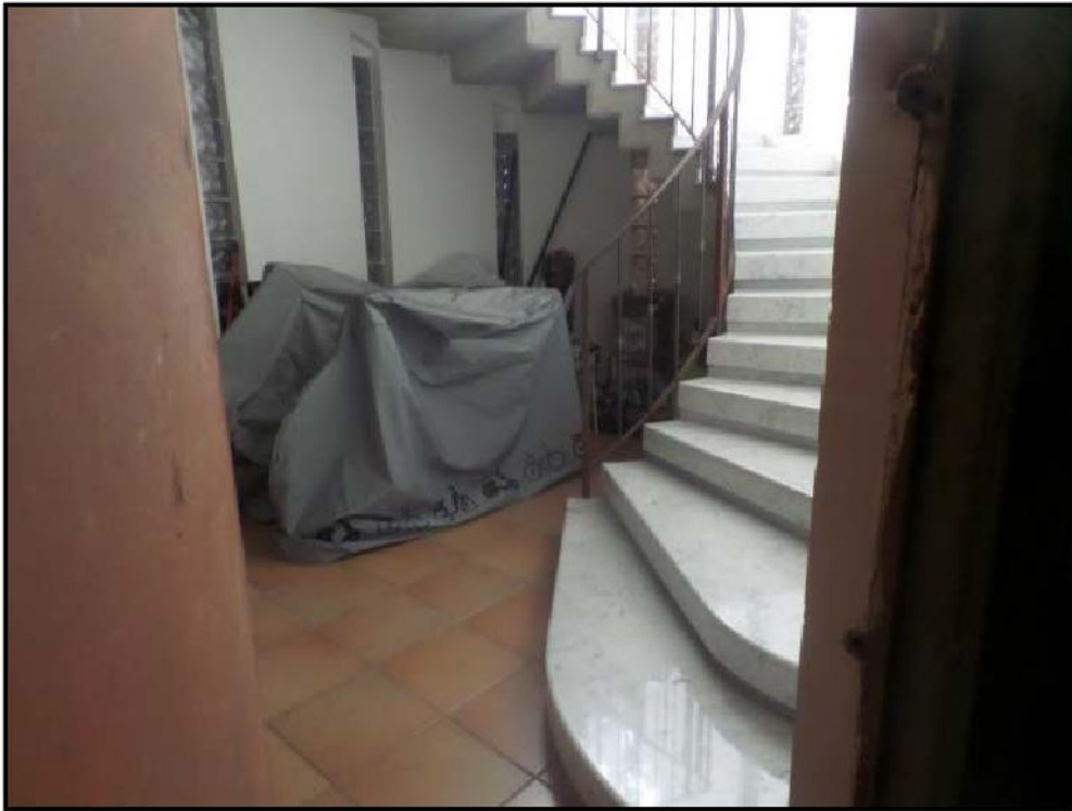
Scala comune (sub 8) con le altre uiu dello stesso edificio