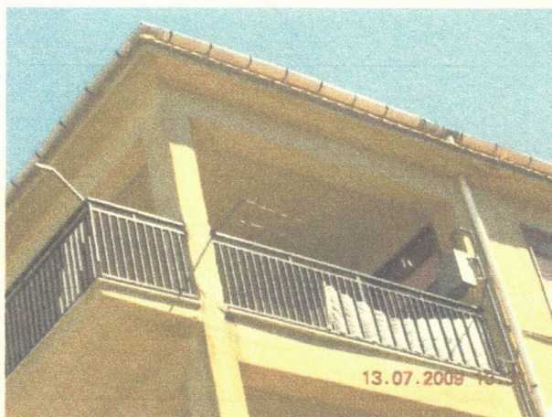
Foto 4 Particolare del terrazzo