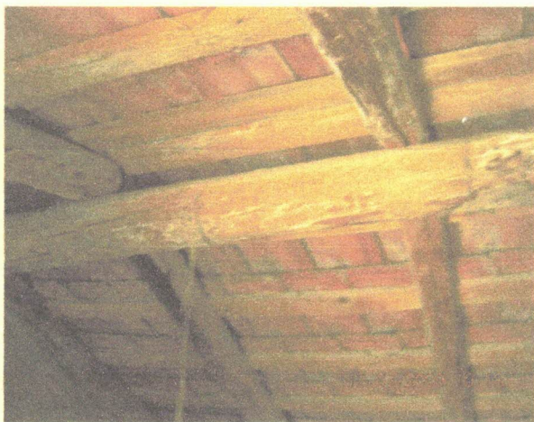
Foto 15 particolare copertura a falde del sottotetto