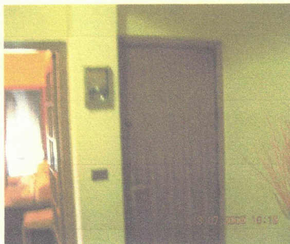
Foto 8 Portoncino d'ingresso.