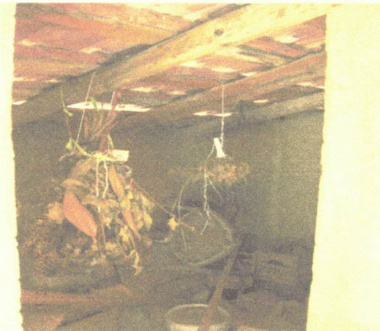
Foto 14 vano sottotetto