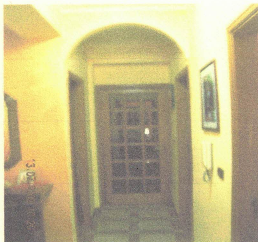
Foto 9 Particolare corridoio