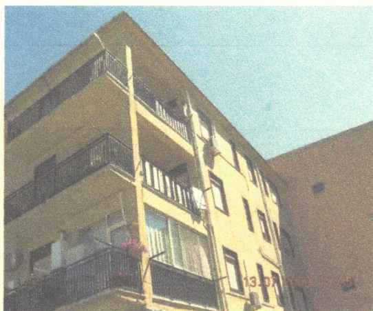
Foto 3 Particolare angolo sud- ovest