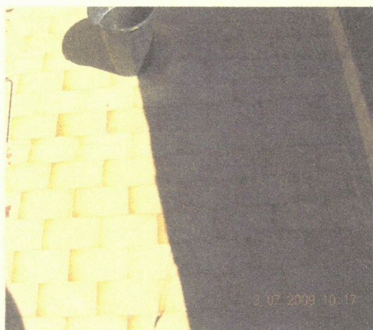
Foto 11 Piastrelle in ceramica