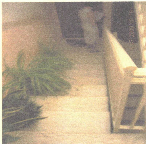
Foto 7 Particolare scale.