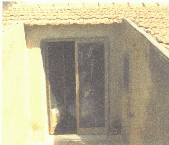
Foto 16 particolare infisso del vano sottotetto