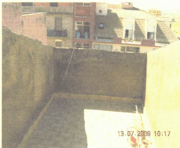
Foto 10 Particolare del terrazzino