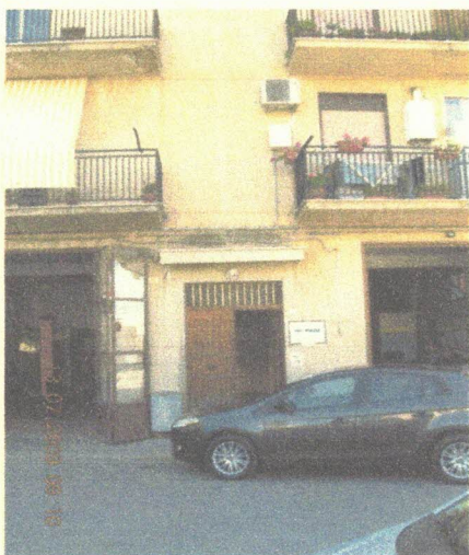
Foto 1 Prospetto ovest su Via Sergio Leone