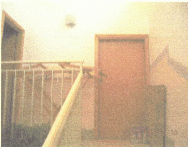
Foto 13 Portoncino d'ingresso.