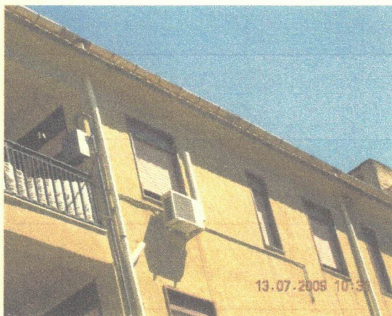
Foto 5 Prospetto sulla Via S. Vincenzo