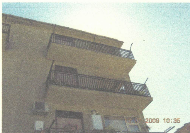
Foto 2 Prospetto angolo tra la Via S. Leone e la Via S. Vincenzo