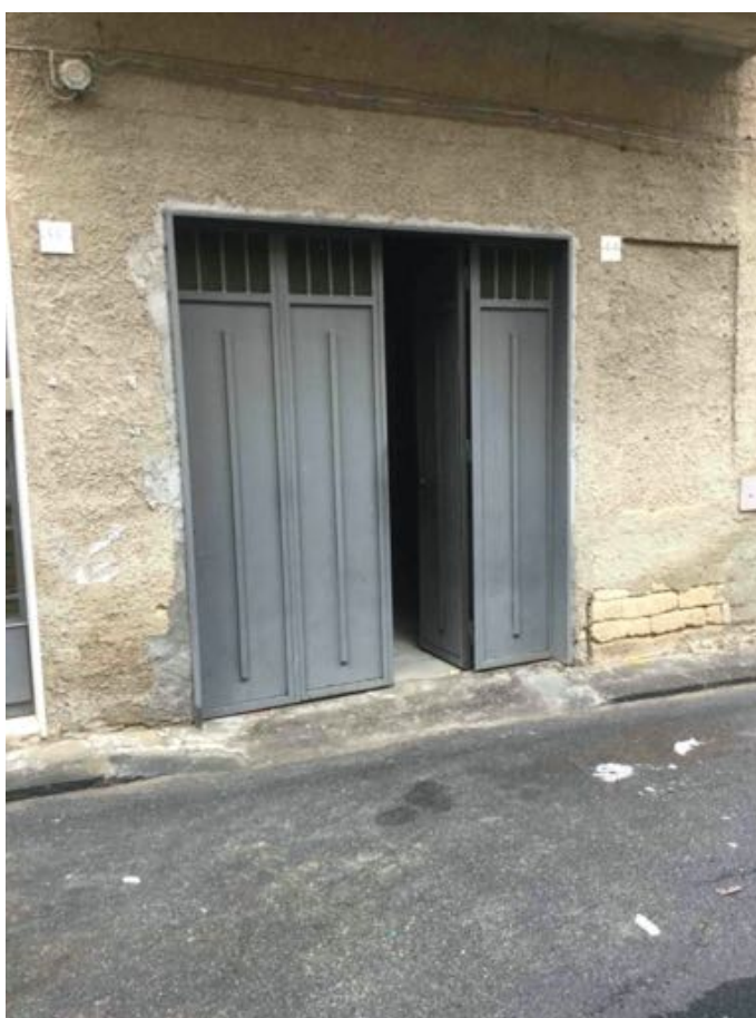
fig. 4 – Porta d'ingresso garage su via Isonzo