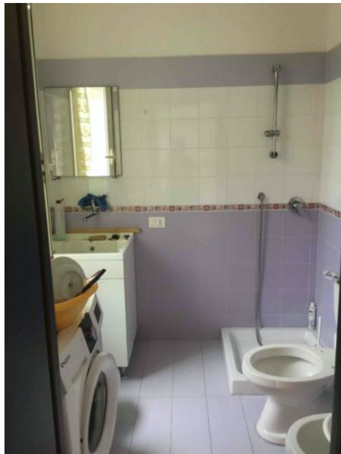
fig.6 – Bagnolavanderia - piano secondo