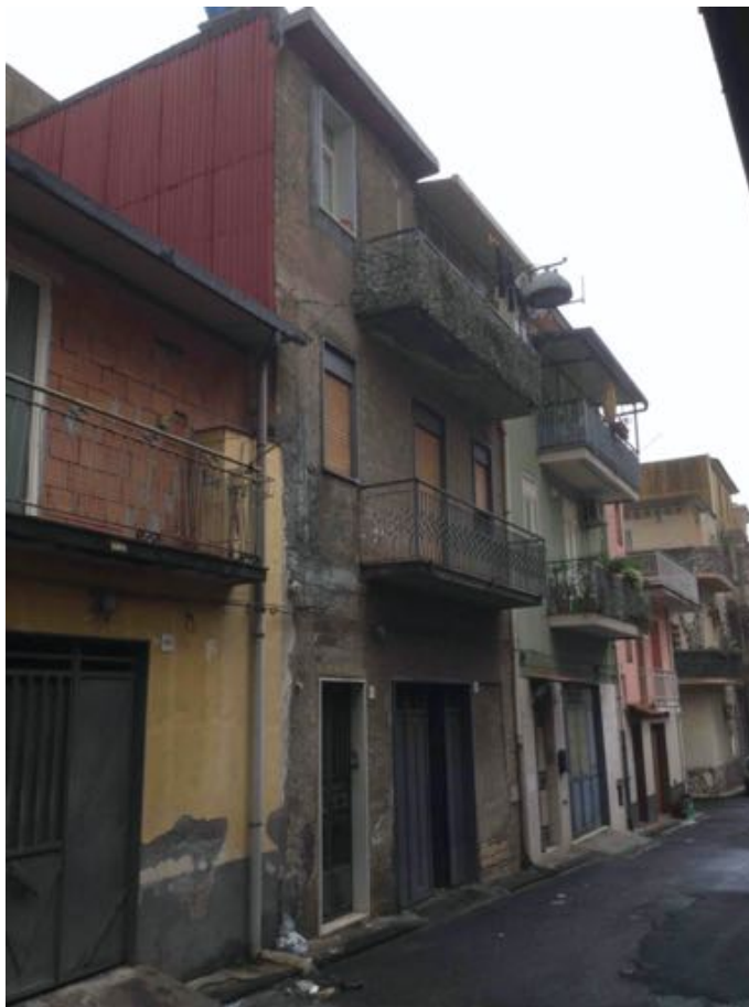
fig. 1 – Prospetto su via Isonzo