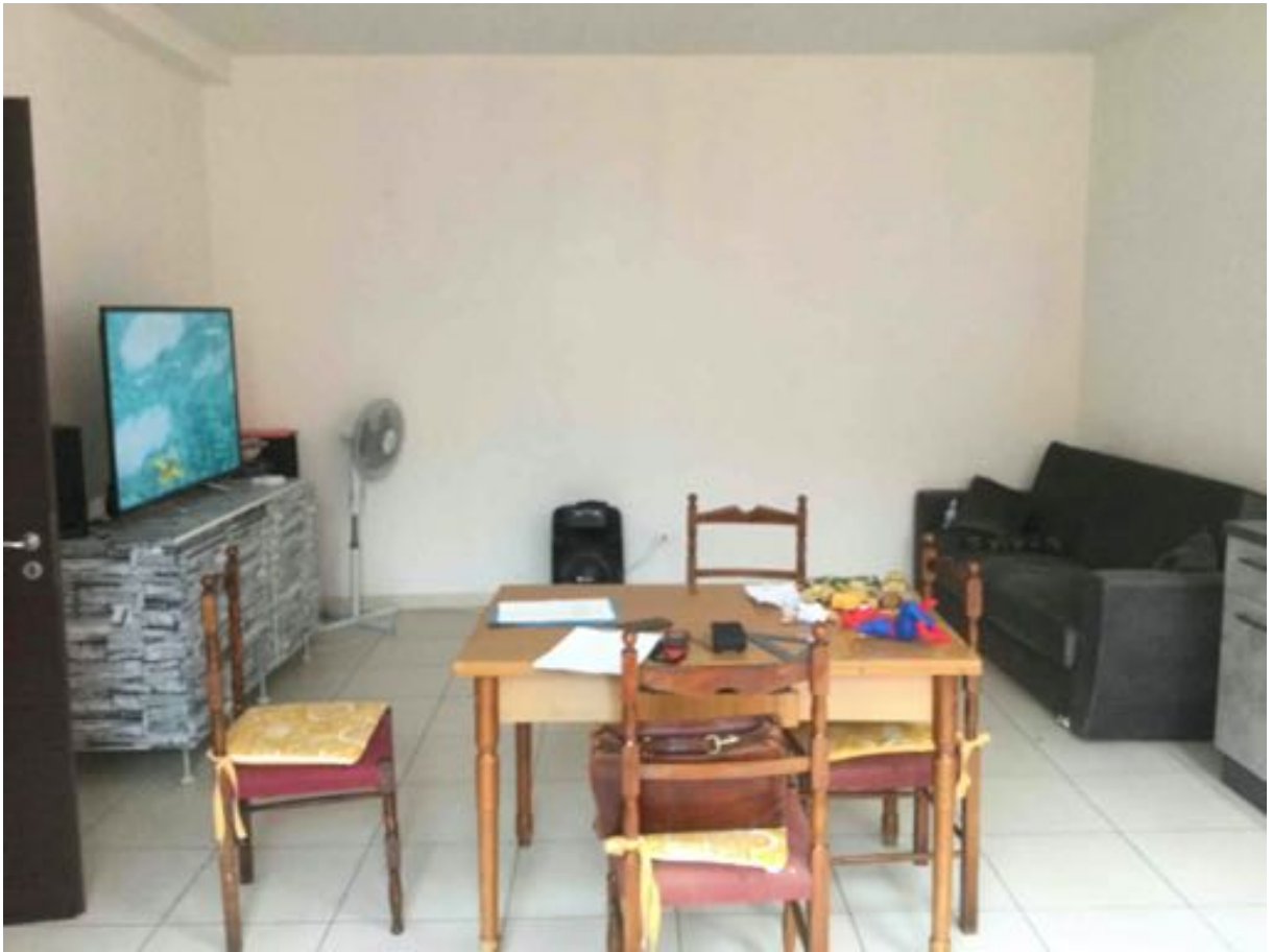
fig. 5 – Cucina soggiorno- piano secondo