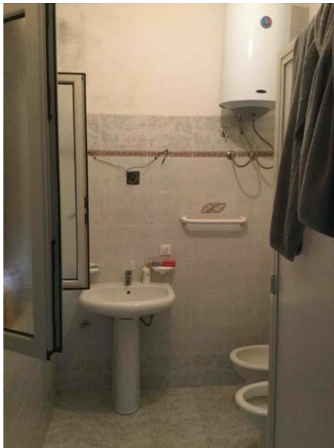
fig. 9 – Bagno - piano primo