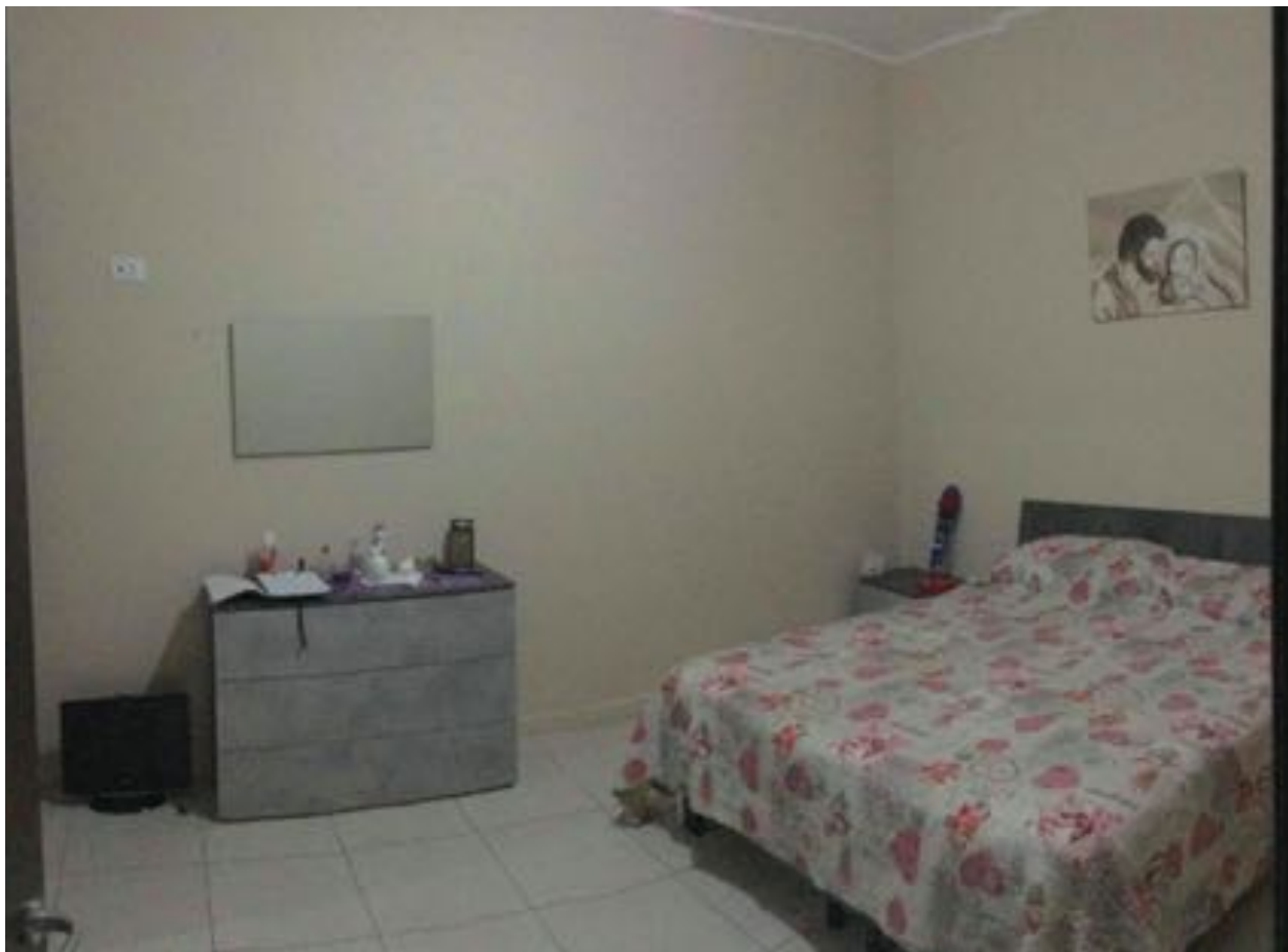
fig. 7 – Camera da letto 1 - piano primo