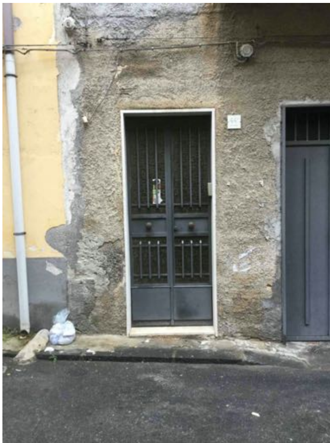
fig. 3 – Portone d'ingresso