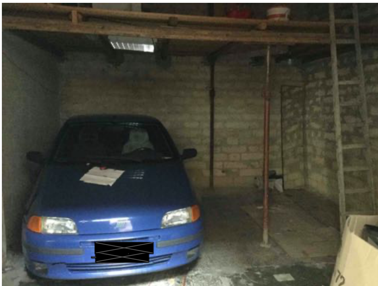
fig.10 – Garage