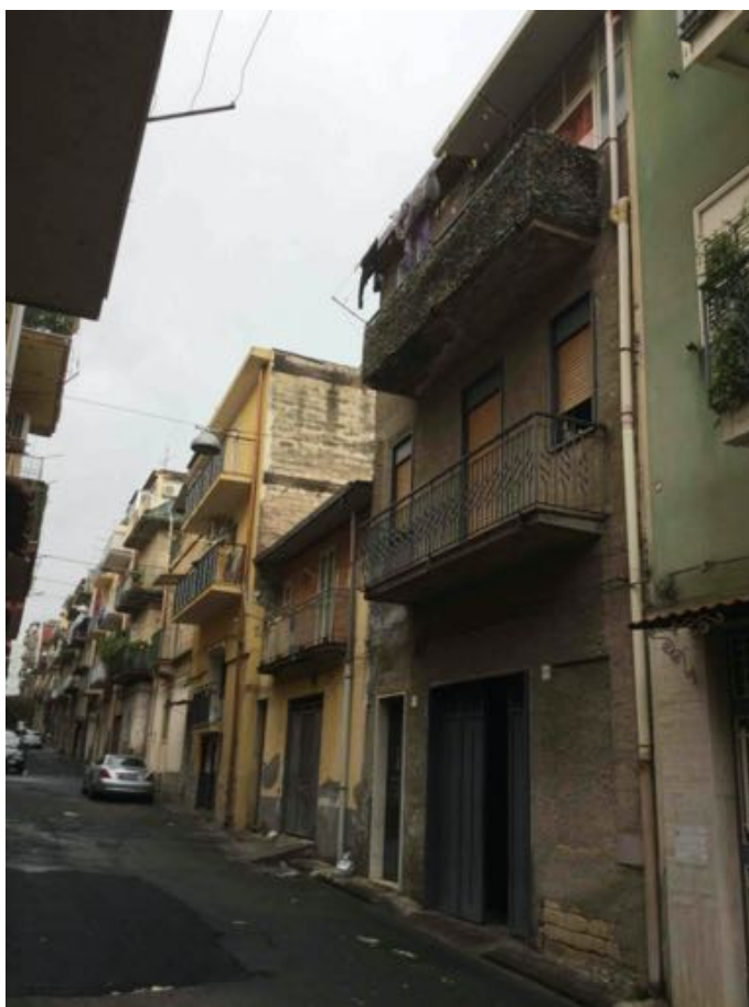
fig. 2 – Prospetto su via Isonzo