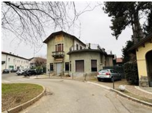
Vista su Piazza Madonnina

L'intero edificio sviluppa 2 piani fuori terra, 1 piano interrato.