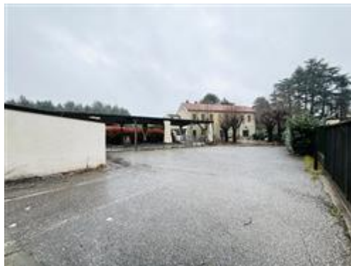
Vista su cortile interno