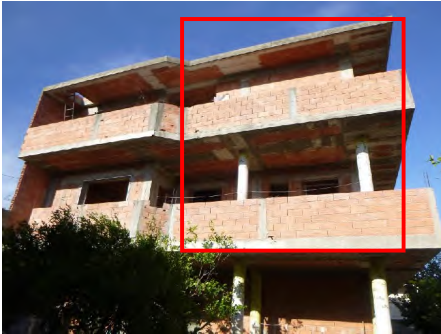
Foto 3.: Prospetto lato Ovest: si noti l'inversione dell'ingombro fra piano primo e secondo