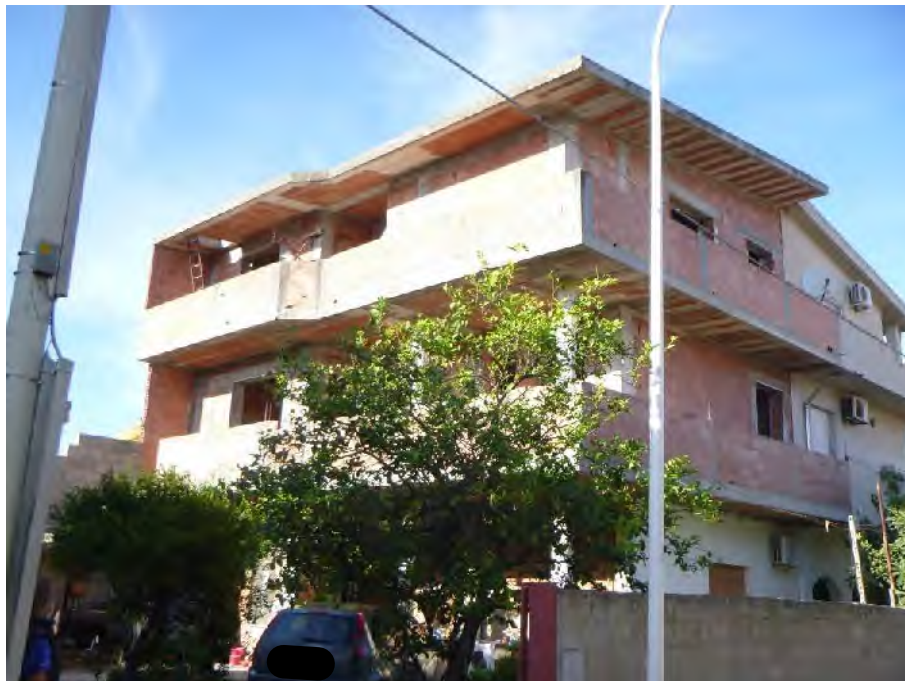
Foto 2.: Prospetti lato sud e Ovest: si noti l'inversione dell'ingombro fra piano primo e secondo.