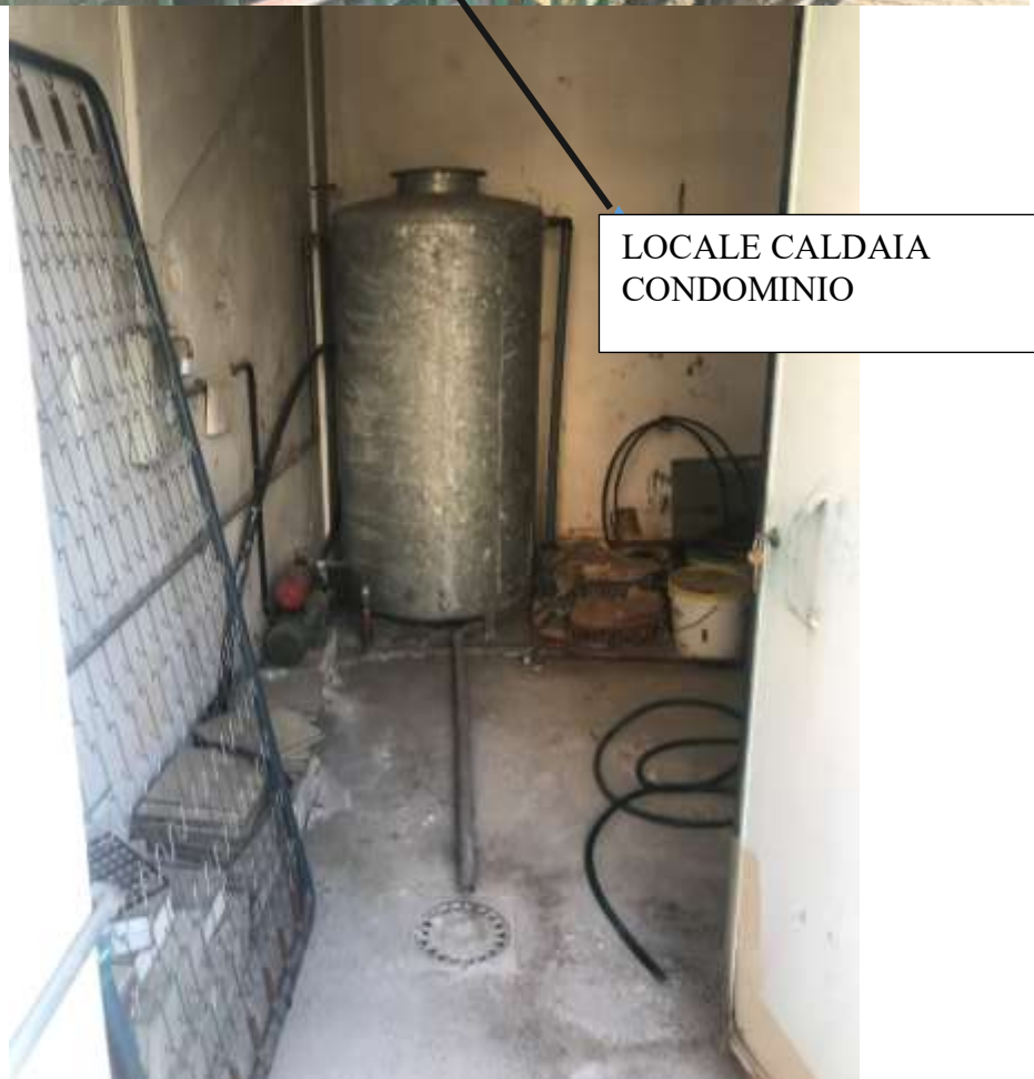
Foto n. 11 LOCALE CALDAIA