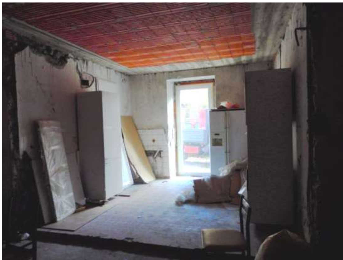
Appartamento al piano terra censito al C.F. fg.37 mapp.225 sub.4-12, particolare accesso nel soggiorno.