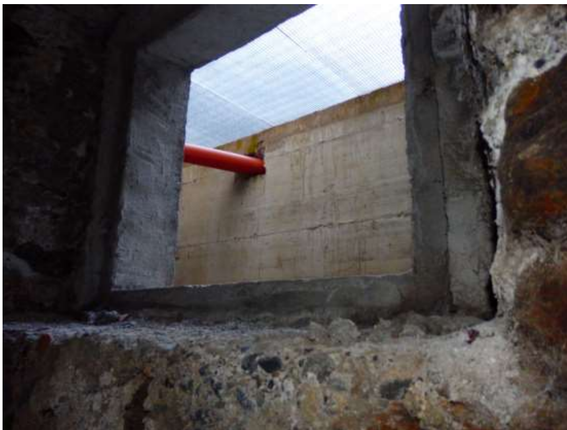
Finiture gole di lupo, prive di serramenti. Cantina al piano interrato di pertinenza all'appartamento censito al C.F. fg.37 mapp.225 sub.4-12.