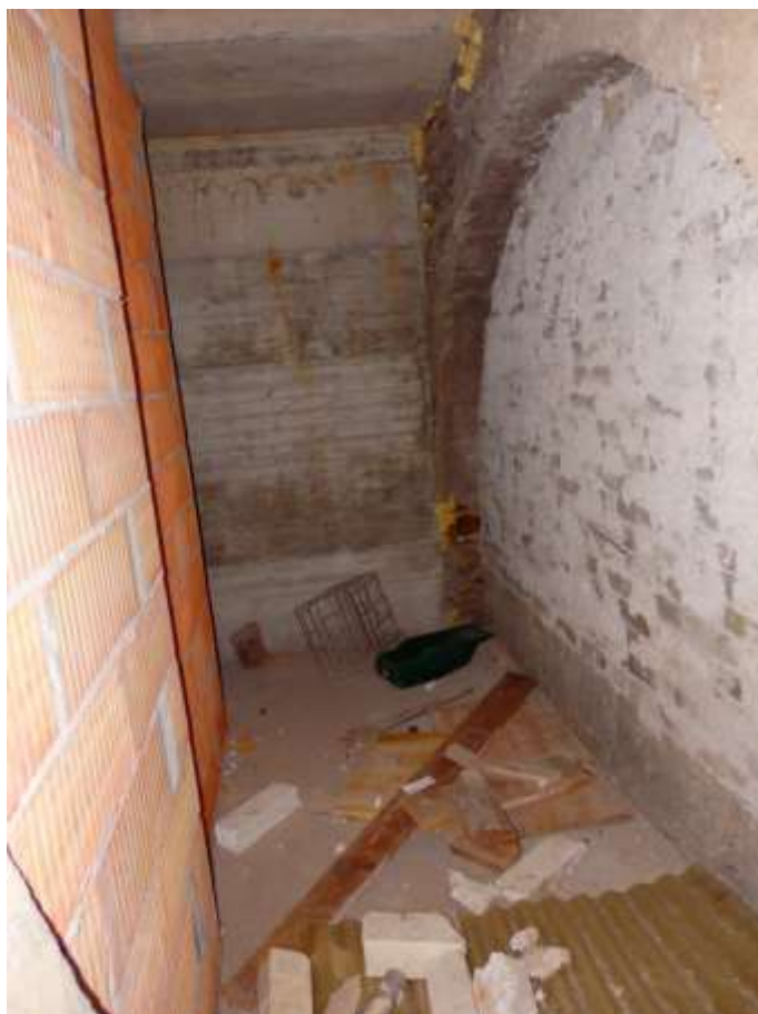
Cantina al piano interrato di pertinenza all'appartamento censito al C.F. fg.37 mapp.225 sub.4-12, posta in prossimità del vano scala.