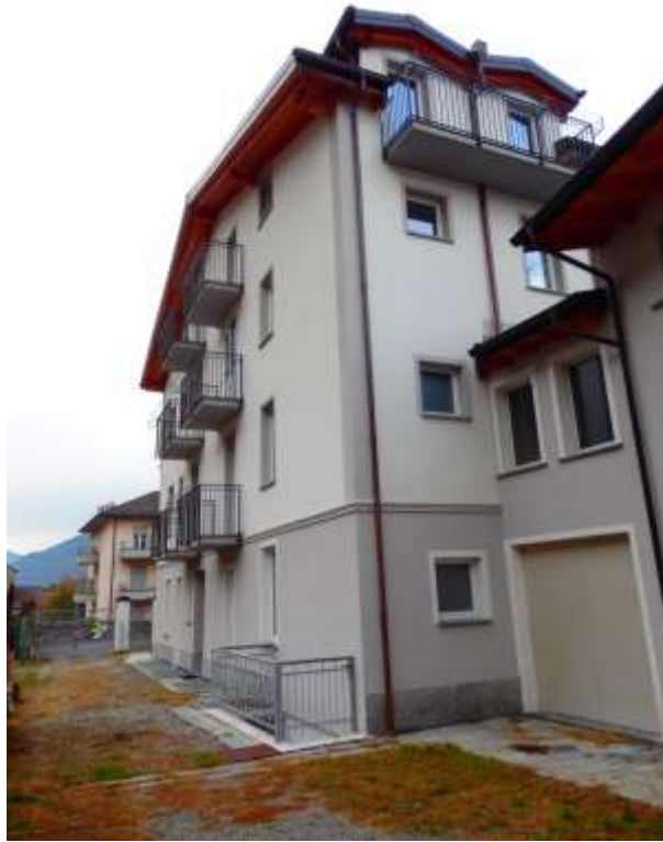
Fabbricato censito al C.F. Fg.37 mapp.225 – Facciate esposte a sud/est.