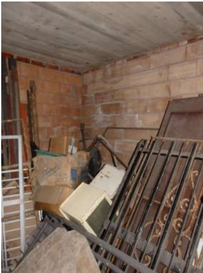
Appartamento al piano terra censito al C.F. fg.37 mapp.225 sub.4-12. Camera n.2. Particolare serramento mancante.