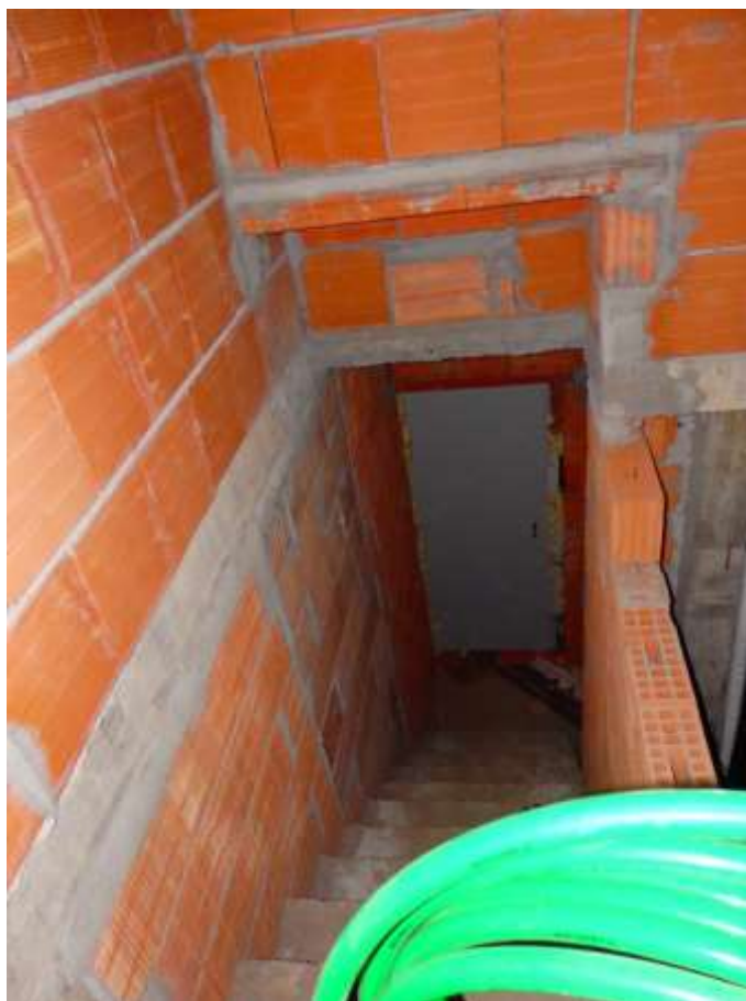
Appartamento al piano terra censito al C.F. fg.37 mapp.225 sub.4-12. Scala di accesso al piano interrato posta nel disimpegno di collegamento al soggiorno con cucina.