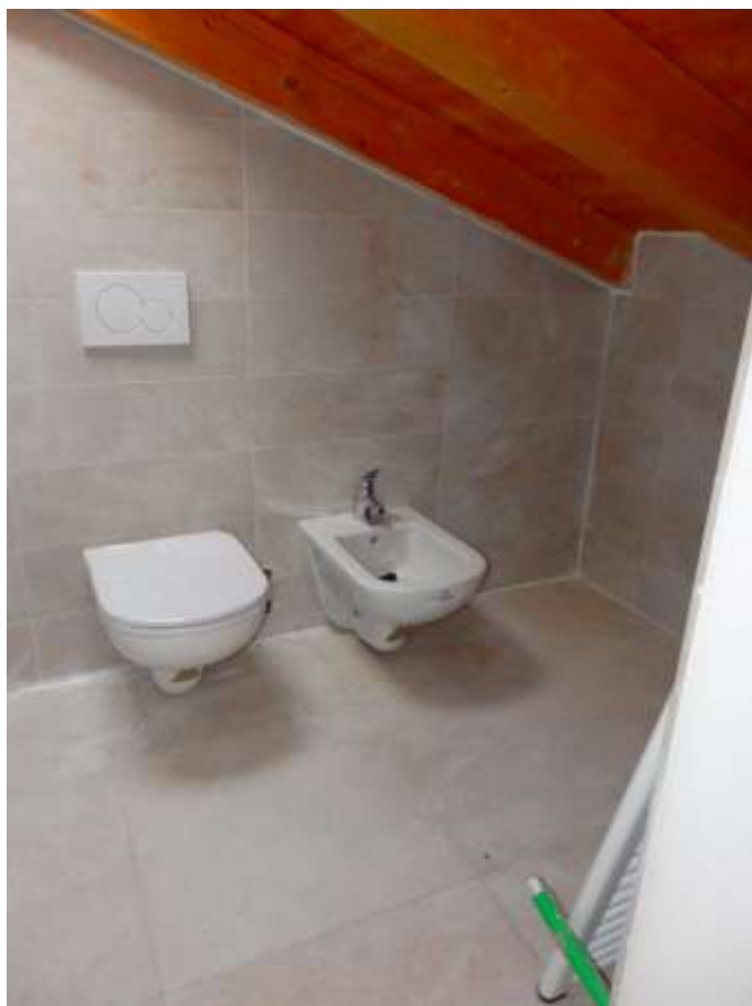
Appartamento al piano terzo censito al C.F. Foglio 37 mappale 225 subalterni 6-14 Bagno n.2 – Particolari altezze minimi in gronda.