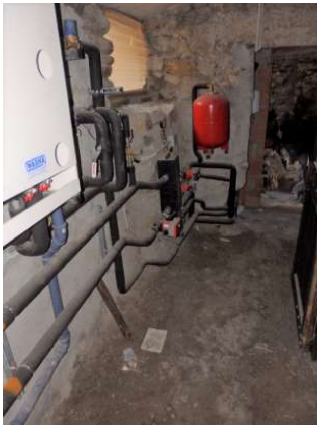
Piano interrato vano comune censito al sub.18, ove è installato l'impianto del teleriscaldamento.