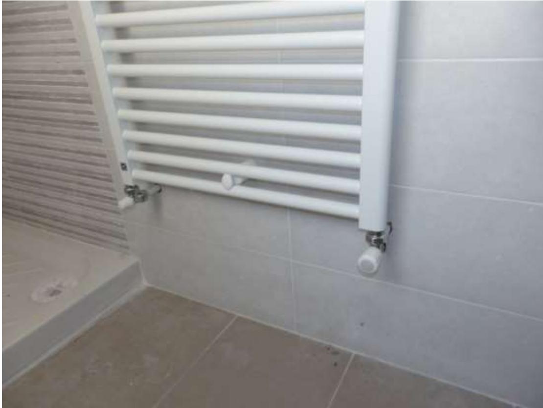
Appartamento al piano terra censito al C.F. fg.37 mapp.225 sub.4-12. Finiture bagno. Particolare termoarredo allacciato alle tubazioni.