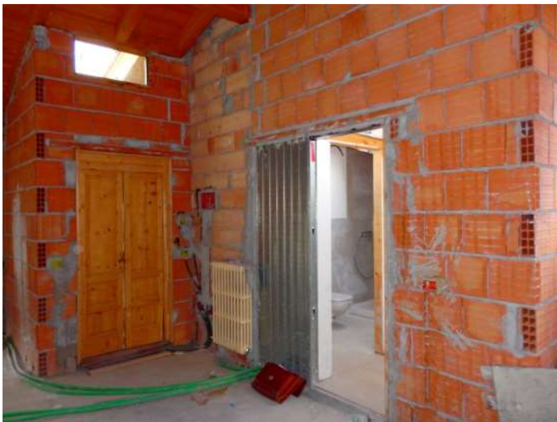
Appartamento al piano terzo censito al C.F. Foglio 37 mappale 225 subalterni 6-14 Particolare soggiorno con angolo cottura e porta di accesso ai bagni.