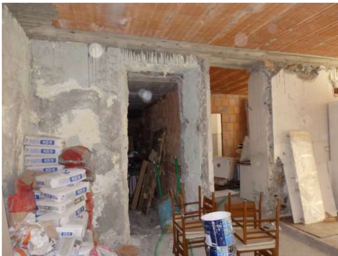
Soggiorno. Particolare accesso alle camere e allo studio con bagno al piano primo