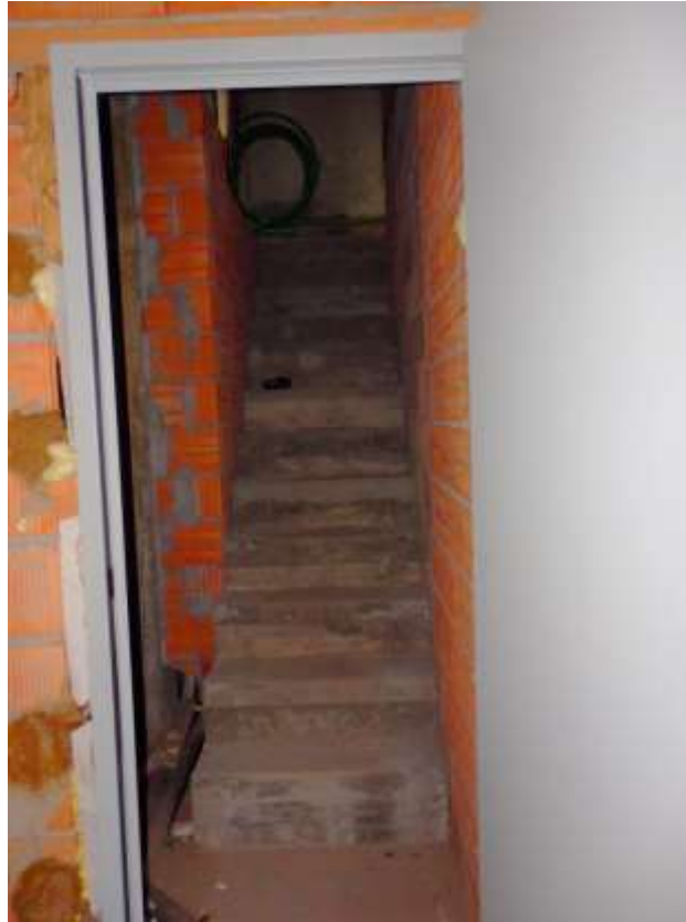
Appartamento al censito al C.F. fg.37 mapp.225 sub.4-12. Scala di collegamento dal piano terra al piano interrato.