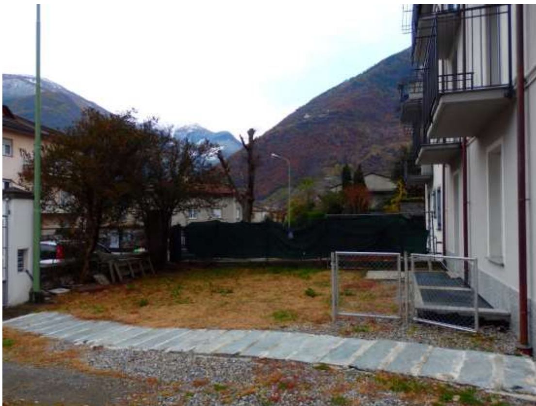
Area censita al C.T. fg.37 mapp.448, posta a sud/ovest dell'appartamento al piano terra censito al C.F. fg.37 mapp.225 sub.4-12