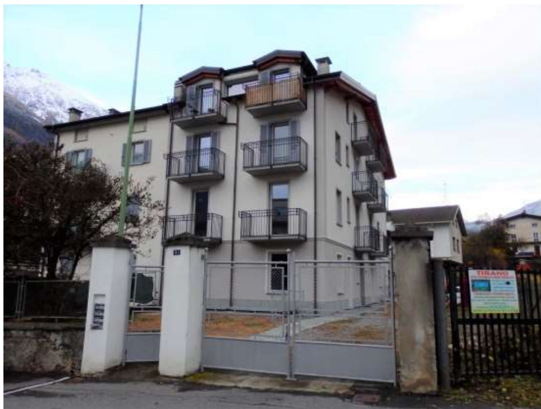
Particolare accesso dalla Via Stelvio

Fabbricato censito al C.F. Fg.37 mapp.225 – Facciate esposte a sud/ovest.