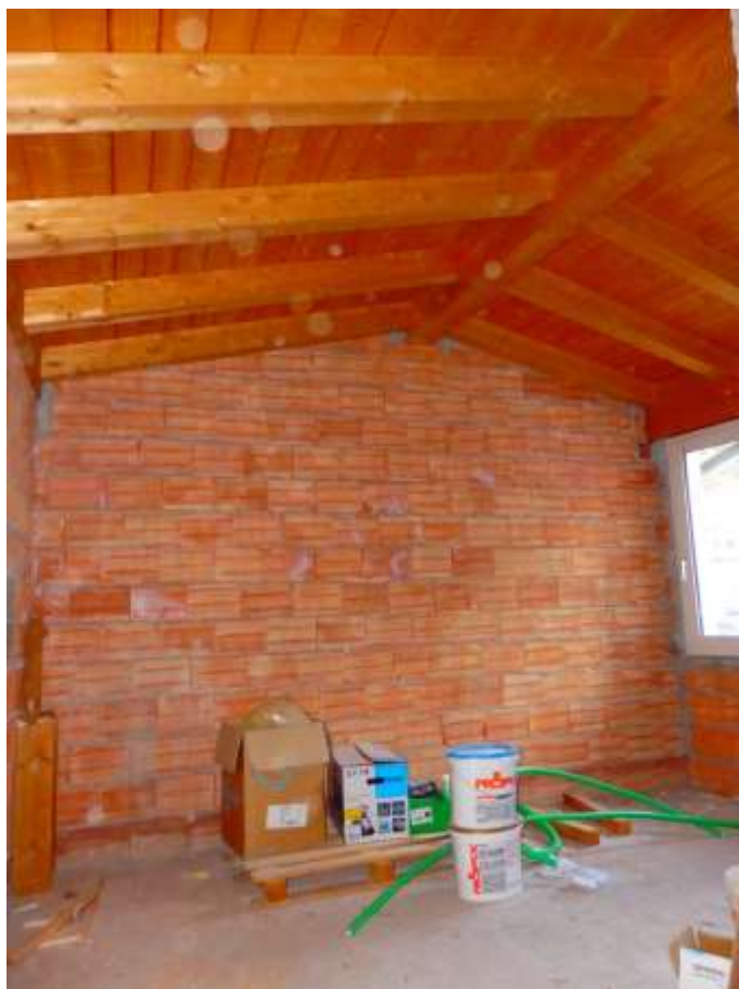
Appartamento censito al C.F. fg.37 mapp.225 sub.4-12, studio con bagno (da realizzarsi) ubicati al piano primo.