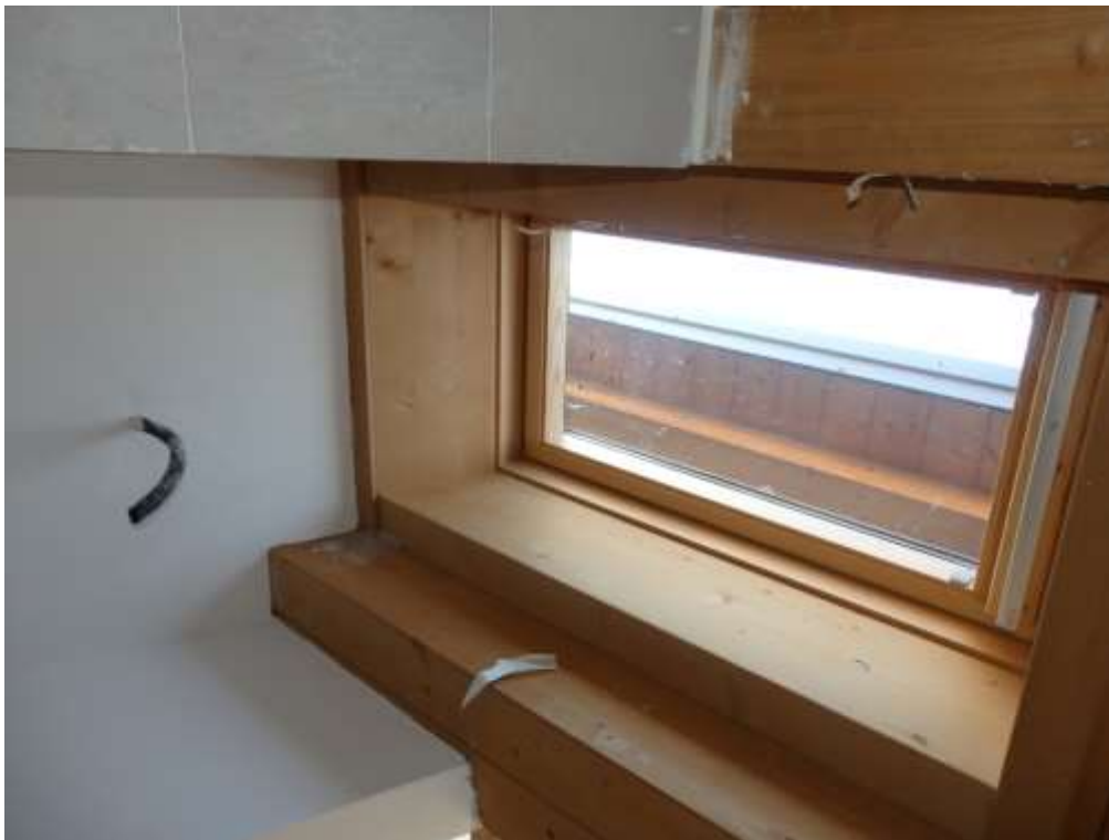
Appartamento al piano terzo censito al C.F. Foglio 37 mappale 225 subalterni 6-14 Finiture Bagno n.1 – Particolare lucernario.