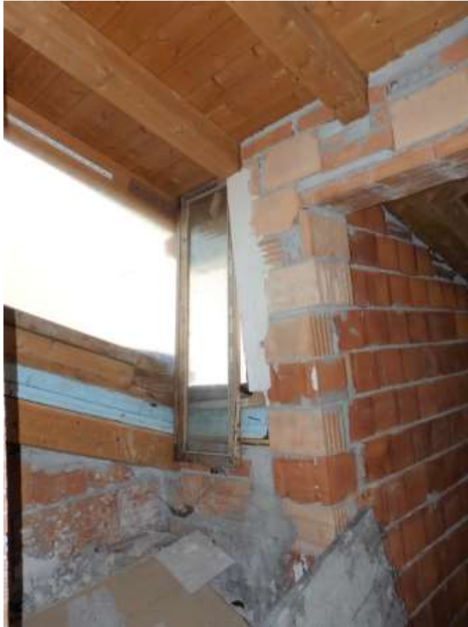
Serramenti non ultimati nel soggiorno