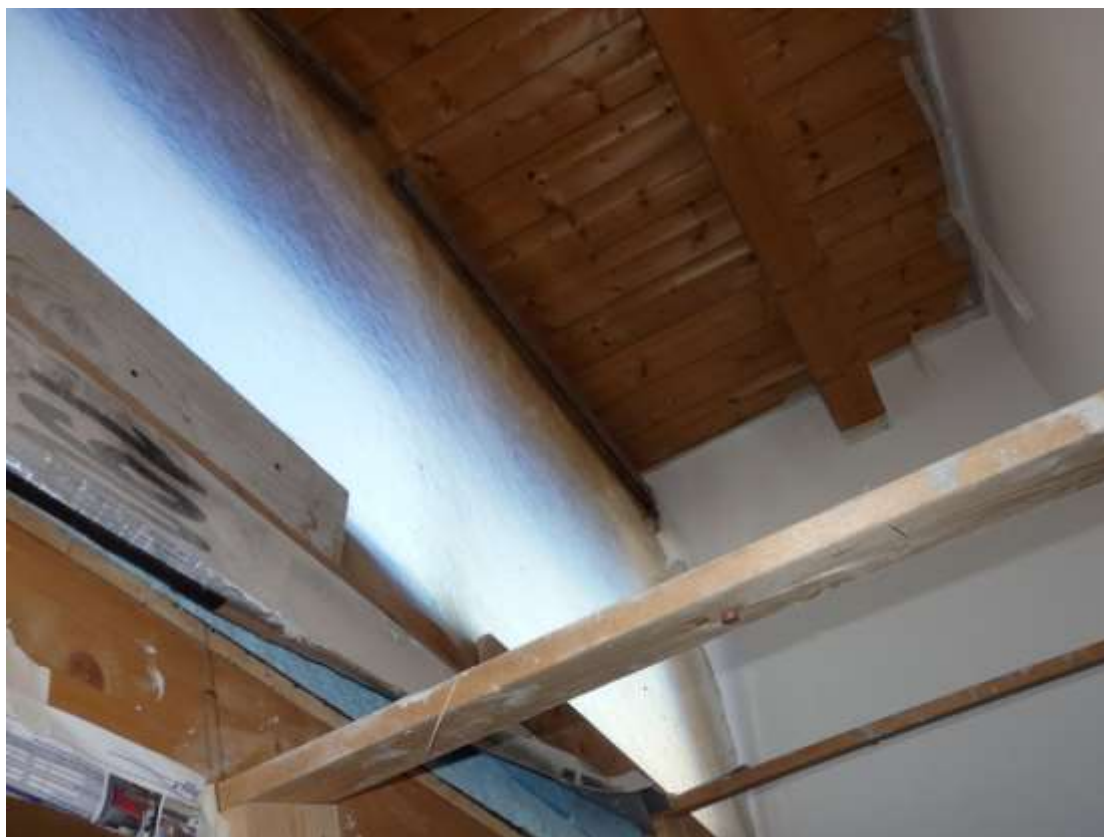
Particolare disimpegno bagni, plafone e serramenti non ultimati.