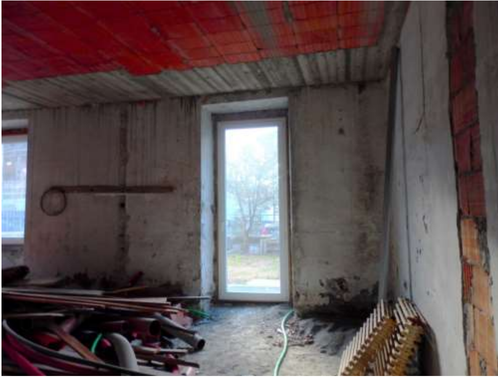
Appartamento al piano terra censito al C.F. fg.37 mapp.225 sub.4-12. Soggiorno con cucina e bagno.