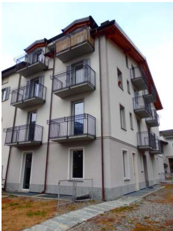
Comune di Tirano (SO) Via Stelvio n.31

Fabbricato censito al C.F. Fg.37 mapp.225 – Facciate esposte a sud/ovest.