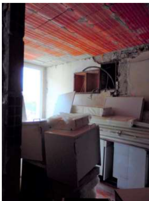
Camera n.1 al piano terra

Appartamento al piano terra censito al C.F. fg.37 mapp.225 sub.4-12, particolare porta di accesso nel soggiorno, comunicante con il vano scale comune attualmente murata.