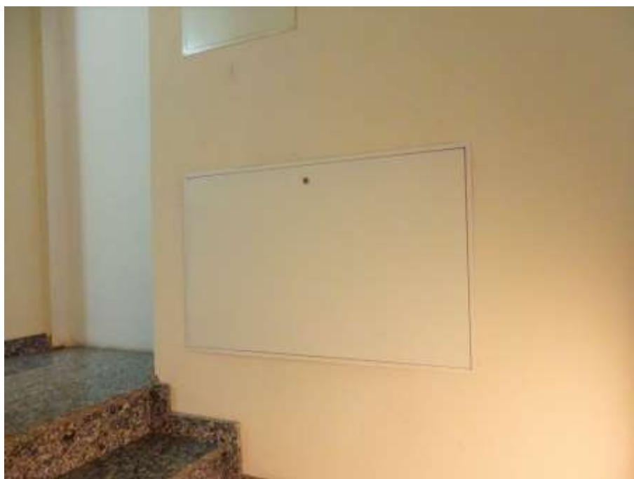
Collettore appartamento posto nel vano scale comune (sub.18)