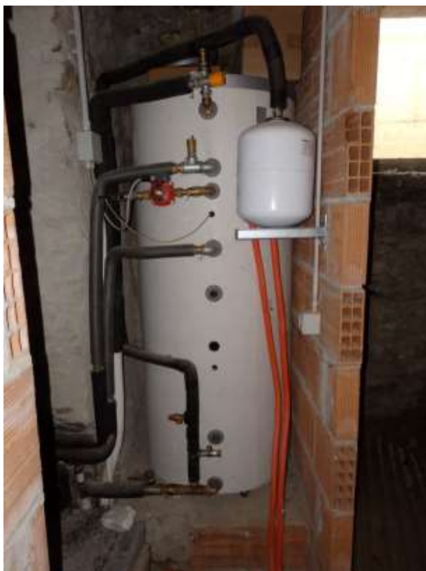
Bollitore ad uso comune installato nella proprietà al piano interrato censito al C.F. fg.37 mapp.225 sub.4-12