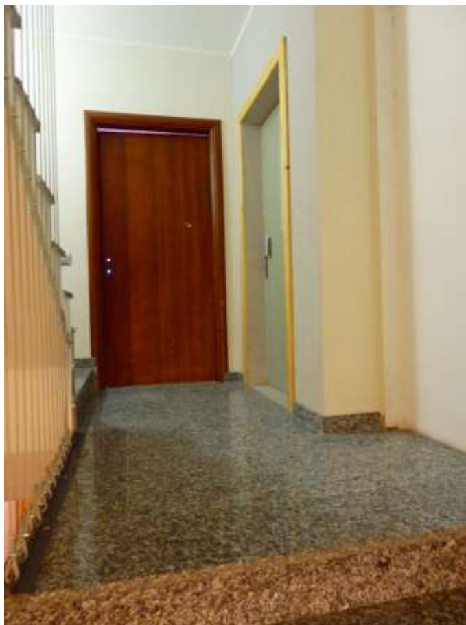
Particolari finiture vano scale comune (sub.18), e porta di accesso appartamento al piano primo censito al C.F. fg.37 mapp.225 sub.5-12