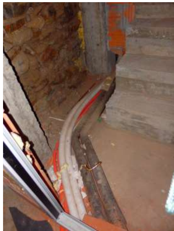
Piano interrato, disimpegno cantina Colonne impianto di riscaldamento e acqua calda.