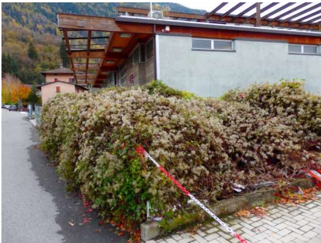
Comune di Tirano – Via Stelvio n.31 Area esterna posta in fregio alla Via Stelvio censita al C.T. Fg.35 mapp. 631-1085