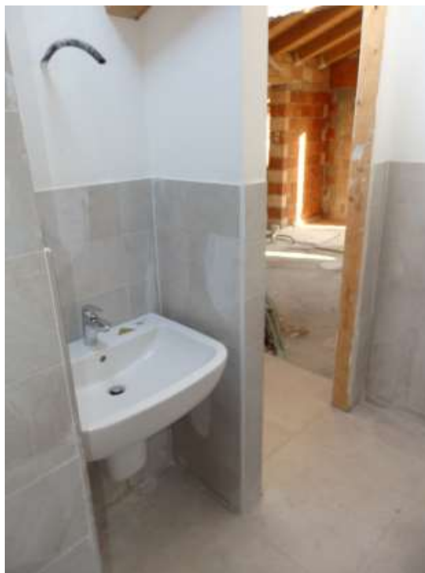
Appartamento al piano terzo censito al C.F. Foglio 37 mappale 225 subalterni 6-14 Finiture Bagno n.1