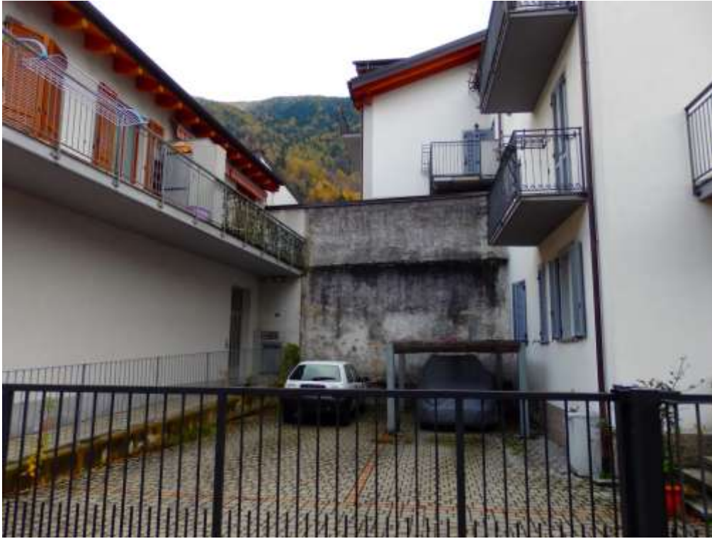
Comune di Tirano (SO) Via Stelvio n.31. Vista da ovest.