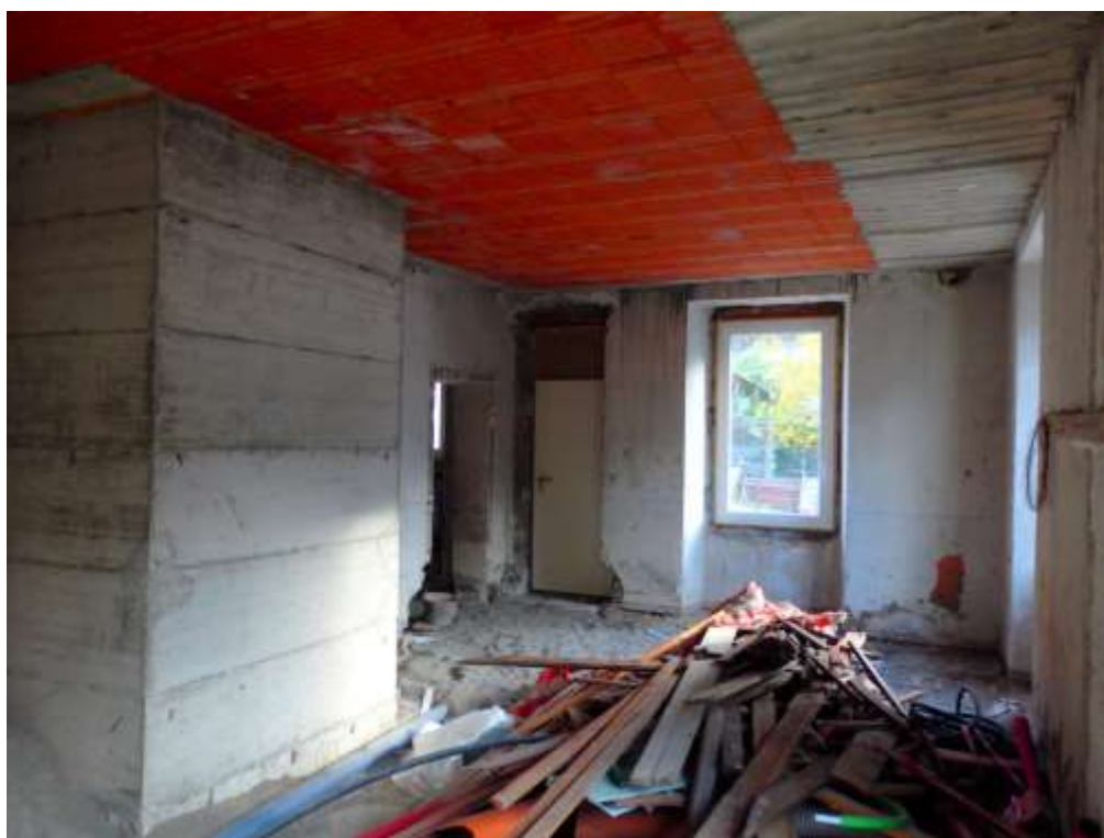
Soggiorno con cucina e bagno.