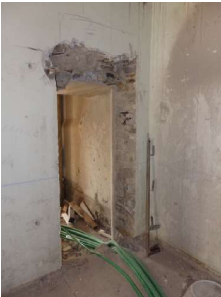
Appartamento al piano terra censito al C.F. fg.37 mapp.225 sub.4-12. Disimpegno di collegamento al soggiorno con cucina.