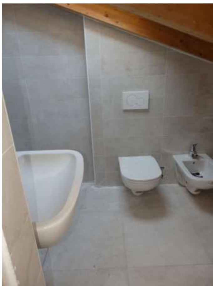
Tribunale di Sondrio – Causa Civile n. 132/2017 R.G.