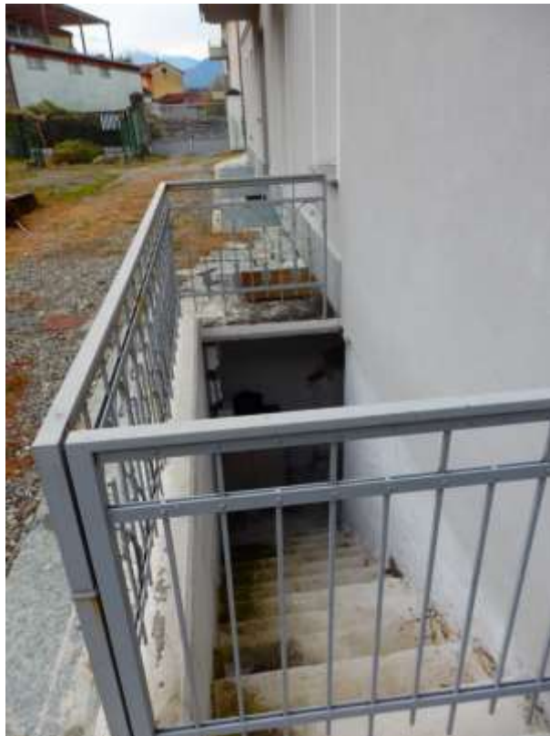
Particolare accesso al sub.18, vano comune al piano interrato ove è stato installato l'impianto del teleriscaldamento.