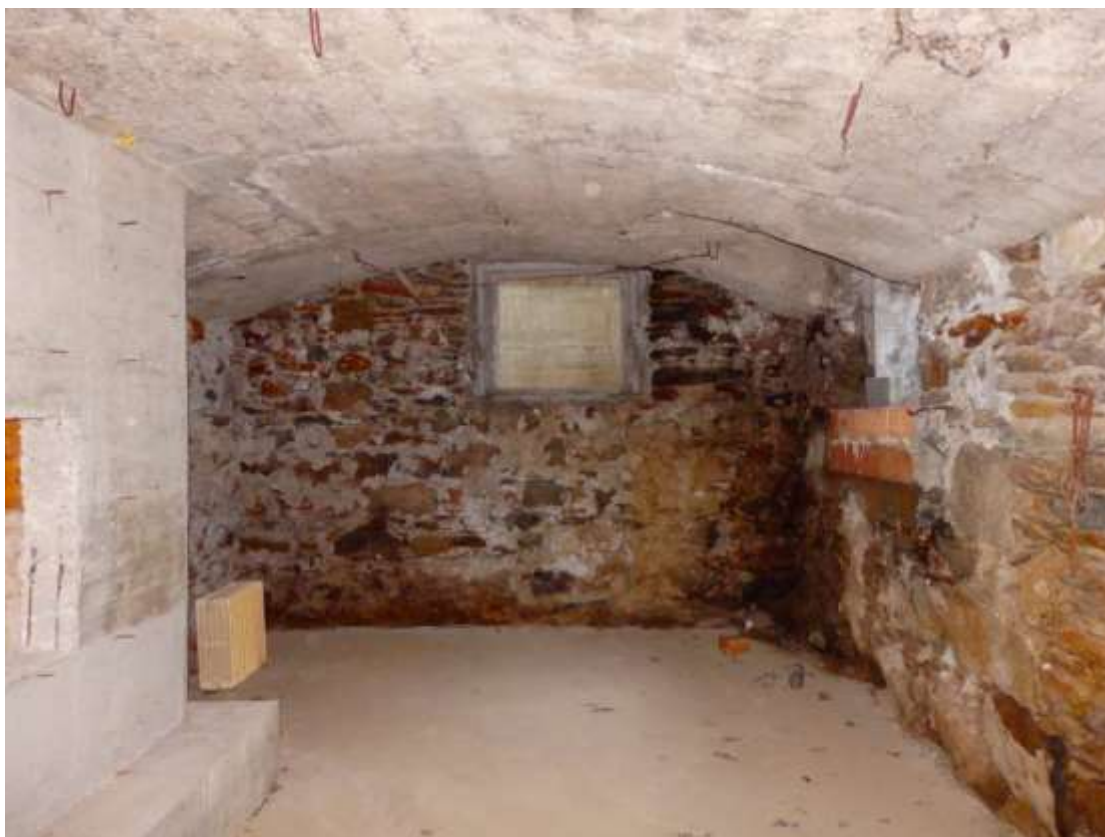
Cantina al piano interrato di pertinenza all'appartamento censito al C.F. fg.37 mapp.225 sub.4-12.