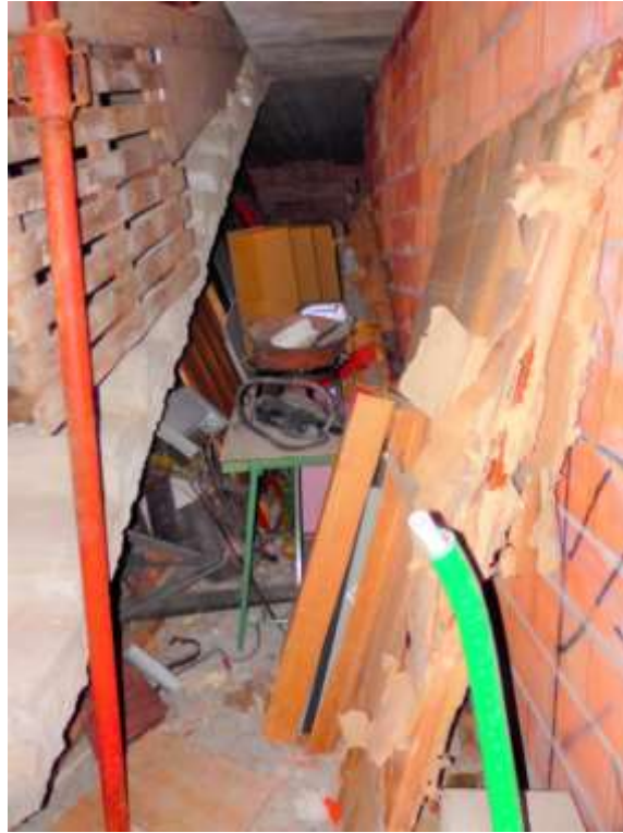
Appartamento censito al C.F. fg.37 mapp.225 sub.4-12, corridoio di accesso alla camera n.2 e alla scala di accesso allo studio con bagno al piano primo.