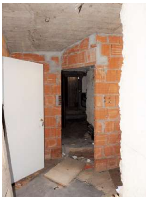
Disimpegno collegato al vano comune censito al sub.18.