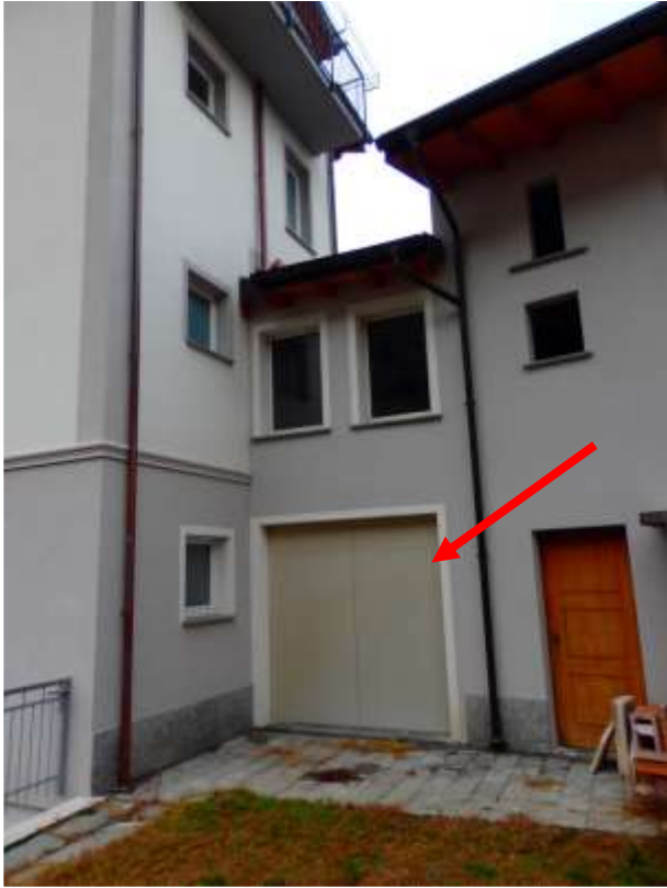
Particolare camera appartamento al piano terra, priva di serramento, censito al C.F. fg.37 mapp.225 sub.4-12