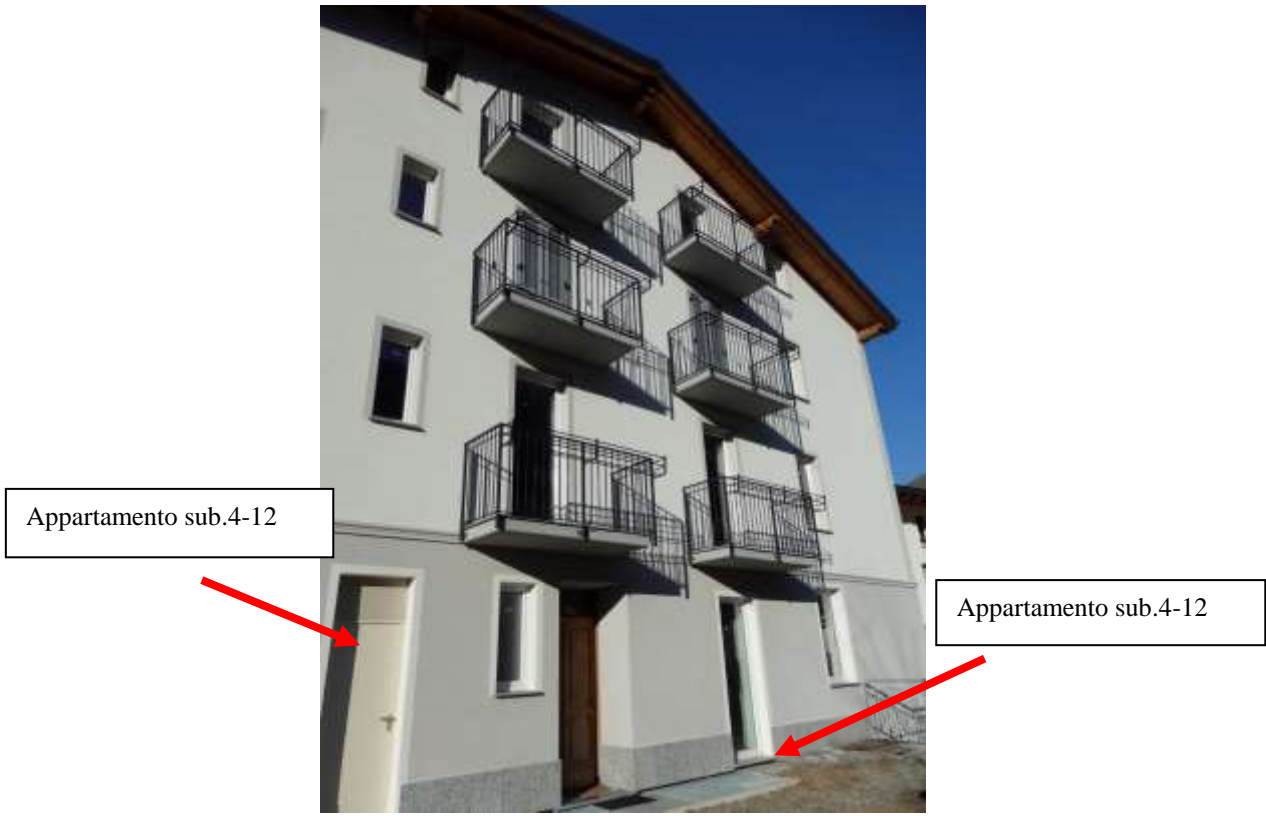
Facciata esposta a sud. Portone di legno di accesso al vano scale comune, e porte accessi appartamento al piano terra censito al C.F. fg.37 mapp.225 sub.4-12