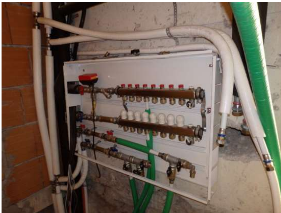
Appartamento al piano terra censito al C.F. fg.37 mapp.225 sub.4-12. Collettore impianto di riscaldamento e acqua calda, installato nel disimpegno