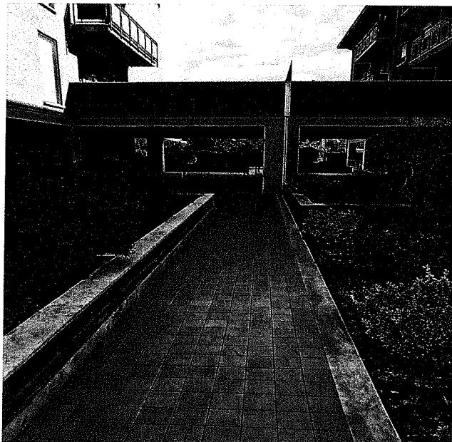
Foto n° 51 - ingresso al terreno (da proprietà condominio via Pio X, 38)