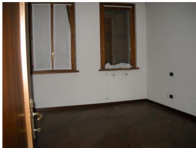
Scorcio di una delle camere (I piano)