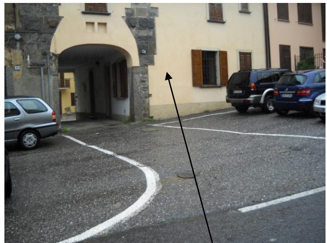
Fronte visto da via S. Protaso