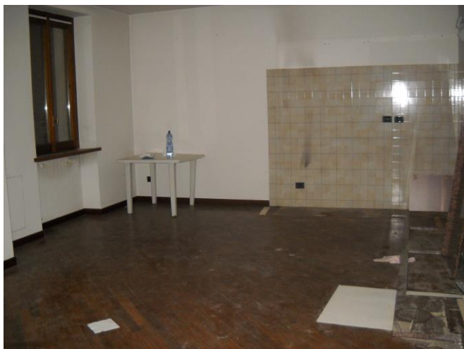
Scorcio del soggiorno con angolo di cottura rivestito di piastrelle (I piano)