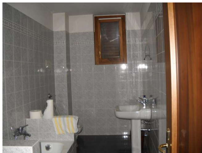
Scorcio del bagno 2 (I piano)