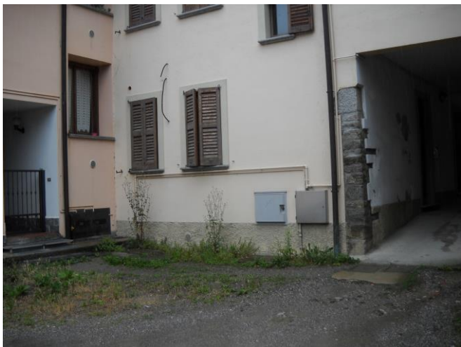
Scorcio del fronte verso il cortile