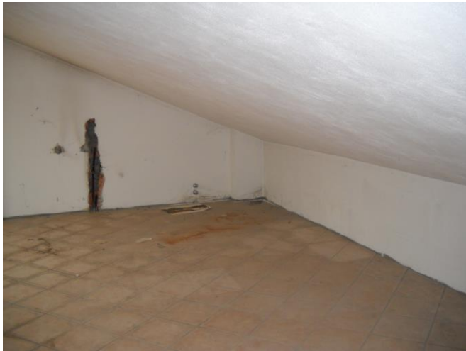
Altro scorcio del sottotetto (II piano)