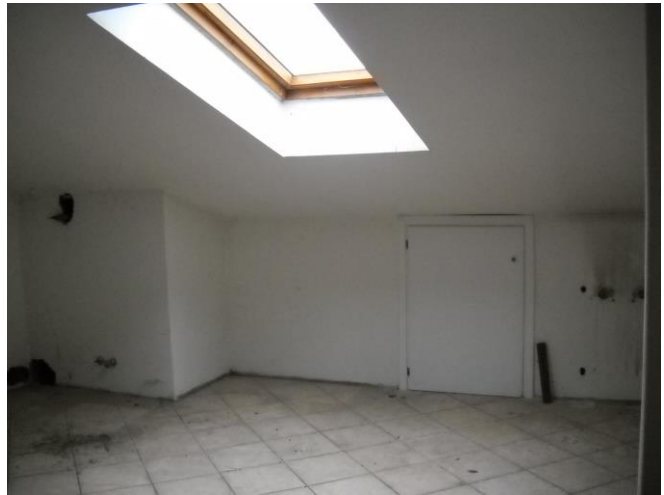
Ulteriore scorcio del sottotetto non abitabile (II piano) con serramento VELUX