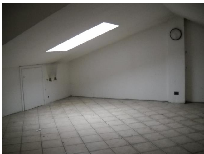
Scorcio del monolocale sottotetto non abitabile (II piano). L'illuminazione è con serramento VELUX