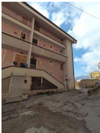
Figura 2: Vista fabbricato da via Salita Sant'Antonino

A seguito del sopralluogo effettuato in data 29/03/2019, lo scrivente ha avuto modo di appurare che il fabbricato di cui l'immobile è parte, è costituito da 4 livelli fuori terra (incluso il piano terra) ed uno entro terra, e presenta una struttura in cemento armato (All. 7, Foto 1 e 2). L'accesso all'immobile costituente il Lotto "D5", si ha dal civico n. 11/B della via Salita Sant'Antonino. In corrispondenza di detto civico è presente una scala esterna (All. 7, Foto 3) che immette ad una piccola corte coperta, dove è presente la scala di accesso al ballatoio esterno di piano secondo, in cui è presente una porta (All. 7, Foto 4), che immette alla scala di accesso dell'immobile (All. 7, Foto 5). Con riferimento all'allegata planimetria dallo scrivente rilevata (l'immobile non risulta accatastato al Catasto Fabbricati, per cui non si è potuta reperire la planimetria catastale), a scala 1:100 (All. 3), l'immobile attualmente disposto a piano terzo, adibito a civile abitazione, avente un'altezza in ciascun vano variabile essendo un sottotetto, risulta oggi composto, da un locale di ingresso costituito da una cucina-soggiorno (All. 7, Foto 6 e 10) con balcone (All. 7, Foto 8) da cui si accede al bagno (All. 7, Foto 12) e alla camera da letto (All. 7, Foto 11).