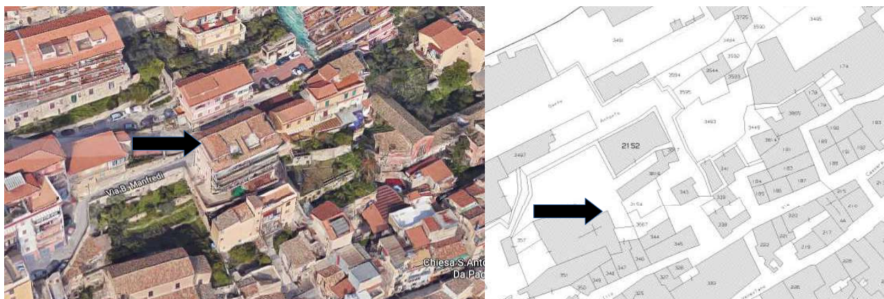
Comparazione tra stralcio maps, e stralcio di mappa catastale con indicazione del fabbricato di salita S. Antonino

Si rappresenta che i dati catastali del terreno su cui è stato edificato il fabbricato, riportati negli atti di pignoramento, sono conformi a quelli registrati presso l'ufficio del Catasto di Palermo, come da visura catastale storica allegata (All. 2a), ad eccezione di quanto riportato nell'atto di pignoramento della procedura 84/2001, in cui il terreno viene erroneamente riportato alla particella 2151, invece della 2152. Altresì, in riferimento alle difformità sostanziali si evidenzia che dai riscontri effettuati presso l'ufficio del catasto, si è appurato che l'attuale fabbricato, ed anche i singoli immobili che lo costituiscono, realizzati sulla particella 2152 non risultano accatastrati al Catasto fabbricati (per maggiori informazioni si rimanda alla risposta al successivo quesito n. 3).