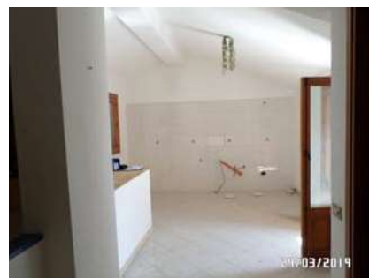
Figura 5: Vista zona cucina

All'interno del bagno, che risulta corredato di vaso, lavabo, bidet e doccia, è presente lo scaldabagno elettrico (All. 7, Foto 12). L'impianto idrico è sottotraccia, così come quello elettrico.