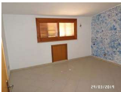
Figura 4: Vista camera da letto