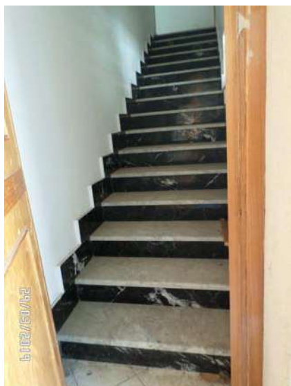
Figura 3: Vista scala ingresso immobile

Le finiture interne non sono di pregio e il loro stato risulta discreto: tutti gli ambienti, ad eccezione del bagno, sono pavimentati con mattoni in gres porcellanato, con pareti intonacate e tinteggiate. Le pareti del bagno, sono per buona parte rivestite di mattonelle, mentre la copertura e la parte rimanente delle pareti risulta intonacata e tinteggiata. Gli infissi interni sono in legno tamburato, mentre gli infissi esterni sono di buona fattura e realizzati in legno con vetri a taglio termico (All. 7, Foto 13 e 14) e persiane esterne.