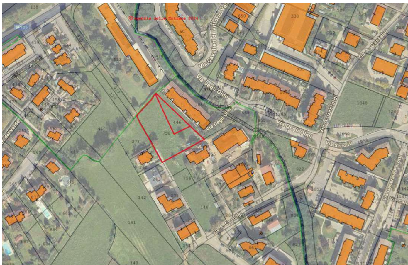
Estratto Satellitare di zona con sovrapposizione catastale