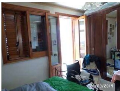
Figura 4: Vista camera da letto