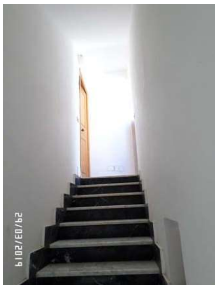
Figura 3: Vista scala ingresso immobile

Le finiture interne non sono di pregio e il loro stato risulta discreto: tutti gli ambienti, ad eccezione del bagno, sono pavimentati con mattoni in gres porcellanato (All. 7, Foto 17), con pareti intonacate e tinteggiate. Le pareti del bagno, sono per buona parte rivestite di mattonelle, mentre la copertura e la parte rimanente delle pareti risulta intonacata e tinteggiata. Gli infissi interni sono in legno tamburato (All. 7, Foto 16), mentre gli infissi esterni sono di buona fattura e realizzati in legno con vetri a taglio termico (All. 7, Foto 7) e persiane esterne (All. 7, Foto 15).