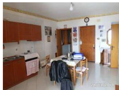
Figura 5: Vista soggiorno-cucina

All'interno del bagno, che risulta corredato di vaso, lavabo, bidet e doccia, è presente lo scaldabagno elettrico (All. 7, Foto 10). L'impianto idrico è sottotraccia, così come quello elettrico.