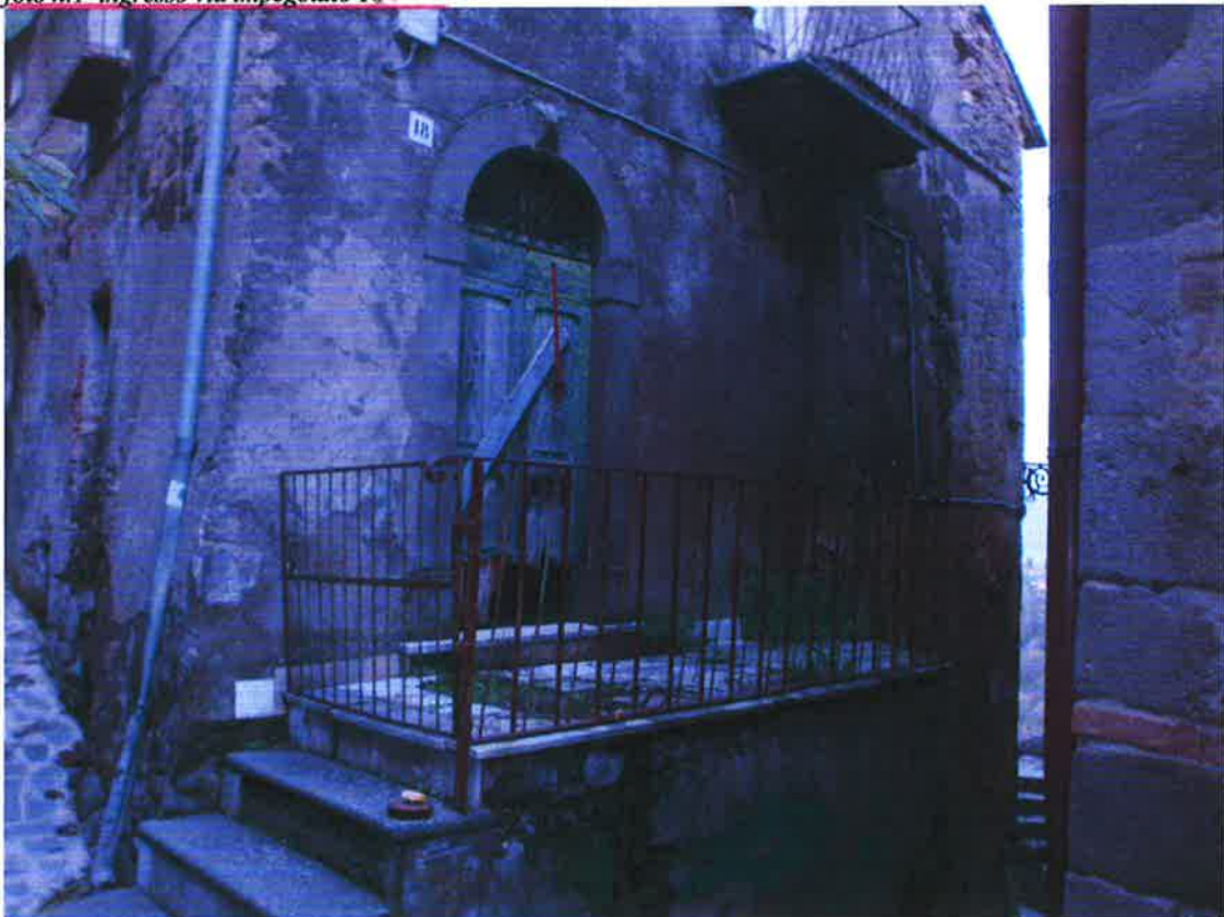
foto n.2 vista scala ingresso