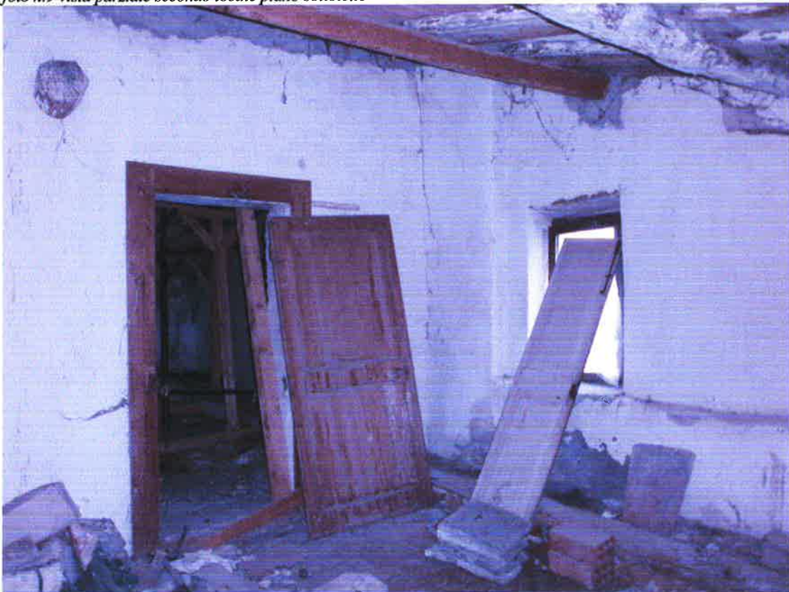
foto n.10 vista parziale puntellatura terzo locale piano sottotetto