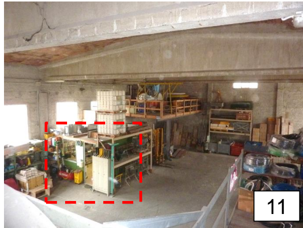
Box prefabbricato amovibile uso ufficio