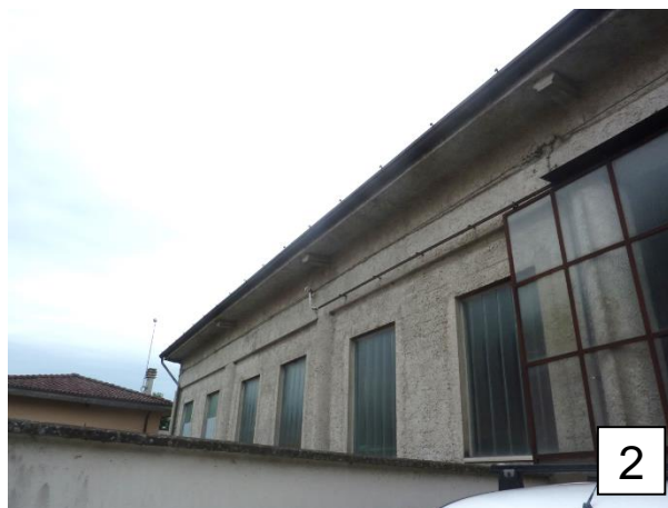
Particolare facciata sud