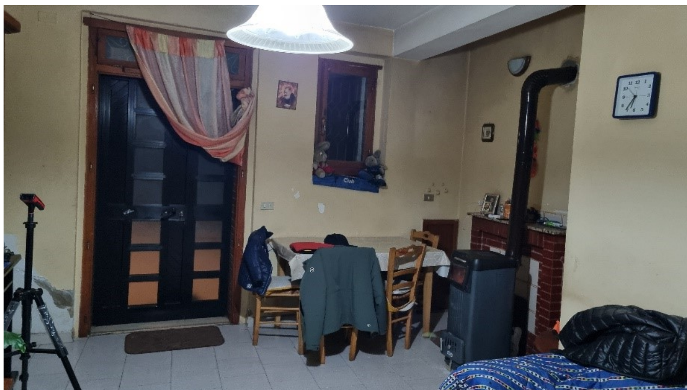
INGRESSO SOGGIORNO PRANZO