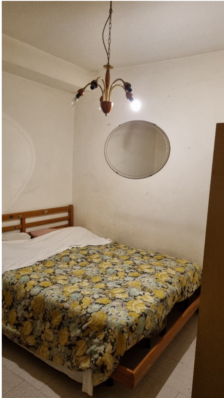
CAMERA DA LETTO 2