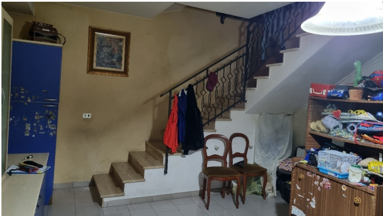
SCALA DI ACCESSO AL PRIMO PIANO