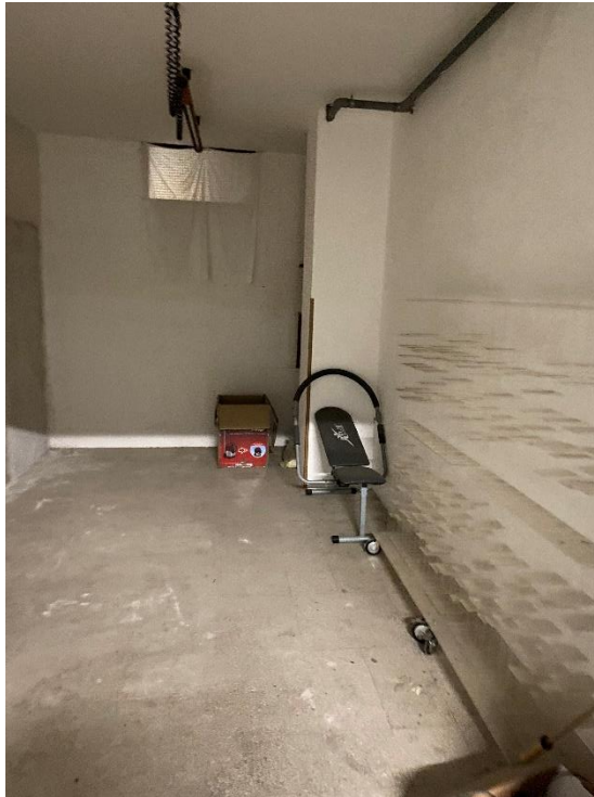
Figura 1: Box