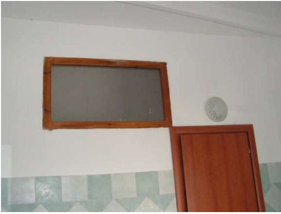
Foto 20 – Bagno (particolare finestra di illuminazione corridoio di servizio) – P.1