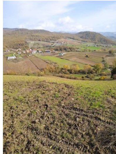
Particella n. 385