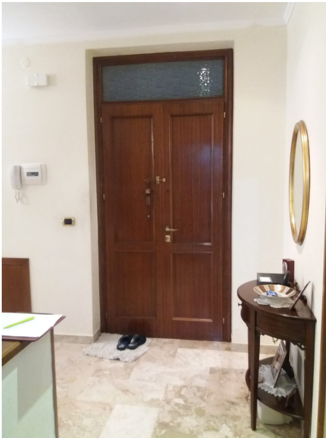
FOTO N. 1 PORTA D'INGRESSO