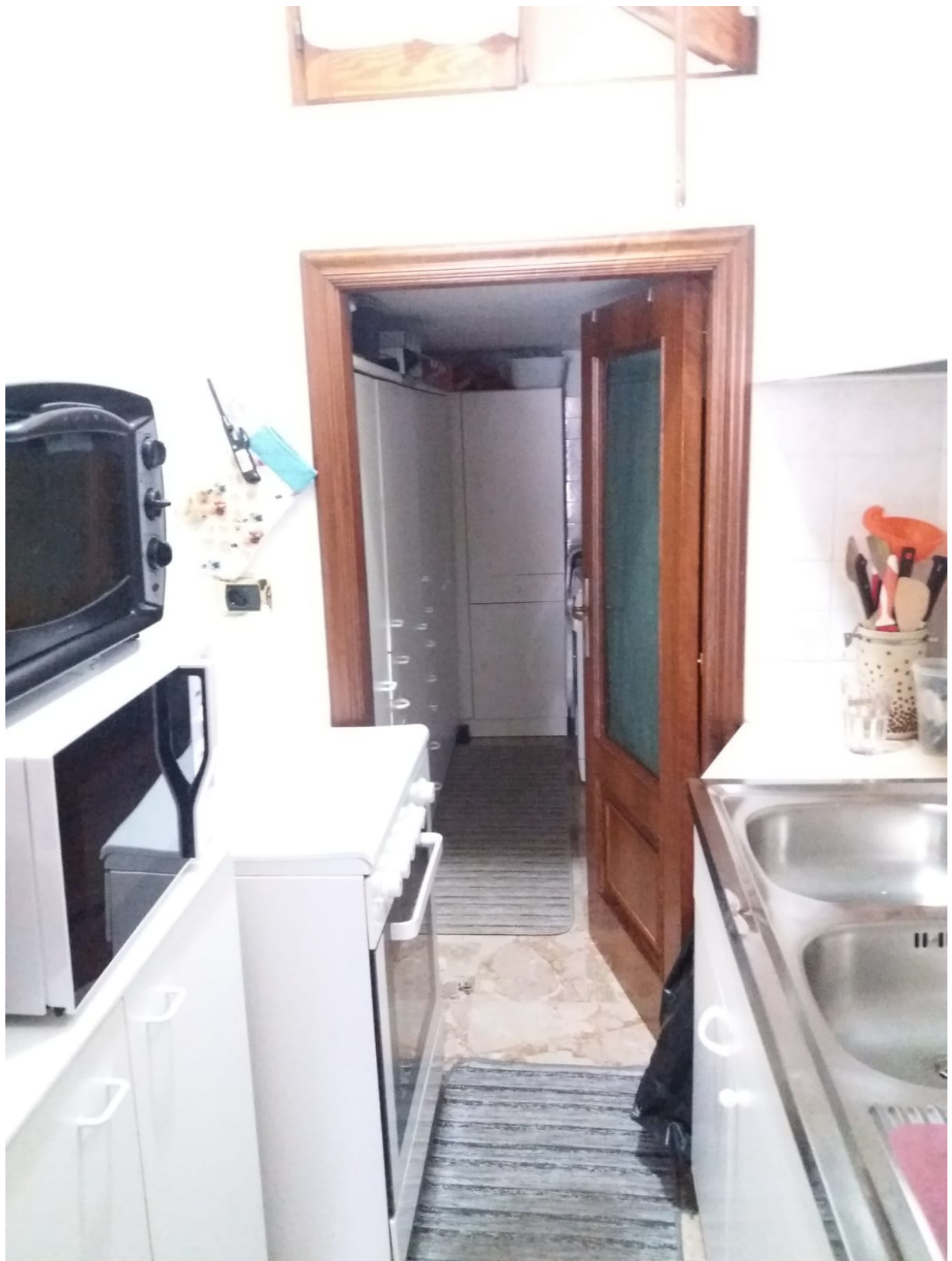
FOTO N. 3 LAVATOIO