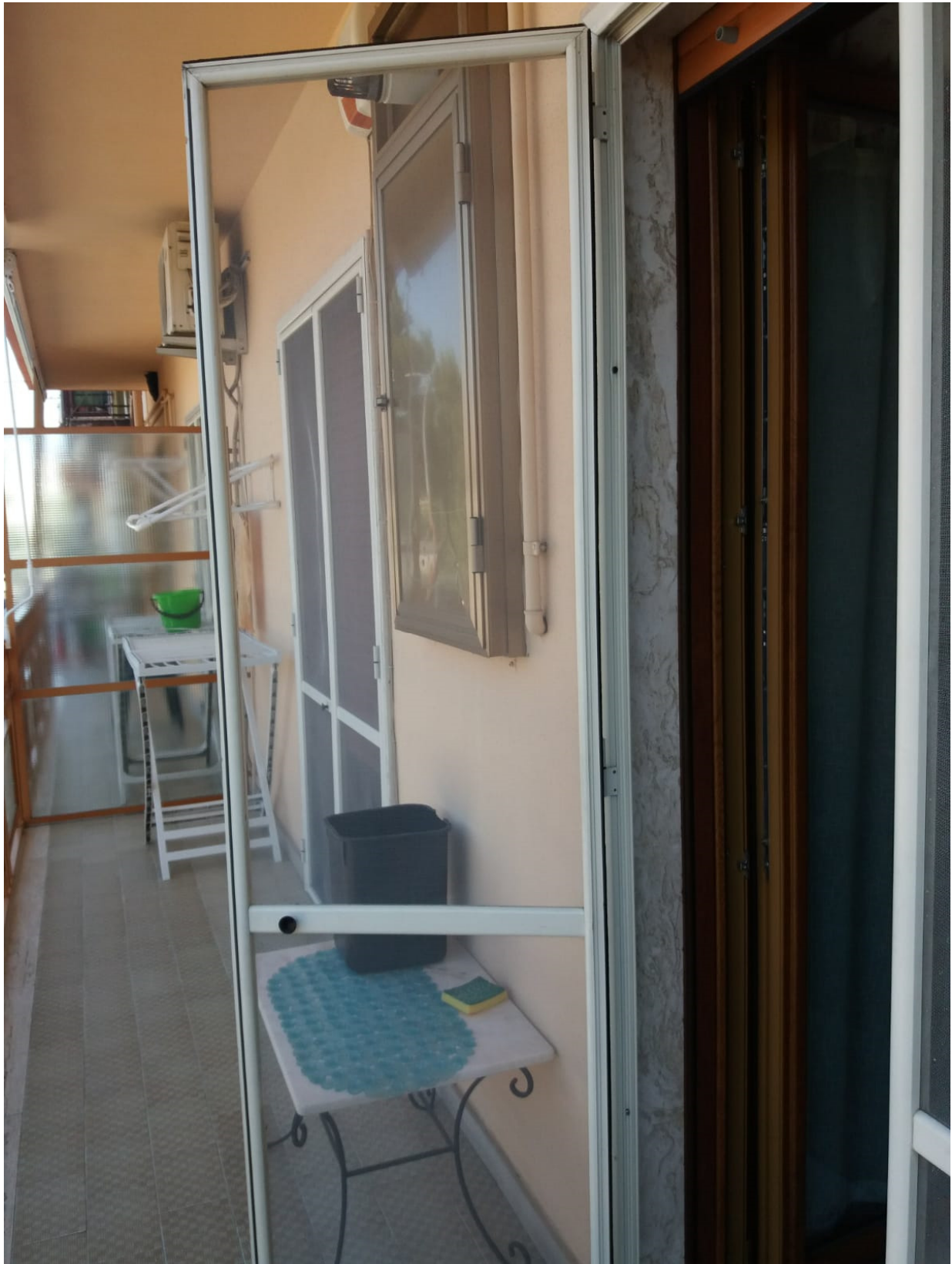
FOTO N. 9 BALCONE SU VIA LANZILLOTTI