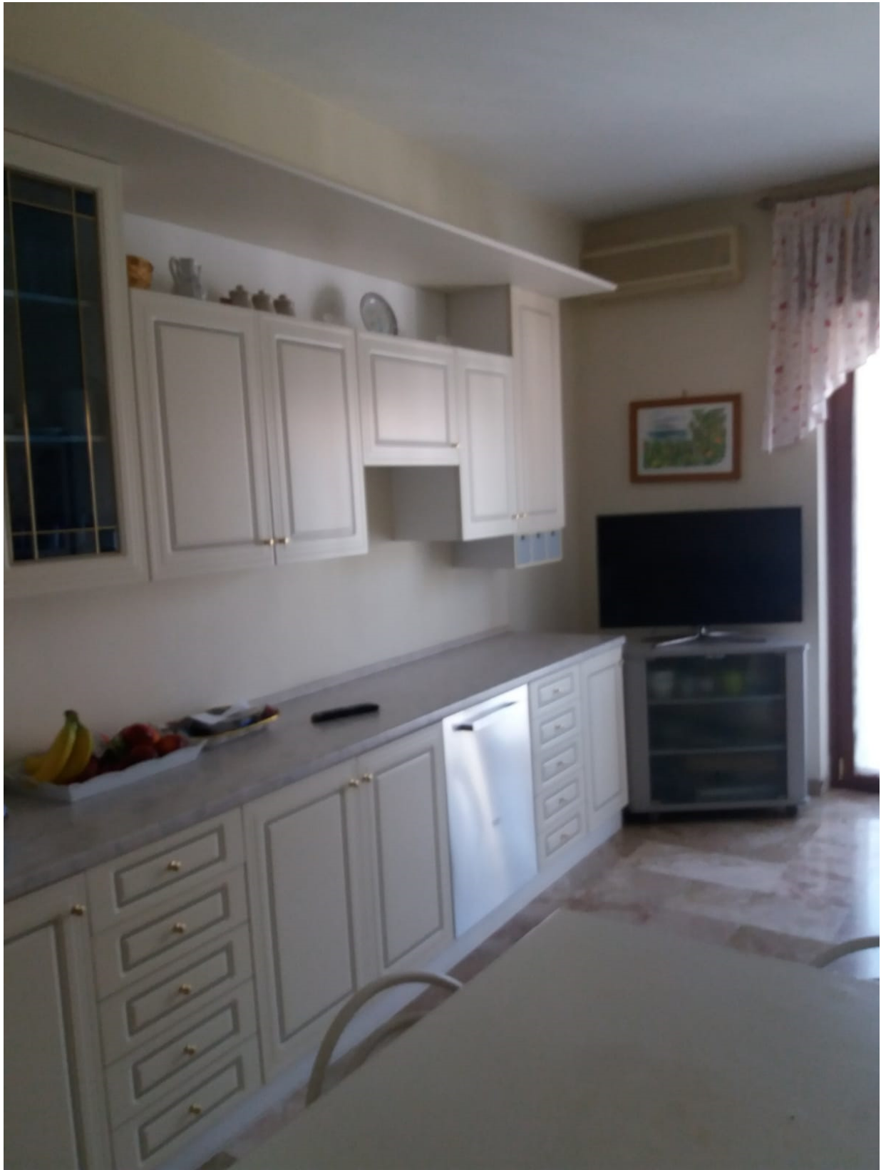
FOTO N. 6 SOGGIORNO