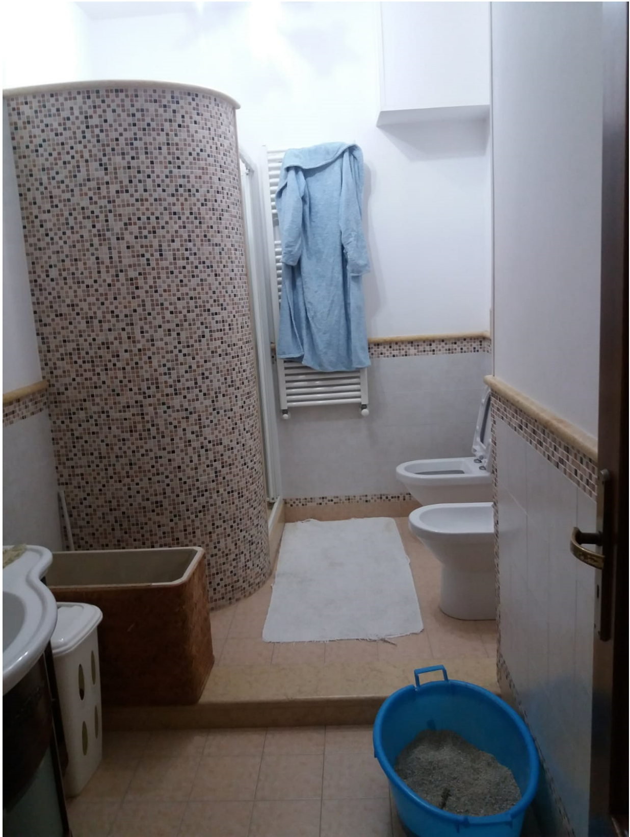
FOTO N. 8 BAGNO