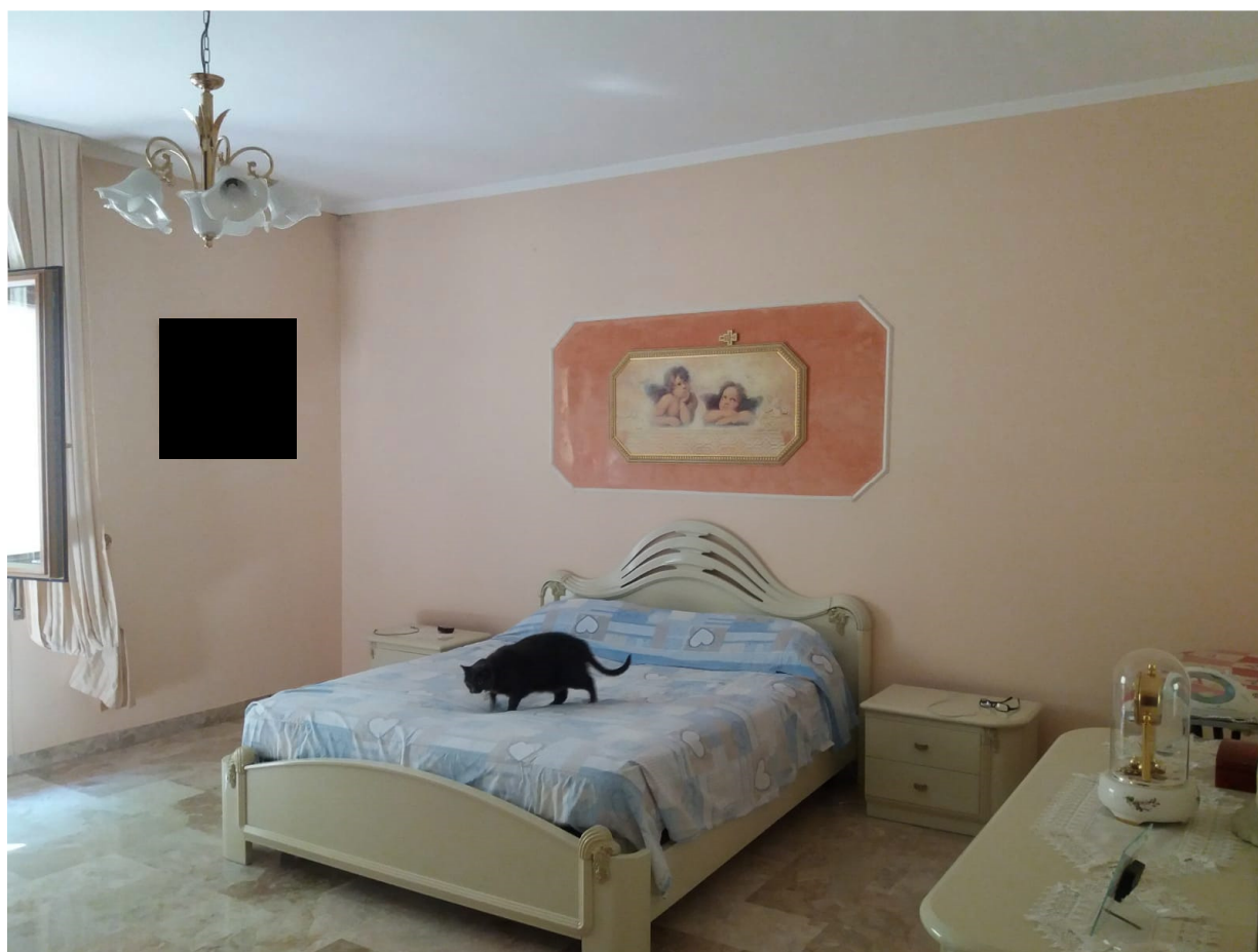
FOTO N. 4 CAMERA DA LETTO MATRIMONIALE