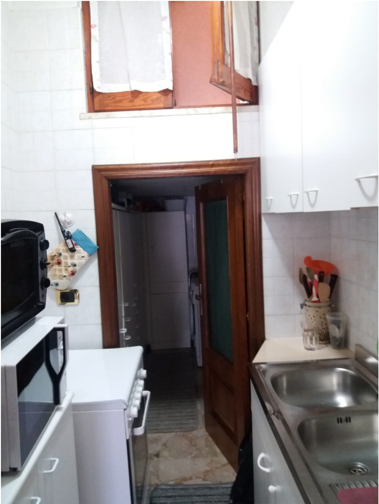
FOTO N. 7 CUCININO