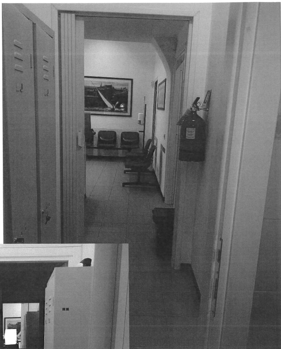
DISIMPEGNO TRA L'ACCETTAZIONE E GLI STUDI MEDICI