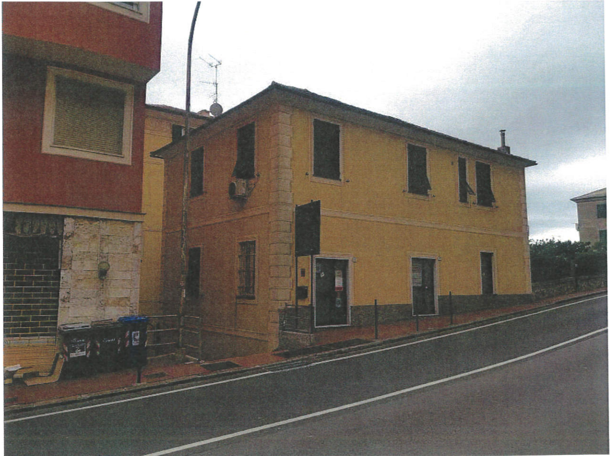
PROSPETTO SU VIA CAVOUR