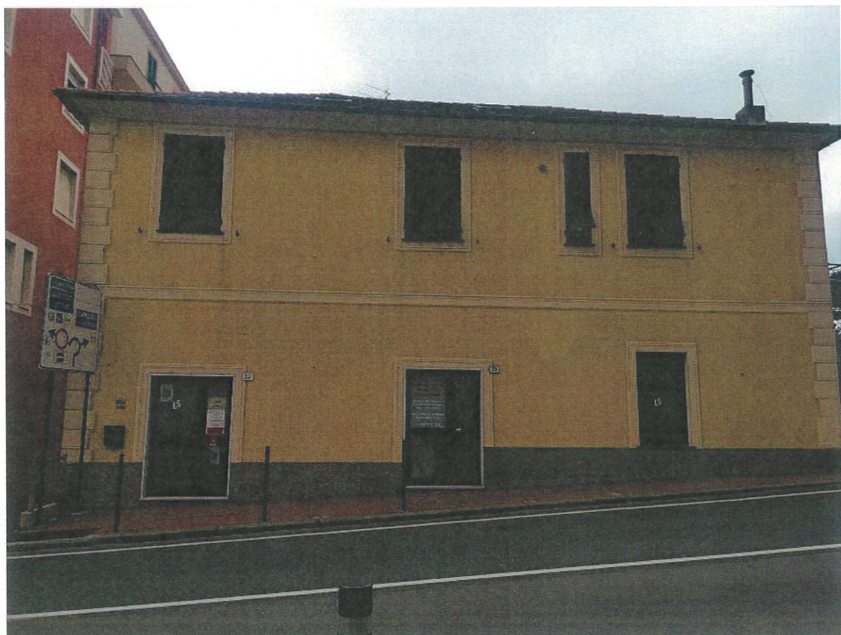
PROSPETTO SU VIA CAVOUR