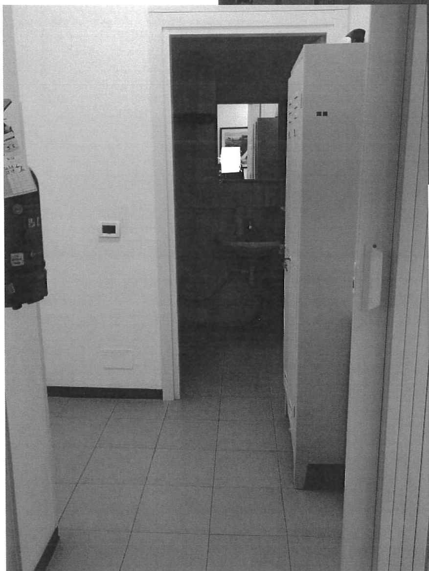
DISIMPEGNO DAVANTI AI LOCALI BAGNO