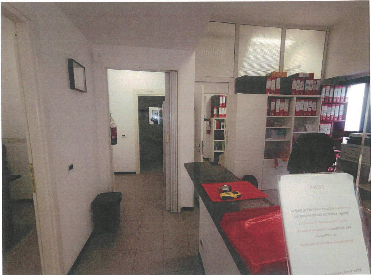
ACCETTAZIONE E VISTA VERSO DISIMPEGNO