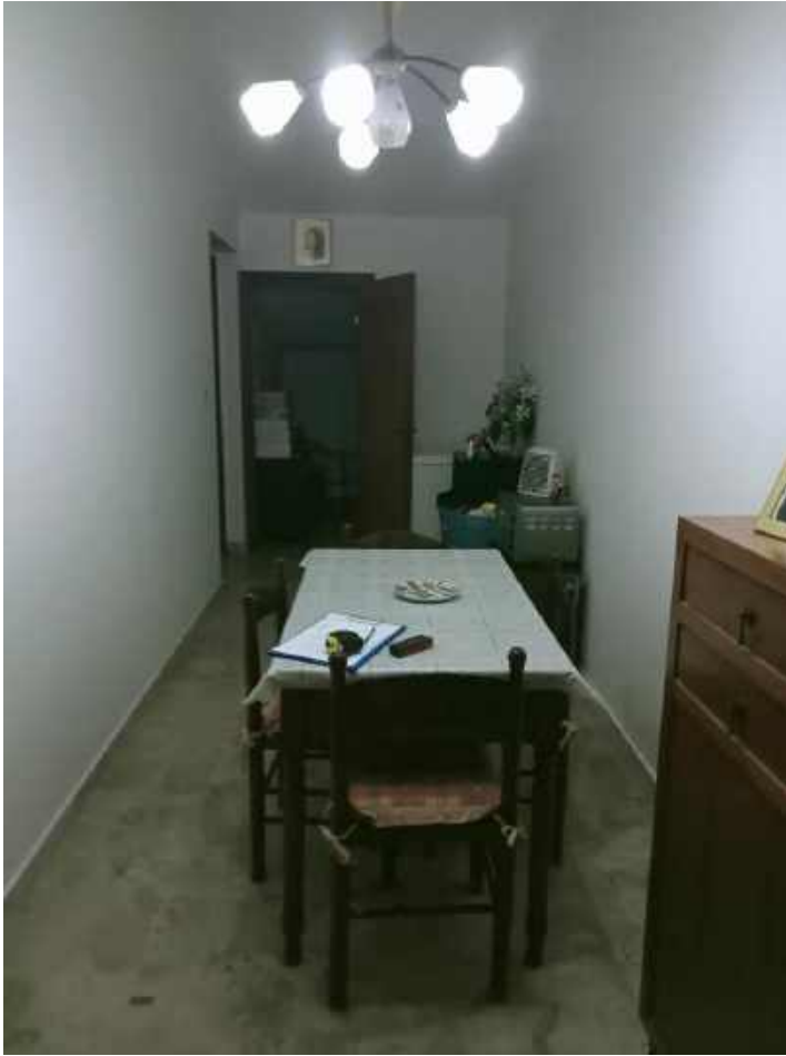
Foto 5 –corridoio cieco Sullo sfondo accesso al secondo ripostiglio