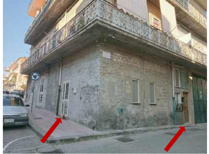
Foto 10 – esterno con accesso da via del Risorgimento n. 42 privato e da via Italia n. 42 comune