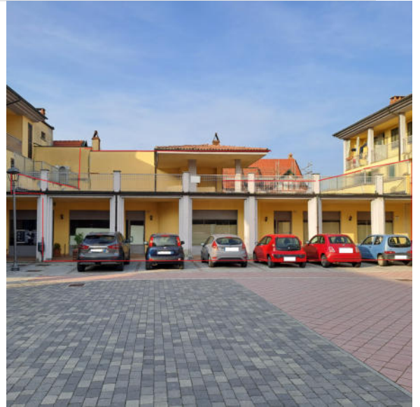
Foto 8 - Prospetto sud dalla Piazza Pertini.