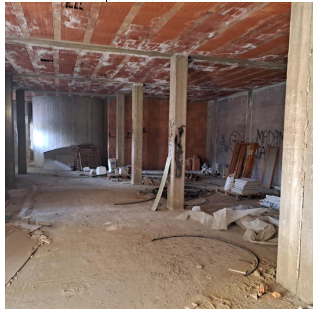
Foto 10 - Locale al piano terreno