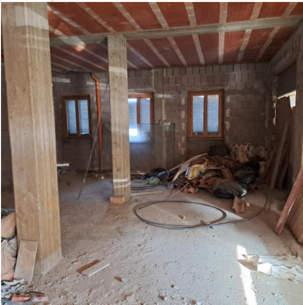
Foto 9 - Locale al piano terreno