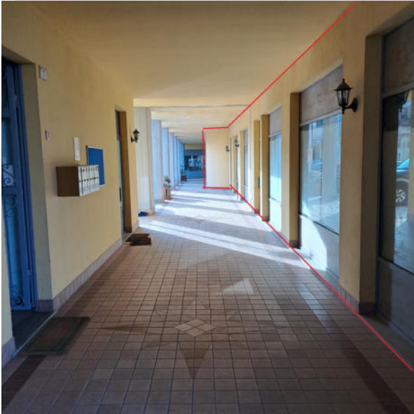
Foto 7 - Porticato condominiale

Esecuzione Immobiliare N° 0081/2022 R.G.E. promossa da Intesa SanPaolo S.p.A. nei confronti della Debitrice Immobile in Comune di Santa Giuletta (Pv) – Piazza Sandro Pertini n. 3-4-5. -Lotto ventidue-