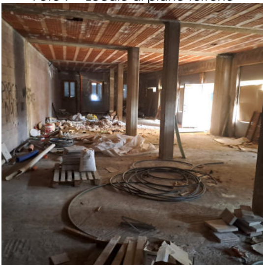
Foto 11 - Locale al piano terreno