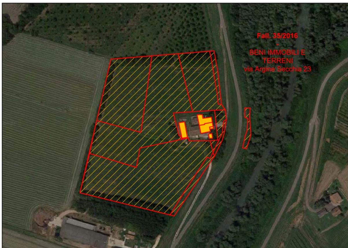
Sovrapposizione catasto/immagine aerea