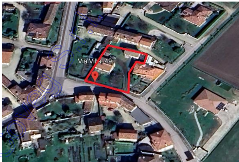
Immagine satellitare "google Earth"