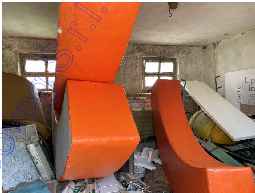
Vista interna del deposito-fienile