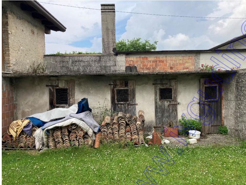
Vista esterna pollai