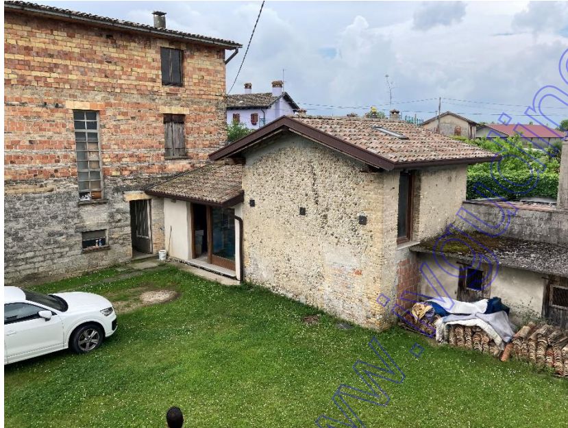
Vista esterna accessorio