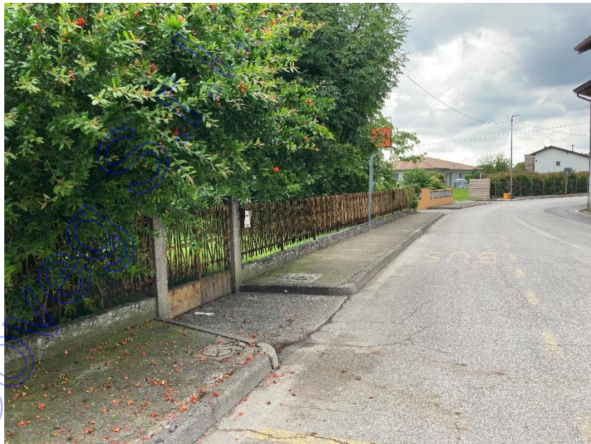
Vista esterna accesso pedonale da via Villa