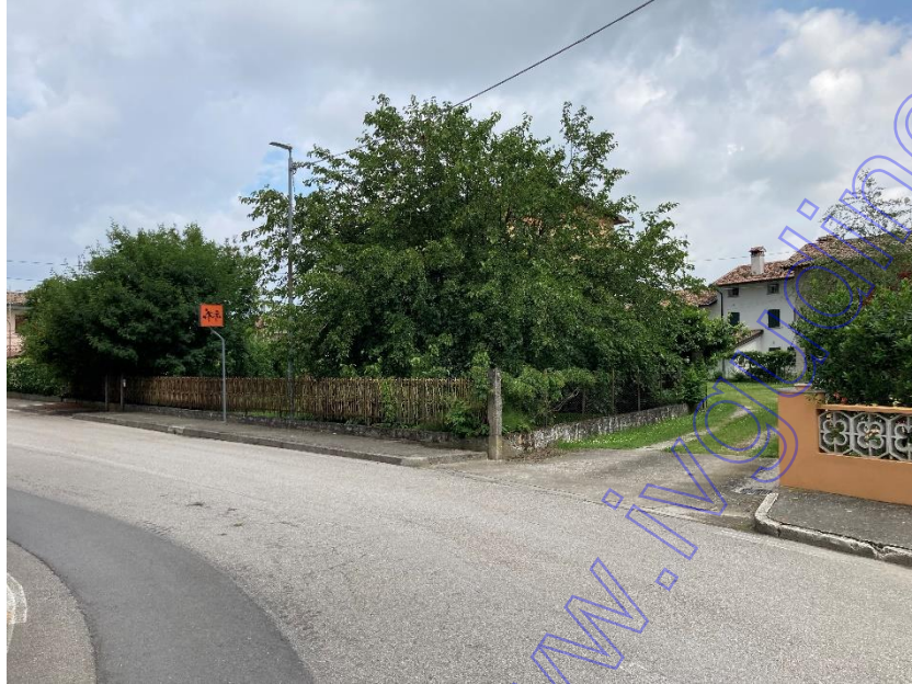
Vista esterna accesso carroia da via Villa