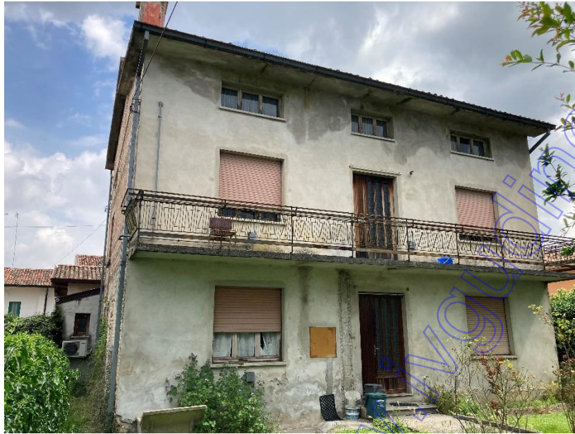
Vista esterna della casa