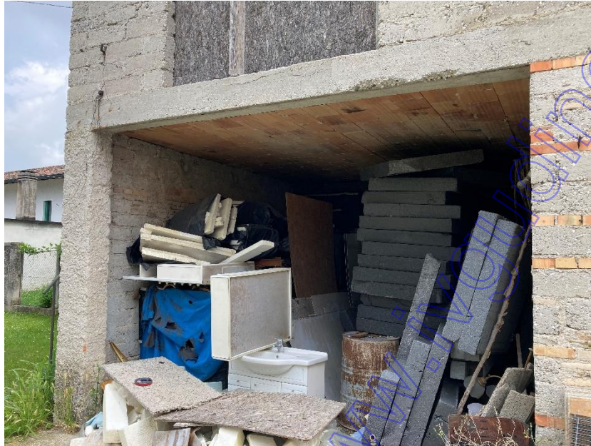
Vista interna del deposito-fienile