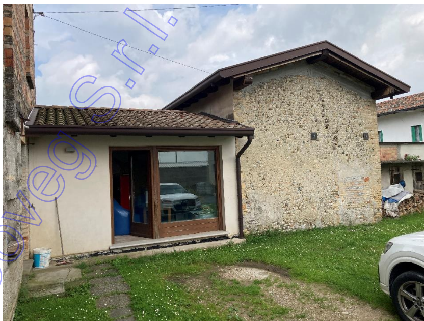
Vista esterna accessorio