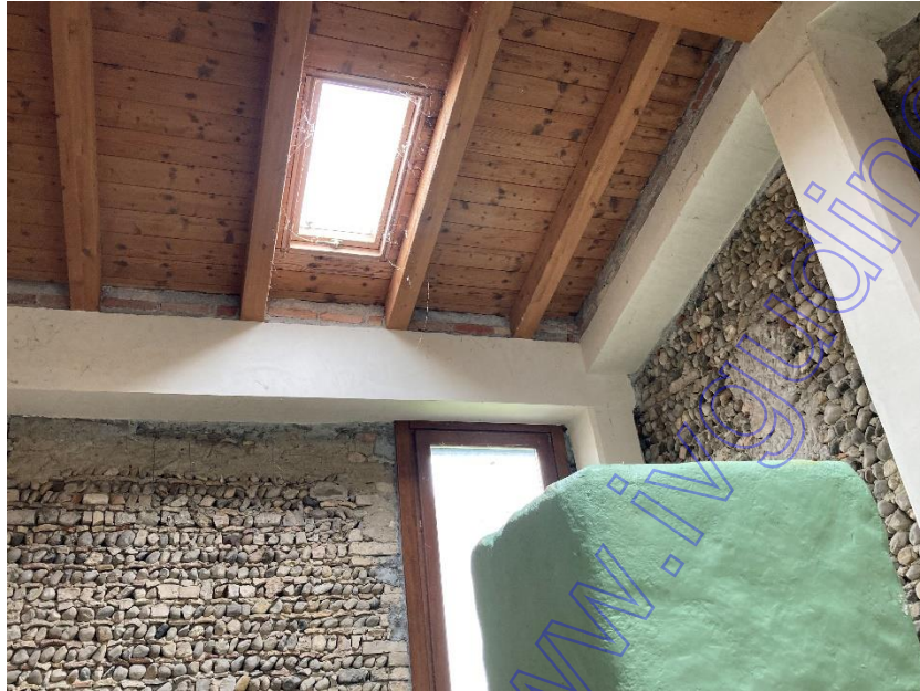
Vista interni accessorio