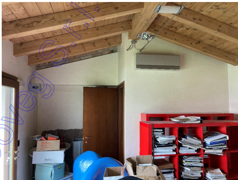
Vista interni accessorio