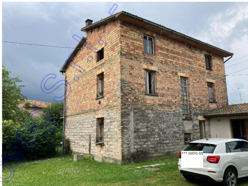
Vista esterna della casa