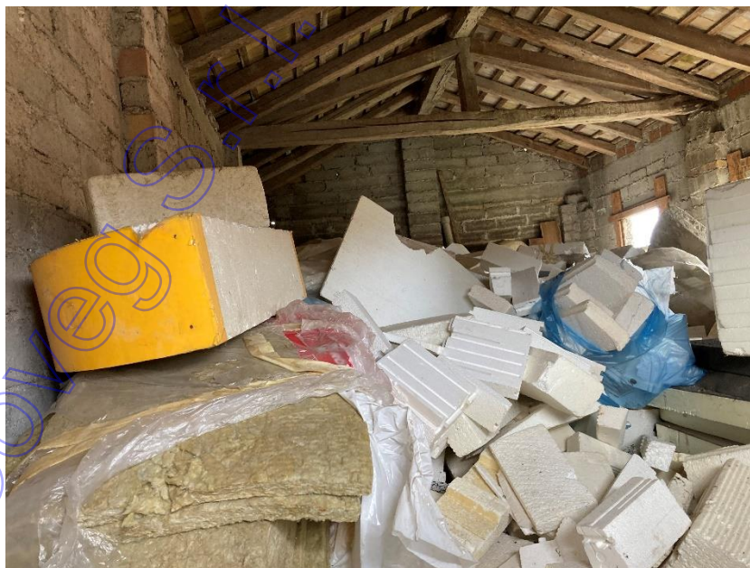
Vista interni del deposito-fienile