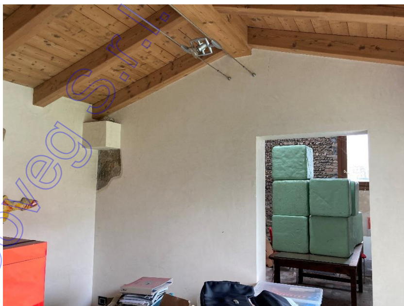
Vista interni accessorio