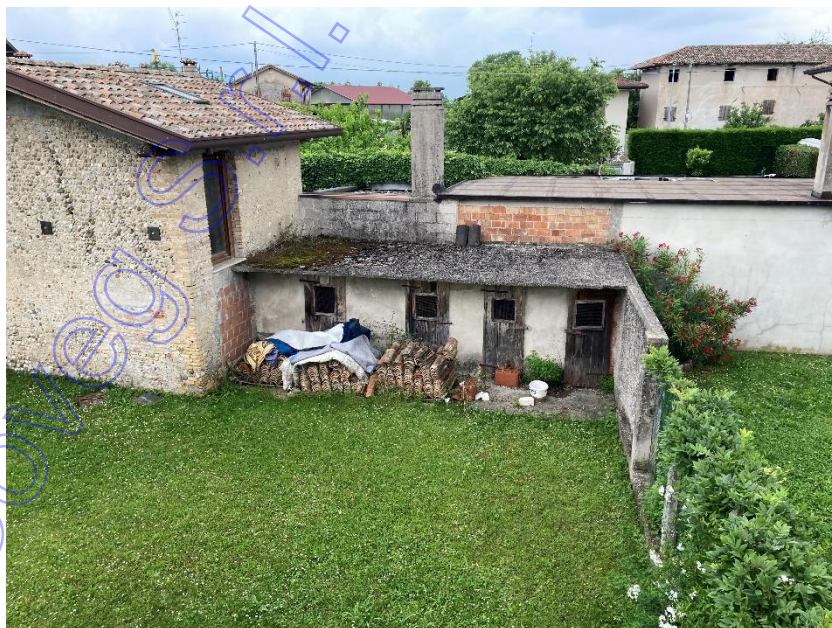
Vista esterna pollai